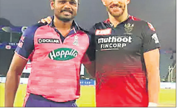
ସଞ୍ଜୁ ସାମସନ ଓ ଫାପ ଟୁପ୍ଲେସି।