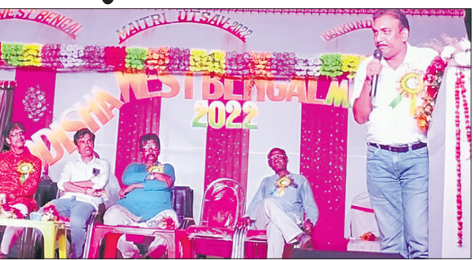
ମୈତ୍ରୀ ଉତ୍ସବର ବୃତ୍ତୀୟ ସନ୍ଧ୍ୟାରେ ମାଟି ସାଂସ୍କୃତିକ ଚେତନାର ଗନ୍ତାଘରରେ ଏକ ସମୀକ୍ଷା ସମ୍ମେଳନା ଆୟୋଜନ କରାଯାଇଛି।