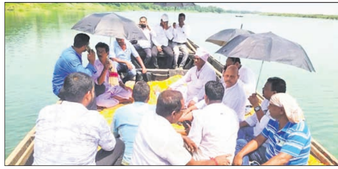
ସୁବର୍ଣ୍ଣରେଖା ନଦୀର ଉତ୍ସବ ପାଇଁ ଆୟୋଜିତ ହେଉଥିବା ସମୀକ୍ଷା ସମ୍ମେଳନାରେ ଉପସ୍ଥିତ ଉପାଧ୍ୟକ୍ଷ ଶ୍ରୀ ରଞ୍ଜନ କୁମାର ସାହୁ ଏବଂ ଅନ୍ୟ ସଭ୍ୟମାନଙ୍କ ସହିତ।

ବାଲିଆପାଳ, ୨୬.୫.୨୨: ବସ୍ତା ବିଧାନ ସଭା ସଭ୍ୟ ଶ୍ରୀ ରଞ୍ଜନ କୁମାର ସାହୁ ଗୃହମନ୍ତ୍ରୀଙ୍କ ସହ ଏକ ସମୀକ୍ଷା ସମ୍ମେଳନା ଆୟୋଜନ କରିଛନ୍ତି।