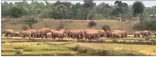
ମୋରଡ଼ାରେ ଉପଦ୍ରବ ସୃଷ୍ଟି କରିଥିବା ହାତୀମାନଙ୍କର ଛବି।

ମୋରଡ଼ା, ବୈଶିଙ୍ଗା, ୨୬.୫.୨୨: ବାଲିଆପାଳ, ୨୬.୫.୨୨: ମୋରଡ଼ା ଓ ବୈଶିଙ୍ଗା ଅଞ୍ଚଳରେ ହାତୀମାନଙ୍କର ଉପଦ୍ରବ ହେଉଥିବା ଜଣାପଡିଛି।