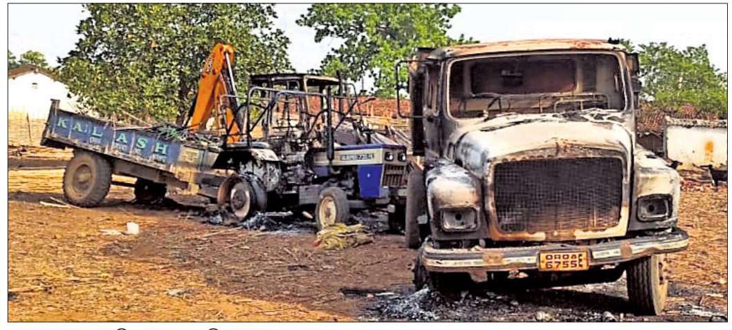
ମାଓବାଦୀମାନେ ଜାଳି ଦେଇଥିବା ଗାଡ଼ି।