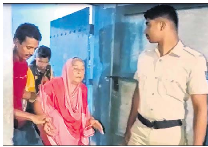
ପୋଲିସ ଠାଳା ଭାଙ୍ଗି ସରକାରୀ କର୍ମଚାରୀଙ୍କୁ ରକ୍ଷା କରୁଛି।