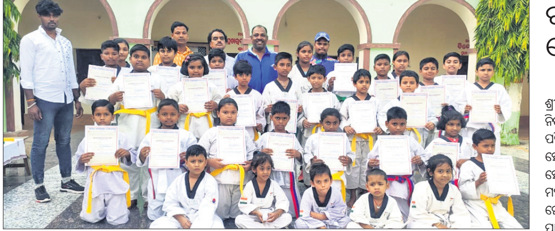
ସାକ୍ଷୀଗୋପାଳର ସତ୍ୟବାଦୀ ଉଚ୍ଚ ବିଦ୍ୟାଳୟରେ ଗୁରୁବାର ହାରା ଚାଏକୋଡ଼ୋ ଏକାଡେମୀର ବେଲୁ ଓ ପ୍ରମାଣପତ୍ର ପ୍ରଦାନ ସମାରୋହ ହୋଇଛି।

ପୁରୀ ଚାଳକଶିଆଳୀରେ ୫ ଏକର ଜମି ଚିହ୍ନଟ କରାଯାଇଥିଲା ମଧ୍ୟ ରାଜ୍ୟ ଓ ଜିଲ୍ଲା ପ୍ରଶାସନର ମିଳିତ ଭାବେ କ୍ଷେତ୍ର ପ୍ରଦର୍ଶନ ପ୍ରକ୍ରିୟା କାର୍ଯ୍ୟକାରୀ ହୋଇପାରେ ନାହିଁ।