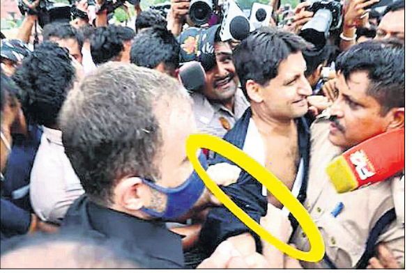
କଂଗ୍ରେସ ବିଶେଷ ଭେଦେ ରାହୁଲ ଗାନ୍ଧୀ ଦାପେନ୍ତ୍ର ଛୁଟାଇ ଶର୍ତ୍ତ ଧରିଥିବା ଫଟୋକୁ ଭାଙ୍ଗିବା ପସରୁ ଭାଇରାଲ କରାଯାଇଛି ।

ନୂଆଦିଲ୍ଲୀ, ୨୮: ଦରଦାମ ବୁକ୍, ବେକାରୀ ଏବଂ ଜିଏସ୍ଟି ବିରୋଧରେ କଂଗ୍ରେସ ପସରୁ ଶୁକ୍ରବାର ଦେଖିବାପାଇଁ ବିଶେଷ ପ୍ରଦର୍ଶନ କରାଯାଇଥିଲା । ଏହି କ୍ରମରେ ନୂଆଦିଲ୍ଲୀରେ ଦକ୍ଷିଣ ପୂର୍ବତନ ଅଧ୍ୟକ୍ଷ ରାହୁଲ ଗାନ୍ଧୀ ଏବଂ ରାଷ୍ଟ୍ରୀୟ ସାଧାରଣ ସମ୍ପାଦକ ପ୍ରିୟଙ୍କା ଗାନ୍ଧୀ ଭଦ୍ରାକ ସମେତ ବହୁ ନେତାଙ୍କୁ ଗିରଫ କରାଯାଇଥିଲା । ବିଶେଷତାରେ ଅଂଶଗ୍ରହଣ କରିଥିବା ନେତାମାନେ କଳା ପୋଷାକ ପିନ୍ଧିଥିଲେ ।