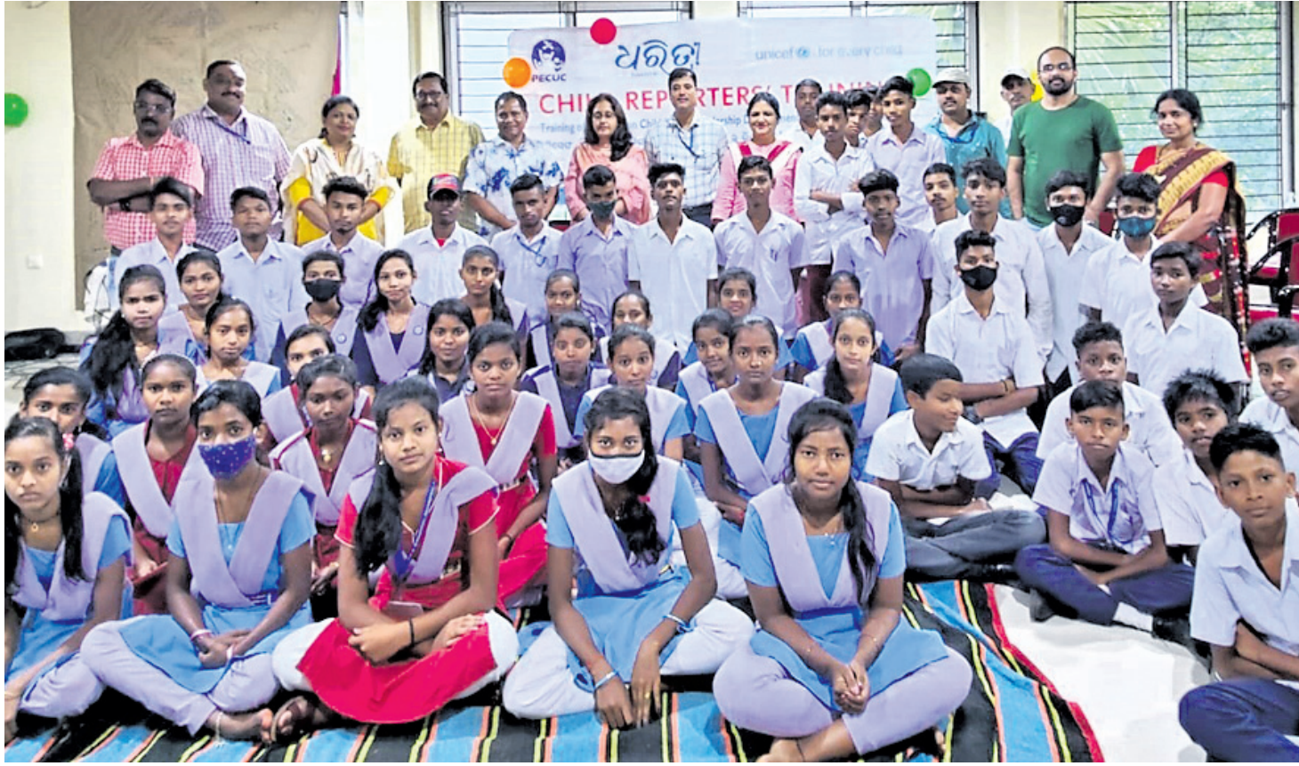
କର୍ମଶାଳାରେ ଛାତ୍ରଛାତ୍ରୀଙ୍କ ସହରେ ଜିଲା ଶିଶୁ ସୁରକ୍ଷା ଅଧିକାରୀ, ଧରଣୀ, ଯୁନିସେଫ୍ ଓ ପିକ୍‌କର୍ କର୍ମକର୍ତ୍ତା ।