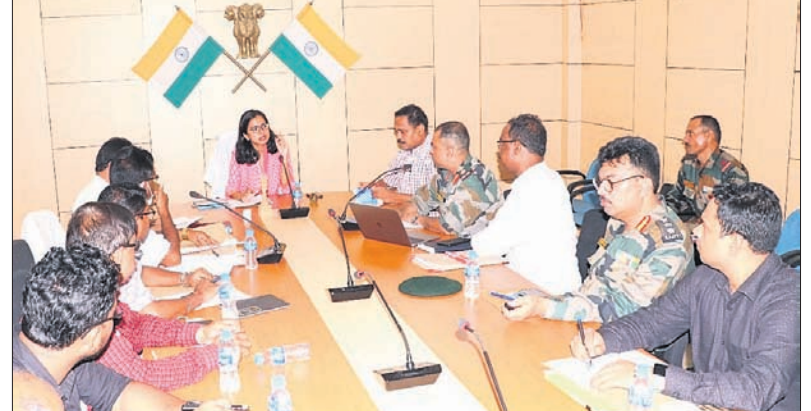
ବୈଠକରେ ଜିଲାପାଳଙ୍କ ସହ ବିଭିନ୍ନ ବିଭାଗୀୟ ଅଧିକାରୀ।

ଆସନ୍ତା ସେପ୍ଟେମ୍ବର ୯ରୁ ୧୫ ତାରିଖ ପର୍ଯ୍ୟନ୍ତ ସମ୍ବଲପୁରରେ ହେବାକୁ ଥିବା ଆର୍ମି ନିଯୁକ୍ତି ରାଲି ନିମନ୍ତେ ବିଭିନ୍ନ ପ୍ରସ୍ତୁତି ବୈଠକ ଏସବୁ ସମ୍ପନ୍ନ କରିବା କ୍ଷମରେ ଅନୁଷ୍ଠିତ ହୋଇଯାଇଛି।