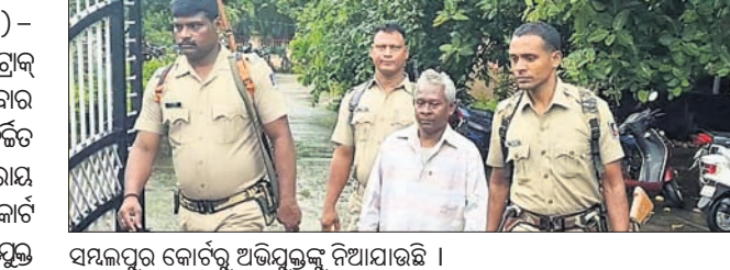
ସମ୍ବଲପୁର କୋର୍ଟରୁ ଅଭିଯୁକ୍ତଙ୍କୁ ନିଆଯାଉଛି ।