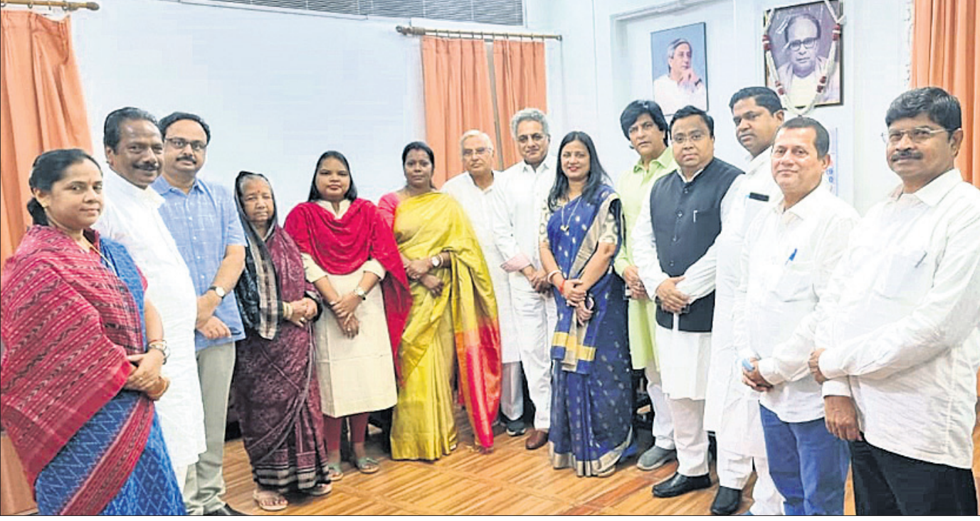
ନୂଆଦିଲ୍ଲୀରେ ଶନିବାର ଉପରାଷ୍ଟ୍ରପତି ପ୍ରାର୍ଥୀ ଜଗଦୀପ୍ ଧନକରଙ୍କୁ ଭୋଟ ଦେବା ପରେ ବିଜେଡି ଲୋକ ସଭା ଓ ରାଜ୍ୟ ସଭା ଏମ୍ପିମାନେ ।