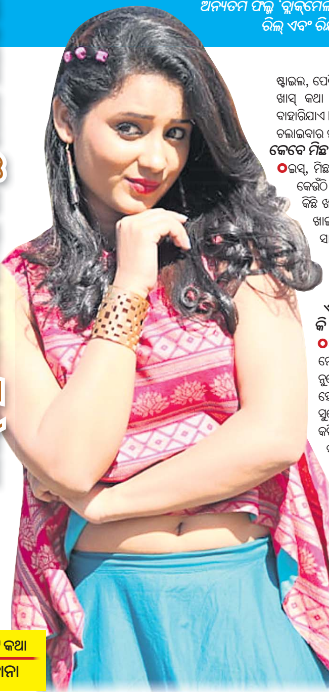
ପାଞ୍ଚଟି କଥା ଆହାନା

ଅବସର କିପରି କଟେ ? ଓ ହୋ, ଅବସର ! କୁହୁଛୁନି । ବର୍ତ୍ତମାନ ମୋର ଗାଜେଟ୍ ସିଡ୍‌ଲୁ । ପାଠପଢ଼ା ଚାଲିଛି ପୁଣି ଚା’ ସହ ଆଜ୍ଞା । ପୁଣି ନିଜକୁ ଫିଟ୍ ରଖିବାକୁ ପ୍ରତିଦିନ ଏକ୍ସରସାଇଜ୍ । ଯେତେବେଳେ ମୋତେ ଅବସର ମିଳେ ମୁଁ ଶୋଇବାକୁ ପସନ୍ଦ କରେ । କିଛି ସମୟ ଶୋଇ ପଡ଼ିଲେ କି ଶାନ୍ତି । ଅନ୍ୟପକ୍ଷରେ ଅବସର ମିଳିଲେ ମୁଁ ସ୍ତବ୍ଧ ଭଳି ଭଲ ମେକଅପ