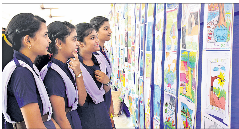
ବରପୁଣ୍ୟ ସରସ୍ୱତୀ ଶିଶୁ ବିଦ୍ୟାଳୟର ପରିସରରେ ଆୟୋଜିତ ଚିତ୍ରକଳା ପ୍ରଦର୍ଶନୀକୁ ଛାତ୍ରୀମାନେ ବୁଲି ଦେଖୁଛନ୍ତି।

ପୁରୁଣା ଭୁବନେଶ୍ୱର, ୨୨।୮ (ଡି.ଏନ୍.ଏ.)- ୩୧.୭ ପୁରୀ-ଭୁବନେଶ୍ୱର ଜାତୀୟ ରାଜପଥର ନୁଡ଼ିଆପୋଖରୀ ଏବଂ ଉତ୍ତରା ଛକ ନିକଟରେ ଦୁଇଟି ପୁଅଙ୍କୁ ପୁଅଙ୍କୁ ଦୁର୍ଘଟଣାରେ ୫ ଜଣ ଆହତ ହୋଇଛନ୍ତି।