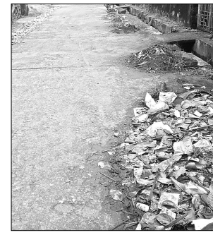
ରାସ୍ତାରେ ଆବର୍ଜନା ପଡ଼ିରହିଛି।

ଖୋର୍ଦ୍ଧା ସହର ଶ୍ରୀରାମନଗର ଗାଧିବାହିରେ ଡେମରୁ ମାଟି କଢାଯାଇ ପ୍ରାୟ ୧ ମାସ ହେବ ରାସ୍ତା ଉପରେ ଗଢା ହୋଇରହିଛି।