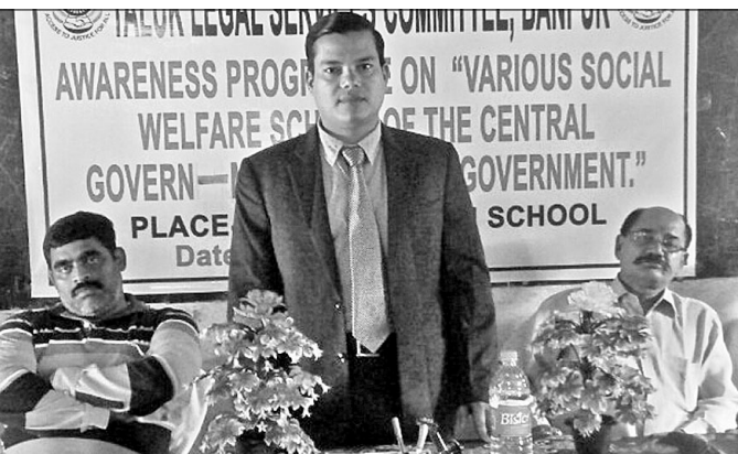
ଶିବିରରେ ଉପସ୍ଥିତ ଅତିଥିମାନେ।