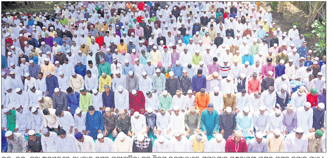
ଭବ୍ୟ-ଭବ୍ୟ-ଭୁଣ୍ଡା ଅବସରରେ ରୁଧିରାଣ କଟକ ସଂଗଠନୀୟ ଛକ ନିକଟ ଉଦ୍‌ଗାଠୀରେ ପୂର୍ବମାନ ସମ୍ପ୍ରଦାୟଙ୍କ ପକ୍ଷରୁ ସମୂହ ନମାଜ ପାଠ।

ଚୌଦ୍ୱାର, ୨୨।୮ (ଡି.ଏନ୍.ଏ.)- ଚୌଦ୍ୱାର ଅଞ୍ଚଳରେ ଭବ୍ୟ-ଭବ୍ୟ-ଭୁଣ୍ଡା ପର୍ବ ପାଳିତ ହୋଇଯାଇଛି। ବହୁସଂଖ୍ୟାରେ ପ୍ରମାଦମାନ ସକାଳେ ସ୍ଥାନୀୟ ମତ୍ସ୍ୟବିତ୍ତ ନିଗମ ପାଠ କରିଥିଲେ।