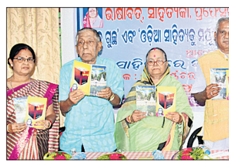
ଭୁବନେଶ୍ୱର, ୨୨।୮ (ଭୁବନେଶ୍ୱର)

‘ଆଶ୍ରୟ’ ସମାଜ କଲ୍ୟାଣ ସଂଗଠନ ପକ୍ଷରୁ ରୁଧିରାଣ ରେଡ଼କ୍ରସ୍ ଉତ୍ତରରେ ‘ଆଶ୍ରୟର ସାହିତ୍ୟ ଉତ୍ସବ-୨୦୧୮’ ଅନୁଷ୍ଠିତ ହୋଇଯାଇଛି।