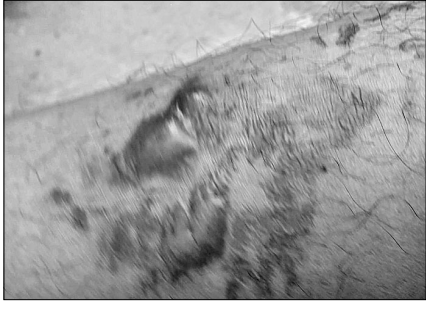
ସରୋଜିନୀଙ୍କ ଗୋଡ଼ାରେ ଚେକ ଦିଆଯାଇଛି।

ଦେଲେ ଘରେ ଥିବା ଦୁଇ ପିଲାଙ୍କର ପାଖ ଯାଏଁ ଓ ସରୋଜିନୀଙ୍କର ଛୁଆକୁ ଯୋଡ଼ି ଦିଆଯାଇଛି। ଗାଈକୁ ହତ୍ୟା ଉଦ୍ୟମ ପରେ ଗାଁର କିଛି ଲୋକଙ୍କ ସହାୟତାରେ ସରୋଜିନୀ ଘର ଛାଡ଼ିଛନ୍ତି।