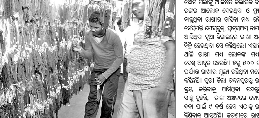
ଜଟଣୀଠାରେ ଥିବା ହୋଇସେଲ୍ ବୋକାନ୍‌ରୁ ଗ୍ରାହକମାନେ ରାଖୀ କିଣୁଛନ୍ତି।

ସାରିଛନ୍ତି। ରାଜ୍ୟର ବିଭିନ୍ନ ଜିଲ୍ଲାରେ ରାଖୀ କ୍ରୟ କରିବା ପାଇଁ ବ୍ୟବସାୟୀମାନେ ଜଟଣୀ ଆସିଥିବା ବୋଲି କୁହାଯାଉଛି।