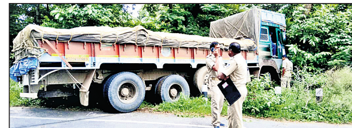
ଦୁର୍ଘଟଣାଗ୍ରସ୍ତ ଟ୍ରକ ଓ ଯାତ୍ରୀବାହୀ ଅଟୋ।