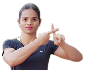
Dutee Chand Sports Personality