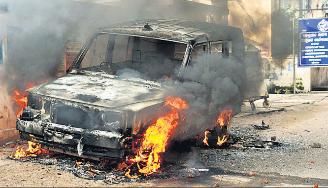
ପୋଡ଼ି ଦିଆଯାଇଥିବା ପୋଲିସ ଜିପ୍।