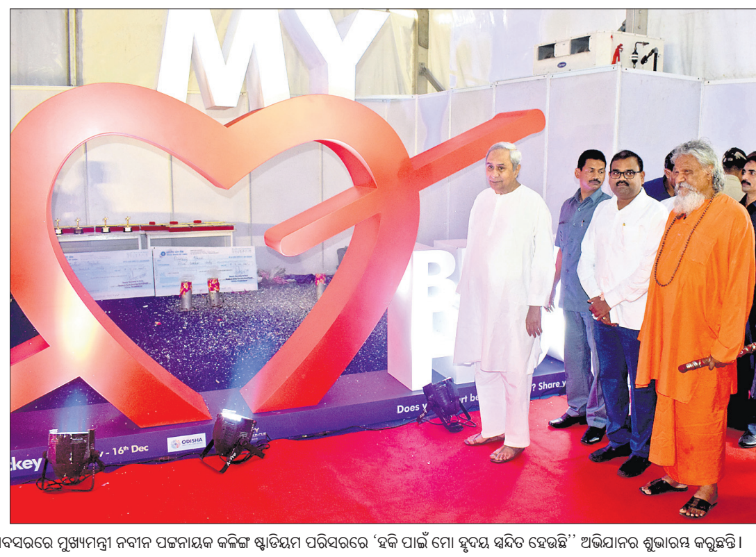
ହକି ବିଶ୍ୱକପର ୯୦ ଦିନିଆ ଅବଗଣନା ଅବସରରେ ପୁଖ୍ୟମନ୍ତ୍ରୀ ନବୀନ ପଟ୍ଟନାୟକ କଳିଙ୍ଗ ଷ୍ଟାଡ଼ିୟମ ପରିସରରେ 'ହକି ପାଇଁ ମୋ ହୃଦୟ ଶ୍ୱଦିତ ହେଉଛି' ଅଭିଯାନର ଶୁଭାରମ୍ଭ କରୁଛନ୍ତି।