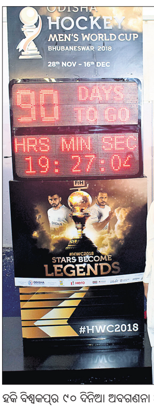
ହକି ବିଶ୍ୱକପର ୯୦ ଦିନିଆ ଅବଗଣନା ଅବସରରେ ପୁଖ୍ୟମନ୍ତ୍ରୀ ନବୀନ ପଟ୍ଟନାୟକ କଳିଙ୍ଗ ଷ୍ଟାଡ଼ିୟମ ପରିସରରେ 'ହକି ପାଇଁ ମୋ ହୃଦୟ ଶ୍ୱଦିତ ହେଉଛି, ଆଉ ଆପଣଙ୍କର' ଅଭିଯାନର ଶୁଭାରମ୍ଭ କରୁଛନ୍ତି।

ଭୁବନେଶ୍ୱର, ୨୯୮୮(କ୍ରୀଡ଼ା ପ୍ରତିନିଧି) ଜାତୀୟ କ୍ରୀଡ଼ା ଦିବସ ଅବସରରେ ରୁଧିରାଜୀ ହକି ବିଶ୍ୱକପ ବିଗୁଲ ଏଥିପ୍ରତି ଏହି ମେଗା ପ୍ରତିଯୋଗିତା ପାଇଁ ଆରମ୍ଭ ହୋଇଛି ଅବଗଣନା।