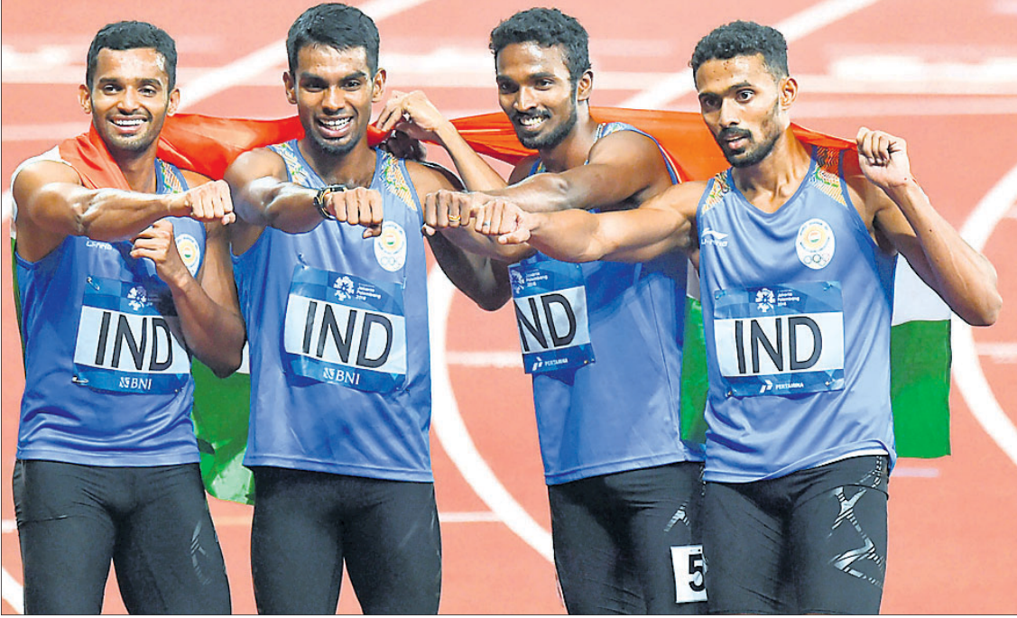
୪୪୪୦୦ ରିଲେରେ ରୌପ୍ୟ ପଦକ ବିଜୟୀ ଭାରତୀୟ ପୁରୁଷ ଦଳ ।