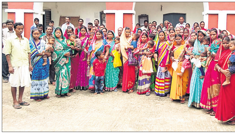
ଉପଜିଲ୍ଲାପାଳଙ୍କ ଭେଟିବାକୁ ଆସିଥିବା ଗ୍ରାମବାସୀ।