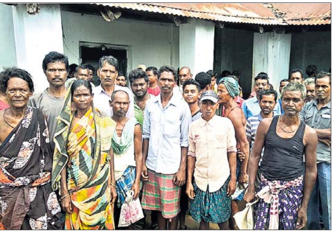
ଡେକ୍‌କୋଟରେ ସାର ପାଇଁ ଚାଷୀଙ୍କ ଭିଡ଼।

ଯୋଜନା ଉପସ୍ଥିତିରେ ସାର ବଣ୍ଟା ଯାଇଥିଲା। କିନ୍ତୁ ଅପରାହ୍ନ ବେଳକୁ ସାର ସରିଯିବାରୁ ଶତାଧିକ ଚାଷୀ ନିରାଶ ହୋଇ ଫେରିଥିଲେ। ଗୁରୁବାର ସକାଳେ କେନ୍ଦୁଝର ସରକାରଙ୍କୁ ଅନୁରୋଧ କରି ପଞ୍ଚାୟତକୁ ସାର ଆସିଥିବା ଖବର ପାଇ ଆଖପାଖ ୪ ଟି ପଞ୍ଚାୟତର ଚାଷୀ ଆସି ଭିଡ଼ ଜମାଇଥିଲେ। କେନ୍ଦୁଝର ଡେକ୍‌କୋଟ ଚାଷୀ ସାର ନେବା ଲାଗି ୧୦ କି.ମି. ଦୂରର ଅଟେ ଭଡା କରି ଆସିଥିଲେ। ସେମାନଙ୍କୁ କେବଳ ଗୋଟିଏ ପ୍ୟାକେଟ ଲେଖାଏ ସାର ମିଳୁଥିଲା। ସାର ଦାମ ୨୭୦ ଟଙ୍କା ଥିବା ବେଳେ ଅଟେ ଭଡା ବେତ ଉପରେ କୋରଡ଼ା ମାତ୍ର ସମ୍ପୂର୍ଣ୍ଣ ହୋଇଥିଲା। ଡେକ୍‌କୋଟ ଖରିଫ ଧାନ ଚାଷ ଲାଗି ବର୍ତ୍ତମାନ ଆବଶ୍ୟକ ସାର ମିଳୁ ନ ଥିବାରୁ ଏଥର ଚାଷକାରୀମାନେ ବାଧ୍ୟତା ସହ ସାର ପ୍ରକାଶ ପାଇଛି। ଚାଷୀ ଶ୍ରମିକମାନେ ମହାନ୍ତ ତାଙ୍କ ପ୍ରତିକ୍ରିୟାରେ ସାର ଅନୁରୋଧ ପ୍ରତିକ୍ରିୟା ଦେଖି କହିଛନ୍ତି। ବିଭାଗକୁ ସମାଲୋଚନା କରିଛନ୍ତି। ଅଧିକ ଜମି ଥିବା ଚାଷୀ ଗୋଟିଏ ବସ୍ତା ସାର