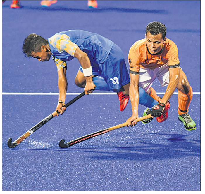
ଭାରତ ଓ ମାଲେସିଆ ମଧ୍ୟରେ ଅନୁଷ୍ଠିତ ମ୍ୟାଚ ।

କାକର୍ତ୍ତା, ୩୦।୮ (ପି.ଟି.) ଏସିଆନ୍ ଗେମ୍ସ ହକି ଇଭେଣ୍ଟରେ ଗତଥର ଚାମ୍ପିୟନ ଭାରତୀୟ ପୁରୁଷ ଦଳ ସ୍ୱର୍ଣ୍ଣ ପଦକ ହାସଲ କରି ପାରିନା । ଗୁରୁବାର ଅନୁଷ୍ଠିତ କ୍ରୀଡ଼ା ସଂପର୍କିତ ସେମିଫାଇନାଲ ମ୍ୟାଚରେ ଭାରତ ଅପେକ୍ଷାକୃତ ଦୁର୍ବଳ ମାଲେସିଆଠାରୁ ସତନ ଡେଥରେ ୬-୬ ଗୋଲରେ ପରାସ୍ତ ହୋଇଛି । ଫଳରେ କେବଳ ସ୍ୱର୍ଣ୍ଣ ଚୁକ୍ତି, ରୌପ୍ୟ ପଦକ ହାସଲକୁ ମଧ୍ୟ ଭାରତ ବଞ୍ଚିତ ହୋଇଛି । ସମ୍ପୂର୍ଣ୍ଣ ୨୦୨୦ ଟୋକିଓ ଅଲିମ୍ପିକ୍ସ ପାଇଁ ସିଧାସଳଖ ଯୋଗ୍ୟତା ହାସଲ କରିବା