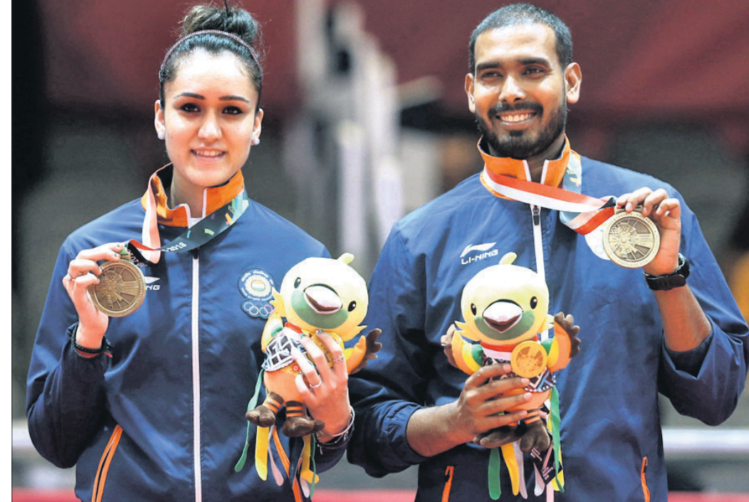
ବେଲ୍‌ଫାଷ୍ଟରେ ଦିନିଆ ସିରିଜର ଦ୍ୱିତୀୟ ମ୍ୟାଚ୍‌ରେ ଆଫଗାନିସ୍ତାନ ଅଧିକ ଗରଥ କଳା(ତାହାଶ) ଓ ମାଲିକା ବାତ୍ରା ଗୁରୁବାର ପଦକ ଗ୍ରହଣ ଅବସରରେ ।