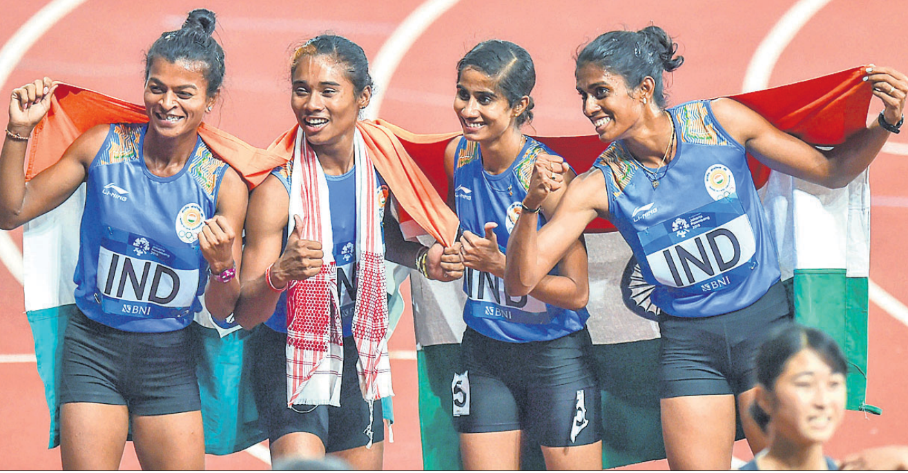
୪୪୪୦୦ ରିଲେରେ ସ୍ୱର୍ଣ୍ଣ ପଦକ ବିଜୟୀ ଭାରତୀୟ ମହିଳା ଦଳ ।

ସିକନରେ ପୂର୍ବରୁ ୬୭.୦୩ ମିଟର ଥିଲା । ଏଠାରେ ସେ ୫୯.୬୧ ମିଟରକୁ ଅଭିମାନ ଆରମ୍ଭ କରିଥିଲେ ହେଁ କ୍ରମେ ଉନ୍ନତି କରି ଶେଷରେ ଶେଷ ଉଦ୍ୟମରେ ୬୫.୧୨ ମିଟର ଥିଲା । ସ୍ୱର୍ଣ୍ଣ ପଦକ ହାସଲ କରିଥିଲେ । ସୀମା ୨୦୧୪ ଇଣ୍ଡିଆନ୍ ଏସିଆନ୍ ଗେମ୍ସରେ ୬୧.୦୩ ମିଟର ଦୂରକୁ ଡିସ୍କ୍‌ସ୍ ପକ୍ଷିପୁରା ସ୍ୱର୍ଣ୍ଣ ପଦକ ହାସଲ କରିଥିଲେ । ମାତ୍ର ଏଠାରେ ୬୨.୨୬ ମିଟର ଥିଲା । ସେହି ଗ୍ରୋଞ୍ଜ ପଦକରେ ସବୁଠାରୁ ହେବାକୁ ପଡ଼ିଥିଲା । ଏହା ସହ ୪ଥର ରାଜ୍ୟଗୋଷ୍ଠୀ କ୍ରୀଡ଼ା ଏବଂ ୨ଟି ଏସିଆନ୍ କ୍ରୀଡ଼ା ପଦକ ହାସଲ କରି ସୀମା ଏସିଆନ୍ ଶ୍ରେଷ୍ଠ ଡିସ୍କ୍‌ସ୍ ଥ୍ରୋୟାର ହୋଇଛନ୍ତି । ଏଥିରେ ଭାରତ ନେଇଥିବା ଅନ୍ୟତମ ଭାରତୀୟ ହରିୟାଣାର ସମୀପ କୁମ୍ଭାପୁର ୫୪.୬୧ ମିଟର ସହ ୫ମ ସ୍ଥାନରେ ରହିଥିଲେ । ତାଙ୍କର ଶେଷ ୩ ଉଦ୍ୟମ ଫାଉଲ୍ ହୋଇଥିଲା । ମହିଳା ୧୫୦୦ ମିଟର ରେସ୍‌ରେ ମଧ୍ୟ ତ୍ରିପୁରାକୁ ଗ୍ରୋଞ୍ଜ ପଦକରେ ସବୁଠାରୁ ହେବାକୁ ପଡ଼ିଥିଲା । ଚଳିତ ସିକନ ପ୍ରଦର୍ଶନ ଦୃଷ୍ଟିରୁ ହର୍ ଫେଭରାଇଟ୍‌ଆବେ ରେସ୍ ଆରମ୍ଭ କରିଥିଲେ । ମାତ୍ର ସେ ୪ ମିନିଟ ୧୨.୫୬ ସେକେଣ୍ଡ ସମୟ ନେଇ ତୃତୀୟ ସ୍ଥାନରେ ରହି ପାରିଥିଲେ । ବାହାରିନର ଦୁଇ ପ୍ରତିଯୋଗୀ କାଲିକତାନ୍ ବେଫୁକାକୁ ୪:୦୭.୮୮ ସେକେଣ୍ଡ ସହ ସ୍ୱର୍ଣ୍ଣ ଏବଂ ୪:୧୨ ମିଟର ଥିଲା । ସ୍ୱର୍ଣ୍ଣ ପଦକ ହାସଲ କରିଥିଲେ । ସୀମା ୨୦୧୭ ଏସିଆନ୍ ଚାମ୍ପିୟନସ୍‌ସିପ୍‌ରେ ତ୍ରିପୁରା ୪:୧୭.୯୨ ସେକେଣ୍ଡ ସମୟ ନେଇ ସ୍ୱର୍ଣ୍ଣ ପଦକ ହାସଲ କରିଥିଲେ । ଭାରତୀୟ ପୁରୁଷ ରିଲେ ଦଳକୁ ରୌପ୍ୟ ଭାରତୀୟ ୪୪୪୦୦ ମିଟର ପୁରୁଷ ରିଲେ ଦଳ ଦ୍ୱିତୀୟ ସ୍ଥାନରେ ରହି ରୌପ୍ୟ ପଦକ ପାଇଛି । ଗୁରୁବାର ଅନୁଷ୍ଠିତ ଇଭେଣ୍ଟରେ କୁମ୍ଭାପୁର ମହମ୍ମଦ, ଧରୁନ ଆୟାସୀନି, ମହମ୍ମଦ ଆନାସ ଓ ରାଜୀବ ଆରୋକିଆଙ୍କୁ ନେଇ ଭାରତୀୟ ଦଳ ୩:୦୧.୮୫ ସେକେଣ୍ଡ ସମୟ ନେଇ ଦ୍ୱିତୀୟ ସ୍ଥାନରେ ରହିଥିଲେ । କାତାର ଦଳ ୩:୦୦.୫୬ ସେକେଣ୍ଡ ସମୟ ନେଇ ସ୍ୱର୍ଣ୍ଣ ଏବଂ କାପାନ ଦଳ ୩:୦୧.୯୪ ସେକେଣ୍ଡ ସମୟ ସହ ଗ୍ରୋଞ୍ଜ ପଦକ ପାଇଥିଲେ । ୨୦୧୪ ଏସିଆନ୍ ଗେମ୍ସରେ ଭାରତୀୟ ଦଳ ୪ଟି ସ୍ଥାନରେ ରହିଥିଲା ।