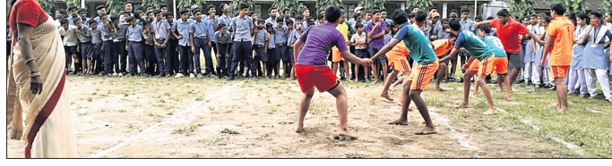
ବାଉନ ହାଇସ୍କୁଲ ପରିସରରେ କବାଡ଼ି ଖେଳ।