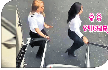
କି କି ଟ୍ୟାଲେକ୍ସ

ଦୁର୍ଘଟ: ବିମାନର 'କି କି ଟ୍ୟାଲେକ୍ସ'ର ଆଉ ଏକ ଭୟଙ୍କର ଭିଡିଓ ସୋପାଆଇ ମିଡିଆରେ ଭାଇରାଲ ହେବାରେ ଲାଗିଛି। ୨୦୦୪ର ଆଇକନିକ୍ ଆମେରିକୀୟ ଟେଲିଭିଜନ ଧାରାବାହିକ 'ଫ୍ରେଣ୍ଡ୍‌ସ୍'ର ଶେଷ ଏପିସୋଡ୍‌କୁ ଏହା ମନେପକାଇଦେଇଛି। ଉକ୍ତ ଧାରାବାହିକରେ ରାଚେଲ୍ ଗ୍ରୀନ୍ ଭୂମିକାରେ ଅଭିନୟ କରିଥିବା କେନିଫର୍ ଆନିଷ୍ଟେନ୍ ନିକ୍ ପ୍ରେମିକଙ୍କ ପାଇଁ ରନ୍‌ଡ୍‌ଫ୍ରେରେ ଚଳନ୍ତା ବିମାନରୁ ଓହ୍ଲାଇ ପଡ଼ିଥିଲେ। ଏହି ଦୃଶ୍ୟ ଏବଂ ଅଭିନେତ୍ରୀଙ୍କ ଡାଇଲଗ୍ ଦର୍ଶକଙ୍କ ମନକୁ ଲିପି ନ ଥିବାବେଳେ ବର୍ତ୍ତମାନ ଉକ୍ତ କାଳ୍ପନିକ କାହାଣୀର ବାସ୍ତବ ତିତ୍ତ୍ୱ ବେଶ୍‌ବାଦୀ ମିଳିଛି।