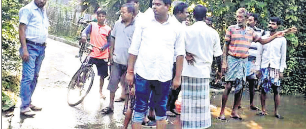
ଜିଲ୍ଲା କଂଗ୍ରେସ ଚିଫ୍ ବନମାଞ୍ଚଳ ବୁଲି ଦେଖୁଛନ୍ତି।