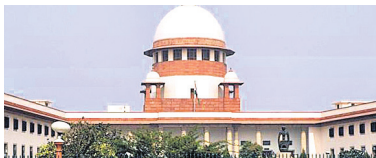
ରଞ୍ଜନ ଗୋଗୋଇଙ୍କ ଅଧକ୍ଷତାରେ ଗଠିତ ୫ ଜଣିଆ ସାମ୍ବିଧାନିକ ପୀଠ ସେପ୍ଟେମ୍ବର ୫ ତାରିଖରେ ଏହି ନିର୍ଦ୍ଦେଶ ଜଣାଇଥିଲା।

ସେ ସରକାରୀ ଚାକିରି କ୍ଷେତ୍ରରେ ସଂରକ୍ଷଣ ସୁବିଧା ଦାବି କରିପାରିବେ ନାହିଁ ବୋଲି ଗୁରୁବାର ସୁପ୍ରିମକୋର୍ଟ ଏକ ଗୁରୁତ୍ଵପୂର୍ଣ୍ଣ ନିର୍ଦ୍ଦେଶ ଦେଇଛନ୍ତି। ଗୋଟିଏ ରାଜ୍ୟର ଏସ୍‌ସି/ଏସ୍‌ଟି ଅନ୍ୟ ରାଜ୍ୟରେ ସଂରକ୍ଷଣ ସୁବିଧା ଦାବି କରିପାରିବେନି କି ନାହିଁ ତାହା ସ୍ପଷ୍ଟ କରିବା ପାଇଁ ସୁପ୍ରିମକୋର୍ଟରେ ଏକାଧିକ ପିଟିଶନ ଦାଖଲ ହୋଇଥିଲା। ଜଷ୍ଟିସ୍