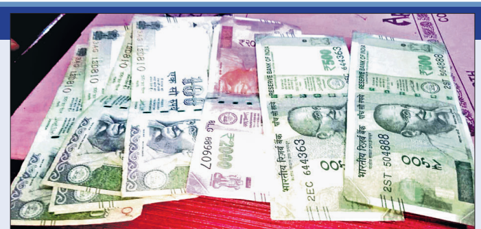
ପୋଲିସ ଦ୍ୱାରା ଜବତ ନକଲି ନୋଟ। ୭,୫୦୦ ଟଙ୍କାର ନକଲି ନୋଟ ଜବତ। ଗିରଫ ଅଭିଯୁକ୍ତଙ୍କୁ ପଚରାଉଚରା। ୧୫ ହଜାର ବଦଳରେ ଯାଜପୁରରୁ ଆଣିଥିଲେ ୧ ଲକ୍ଷ ଟଙ୍କା। ମାଷ୍ଟରମାଇଣ୍ଡକୁ ଖୋଜୁଛି ପୋଲିସ।