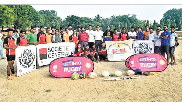
ମିନି ଷ୍ଟାଡ଼ିୟମ୍‌ରେ ଅତିଥି ଓ ଖେଳାଳିମାନେ।