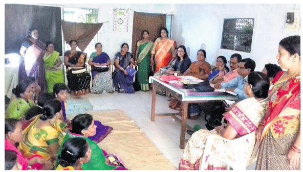
ଜିଲା ସମାଜ କଲ୍ୟାଣ ବିଭାଗର କର୍ତାଚାରୀଙ୍କଠାରୁ ପାଣି ସଂଗ୍ରହ କରୁଛି ।