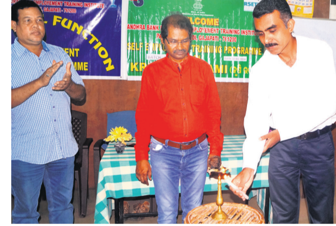
ଅଭିଯୁକ୍ତ ପ୍ରାଥମିକ କୃଷି ଶିବିରକୁ ଉଦ୍ଘାଟନ କରୁଛନ୍ତି।

ଗଜପତି ଜିଲ୍ଲା ସରକାର ମହାକୁମାରୀ ପାରଳାଖେମୁଣ୍ଡିରୁ ଆଣି ବ୍ୟାଙ୍କ ଗ୍ରାମୀଣ ଆମ୍ବୁଲେନ୍ସ ଚାଳନା ପ୍ରତିଷ୍ଠାନ ଠାରେ ଏକ କୃଷି ଉତ୍ସାହୀ ଚାଳନା ଶିବିର ଆରମ୍ଭ ହୋଇଛି। ଏହା ୧୩ ଦିନ ଚାଲିବ। ଏଥିରେ ଜିଲ୍ଲାର ବିଭିନ୍ନ ସ୍ଥାନରୁ ଆସିଥିବା ୫୦ଜଣ କୃଷକ ସାମିଲ ହୋଇଛନ୍ତି।