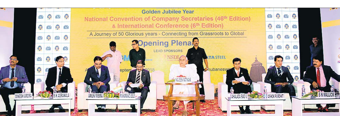
ଭୁବନେଶ୍ୱରରେ ଇନିସ୍ପିରିଟ୍ ଅଫ୍ କମ୍ପାନୀ ସେକ୍ରେଟାରିଜ୍ ଅଫ୍ ଇଣ୍ଡିଆ ପକ୍ଷରୁ ଗୃହୀତ ଉଦ୍ୟୋଗ ସୁବର୍ଣ୍ଣ ଜୟନ୍ତୀ ପାଦନ ଅବସରରେ ମହାସାଧନ ପୃଷ୍ଠାମୁଖୀ ନବୀନ ପଟ୍ଟନାୟକ ଓ ଅନ୍ୟ ଅତିଥି।

୨୦୧୧ ଅଗଷ୍ଟରେ ବିକ୍ରି କରିବା ପରେ ପଠାଯାଇଥିଲା। ସେତେବେଳେ ଏହି ହିରାର ମୂଲ୍ୟ ୧.୧ ମିଲିୟନ ଡଲାର ଦର୍ଶାଯାଇଥିଲା।