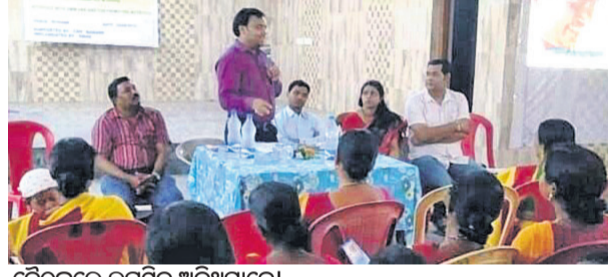
ବୈଠକରେ ଉପସ୍ଥିତ ଅତିଥିମାନେ।

ଋତିକ୍ ସେବା ପାଇବାରେ ପୁସ୍ତିକ ହେଉଛି। ରାମଗିରିରେ କେବଳ ୨୬ଟି ଏବଂ ୩୯ଟି ସେବା ସ୍ଥାନରେ ବିଏସ୍‌ଏଲ୍ ସେବା ଯୋଗାଇବା ପାଇଁ ମାଗିଛି।