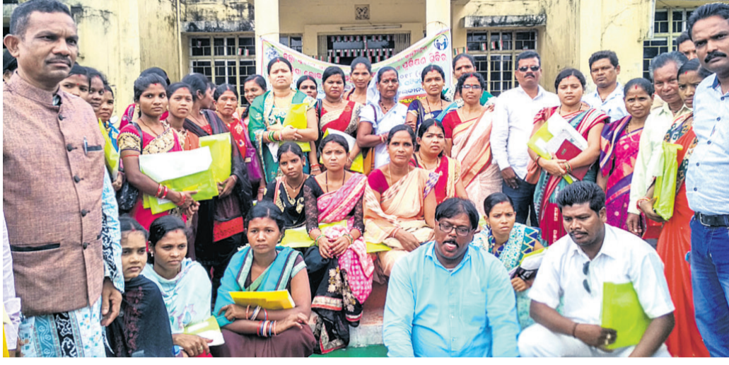
ତାଲିମ କାର୍ଯ୍ୟକ୍ରମକୁ ଆସିଥିବା ଜନ ପ୍ରତିନିଧିମାନେ ।

ମାଲକାନଗିରି ଜିଲ୍ଲା ପରିଷଦ ସମ୍ମିଳନୀ କକ୍ଷରେ ଗୁରୁବାର ଏକ ଅଭାବନୀୟ ପରିସ୍ଥିତି ଦେଖିବାକୁ ମିଳିଛି । ଜିଲ୍ଲାର ସମସ୍ତ ଜିଲ୍ଲାସ୍ତରୀୟ ଜନ ପ୍ରତିନିଧିମାନଙ୍କ ଦୁଇଦିନିଆ ତାଲିମ ଶିବିର ଅଧାରୁ ବନ୍ଦ ହୋଇଯାଇଛି। ପୂର୍ବରୁ ୧୧ଟାରେ ଏହି ଶିବିର ଆରମ୍ଭ ହୋଇଥିଲା । କେନ୍ଦ୍ର ଏବଂ ରାଜ୍ୟ ସରକାରଙ୍କ ବିଭିନ୍ନ ଜନସଂଲଗ୍ନ ଯୋଜନା ଗ୍ରାମାଞ୍ଚଳରେ କିପରି କାର୍ଯ୍ୟକାରୀ ହେଉଛି ସେଥିପ୍ରତି ପାଇଁ ଫୋକଲୋକ ସମ୍ବନ୍ଧ, ଲୁକ ଅଧିକାର, ସମିତିସଭା, ଜିଲ୍ଲା ପରିଷଦ ସଭା, ପୁନିର୍ବାସନା କାର୍ଯ୍ୟକ୍ରମ ପାଇଁ କାର୍ଯ୍ୟକାରୀ ଏବଂ ଅଧିକ, ଜିଲ୍ଲା ପରିଷଦ ଅଧିକାରୀ ଓ ସଭାସଭାଙ୍କ ଭୂମିକା ସମ୍ବନ୍ଧରେ ଅବଗତ କରାଇବା ଲାଗି ଶିବିର ହେଉଥିଲା। ଅତିରିକ୍ତ ଜିଲ୍ଲାପାଳଙ୍କ ନିର୍ଦ୍ଦେଶରେ କାର୍ଯ୍ୟକ୍ରମ ପାଇଁ ଭୁବନେଶ୍ୱରରୁ ତାଲିମଦାତା ଆସିଥିଲେ। ଜିଲ୍ଲାର ଗ୍ରାମ୍ୟ ଉନ୍ନୟନ ପ୍ରକଳ୍ପ ନିର୍ଦ୍ଦେଶକ, ଜିଲ୍ଲା ପୁଞ୍ଜି ଚିକିତ୍ସା ଅଧିକାରୀ, ଜିଲ୍ଲା ସୂଚନା ଅଧିକାରୀ, ଜିଲ୍ଲା ପରିବହନ ଅଧିକାରୀଙ୍କ ସମେତ ସମସ୍ତ ବିଭାଗୀୟ ଅଧିକାରୀମାନେ ନିଜ ନିଜ ବିଭାଗର କେନ୍ଦ୍ର ଓ ରାଜ୍ୟ ସରକାରଙ୍କ କାର୍ଯ୍ୟକାରୀ ହେଉଥିବା ଯୋଜନା ସମ୍ବନ୍ଧରେ ଜନ ପ୍ରତିନିଧିମାନଙ୍କୁ ଅବଗତ କରି