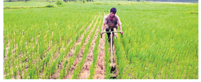
ଜଣେ ଚାଷୀ ଶ୍ରୀ ପ୍ରଶାଳୀରେ ଚାଷ କରିଛନ୍ତି ।