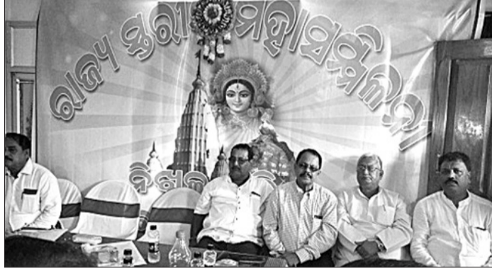
ଓଡ଼ିଶା ରାଜ୍ୟ ଘରୋଇ ବସ୍ ମାଲିକ ସଂଘର ବୈଠକରେ ଆଲୋଚନା କରାଯାଇଛି ।

କଳାହାଣ୍ଡି ଜିଲ୍ଲା ଭବାନୀପାଟଣାସ୍ଥିତ ସଂଘର ବସ୍ ମାଲିକ ସଂଘର ବୈଠକ ଆରମ୍ଭ ହୋଇଛି ।