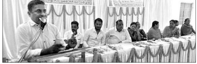
ଖଡ଼ିଆଳକରେ ଅନୁଷ୍ଠିତ ସ୍ଵାୟତ୍ତ ଶାସନ ଦିବସ କାର୍ଯ୍ୟକ୍ରମରେ ମହାଧ୍ୟାପକ ଅତିଥି ।

କୂଳାଗତ ପ୍ରିୟତମ୍ଭରା ଉଦ୍ଦିଷ୍ଟ ମହାବିଦ୍ୟାଳୟ ଆରମ୍ଭରୁ ଅଧ୍ୟକ୍ଷ ଭାବରେ ଦାୟିତ୍ଵ ତୁଲାଇ ସାଙ୍ଗରେ ଆସିଥିବା ଏହି ଅଧ୍ୟକ୍ଷଙ୍କୁ ବିଦାୟକାଳୀନ ସମ୍ବର୍ଦ୍ଧନା ପ୍ରଦାନ କରାଯାଇଥିଲା ।