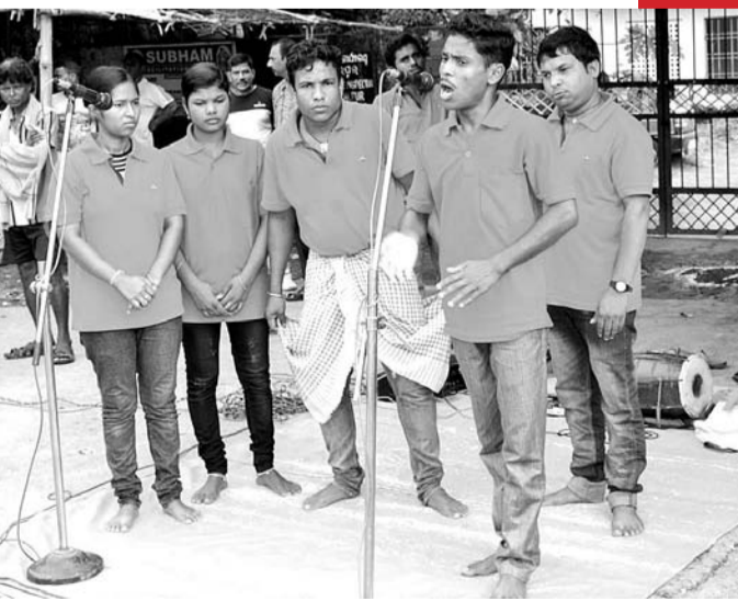
ଶୁକ୍ରବାର ସମ୍ବଲପୁର କେଲ ଛକଠାରେ ଛାତ୍ର ଉପରେ ବର୍ଷା କଳ ଅମଳ ବ୍ୟବସ୍ଥା ଶୀର୍ଷକ ପଥପ୍ରାନ୍ତ ନାଟକ।