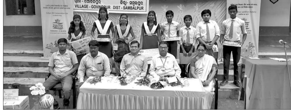
ବାମରା ହାଇସ୍କୁଲ ପରିସରରେ ଅନୁଷ୍ଠିତ କାର୍ଯ୍ୟକ୍ରମରେ ଅତିଥି ଗଣେଶେ ପୁରସ୍କୃତ ଛାତ୍ରାଛାତ୍ରୀ।