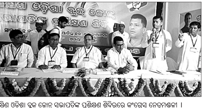
ଦକ୍ଷିଣ ଓଡ଼ିଶା ବ୍ଲକ ଜୋନ୍ ସଭାପତିଙ୍କ ପ୍ରଶିକ୍ଷଣ ଶିବିରରେ କଂଗ୍ରେସ ନେତୃମଣ୍ଡଳୀ ।

ଦକ୍ଷିଣ ଓଡ଼ିଶା ବ୍ଲକ ଜୋନ୍ ସଭାପତିଙ୍କ ପ୍ରଶିକ୍ଷଣ ଶିବିର ଆରମ୍ଭ ହୋଇଛି ।