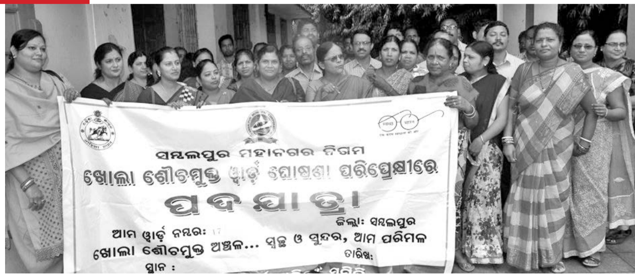
ଖୋଲାରେ ମନଦୀର ଦ୍ୱାରା ପରିବେଷିତ ପ୍ରକୃତି ହେଉଛି। ଏଣୁ ଏଥିପାଇଁ ସଚେତନତା ଉଦ୍ଦେଶ୍ୟରେ ଶୁକ୍ରବାର ସମ୍ବଲପୁର ମହାନଗର ନିଗମ ପକ୍ଷରୁ ଖୋଲା ଶୈତପୁତ୍ର ପଦଯାତ୍ରା ବାହାରିବା ଅବସ୍ଥାରେ ସାମିଲ ହୋଇଥିବା ମହିଳାମାନେ।