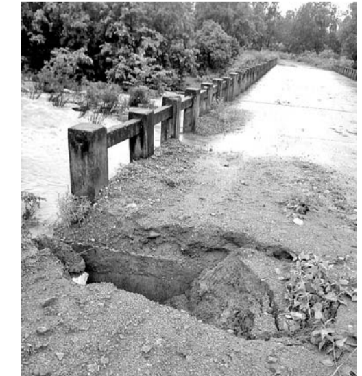
ନାକଟାବେଇ ବୁକ୍ ଯୋଗାଯୋଗ-ଲୀଞ୍ଜିମାଳ ରାସ୍ତାର ଯୋଗାଯୋଗ ବୃଦ୍ଧି ପାଇଁ ବିପଦସଙ୍କୁଳ ଅବସ୍ଥାରେ।

ବାମରା ହାଇସ୍କୁଲ ପରିସରରେ ଶୁକ୍ରବାର ଭାରତ ସରକାରଙ୍କ ଦ୍ୱାରା ପରିଚାଳିତ ଇଣ୍ଡିଆନ୍ ଅଧିକ କର୍ପୋରେସନ୍ ଲିମିଟେଡ ପକ୍ଷରୁ ଗ୍ରାମ୍ୟ ସଚେତନତା ସଭା ଓ ସ୍କୁଲ ଭାରତ ଅଭିଯାନର ସ୍ୱଚ୍ଛତା ପକ୍ଷ ଅନୁଷ୍ଠିତ ହୋଇଯାଇଛି।