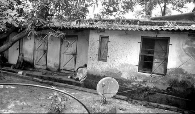
କୁତୁମ୍ଭା ବୁକ୍ ପୁଲ୍‌ଝରନ୍‌ଠାରେ ବିପଦ ଅବସ୍ଥାରେ ଥିବାର ମାଡ଼ୁଭବନ।

ଗୁଡ଼େ ସୁଆସ୍ତିଆ କେନ୍ଦ୍ର ବି ଉଦ୍ଦେଶ୍ୟ ହେଇଛି। ଇଥିରେ ଭୂଅର୍ଜନ ଅଧିକାରୀ ବିଭାଗ ତରଫୁ ପାଖାପାଖି ୫୩ ଲକ୍ଷ ଟଙ୍କା ପାର୍ବତୀଗିରି ଗ୍ରାମରେ ବେଭାର କାମ୍ ଆରମ୍ଭ ହେଇଛି।