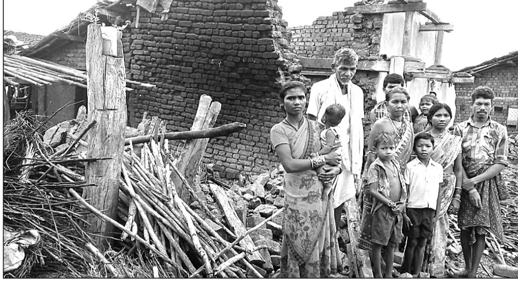
ନୂଆପତା ଅଞ୍ଚଳରେ ଘର ଭାଙ୍ଗି ନିଆଁସି ହେଲେ ୨ ଗରିବ ପରିବାର ।

ଗଲା କେତେ ଦିନ ହେଲା ସିନାପାଲି ଅଞ୍ଚଳରେ ଝରି ବନ୍ଧୁର ଲାଗି ବହୁତ କଷ୍ଟ ହେଇଛି । ଏବେ ନୂଆପତା ଅଞ୍ଚଳରେ ଘର ଭାଙ୍ଗି ନିଆଁସି ହେଲେ ୨ ଗରିବ ପରିବାର ।