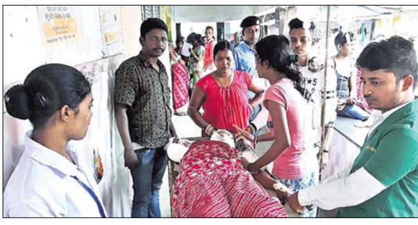
ବରଗଡ଼ ଅଧିକାରୀଙ୍କ ଦ୍ଵାରା ପରିଷ୍କାର କରାଯାଇଥିବା ଦୂରଦର୍ଶନ ପ୍ରସାରଣ କାର୍ଯ୍ୟକ୍ରମର ଛାତ୍ରୀଙ୍କ ହାତ କଟିଲା

ବରଗଡ଼ ଅଧିକାରୀଙ୍କ ଦ୍ଵାରା ପରିଷ୍କାର କରାଯାଇଥିବା ଦୂରଦର୍ଶନ ପ୍ରସାରଣ କାର୍ଯ୍ୟକ୍ରମର ଛାତ୍ରୀଙ୍କ ହାତ କଟିଲା । ଦୂରଦର୍ଶନ ପ୍ରସାରଣ କାର୍ଯ୍ୟକ୍ରମର ଛାତ୍ରୀଙ୍କ ହାତ କଟିଲା । ଦୂରଦର୍ଶନ ପ୍ରସାରଣ କାର୍ଯ୍ୟକ୍ରମର ଛାତ୍ରୀଙ୍କ ହାତ କଟିଲା ।