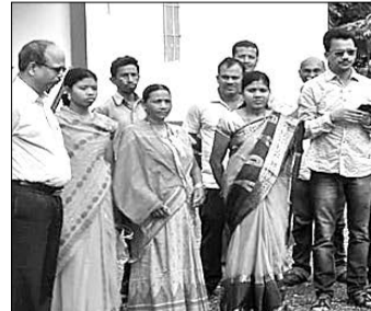
ରେଡ଼ାଖୋଲ ଏନ୍.ଏସି ପରିସରରେ ଶୁକ୍ରବାର ଅନୁଷ୍ଠିତ ସ୍ୱାସ୍ଥ୍ୟ ଶିବିରର ଦିବ୍ୟ ପାଳନ କାର୍ଯ୍ୟକ୍ରମରେ ଅଧ୍ୟକ୍ଷ, ଅଧ୍ୟକ୍ଷ, ଲଠି ଏବଂ କାର୍ଯ୍ୟକର୍ତ୍ତାମାନେ।