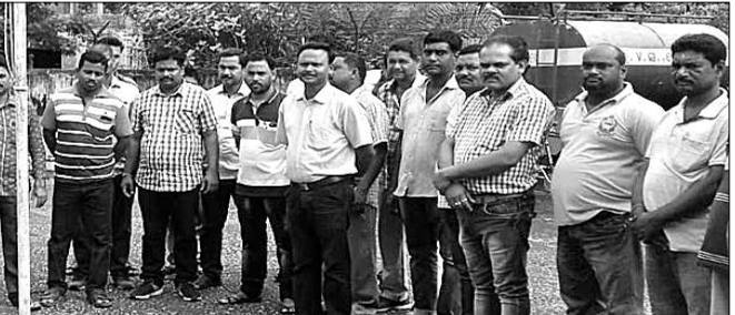
ରେଡ଼ାଖୋଲ ଏନ୍.ଏସି ପରିସରରେ ଶୁକ୍ରବାର ଅନୁଷ୍ଠିତ ସ୍ୱାସ୍ଥ୍ୟ ଶିବିରର ଦିବ୍ୟ ପାଳନ କାର୍ଯ୍ୟକ୍ରମରେ ଅଧ୍ୟକ୍ଷ, ଅଧ୍ୟକ୍ଷ, ଲଠି ଏବଂ କାର୍ଯ୍ୟକର୍ତ୍ତାମାନେ।