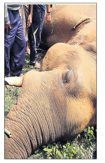
ଡେଙ୍ଗୁ ନେଲା ଜୀବନ