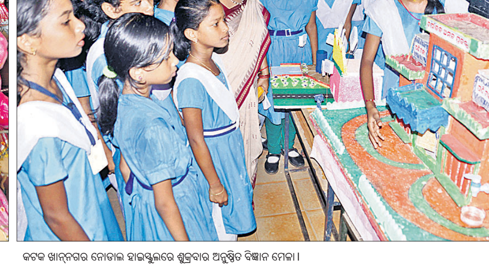
କଟକ ଖାନ୍ଦନଗର ନୋଡାଲ ହାଇସ୍କୁଲରେ ଶୁକ୍ରବାର ଅନୁଷ୍ଠିତ ବିଜ୍ଞାନ ମେଳା।