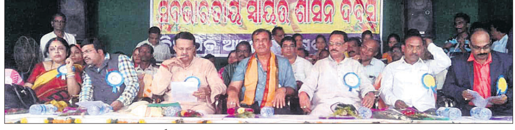
ସ୍ୱାୟତ୍ତ ଶାସନ ଦିବସ ଉତ୍ସବରେ ଏମ୍ପି ଭର୍ତ୍ତୃହରି ମହତାବ, ମନ୍ତ୍ରୀ ଅଶୋକ ପଣ୍ଡା, ବିଧାୟକ ପ୍ରଭାତ ତ୍ରିପାଠୀ ଓ ଅନ୍ୟମାନେ ଉପସ୍ଥିତ।