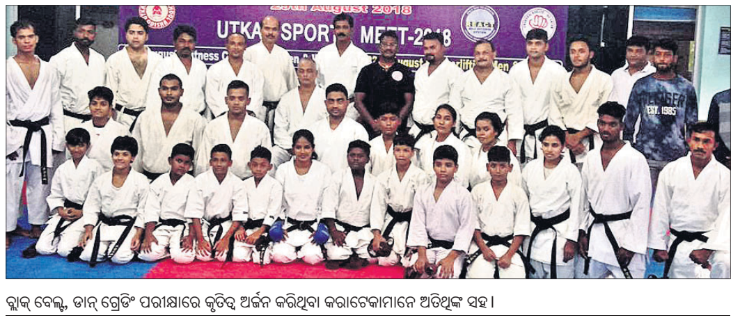
ଗୁଲ୍ ବେଲ୍, ଡାନ ଟ୍ରେଡିଂ ପରୀକ୍ଷାରେ କୃତ୍ତିମ ଅର୍ଜନ କରିଥିବା କରାଚେକାମାନେ ଅତିଥିକ ସହ।