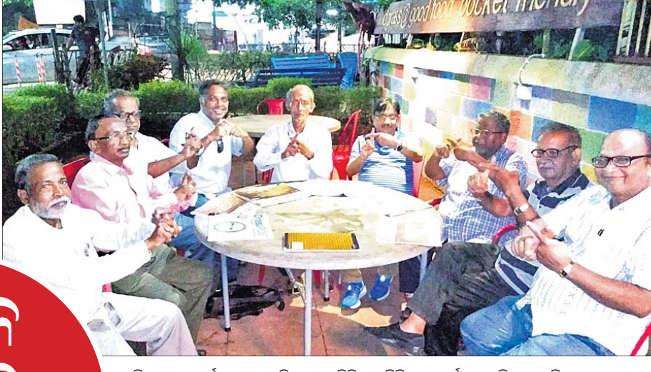
ଅଭିଯାନକୁ ସମର୍ଥନ କଣାଇଥିବା ପୁରୀର ସିନିୟର ସିନିଜେନ କର୍ମଚର ବରିଷ୍ଠ ନାଗରିକମାନେ।