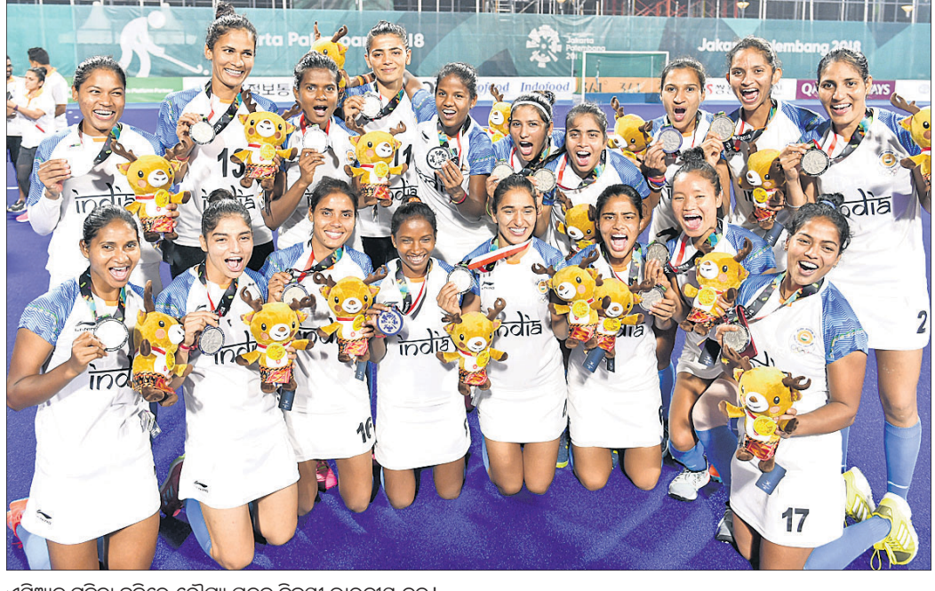
ଏସିଆନ୍ ମହିଳା ହକିରେ ରୌପ୍ୟ ପଦକ ବିଜୟୀ ଭାରତୀୟ ଦଳ।