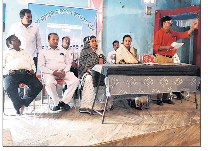
ଆଇନ ସଚେତନତା ଶିବିରରେ ଯୋଗଦେଇଥିବା ଅତିଥି।

ବାଙ୍କା ମହୋତ୍ସବ ୨୦୧୮ ନିମନ୍ତେ ବାଙ୍କା ବ୍ଲକ୍ କଳାପଥର ଧଳାପଥର ଉଚ୍ଚ ବିଦ୍ୟାଳୟ ପରିସରରେ ଶୁକ୍ରବାର ଜୋନସ୍ତରୀୟ ବିଭିନ୍ନ ପ୍ରତିଯୋଗିତା ଅନୁଷ୍ଠିତ ହୋଇଯାଇଛି। ଏଥିରେ ମୋଟ ୪୨ ପ୍ରତିଯୋଗୀ ପ୍ରବନ୍ଧ, ବକ୍ତୃତା, ଚିତ୍ରାଙ୍କନ ଓ କଣ୍ଠ ସଂଗୀତରେ ଭାଗ ନେଇଥିଲେ। ବିଚାରକ ଭାବେ ଗଣନାଥ ଦାସ,