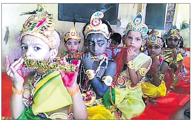
ବଡ଼: କୃଷ୍ଣ ବେଶରେ ପିଲାମାନେ ।