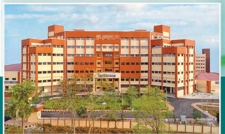
ଭୀମ ଭୋଇ ମେଡିକାଲ କଲେଜ ଏବଂ ହସ୍ପିଟାଲ, ବଲାଙ୍ଗୀର

ଆଗକୁ ଆହୁରି ୫ଟି ନୂଆ ସରକାରୀ ମେଡିକାଲ କଲେଜ ପ୍ରତିଷ୍ଠା ହେବ ଆମ ରାଜ୍ୟରେ ।