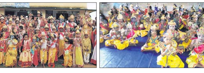
ଡେକିକୋଟ: ରାଧାକୃଷ୍ଣ ବେଶଧାରୀ ପିଲାମାନେ।