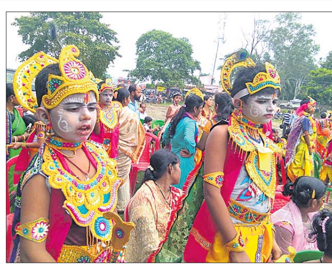
ବାସୁଦେବପୁର: କୃଷ୍ଣ ବେଶରେ ସଜିତ ଛାତ୍ର ।

ନବମୁକ୍ତି ପାଇଁ ଦସ୍ତଖତ ଅଭିଯାନ ଆରମ୍ଭ କରିଛନ୍ତି। ଏଥିରେ ଗୋରାମଦ କାରଦାର ବହୁସଂଖ୍ୟକ ସାମାଜିକ ବିଶ୍ୱକର୍ମୀ ସମ୍ମୁଖରେ ନିଶ୍ଚଳ ଗୋଷ୍ଠୀ ଗଠନ ହେବ।