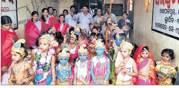
ବାହାନବା ଲୁକ ଗାଗେଶ୍ୱରପଦାଠାରେ ଥିବା ସରସ୍ୱତୀ ଶିଶୁ ମନ୍ଦିର ପରିସରରେ ଆୟୋଜିତ ଶ୍ରୀକୃଷ୍ଣ ବେଶ ପ୍ରତିଯୋଗିତାରେ ଭାଗନେଇଥିବା ଛାତ୍ରୀଛାତ୍ର।