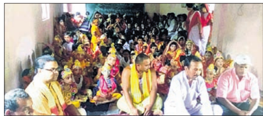
ଅଲିପୁର ସରସ୍ୱତୀ ମନ୍ଦିରରେ ଭଗବତ୍ ଆଲୋଚନା ଚାଲିଛି।

ପୁଷ୍ପାମ୍ବୁ ନବୀନ ପଟ୍ଟନାୟକ ଏହାକୁ ଉଦଘାଟନ କରିବେ। ପୁଷ୍ପାମ୍ବୁ ହେଲିକପ୍ଟର ଅବତରଣ ଲାଗି କଲେଜ ପରିସରରେ ହେଲିପ୍ୟାଡ ନିର୍ମାଣ କରାଯାଇଛି। କେନ୍ଦ୍ରମନ୍ତ୍ରୀ ସତ୍ୟ ପଥରେ ମେଡିକାଲ କଲେଜରେ ପହଞ୍ଚିବେ। ସପ୍ତମାସ ୧ ଘଣ୍ଟାର କାର୍ଯ୍ୟକ୍ରମ ମଧ୍ୟରେ ପୂର୍ବାହ୍ନ ସାଢ଼େ ୧୧ଟାରେ ଫକୀରମୋହନଙ୍କ ପ୍ରତିମୂର୍ତ୍ତି ଉଦଘାଟନ ଓ ପୁଷ୍ପାମ୍ବୁ ନବୀନ ପଟ୍ଟନାୟକ ଏହାକୁ ଉଦଘାଟନ କରିବେ।