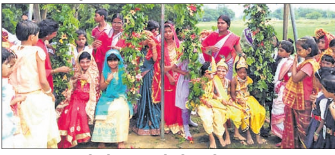
ବାଲେଶ୍ୱର ସରକାରୀ ଚିଆଖିଆ ସରସ୍ୱତୀ ଶିଶୁ ବିଦ୍ୟା ମନ୍ଦିରରେ ଜନ୍ମାଷ୍ଟମୀ ପାଳନ ଅବସରରେ ଶିଶୁମାନେ କୃଷ୍ଣ ବେଶରେ ସଜିତ ହୋଇ ବୋଲିବେ ସୁଲଭିତ।