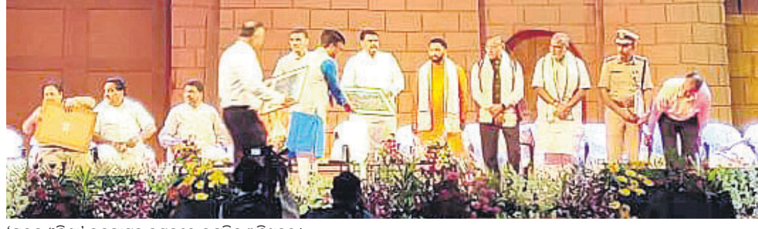
'ପରବ ଓଡ଼ିଶା' ଉଦ୍‌ଘାଟନ ଅବସରରେ ଉପସ୍ଥିତ ଅତିଥିବୃନ୍ଦ।

ଭୁବନେଶ୍ୱର, ୨।୯ (ବୁଧବାର) ସୁରତ ଓ ଗୁଜରାଟ ବିକାଶରେ ଓଡ଼ିଆ ଲୋକମାନଙ୍କର ଗୁରୁତ୍ୱପୂର୍ଣ୍ଣ ଭୂମିକା ରହିଛି। ସୁରତଠାରେ ବୁଲିଦିନିଆ ଓଡ଼ିଆ ପର୍ବ ଉଦ୍‌ଘାଟନ ଅବସରରେ ଗୁଜରାଟ ମୁଖ୍ୟମନ୍ତ୍ରୀ ବିଜୟ ରୁପାମା ଏହା କହିଛନ୍ତି। ଏହି ଅବସରରେ କେନ୍ଦ୍ରମନ୍ତ୍ରୀ ଧର୍ମେନ୍ଦ୍ର ପ୍ରଧାନ କହିଛନ୍ତି ଯେ, ଓଡ଼ିଆ ଓ ଗୁଜରାଟବାସୀଙ୍କ ମଧ୍ୟରେ ସାମାଜିକ, ସାଂସ୍କୃତିକ ଓ ରାଜନୈତିକ ସମ୍ପର୍କ ଅତି ନିବିଡ଼। ଓଡ଼ିଶାର କୋଶାଳରେ ପୂର୍ଯ୍ୟଙ୍କ ପ୍ରଥମ କିଶ ପଢୁଥିବାବେଳେ ଗୁଜରାଟର ମୋଧେରାରେ ଶେଷ କିଶ ପଢିଥାଏ। ଗୁଜରାଟର ଅର୍ଥନୀତି ପରିବର୍ତ୍ତନରେ ଓଡ଼ିଆଙ୍କ ପ୍ରମୁଖ ଭୂମିକା ରହିଛି। ଗୁଜରାଟ ଓ ଓଡ଼ିଶାର ଭାବନା ସମ୍ପର୍କରେ ଏହି ଓଡ଼ିଆ ପରବ ଏକ