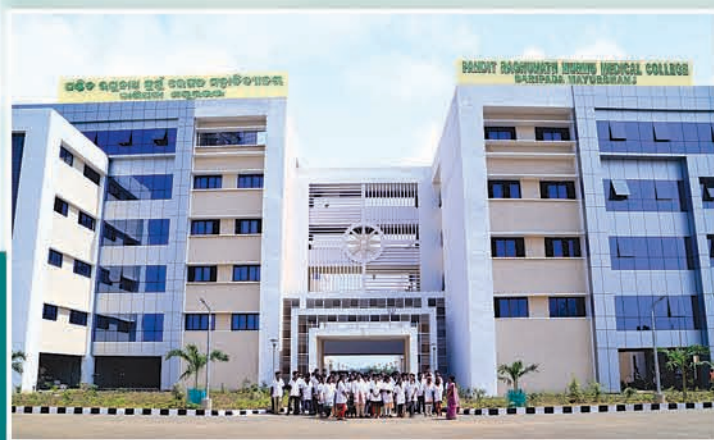
ପଣ୍ଡିତ ରଘୁନାଥ ମୁର୍ମୁ ମେଡିକାଲ କଲେଜ ଏବଂ ହସ୍ପିଟାଲ, ବାରିପଦା