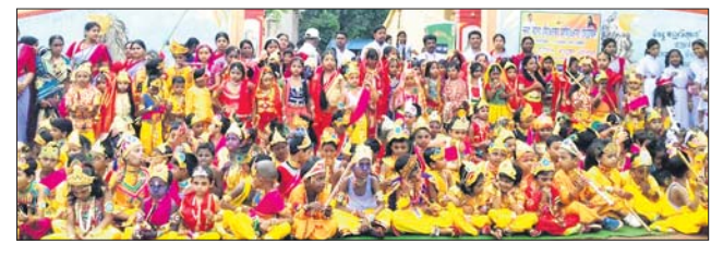
ବଡ଼ବିଲ୍ଲେ ଛାତ୍ରାଛାତ୍ର ରାଧାକୃଷ୍ଣ ବେଶରେ ସୁସଜ୍ଜିତ ହୋଇଛନ୍ତି।