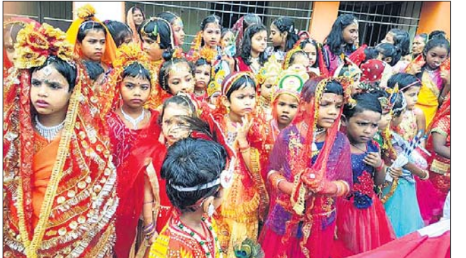
ଧାମନଗର: ଶିଶୁମନ୍ଦିର ଛାତ୍ରାଛାତ୍ରୀଙ୍କୁ ଗୋପୀ ଗୋପାଳ ବେଶ ।

ଅତିଥି ଭାବେ ଯୋଗ ଦେଇଥିଲେ । ବିକ୍ଟି ବ୍ଲକ୍ ନିମନ୍ତାସ୍ଥିତ ବିବେକାନନ୍ଦ ଶିଶୁ ମନ୍ଦିରରେ ରବିବାର ଜନ୍ମାଷ୍ଟମୀ ଅବସରରେ ଛାତ୍ରାଛାତ୍ରୀଙ୍କ ମଧ୍ୟରେ ଶ୍ରୀକୃଷ୍ଣ ବେଶ ପ୍ରତିଯୋଗିତା ସାଙ୍ଗକୁ ପ୍ରଧାନ ଆଚାର୍ଯ୍ୟ ଭିତ୍ତିଗ୍ରୀ କରଶର୍ମାଙ୍କ ତତ୍ତ୍ୱାବଧାନରେ ବହୁତା ପ୍ରତିଯୋଗିତା ଅନୁଷ୍ଠିତ ହୋଇଥିଲା ।