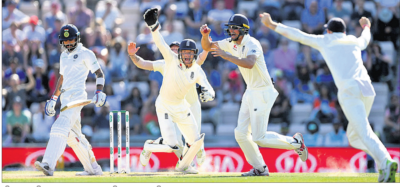
ବିରାଟ କୋହଲିଙ୍କ ଉଇକେଟ୍ ପତନ ପରେ ଉଇଲିୟମ୍ ଇଂଲଣ୍ଡ ଖେଳାଳି ।

ଅଧିନାୟକ ବିରାଟ କୋହଲି ଓ ଅଜିଙ୍କ୍ୟ ରାହାନେଙ୍କ ଶତକାନ୍ତ ଭାଗାଦାରି ପର୍ଯ୍ୟାପ୍ତ ହେଲାନି। ଅନ୍ୟବ୍ୟାଟ୍ମ୍ୟାନଙ୍କ ବିଫଳତା ଯୋଗୁ ଭାରତ ଦ୍ୱିତୀୟ ଇନିଂସରେ ମାତ୍ର ୧୮୪ ରନ କରିବାକୁ ସକ୍ଷମ ହେଲା। ଫଳରେ ଇଂଲଣ୍ଡ ଏଠାରେ ଅନୁକୃତ ଚତୁର୍ଥ କ୍ରିକେଟ ଚେଷ୍ଟାରେ ୬୦ ରନରେ ବିଜୟୀ ହେବା ସହ ୫ ମ୍ୟାଚ ବିଶିଷ୍ଟ ସିରିଜକୁ ଆଗୁଆ ଜିତିନେଇଛି।