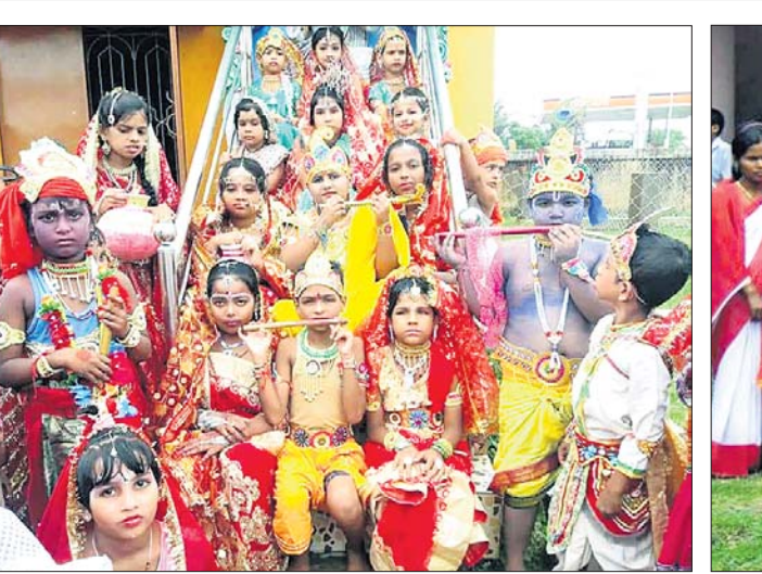
ତିହଡ଼ି: ରାଧାକୃଷ୍ଣ ବେଶରେ ଛାତ୍ରାଛାତ୍ରୀ ।