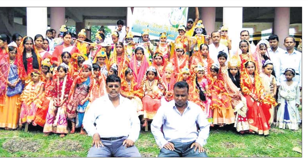
ପଦ୍ମପୁର: ରାଜ୍ୟରୋପାଖରୀ ସରକାରୀ ଶିଶୁ ମନ୍ଦିରରେ ଅନୁଷ୍ଠିତ ପ୍ରତିଯୋଗିତାରେ ଅଂଶଗ୍ରହଣ କରିଥିବା ରାଧା ଓ କୃଷ୍ଣ ବେଶଧାରୀ ଛାତ୍ରାଛାତ୍ରୀ ।