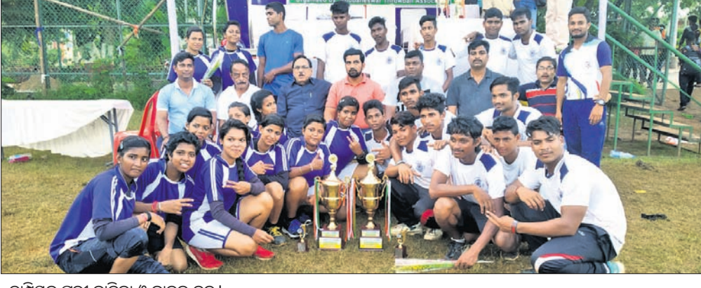
ଚାମ୍ପିୟନ ପୁରୀ ବାଳିକା ଓ ବାଳକ ଦଳ ।

କଟକ ଅଫିସ୍, ୨୯: ବାରବାଟୀ ଷ୍ଟାଡ଼ିୟମରେ ଚାଲିଥିବା ଫାଓ ପ୍ରଥମ ଡିଭିଜନ ଲିଗ୍ରେ ରବିବାର ୨ଟି ମ୍ୟାଚ୍ ଖେଳାଯାଇଥିଲା। ଗୋଟିଏ ମ୍ୟାଚ୍ରେ ଯାଇ ବିଜୟୀ ହୋଇଥିବା ବେଳେ ଅନ୍ୟଏକ ମ୍ୟାଚ୍ ଅମାମାସିଂତ ରହିଛି।