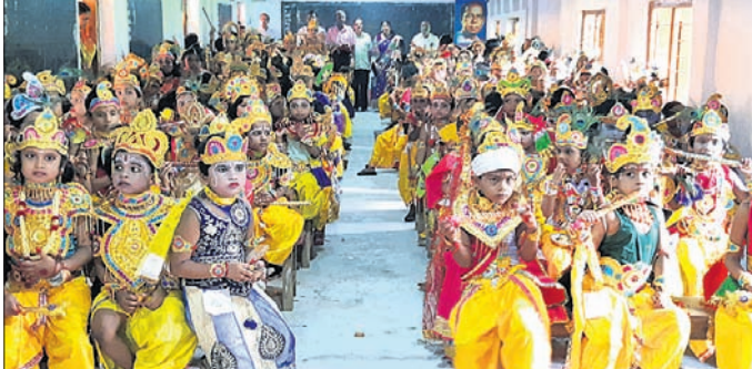
ମାଣିକା ସରସ୍ୱତୀ ଶିଶୁ ବିଦ୍ୟାମନ୍ଦିରରେ ଜନ୍ମାଷ୍ଟମୀ ପାଳନ ଅବସରରେ ଶିଶୁମାନେ ରାଧାକୃଷ୍ଣ ବେଶରେ ସଜିତ ହୋଇଛନ୍ତି।