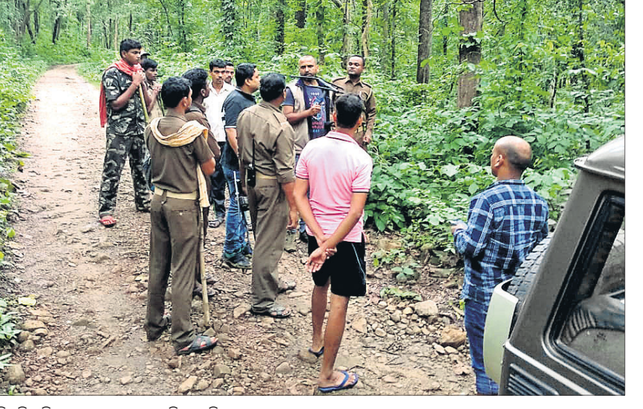
ବିପ୍ରତିହ ନିକଟସ୍ଥ ଜଙ୍ଗଲରେ ବନ ବିଭାଗ ଟିମ୍।

କଲ୍ୟାଣ, ୨୯(ଡି.ଏନ.ଏ.) ବାଘ ବଂଶ ବୃଦ୍ଧି ପାଇଁ ମଧ୍ୟପ୍ରଦେଶରୁ ଅଣାଯାଇ ସାତକୋଶିଆ ଜଙ୍ଗଲରେ ଛତାଯାଇଥିବା ବାୟୁଶୀ 'ସୁନ୍ଦରୀ' ଏବେ ଧଣ୍ଡାତୋପା ରେଞ୍ଜରେ ଆତଙ୍କିତ ହୋଇଛି।