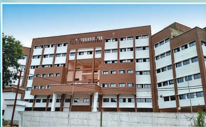
ଶହୀଦ ଲକ୍ଷ୍ମଣ ନାୟକ ମେଡିକାଲ କଲେଜ ଏବଂ ହସ୍ପିଟାଲ, କୋରାପୁଟ

ଆମ ରାଜ୍ୟର ଡାକ୍ତରୀ ଶିକ୍ଷା ଏବଂ ସ୍ୱାସ୍ଥ୍ୟ ସେବାକୁ ଏକ ନୂଆ ଦିଶା ଦେଇଛନ୍ତି ଆମ ପ୍ରିୟ ମୁଖ୍ୟମନ୍ତ୍ରୀ ଶ୍ରୀଯୁକ୍ତ ନବୀନ ପଟ୍ଟନାୟକ ।