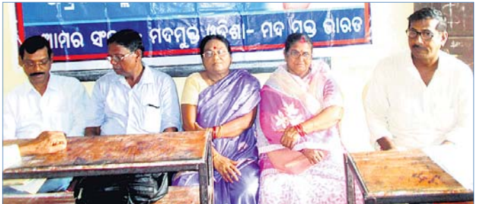
ବୈଠକରେ ଭବିଷ୍ୟତ ଅଭିଯାନ ।

ରାଜ୍ୟ ଆଦାୟ ନାମରେ ରାଜ୍ୟ ସରକାର ଗୋଟିଏ ପରେ ଗୋଟିଏ ନବମୁକ୍ତି ପାଇଁ ଦସ୍ତଖତ ଅଭିଯାନ ଆରମ୍ଭ କରିଛନ୍ତି। ଏଥିରେ ଗୋରାମଦ କାରଦାର ବହୁସଂଖ୍ୟକ ସାମାଜିକ ବିଶ୍ୱକର୍ମୀ ସମ୍ମୁଖରେ ନିଶ୍ଚଳ ଗୋଷ୍ଠୀ ଗଠନ ହେବ।