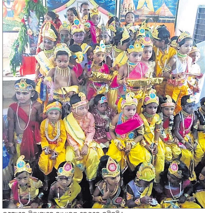
ଚମ୍ପୁଆରେ ପିଲାମାନେ ରାଧାକୃଷ୍ଣ ବେଶରେ ବସିଛନ୍ତି।