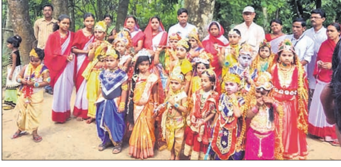
ବାଲିଆପାଳ ଲୁକ ଖପରାପଦା ସରସ୍ୱତୀ ଶିଶୁମନ୍ଦିରରେ ଛାତ୍ରୀଛାତ୍ରମାନେ ଶ୍ରୀକୃଷ୍ଣ, ବଳରାମ, କନ୍ୟା, ହନୁମତ୍ ଓ ଦେବୀ ଆଦି ବେଶ ଧାରଣ କରି ବକାର ପରିଚୟ କରୁଛନ୍ତି।