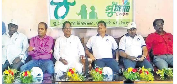
ବିକ୍ଟି ମୁଦ୍ ବାହିନୀ ପକ୍ଷରୁ ଆୟୋଜିତ ଉତ୍ସବରେ ମଞ୍ଚାସୀନ ଅଭିଯୋଗୀ ।