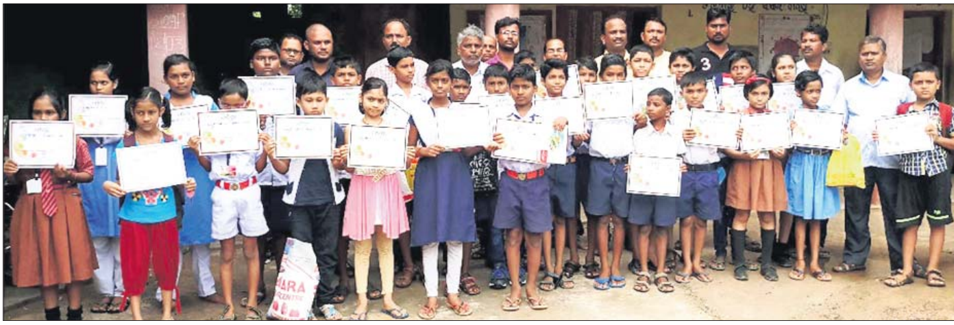
ଅଭିଯାନର ଗହଣରେ ଛାତ୍ରାଛାତ୍ରୀ ।

ଭଦ୍ରକ ଅଫିସ୍, ୨୧: ଜନଶୃଙ୍ଖଳା ଅବସରରେ ବିଶୁଦ୍ଧି ପରିଷଦ ପକ୍ଷରୁ ପ୍ରତିଷ୍ଠା ଦିବସ ଏବଂ ସଭ୍ୟତା ଦିବସ ପାଳନ କରାଯାଇଥିଲା।