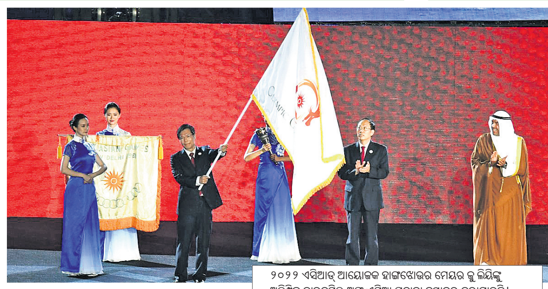
୨୦୨୨ ଏସିଆନ୍ ଆୟୋଜକ ହାଙ୍ଗଜୋଉର ମେୟର ଲୁ ଲିୟିଙ୍କୁ ଅଲିମ୍ପିକ୍ କାର୍ଯ୍ୟକ୍ରମ ଅଫ ଏସିଆ ପତାକା ହସ୍ତାନ୍ତର କରାଯାଉଛି ।