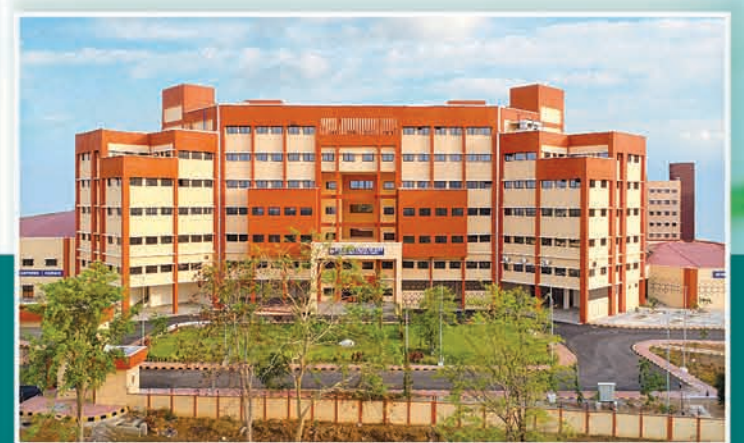
ଭୀମ ଭୋଇ ମେଡିକାଲ କଲେଜ ଏବଂ ହସ୍ପିଟାଲ, ବଲାଙ୍ଗୀର

ଆଗକୁ ଆହୁରି ୫ଟି ନୂଆ ସରକାରୀ ମେଡିକାଲ କଲେଜ ପ୍ରତିଷ୍ଠା ହେବ ଆମ ରାଜ୍ୟରେ ।