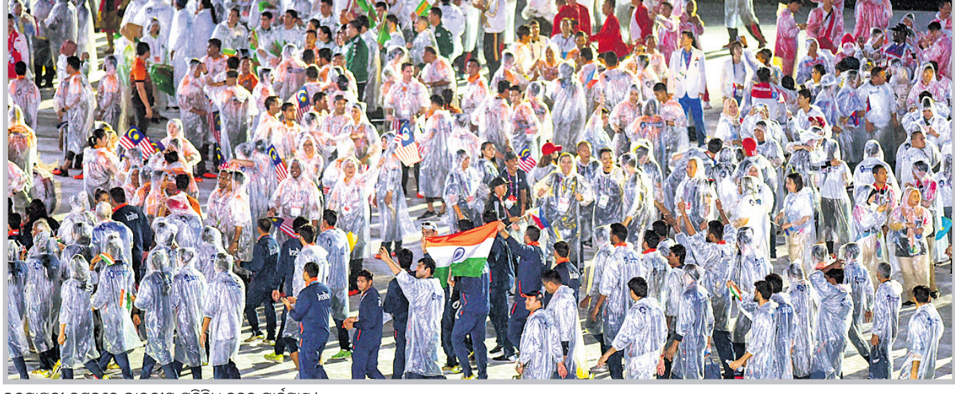
ଉଦ୍‌ଘାଟନୀ ଉତ୍ସବରେ ଭାରତୀୟ ପ୍ରତିନିଧି ଦଳର ମାର୍ଚ୍ଚପାଷ୍ଟ ।