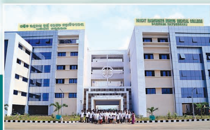
ପଣ୍ଡିତ ରଘୁନାଥ ମୁର୍ମୁ ମେଡିକାଲ କଲେଜ ଏବଂ ହସ୍ପିଟାଲ, ବାରିପଦା