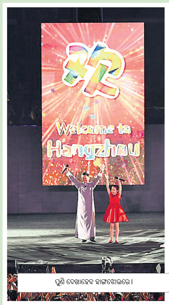
ପୁଣି ଦେଖାହେବ ହାଙ୍ଗଜୋଉରେ ।