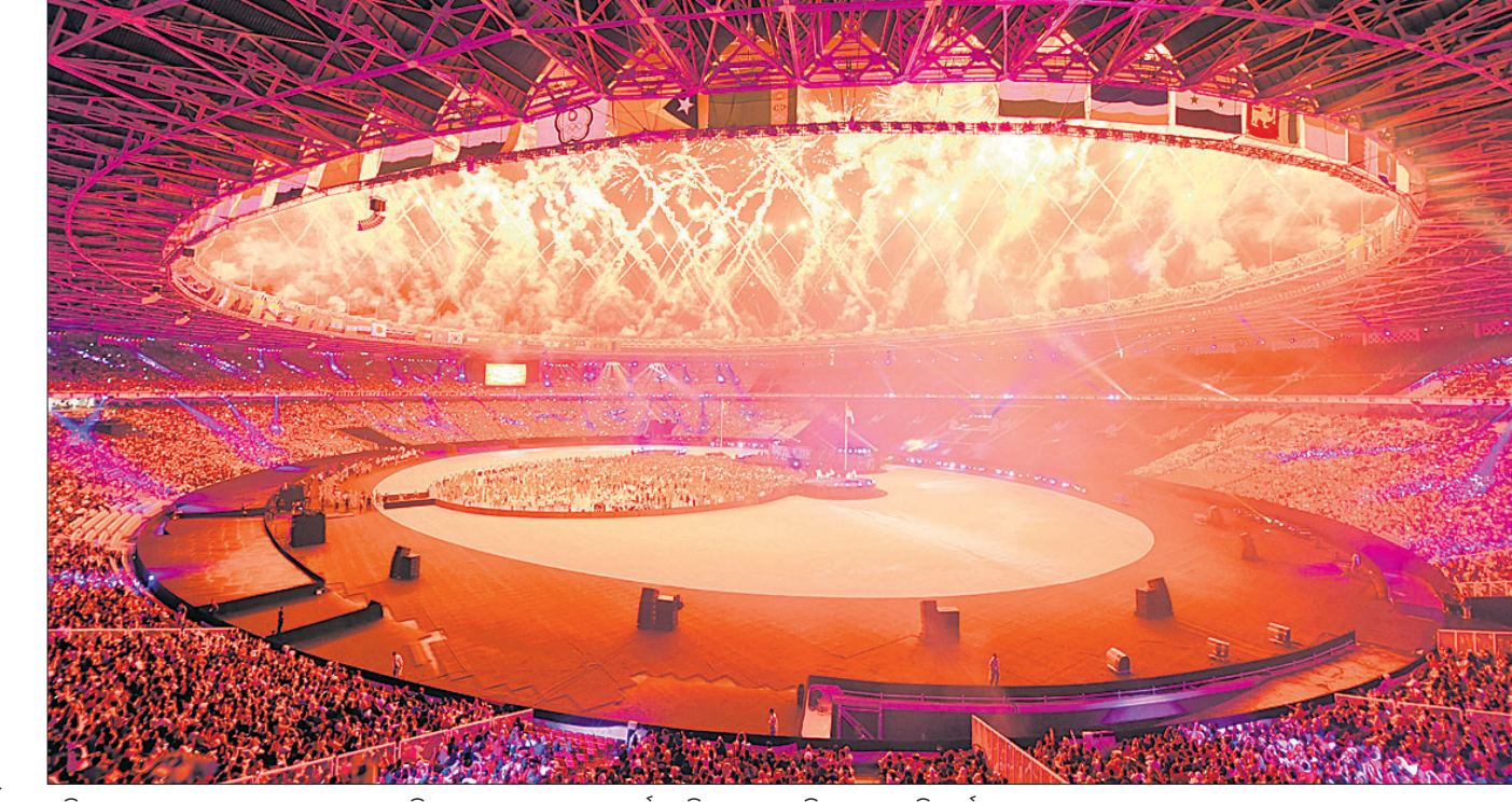
ଏସିଆନ ଗେମ୍ସ ଉଦ୍‌ଘାଟନ ଅବସରରେ ରବିବାର ଗେଲୋରା ବୁକ୍ କାର୍ନୋ ସ୍ଵାଭିଯମରେ ଅନୁଷ୍ଠିତ ଆତ୍ମସବାଜି କାର୍ଯ୍ୟକ୍ରମ।