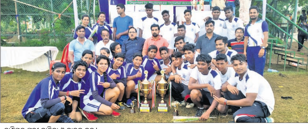
ଗାମ୍ଭୀରନ ପୁରୀ ବାଳିକା ଓ ବାଳକ ଦଳ ।

କଟକ ଅଫିସ୍, ୨୯: ବାରବାଟୀ ଷ୍ଟାଡ଼ିୟମରେ ଚାଲିଥିବା ଫାଓ ପ୍ରଥମ ଡିଭିଜନ ଲିଗ୍ରେ ରବିବାର ୨ଟି ମ୍ୟାଚ୍ ଖେଳାଯାଇଥିଲା।