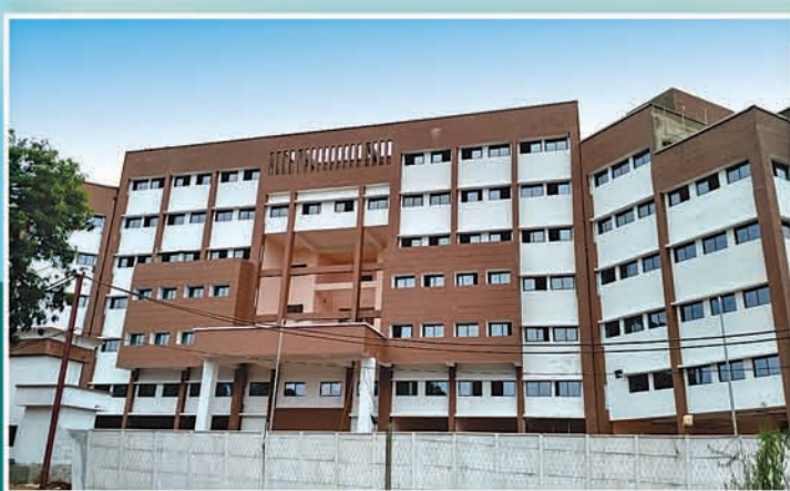
ଶହୀଦ ଲକ୍ଷ୍ମଣ ନାୟକ ମେଡିକାଲ କଲେଜ ଏବଂ ହସ୍ପିଟାଲ, କୋରାପୁଟ

ଆମ ରାଜ୍ୟର ଡାକ୍ତରୀ ଶିକ୍ଷା ଏବଂ ସ୍ୱାସ୍ଥ୍ୟ ସେବାକୁ ଏକ ନୂଆ ଦିଶା ଦେଇଛନ୍ତି ଆମ ପ୍ରିୟ ମୁଖ୍ୟମନ୍ତ୍ରୀ ଶ୍ରୀଯୁକ୍ତ ନବୀନ ପଟ୍ଟନାୟକ ।