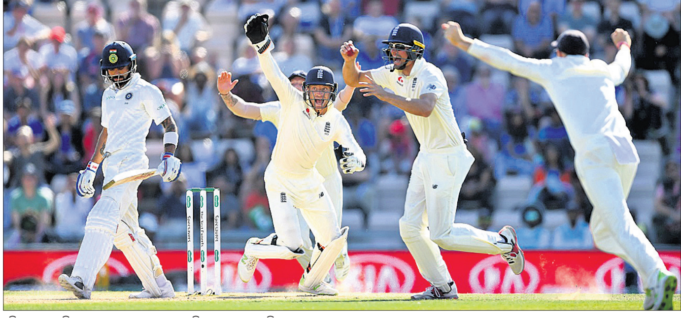
ବିରାଟ କୋହଲିଙ୍କ ଉଇକେଟ୍ ପତନ ପରେ ଉଇକେଟ୍ ଇଂଲଣ୍ଡ ଖେଳାଳି ।

ଅଧିନାୟକ ବିରାଟ କୋହଲି ଓ ଅଜିଙ୍କ୍ୟ ରାହାନେଙ୍କ ଶତକାୟ ଭାଗାଦାରି ପର୍ଯ୍ୟାପ୍ତ ହେଇନା। ଅନ୍ୟବ୍ୟାଟ୍ମ୍ୟାନଙ୍କ ବିଫଳତା ଯୋଗୁ ଭାରତ ଦ୍ୱିତୀୟ ଇନିଂସରେ ମାତ୍ର ୧୮୪ ରନ କରିବାକୁ ସକ୍ଷମ ହେଲା।