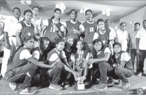
ଅତିଥିମାନଙ୍କ ରହଣରେ ଚାମ୍ପିୟନ୍ ପ୍ରତି ସହ ଉଭୟ ବାଲିକା ଓ ବାଲକ ବର୍ଗର ଖେଳାଳିମାନେ।