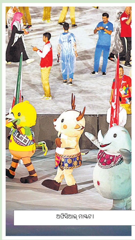
ଅପିସିଆନ୍ ମାସ୍କଟ ।