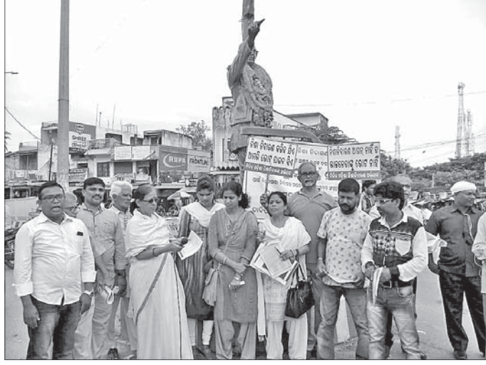
ମିଳିତ ଓଡ଼ିଶା ନିଶା ନିବାରଣ ଅଭିଯାନ(ମୋନା) ପକ୍ଷରୁ ବିକ୍ରମଚନ୍ଦ୍ରାକର ଛକରେ ପ୍ରଥମଥର ପାଇଁ ଦାବି କରାଯିବ।

ମିଳିତ ଓଡ଼ିଶା ନିଶା ନିବାରଣ ଅଭିଯାନ(ମୋନା) ପକ୍ଷରୁ ରବିବାର ମଦପୁତ୍ରି ଓଡ଼ିଶା ପାଇଁ ଦସ୍ତଖତ ଅଭିଯାନ ହିଞ୍ଜିଳିକାଟୁରୁ ଆରମ୍ଭ ହୋଇଛି।