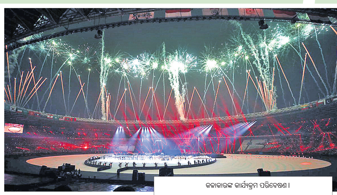
କଳାକାରଙ୍କ କାର୍ଯ୍ୟକ୍ରମ ପରିବେଷଣ ।