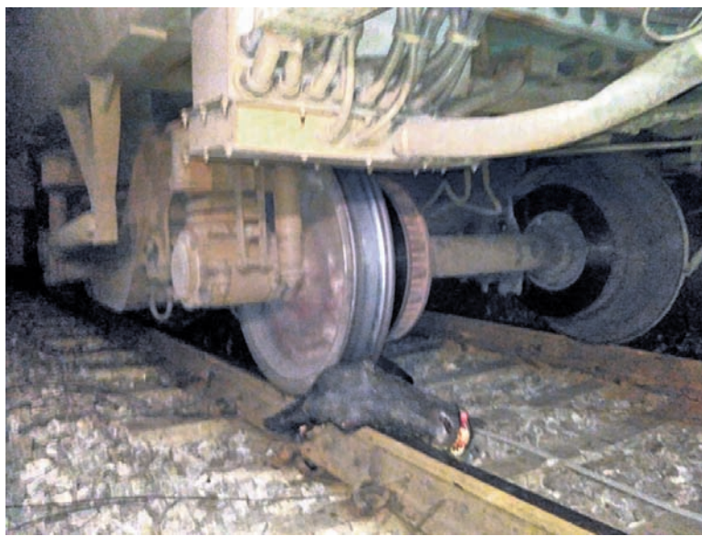
ଲଞ୍ଜିନ ଚକା ତଳେ ଲାଗିଥିବା ମଇଁଷି ପୁଣି।

ଟ୍ରେନ୍‌ଟି ପ୍ରାୟ ୩୦୦୦ ଗଜ୍ଜି ସମୟ ଫାଟକରେ ଅଟକି ରହିବାକୁ ଯାତ୍ରୀମାନେ ନାହିଁ ନ ଥିବା ଅସୁବିଧାର ସମ୍ମୁଖୀନ ହୋଇଥିଲେ। ଉଭୟ ପଟେ ଶହ ଶହ ଗାଡ଼ିମୋଟର ମଧ୍ୟ