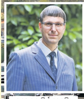
ପ୍ରଫେସର ଡିକ୍ ହେଲବିଂ