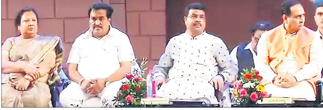
'ପରବ ଓଡ଼ିଶା' ଉଦ୍‌ଘାଟନ ଉତ୍ସବରେ ଉପସ୍ଥିତ ଅତିଥିମାନେ।

ଭୁବନେଶ୍ୱର, ୨।୯ (ବୁଧବେଳା) ରୁପାମା ଓ ଗୁଜରାଟ ବିକାଶରେ ଓଡ଼ିଆ ଲୋକମାନଙ୍କର ଗୁରୁତ୍ୱପୂର୍ଣ୍ଣ ଭୂମିକା ରହିଛି। ପୁରତାରେ ଗୁଜରାଟୀ ଓଡ଼ିଆ ପର୍ବ ଉଦ୍‌ଘାଟନ ଅବସରରେ ଗୁଜରାଟ ପ୍ରଧାନମନ୍ତ୍ରୀ ବିଜୟ ରୁପାମା ଏହା କହିଛନ୍ତି। ଏହି ଅବସରରେ କେନ୍ଦ୍ରମନ୍ତ୍ରୀ ଧର୍ମେନ୍ଦ୍ର ପ୍ରଧାନ କହିଛନ୍ତି ଯେ, ଓଡ଼ିଆ ଓ ଗୁଜରାଟୀଙ୍କ ମଧ୍ୟରେ ସାମାଜିକ, ସାଂସ୍କୃତିକ ଓ ରାଜନୈତିକ ସମ୍ପର୍କ ଅତି ନିବିଡ଼। ଓଡ଼ିଶାର କୋଶାଳରେ ପୂର୍ଣ୍ଣ ପ୍ରଥମ କିରଣ ପଞ୍ଚୁଆବେଳେ ଗୁଜରାଟର ମୋଧେରାରେ ଶେଷ କିରଣ ପଡ଼ିଥାଏ। ଗୁଜରାଟର ଅର୍ଥନୀତି ପରିବର୍ତ୍ତନରେ ଓଡ଼ିଆଙ୍କ ପ୍ରମୁଖ ଭୂମିକା ରହିଛି। ଗୁଜରାଟ ଓ ଓଡ଼ିଶାର ଭାବାବେଶ ସମ୍ପର୍କରେ ଏହି ଓଡ଼ିଆ ପରବ ଏକ ଆବେଦନ ବାଣୀ ବନ୍ଧନ କରୁଛି। ପୁରତାରେ ଏବେ ଓଡ଼ିଆ ସାଂସ୍କୃତିକ, ପରମ୍ପରା, ଜଗନ୍ନାଥ