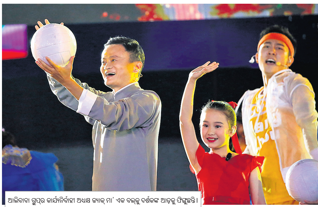
ଆଲିବାବା ଗ୍ରୁପର କାର୍ଯ୍ୟନିର୍ବାହୀ ଅଧ୍ୟକ୍ଷ ଜ୍ୟାକ୍ ମା' ଏକ ବଲ୍‌କୁ ଦର୍ଶକଙ୍କ ଆଡ଼କୁ ଫିଙ୍ଗିଛନ୍ତି ।