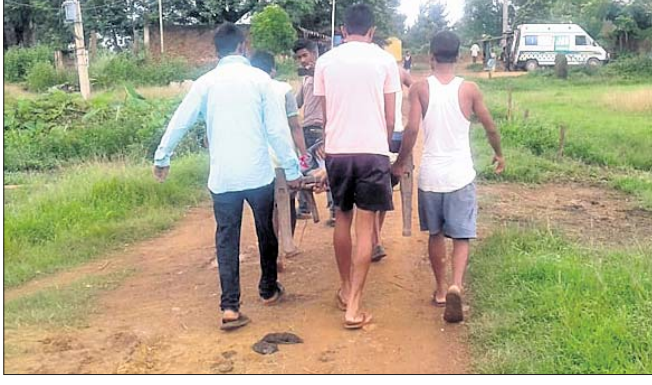
ରୋଗୀଙ୍କୁ ଖଟିଆରେ ବୁହାଯାଇଛି।