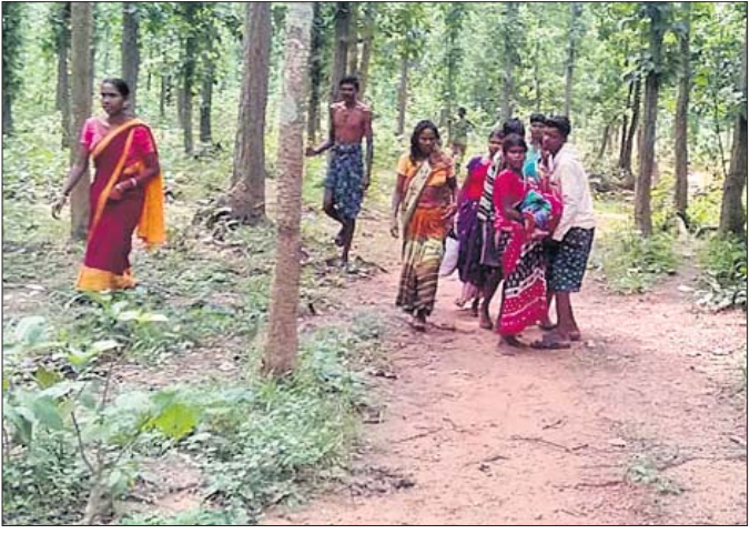
ତପସ୍ଵିନୀଙ୍କୁ ହାତରେ ଟେକି ନିଆଯାଇଛି।

ରାସ୍ତା ଦୁର୍ଗମତା ଗାଁରେ ପହଞ୍ଚି ପାରିଲାନି ଆତ୍ମଲୀଳା। ଜଣେ ପ୍ରସୂତିକ୍ରମ କେତେକ ମହିଳା ମିଶ୍ରି ହାତରେ ଧରି ୨ କି.ମି ରାସ୍ତା ପାରକରି ଆତ୍ମଲୀଳା ପାଖକୁ ଆଣିଥିଲେ। ସେଠାରୁ ଆତ୍ମଲୀଳାକୁ ପ୍ରସୂତିକ୍ରମ ଡାକ୍ତରଖାନାକୁ ନିଆଯାଇଥିଲା। ମାତ୍ର ଠିକ୍ ସମୟରେ ଚିକିତ୍ସା ପ୍ରତିଧା ନ ମିଳିବାରୁ ପ୍ରସୂତି ଜଣଙ୍କ ଏକ ମୃତ ପୁତ୍ରସନ୍ତାନ ଜନ୍ମ ଦେଇଥିବା ଅଭିଯୋଗ ହୋଇଛି। ସୁରକ୍ଷିତ ମାତୃତ୍ୱ ଓ ନିରାପଦ ପ୍ରସବ ପାଇଁ ଉଭୟ କେନ୍ଦ୍ର ଓ ରାଜ୍ୟ ସରକାର ଅନେକ ଯୋଜନା ପ୍ରଣୟନ କରିଛନ୍ତି। ଅର୍ଥ ବେଢ଼ ବରାଦ ହେଉଛି ତଥାପି କେନ୍ଦୁଝର ଜିଲା ପାଟଣା ବ୍ଲକ୍‌ରେ ସବୁ ଯୋଜନା ବିଫଳ ହେଉଛି। ପାଟଣା ବ୍ଲକ୍‌ରେ ଗମନାଗମନ ଅସୁବିଧା, ଠିକ୍ ସମୟରେ ଆତ୍ମଲୀଳା ନ ପହଞ୍ଚିବା ବିଭାଗୀୟ କର୍ମଚାରୀଙ୍କ ଅବହେଳା ପାଇଁ ପ୍ରସୂତି ଖୋଲା ଆକାଶ ତଳେ, ଅଟୋ ଅବା ଆତ୍ମଲୀଳା ଭିତରେ ଅସହାୟ ଅସୁରକ୍ଷିତ ଭାବେ ପ୍ରସବ ହେଉଥିବା