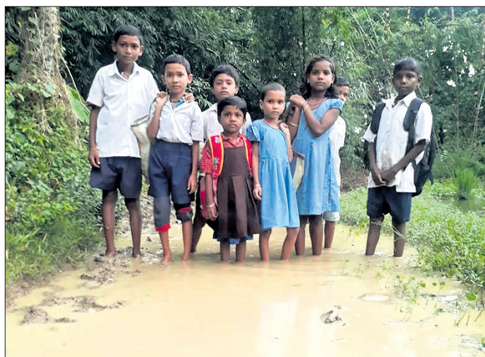
ପିଲା ମାନେ ଦୁର୍ଗମ ରାସ୍ତାରେ ବିଦ୍ୟାଳୟକୁ ଯାଉଛନ୍ତି ।

ବାଲେଶ୍ୱର ଜିଲ୍ଲା ଖଇରା ବ୍ଲକ୍ ସାବୁରା ପଞ୍ଚାୟତ ଅଧୀନ ଏକ ଅବହେଳିତ ଗାଁ ମାହାରାସାହି । ଗାଁକୁ ଯାତାୟତ ଲାଗି ସବୁଦିନିଆ ରାସ୍ତା ନ ଥିବାରୁ ବିକାଶଧାରୀ ଏଠି ଅପହଞ୍ଚିତ ହୋଇ ରହିଛି । ଯେଉଁ ରାସ୍ତା ଅଛି , ସେଥିରେ ମୁଠେ ମାଟି କିମ୍ବା ନାଲି ଗୋଡ଼ି ପତୁ ନ ଥିବାରୁ ବର୍ଷାଦିନେ ସ୍ଥାନୀୟ ବାସିନ୍ଦା ଯାତାୟତ କରି ନ ପାରି ଅକଥନୀୟ ଦୁର୍ଭିକ୍ଷା ସମ୍ମୁଖୀନ ହେଉଛନ୍ତି । ରାସ୍ତା ସମସ୍ୟାର ପ୍ରତିକାର ଲାଗି ଗ୍ରାମବାସୀ ବାରମ୍ବାର ପ୍ରଶାସନକୁ ଅବଗତ କରାଇ ନିରାଶ ହୋଇଥିବା କହିଛନ୍ତି । ତୁରନ୍ତ ରାସ୍ତା ନିର୍ମାଣ କରା ନ ଗଲେ ସେମାନେ ରାସ୍ତାକୁ ଓହ୍ଲାଇ ଶୋକର ଛାୟା ଖେଳିଯାଉଛି ।