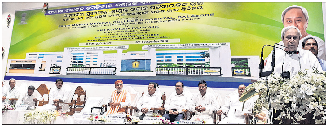
ଉଦ୍‌ଘାଟନ ସମାରୋହରେ ମୁଖ୍ୟମନ୍ତ୍ରୀ ନବୀନ ପଟ୍ଟନାୟକ ଉଦ୍‌ଘୋଷଣା କରୁଛନ୍ତି।