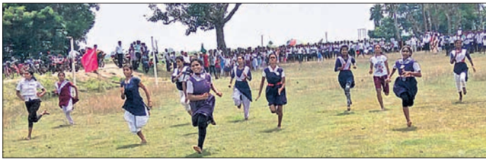
ପିଲାମାନଙ୍କ ମଧ୍ୟରେ ଦୌଡ଼ ପ୍ରତିଯୋଗିତା ।