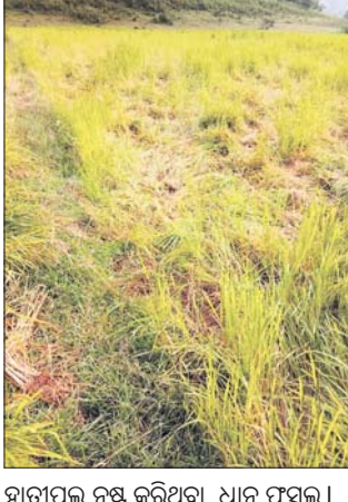
ହାତୀପଲ ନଷ୍ଟ କରିଥିବା ଧାନ ଫସଲ।

ଚଞ୍ଚୁଆ ଅନ୍ତର୍ଗତ ବାମେବାରୀ ଏବଂ ବାଲିବନ୍ଧ ଫରେଷ୍ଟ ଅଞ୍ଚଳରେ ରହିଥିବା ଜଙ୍ଗଲ ପାର୍ଶ୍ଵବର୍ତ୍ତୀ ଗ୍ରାମ ଗୁଡ଼ିକରେ ହାତୀପଲଙ୍କ ଦୌରାନ୍ତ୍ୟ ଲାଗି ରହିଛି। ଫଳରେ ଗଣ୍ୟ ଅତିଷ୍ଠ ହୋଇ ଗଲେଣି। ଖରିଫ ଚାଷକୁ ହାତୀପଲ ନଷ୍ଟ କରୁଛନ୍ତି। ଧାନ ଫସଲ ଆରମ୍ଭରୁ ହିଁ ହାତୀପଲ ଖମାର ଗାଁର ଗଣ୍ୟ କ୍ଷେତରେ ପଶି ନଷ୍ଟ କରିଛନ୍ତି। ହାତୀ ଘଉଡ଼ାଇବା ପାଇଁ ବନ କର୍ମଚାରୀ ନ ପହଞ୍ଚିବା, ଜଙ୍ଗଲ ପାର୍ଶ୍ଵବର୍ତ୍ତୀ ଗ୍ରାମ ଗୁଡ଼ିକୁ ଚର୍ଚ୍ଚ, ବାଣ ଯୋଗାଯାଉ ନ ଥିବା ଅଭିଯୋଗ ହେଉଛି। ଏ ନେଇ ଜଙ୍ଗଲ ପାର୍ଶ୍ଵବର୍ତ୍ତୀ ଗ୍ରାମ ଜୟପୁର, ନାରପାଣି, ହାତୀପଲ, ତିପିଆ, ବାମନଡ଼ିଆ, କାଳିଆପାଳ, ବସନ୍ତପୁର,