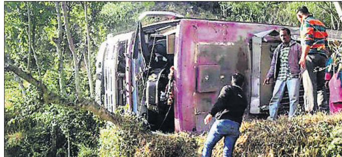
ଖାତକୁ ଖସିପଡ଼ିଥିବା ବସ୍।