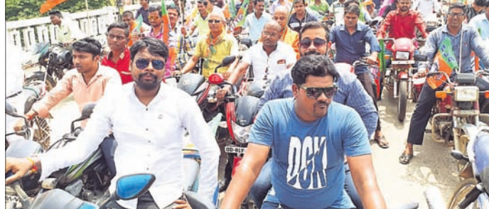
କେନ୍ଦ୍ରମନ୍ତ୍ରୀଙ୍କୁ ସ୍ମାରକ ବାଇକ୍ ଶୋଭାଯାତ୍ରା।

ଲୋକାର୍ପଣ ସମାରୋହରେ କେନ୍ଦ୍ରମନ୍ତ୍ରୀ ତୃତୀୟ ଦିନେ ମଞ୍ଚାସୀନ ହୋଇଥିଲେ। ଭାଙ୍ଗିଯାଇଥିବା କେନ୍ଦ୍ରମନ୍ତ୍ରୀଙ୍କୁ ସମ୍ମାନ ଜୁମାର ତୃତୀୟ ଦିନେ ଆସି ବାଲେଶ୍ୱରରେ ପହଞ୍ଚିବା ପରେ ଭାଙ୍ଗିଯାଇଥିଲା।