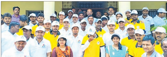
ବିଭିନ୍ନ କାର୍ଯ୍ୟକ୍ରମ ଅବସରରେ ବିଜୁ ଯୁବବାହିନୀ କର୍ମଚାରୀ।

ସିପୁଲିଆ, ୩୧ (ଡି.ଏନ.ଏ.) ବିଜୁ ଯୁବ ବାହିନୀ ପକ୍ଷରୁ ପୋଷାକ ବିତରଣ ଓ ବୃକ୍ଷରୋପଣ ଅବିବାର ସିପୁଲିଆ ରୁକ୍ଷ ପରିସରରେ ଅନୁଷ୍ଠିତ ହେଉଥିଲା।