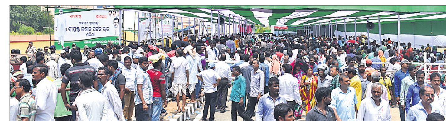
ମେଡିକାଲ କଲେଜ ଆଗରେ ଲାଗିଥିବା ପ୍ରୋଜେକ୍ଟର ସାମାନ୍ତର ଲୋକଙ୍କ ଗହଣ।