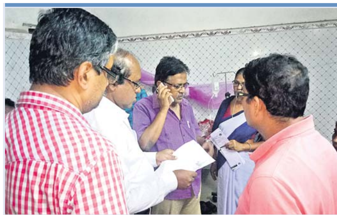
ଅଭିଯୋଗ ହେବା ପରେ ସିଡିଏମଠୁ, ଏଡିଏମଠୁ ତେଜୁ ଖୁବ୍ରେ ପରିଦର୍ଶନ କରିଛନ୍ତି। ■ ନିରାକରଣ ପାଇଁ ଜିଲାପାଳଙ୍କୁ ଭେଟିଲେ ପ୍ରତିନିଧି ଦଳ ■ ଜିଲା ସାମ୍ବଲ ବିଭାଗର ନୀରବତା ନେଇ ଉଦ୍‌ବେଗ ■ ଦୈନିକ ପଞ୍ଚାୟତ ଅଞ୍ଚଳରେ ୩୦ ରୋଗୀ ଚିକିତ୍ସା

ଔଷଧ ଚିଠା ଦେଉଥିବାରୁ ଗରିବ ଲୋକେ ବଡ଼ ଦରରେ ଔଷଧ କିଣି ନ ପାରି ଚିକିତ୍ସା ସେବାକୁ ବଞ୍ଚିତ ହେଉଥିବା ଅଭିଯୋଗ କରିଛନ୍ତି। ଅନ୍ୟପକ୍ଷେ ରୋଗ ନିରାକରଣ ଲାଗି ସାମ୍ବଲ ବିଭାଗ ପକ୍ଷରୁ କୌଣସି ପଦକ୍ଷେପ ନିଆଯାଇ ନାହିଁ। ଏଭଳି ସାମ୍ବଲ ସମସ୍ୟା ପ୍ରସଙ୍ଗ ଉଠାଇ ସୋମବାର ଭାଙ୍ଗପାର ଏକ ପ୍ରତିନିଧି ଦଳ ଜିଲାପାଳଙ୍କ ଅଭିଯୋଗ ପ୍ରକାଶକୁ ଯାଇ ସାମ୍ବଲ ବିଭାଗର ଅବହେଳା ନେଇ ଉଦ୍‌ବେଗ ପ୍ରକାଶ କରିଛନ୍ତି। ଦୈନିକ ପଞ୍ଚାୟତ ଅଞ୍ଚଳରେ ତୁରନ୍ତ ପ୍ରତିଷ୍ଠାପକମାନଙ୍କୁ ପଦକ୍ଷେପ ନେବା ସକାଶେ ସେମାନେ ଦାବି କରିଛନ୍ତି। ସେମାନେ ଦର୍ଶାଇଛନ୍ତି ଯେ, ଦୈନିକ ପଞ୍ଚାୟତ ଓ ଆଖପାଖ ଅଞ୍ଚଳରେ ତେଜୁ କ୍ଷରକୁ ନେଇ କୋଲୁଆ ଭୟ ସୃଷ୍ଟି ହୋଇଛି। ଏ ପର୍ଯ୍ୟନ୍ତ ଡାକ୍ତରୀ ଦଳ ଏହି