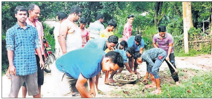
ଯୁବଗୋଷ୍ଠୀ ସଫେଇ କାର୍ଯ୍ୟ କରୁଛନ୍ତି ।