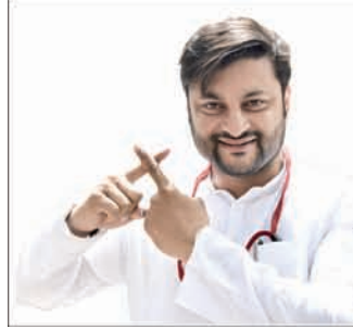
Anubhav Mohanty Actor

ଜାକର୍ଣ୍ଣା ଏସିଆନ ଗେମ୍ସରେ ୨ଟି ଗୌପ୍ୟ ସପକ ଜିତି ଦେଶକୁ ଗର୍ବିତ କରିଥିବା ଓଡ଼ିଶାର ଦୃତୀ ଚାନ୍ଦ ଆଶାମା ଦିନରେ ଆହୁରି ସଫଳତା ପାଇଁ ବେଶ୍ ଆଶାବାଦୀ।