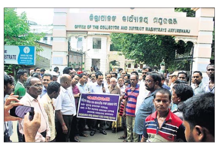
ଜମାଦାରୀମାନେ ଜିଲାପାଳଙ୍କ କାର୍ଯ୍ୟାଳୟ ସମ୍ମୁଖରେ ବିକ୍ଷୋଭ କରୁଛନ୍ତି।

ବାରିପଦା ଅଫିସ, ୩୧: ବାରିପଦା ଜମାଦାରୀମାନେ ରଖିଥିବା ସେମାନଙ୍କ ଜମାଦାରୀ ଫେରସ୍ତ ଦାବିରେ ବ୍ୟାଙ୍କ ଜମାଦାରୀ ବିକ୍ଷୋଭ କରି ରଖୁଛନ୍ତି। ଏନେଇ ଜମାଦାରୀମାନେ ସୋମବାର ଜିଲାପାଳଙ୍କ କାର୍ଯ୍ୟାଳୟ ସମ୍ମୁଖରେ ଧାରଣା ସହିତ ବିକ୍ଷୋଭ କରିଛନ୍ତି। ଜମାଦାରୀମାନେ ପୂର୍ବାହରେ ବ୍ୟାଙ୍କ ଖୋଲିବା ପରେ ବ୍ୟାଙ୍କ ସମ୍ମୁଖରେ ଗଣଧାରଣାରେ ବସି ଜମା ରାଶି ଫେରସ୍ତ ଦାବି କରି ବିକ୍ଷୋଭ ପ୍ରଦର୍ଶନ କରିଥିଲେ। ଏହାପରେ ମଧ୍ୟାହ୍ନ ପ୍ରାୟ ୧୨ଟା ପରେ ଏକ ଶୋଭାଯାତ୍ରାରେ ଜମାଦାରୀମାନେ ଜିଲାପାଳଙ୍କ କାର୍ଯ୍ୟାଳୟ ସମ୍ମୁଖରେ ପହଞ୍ଚି ଧାରଣାରେ ବସିଥିଲେ। ଏହି ସମୟରେ ଜମାଦାରୀମାନେ ଅର୍ଦ୍ଧନ ବ୍ୟାଙ୍କର ପରିଚାଳନା କମିଟି, ବ୍ୟାଙ୍କ କର୍ତ୍ତୃପକ୍ଷଙ୍କ ସହିତ ରାଜ୍ୟ ସରକାରଙ୍କ ବିରୋଧରେ ବିଭିନ୍ନ ଘୋଷାମାନମାନ