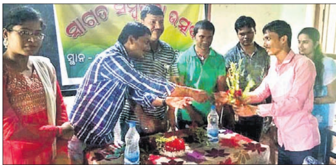
ନବନିଯୁକ୍ତ କନିଷ୍ଠ ଶିକ୍ଷୟିତ୍ରୀ ଓ ଶିକ୍ଷକଙ୍କୁ ସମର୍ଥନ କରାଯାଉଛି ।

ବାଲେଶ୍ୱର ଜିଲ୍ଲା ଖଇରାପଡ଼ା ଥାନା ଅଧୀନ ରେମୁଣା ବ୍ଲକ୍ ମହାରାଜପୁର ଗ୍ରାମରେ ପରିବେଶ ଗଠନ ଲାଗି ଯୁବ ଗୋଷ୍ଠୀ ଅଣ୍ଟା ଭିଡ଼ିଛନ୍ତି । ଉଦ୍ଦେଶ୍ୟ ରାଧାକୃଷ୍ଣ କାନ୍ଥ କୁବର ସଦସ୍ୟମାନେ ସଂଗଠିତ ହୋଇ ଗ୍ରାମ ରାସ୍ତା ଓ ବିଦ୍ୟାଳୟ ପରିସରକୁ ସଫାକରିବା କରିଥିଲେ । ସେମାନେ ଅନାବନା ଗଛ ନଷ୍ଟ କରି ପରିବେଶ ଏହି ସଫେଇ କାର୍ଯ୍ୟ କରିଥିଲେ ।