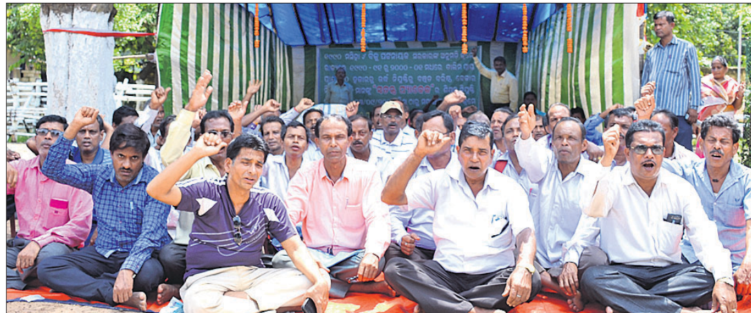
ଲୋୟର ପିଏମ୍‌ଜିରେ ଆନ୍ଦୋଳନରେ ବସିଥିବା ଅଲ୍ ଓଡ଼ିଶା ଅଣକର୍ମଚାରୀ ପୁରୁଣା ସିଟି ଏବଂ ବି.ଇଡି ସଂଘ ସଦସ୍ୟ।