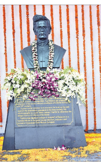
ମେଡିକାଲ ପରିସରରେ ଫକୀରମୋହନଙ୍କ ପ୍ରତିମୁର୍ତ୍ତି ସମୟ ପୂର୍ବରୁ ସେ ଆସି ପହଞ୍ଚିଥିଲେ ମଧ୍ୟ ଭିଆଇପିକ ଗହଣରେ ବସିଥିବାର ଦେଖିବାକୁ ମିଳିଥିଲା। ତାଙ୍କୁ ଭବିଷ୍ୟ ଆସନ ମିଳି ନ ଥିବାରୁ ବିଶ୍ୱବିଦ୍ୟାଳୟର ଛାତ୍ରାଛାତ୍ରୀ ଏବଂ କର୍ମଚାରୀ ଅସନ୍ତୋଷ ବ୍ୟକ୍ତ କରିବା ଦେଖାଦେଇଥିଲା।