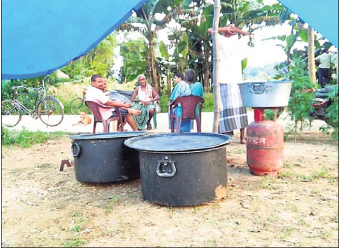
ବାଲିପଡ଼ା ସାହି ଲୋକଙ୍କ ପାଇଁ ହୋଇଥିବା ଖାଦ୍ୟ।