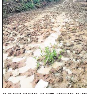
କୁଣ୍ଡାକୁଟ ଗ୍ରାମର କାବୁଅ ପତପତ ରାସ୍ତା।

କେନ୍ଦୁଝର ଜିଲା ଆନନ୍ଦପୁର ଧକୋଠା ପଞ୍ଚୟତର କୁଣ୍ଡାକୁଟ ଗ୍ରାମ ରାସ୍ତା କାବୁଅ ପତପତ ହୋଇଛି। ଉକ୍ତ ରାସ୍ତାରେ ଲୋକେ ଯାତାୟତ କରିବାର ହଇରାଣ ହେଉଛନ୍ତି। ରାସ୍ତା ଶୋଚନୀୟ ହୋଇଥିବାରୁ ସ୍କୁଲକଲେଜ ଛାତ୍ରାଛାତ୍ରୀ ହଇରାଣ ହେଉଛନ୍ତି। ଗାଁ ଭିତରକୁ ଆତ୍ମଲୀଳା ଯାଇପାରୁନି। କୁଣ୍ଡାକୁଟ ଗ୍ରାମର ଲୋକେ ଏ ନେଇ ଧକୋଠା ପଞ୍ଚୟତରୁ ଆରମ୍ଭ କରି ଆନନ୍ଦପୁର ବ୍ଲକ୍‌ସ୍ତରକୁ ଗୁହାରି କରିଥିଲେ। ଅଦ୍ୟାବଧି ରାସ୍ତା ମରାମତି ହୋଇପାରୁନି। ରାସ୍ତା