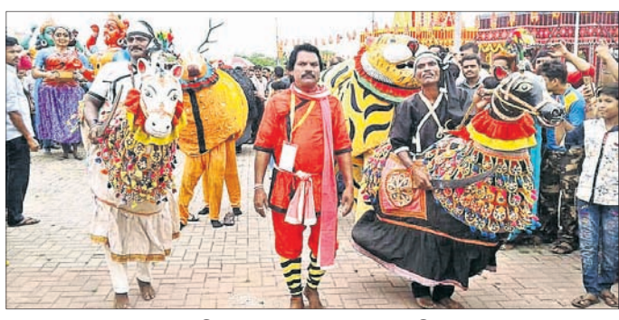
ଉପେନ୍ଦ୍ର ଭଞ୍ଜ ଲୋକନୃତ୍ୟ ପରିଷଦ ପକ୍ଷରୁ ପଶୁମୁଖା ନୃତ୍ୟ ପରିବେଷଣ ।

ଓଡ଼ିଶା ପର୍ବରେ ଘୁମୁସରର ପଶୁମୁଖା ନୃତ୍ୟ ପରିବେଷଣ । ଉପେନ୍ଦ୍ର ଭଞ୍ଜ ଲୋକନୃତ୍ୟ ପରିଷଦ ପକ୍ଷରୁ ପଶୁମୁଖା ନୃତ୍ୟ ପରିବେଷଣ ।