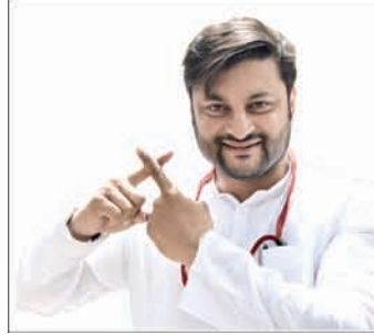
Anubhav Mohanty Actor

ଜାକର୍ଣ୍ଣା ଏସିଆନ ଗେମ୍‌ରେ ୨ଟି ଗୌପ୍ୟ ସପକ ଜିତି ଦେଶକୁ ଗର୍ବିତ କରିଥିବା ଓଡ଼ିଶାର ଦୃତୀ ଚାନ୍ଦ ଆଶାମା ଦିନରେ ଆହୁରି ସଫଳତା ପାଇଁ ବେଶ୍ ଆଶାବାଦୀ।