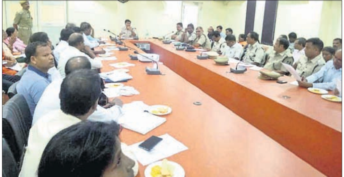
ବୈଠକରେ ଉପସ୍ଥିତ ଏସପି ଏବଂ ଅନ୍ୟମାନେ ।