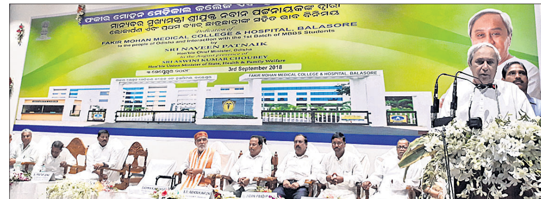
ଉଦ୍‌ଘାଟନ ସମାରୋହରେ ମୁଖ୍ୟମନ୍ତ୍ରୀ ନବୀନ ପଟ୍ଟନାୟକ ଉଦ୍‌ଘୋଷଣା କରୁଛନ୍ତି।