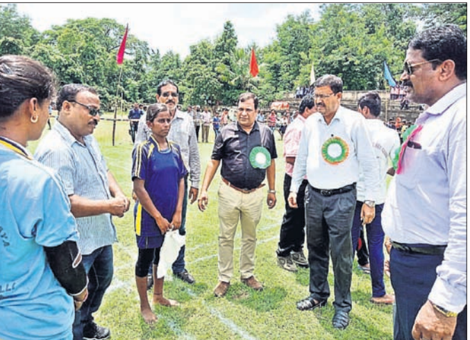
ପ୍ରତିଯୋଗିତାରେ ଉପସ୍ଥିତ ଅତିଥି ।