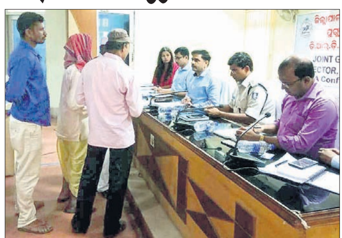
ଜିଲ୍ଲାପାଳ ଓ ଏସପି ଲୋକଙ୍କ ଅଭିଯୋଗ ଶୁଣୁଛନ୍ତି ।