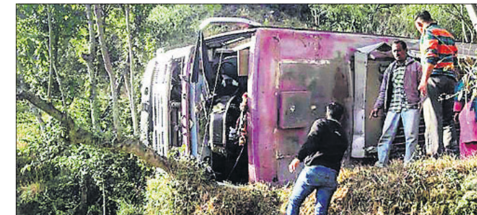
ଖାତକୁ ଖସିପଡ଼ିଥିବା ବସ୍।

ପରେ ଡେରାଡୁନ ହସ୍ପିଟାଲରେ ଭର୍ତ୍ତି କରାଯାଇଥିବା ପରଖିଲ ପ୍ରକାଶ କରିଛନ୍ତି। ଗାଡ଼ିକୁ ଡେଇଁପଡ଼ି ସେମାନେ ପଥର ଫାଙ୍କରେ ରହି ଯାଇଥିଲେ। ତେବେ ସମସ୍ତ ମୃତକ ଏବଂ ଆହତ ଆଖପାଖ ଅଞ୍ଚଳର ବୋଲି ସେ କହିଛନ୍ତି। ସେମାନଙ୍କ ମଧ୍ୟରୁ ଅଧିକାଂଶ ଗୋଟିଏ ପରିବାରର ବୋଲି ଜଣାପଡ଼ିଛି। ଗଙ୍ଗୋତ୍ରୀ ମନ୍ଦିରକୁ ଦର୍ଶନ କରିବା ପାଇଁ ସେମାନେ ଯାଉଥିଲେ। ଦୁର୍ଘଟଣା ସମ୍ପର୍କରେ ଜଣାପଡ଼ିବା ପରେ ସ୍ଥାନୀୟ ଲୋକେ, ଭବିଷ୍ୟତ ପୋଲିସ୍, ରାଜ୍ୟ ବିପର୍ଯ୍ୟୟ ପ୍ରଶମନ ବଳ (ଏସ୍‌ଡିଆର୍‌ଏଫ୍) ଏବଂ ଆଇଟିସିପିଏମାନମାନେ ଉଦ୍ଧାରକାର୍ଯ୍ୟରେ ଲାଗି ପଡ଼ିଥିଲେ। ୧୩ ଜଣଙ୍କ ମୃତ୍ୟୁକୁ ନେଇ ଉତ୍ତରାଖଣ୍ଡ ମୁଖ୍ୟମନ୍ତ୍ରୀ ଭୁବେନ୍ଦ୍ର ସିଂ ରାଓଙ୍କୁ ଶୋକପ୍ରକାଶ କରିଛନ୍ତି। ଆହତ ଦୁଇ ନାବାଳିକାଙ୍କୁ ସବୁ ପ୍ରକାର ଚିକିତ୍ସା ସୁବିଧା ଯୋଗାଇବାକୁ ମୁଖ୍ୟମନ୍ତ୍ରୀ ନିର୍ଦ୍ଦେଶ ଦେଇଛନ୍ତି।