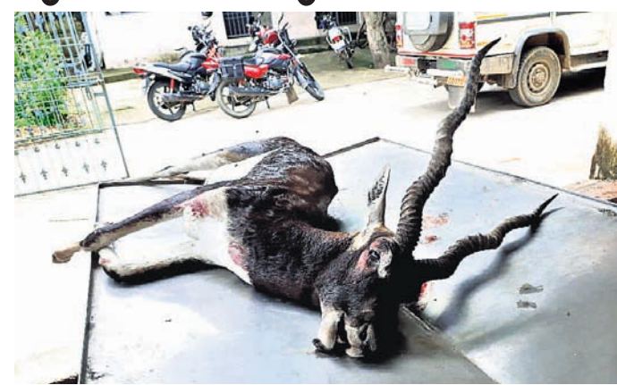
ମୃତ କୃଷ୍ଣସାର ।

ଅଧିକା, ୩୯ (ଡି.ଏନ.ଏ.) : ଚାରିଦଲଇ ଛକଠାରୁ ସିକନ୍ଦରୀ ଯାଇଥିବା ରାସ୍ତାରେ କରଡିପତିଆରୁ ସୋମବାର ସକାଳେ ଏକ ଅଣ୍ଡିରା କୃଷ୍ଣସାର ମୃତ ମୃତଦେହ ଉଦ୍ଧାର କରାଯାଇଛି । ପ୍ରାୟ ସାଢ଼େ ୩ ମୁଟ ଲମ୍ବା, ଅଜେଲମୁଟ ଉକ୍ତତା ଓ ଦେହ ଫୁଟ ଲମ୍ବର ସିଂଧୁ ଥିବା ଏହି କୃଷ୍ଣସାରର ଦୟସ ୫ରୁ ୬ ବର୍ଷ ମଧ୍ୟରେ ବର୍ଷ ହେବ ବୋଲି ଅନୁମାନ କରାଯାଇଛି । ମୃତ କୃଷ୍ଣସାରକୁ ବନ ବିଭାଗ ପକ୍ଷରୁ ଆସିବା ପ୍ରାଣୀ ଚିକିତ୍ସାଳୟରେ ବ୍ୟବହେଦ ପରେ ଚାରିଦଲଇସ୍ଥିତ