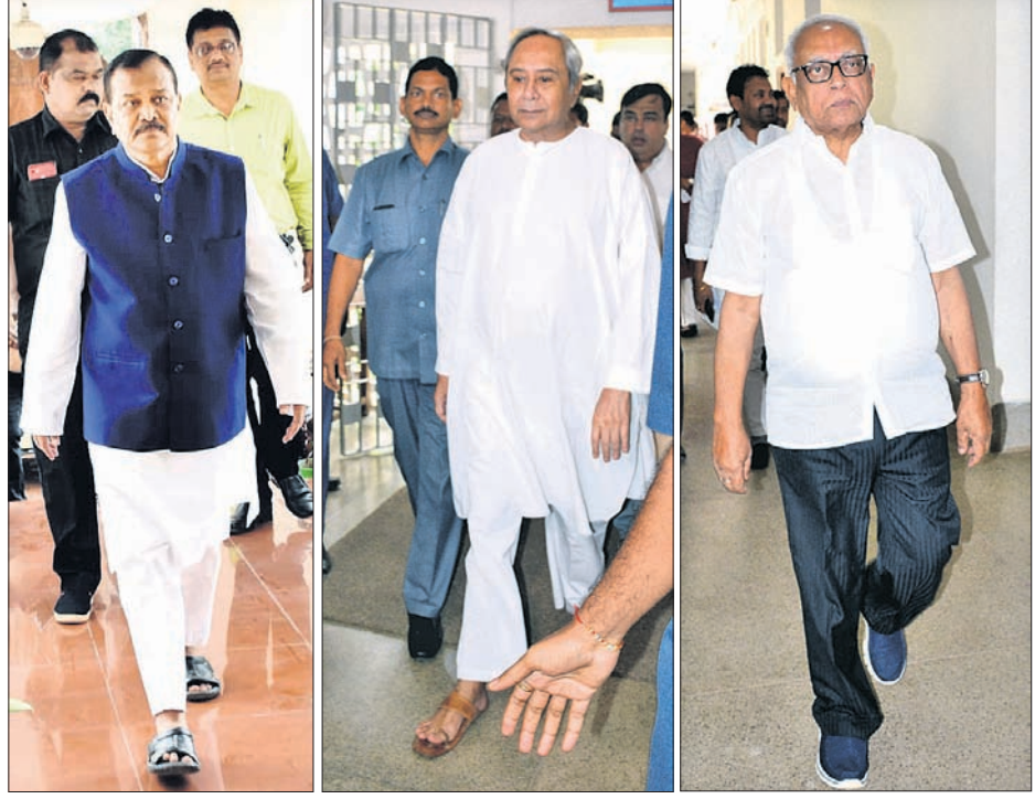
ମଙ୍ଗଳବାର ବିଧାନସଭାକୁ ବାବଦ ପ୍ରତ୍ୟାପନା ପାଇଁ, ମୁଖ୍ୟମନ୍ତ୍ରୀ ନବାନ ପଟ୍ଟନାୟକ ଓ ବିରୋଧୀବଳ ନେତା ନରସିଂହ ମିଶ୍ର ଯାଉଛନ୍ତି।