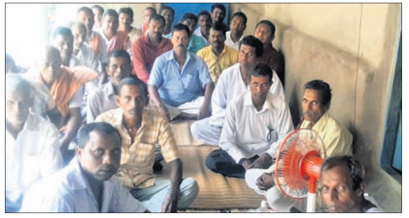
ସାଥୀ କଂଗ୍ରେସର ପରିବର୍ତ୍ତିତ କର୍ମୀ ବୈଠକରେ ଉପସ୍ଥିତ କର୍ମୀ।

୩ ଚୋରା ମଦ ବେପାରୀ ଗିରଫ... ନାଳଗିରି, ୪୮୯(ଡି.ଏନ.ଏ.): ଚୋରା ମଦ ବେପାରୀ ଗିରଫ କରାଯାଇଛି।