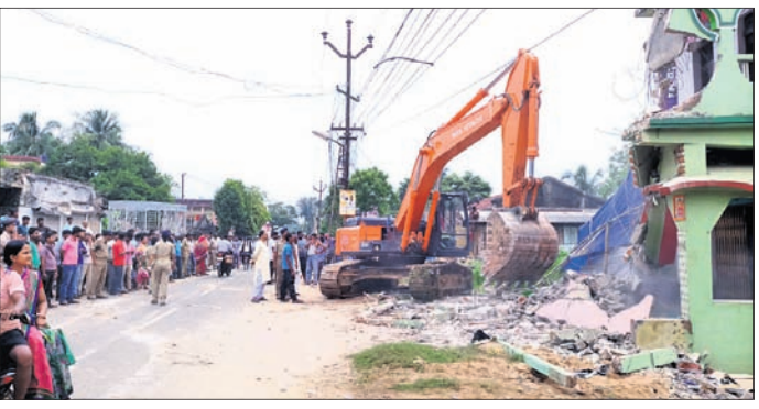
କେସିଏ ଦ୍ୱାରା ଜବରଦସ୍ତୀ ଉଚ୍ଛେଦ କରାଯାଇଛି। ନେତୃତ୍ୱରେ କେତେକ ଭାଙ୍ଗିବା କର୍ମୀମାନେ ବାଲେଶ୍ୱରରେ ଅଧିକାରୀଙ୍କୁ ଉଚ୍ଛେଦ କରାଯାଇଛି।

ଜଳେଶ୍ୱର, ୪୮୯(ଡି.ଏନ.ଏ.) ୫୭ ନମ୍ବର ରାଜ୍ୟ ରାଜପଥ କଳେଶ୍ୱର-ବାଟପାଲି-ଚନ୍ଦ୍ରନଗର ଉପରେ ନିର୍ମାଣ ହେବାକୁ ଥିବା ଓଡ଼ିଶା ଲାଗି ମଙ୍ଗଳାକାର ଜବରଦସ୍ତୀ ଉଚ୍ଛେଦ ଆରମ୍ଭ ହୋଇଛି।