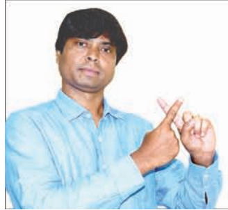
Dilip Tirkey Sports Personality