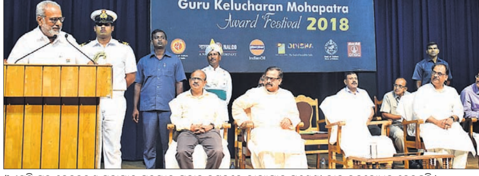
ଓଡ଼ିଶା ଗୁରୁ କେଳୁଚରଣ ମହାପାତ୍ର ପୁରସ୍କାର ପ୍ରଦାନ ଉତ୍ସବରେ ରାଜ୍ୟପାଳ ଗଣେଶୀ ଲାଲ ଉଦ୍‌ବୋଧନ ଦେଉଛନ୍ତି।

ପୃଥ୍ବୀ ଏବଂ ଆକାଶ ମଧ୍ୟରେ ରାସ ରହିଥାଏ। ହେଲେ ପୃଥ୍ବୀର ଚଳେ ଓ ଆକାଶକୁ ଉଡ଼ିବେ ଯାହା ଥାଏ, ତାହାକୁ ମହାରାସି କୁହାଯାଏ। କମଳଦେବୀ ପୁରୁଷ ଗୁରୁ କେଳୁଚରଣ ମହାପାତ୍ର ଯେଭଳି ଜଣେ ମହାରାସି ଥିଲେ ତାଙ୍କ ନିକଟରେ ବିଶ୍ୱର ସବୁ ଉଲ୍ଲୁଖତା ସମାପ୍ତ ହୋଇଥିଲା। ଗୁରୁ କେଳୁଚରଣ ଭାରତୀୟ ସଂସ୍କୃତି ଜଗତର ଅତ୍ୟନ୍ତ ମହତ୍ତ୍ୱପୂର୍ଣ୍ଣ ଥିଲେ ବୋଲି ରାଜ୍ୟପାଳ ପ୍ରଫେସର ଡ. ଗଣେଶୀ ଲାଲ କହିଛନ୍ତି।