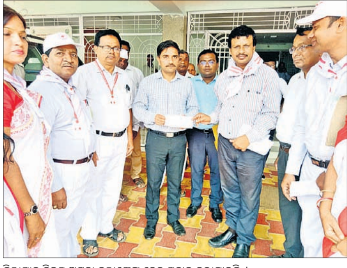
ଜିଲ୍ଲାପାଳ ବିଜୟ ଅନୁରୁଦ୍ଧ ଗଞ୍ଜାମରେ ଏଆଇଟିୟୁସି ପ୍ରଦାନ କରାଯାଇଛି ।

ଗଣତନ୍ତ୍ର ଓ ସମ୍ବିଧାନର ସୁରକ୍ଷା, ପ୍ରଚଳିତ ଶ୍ରମ ଆଇନ ସଂଶୋଧନ ବାତିଲ ଏବଂ ଭଲ ନ୍ୟାୟାଳୟ ଆଦିର ଅନୁପାଳନ ଶ୍ରମିକ ଓ କର୍ମଚାରୀଙ୍କ ସମାନ କାମକୁ ସମାନ ଭାବେ ପ୍ରଦାନ ପାଇଁ ଦାବି କରାଯିବ ।