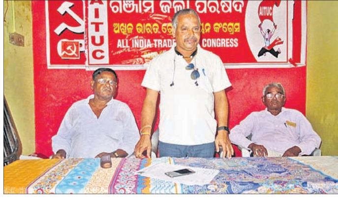
ୱିକିମିଡ଼ିଆ ସମାପକମାନେ ସମସ୍ତଙ୍କୁ ଏଆଇଟିୟୁସି ନେତାମାନେ ।

ଭିକିମିଡ଼ିଆ ପ୍ରତିଷ୍ଠା, ଗୋପାଳପୁର ବନ୍ଦରରେ କାର୍ଯ୍ୟକ୍ରମ ପ୍ରଦର୍ଶନ କରିବା ପାଇଁ ଏଆଇଟିୟୁସି ଆସିଛି ।