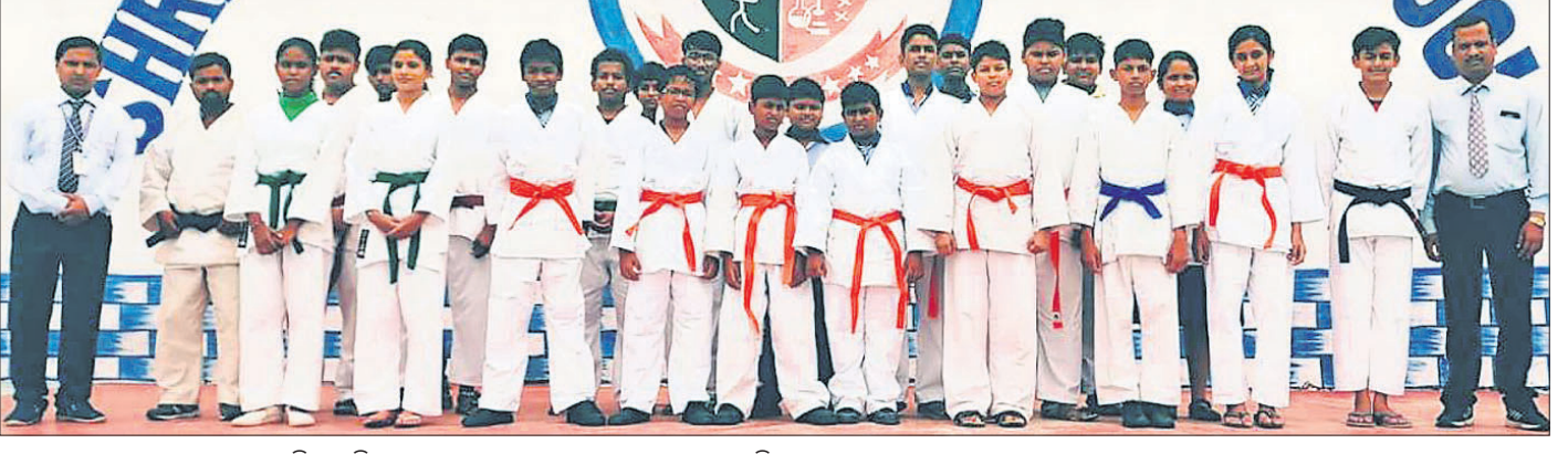
ଜାପାନ କରାଟେ ସୋଡୋକାଇ ଟ୍ରେନିଂ ସେମିନାରରେ ଭାଗ ନେଇଥିବା କରାଟେକାରୀମାନେ ଅତିଥିକ ସହ ।