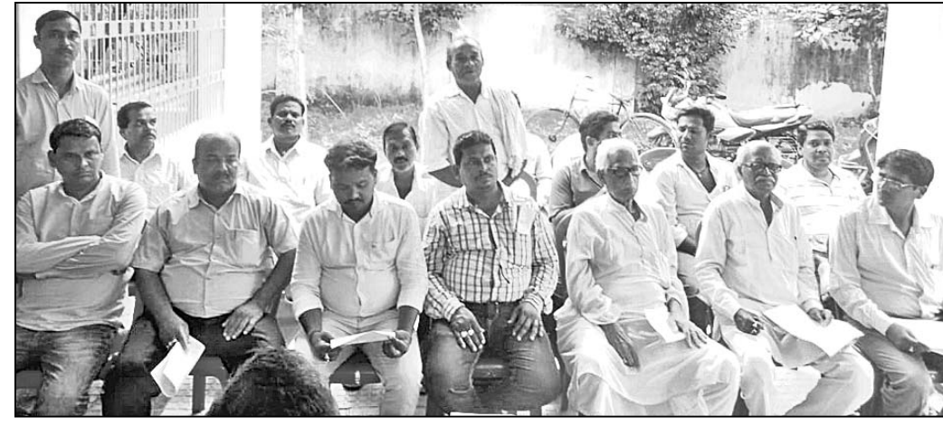
ଉପସ୍ଥିତ ବିଜେଡି କର୍ମକର୍ତ୍ତା।