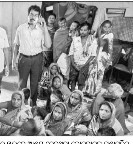
ଲଗାଶବ୍ଦୀ ଯୋଗୁ ଉତ୍ତୁନାଥପୁର ବ୍ଲକ୍ ଗୋକୁଳପୁର ସ୍କୁଲରେ ଆଶ୍ରୟ ନେଇଥିବା ଲୋକମାନଙ୍କୁ ପ୍ରଶାସନିକ ଅଧିକାରୀମାନେ ଭେଟୁଛନ୍ତି ।