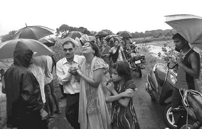
ଶୋକସତ୍ତ୍ୱ ମୃତକଙ୍କ ଆତ୍ମାୟମାନେ ।

ଏହି ସମୟରେ ଆମାୟ ସ୍ୱଜନଙ୍କ କାନ୍ଦବୋବାଳିରେ ଗାଁ ଫାଟି ପଡ଼ିଥିଲା । ପ୍ରବଳ ବର୍ଷା ସତ୍ତ୍ୱେ ହଜାର ହଜାର ଗ୍ରାମବାସୀ ଶୁଖାନରେ ଉପସ୍ଥିତ ରହିଥିଲେ । ସୂଚନା ଅନୁଯାୟୀ, ପରିକ୍ଷିତ ଗ୍ରାମ ଗଣନାରେ ପାଣି ଜମି ରହିଥିବାରୁ ପଥୁରିଆ ଗାଁ ଶୁଖାନରେ ଶେଷକୃତ୍ୟ ସମ୍ପନ୍ନ ହୋଇଥିଲା । ଗୁରୁବାର ପୂର୍ବାହ୍ନରେ କୁଳଙ୍ଗରେ ମୃତଦେହ ବ୍ୟବହେଦ ପରେ ପ୍ରାୟପରିକଳ୍ପ କ୍ରମରେ ଲକ୍ଷ୍ୟ କରି ଗ୍ରାମର ପୁରବାମାନେ ମୃତଦେହ ଗାଁକୁ ନ