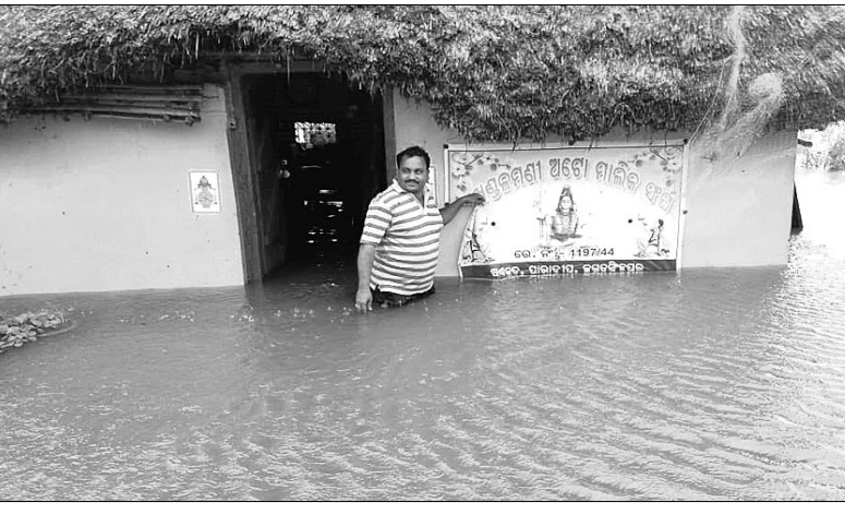
ପାରାଦୀପ ସଖକୁଦଠାରେ ଥିବା ଅତୀତ ମାଲିକ ସଂଘ ଗୃହରେ ବର୍ଷା ପାଣି ।