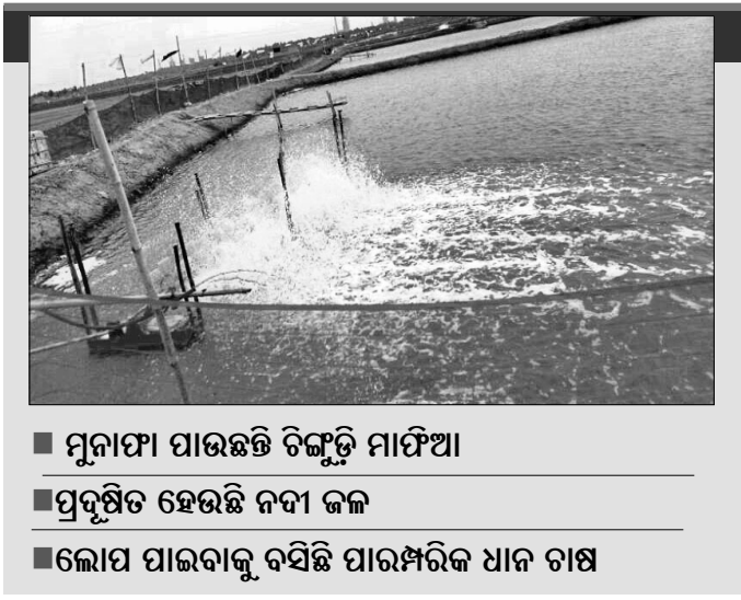
■ ମୁନାଫା ପାଇଛନ୍ତି ଚିକ୍ଳୁଡ଼ି ମାଫିଆ ■ ପ୍ରଦୂଷିତ ହେଉଛି ନଦୀ ଜଳ ■ ଲୋପ ପାଇବାକୁ ବସିଛି ପାରମ୍ପରିକ ଧାନ ଚାଷ

ନମ୍ବର ଜିଲ୍ଲା ପରିଷଦ ଭୋଗ ଅଞ୍ଚଳରେ ଏବେ ବେଆଇନ୍ ଭାବେ ଚିକ୍ଳୁଡ଼ି ଘେରା ନିର୍ମାଣ କରାଯାଉଥିବା ଦେଖିବାକୁ ମିଳିଛି । ଫଳରେ ପାରମ୍ପରିକ ଧାନଚାଷ ଏବେ ପ୍ରାୟ ସମ୍ପୂର୍ଣ୍ଣ ଭାବେ ବିକୃଷ୍ଟ ହୋଇପଡ଼ିଛି । କଟକ ଓ ଭୁବନେଶ୍ୱର ଚିକ୍ଳୁଡ଼ି ମାଫିଆମାନେ ସ୍ଥାନୀୟ ଅଞ୍ଚଳର ଚାଷୀଙ୍କୁ ପ୍ରଲୋଭିତ କରି ସେମାନଙ୍କଠାରୁ ଅତ୍ୟନ୍ତ ସ୍ୱଳ୍ପ ମୂଲ୍ୟରେ ଜମି ବାଞ୍ଛିତ ଭାବେ ଲିଜ ନେଇ ଏଥିରେ ଘେରା ନିର୍ମାଣ କରୁଛନ୍ତି । ଫଳରେ ସେମାନେ କୋଟି କୋଟି ଟଙ୍କାର ମୂନାଫା ହାସଲ କରୁଥିବାବେଳେ ଗରୀବ ଚାଷୀମାନଙ୍କୁ ସେମାନଙ୍କର ସ୍ୱଳ୍ପ ମୂଲ୍ୟ ମଧ୍ୟ ପ୍ରଦାନ କରୁନାହାନ୍ତି । ଏବେ ଏହି ଘେରା ନିର୍ମାଣ ପ୍ରକ୍ରିୟା ଏତେ ପରିମାଣରେ ବଢ଼ିଯାଇଛି ଯେ କେଳ ୧୦ ପ୍ରତିଶତ ଜମିକୁ ଛାଡ଼ିଦେଲେ ବାକି ସମସ୍ତ ଜମିରେ ଘେରା ନିର୍ମାଣ ହୋଇଥିବା ଜଣାପଡ଼ିଛି । ଏପରିକି ଅବଶିଷ୍ଟ ଦଶପ୍ରତିଶତ ଜମିରେ ମଧ୍ୟ ଧାନ ଚାଷ କରାଯାଇଛି । ଅନେକ ସମୟରେ ଏହି ଘେରା ନିର୍ମାଣ କରାଯାଇଛି, ଯାହାକି ଗ୍ରାମୀଣଙ୍କ ଲୋକଙ୍କ ପାଇଁ ସମସ୍ୟା ସୃଷ୍ଟି କରିଛି । ପ୍ରକାଶ ଯେ, ଏରସମା କୁଳ ୪