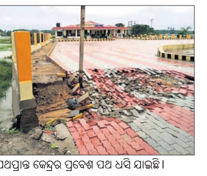
ପଥପ୍ରାନ୍ତ କେନ୍ଦ୍ରର ପ୍ରବେଶ ପଥ ଧସି ଯାଇଛି ।

ଡୋରବିଶା, ୩୯ (ସ୍ୱ.ପ୍ର.):-ଡୋରବିଶା ଜଳ ବାନପୁର ପଞ୍ଚାୟତ ଅଧୀନ କେଶରପୁର ଠାରେ ଥିବା ପଥପ୍ରାନ୍ତ ସୁବିଧା କେନ୍ଦ୍ରର ପ୍ରବେଶ ପଥ ଲଗାଶ ବର୍ଷାରେ ଭୁଜୁଡ଼ି ପଡ଼ିଛି । ଗତ ଜୁଲାଇ ୩୧ରେ ରାଜ୍ୟ ସରକାରଙ୍କ ପକ୍ଷରୁ ନିର୍ମିତ ଏହି ସୁବିଧା କେନ୍ଦ୍ର ପୁଖ୍ୟମନ୍ତ୍ରୀ ନବୀନ ପଟ୍ଟନାୟକଙ୍କ ଦ୍ୱାରା ଲୋକାର୍ପିତ ହୋଇଥିଲା । କେନ୍ଦ୍ରାପଡ଼ା ପୂର୍ବବିଭାଗ ପକ୍ଷରୁ ୧ କୋଟି ୪୯ ଲକ୍ଷ ଟଙ୍କା ବ୍ୟୟରେ ନିର୍ମିତ ଏହି ସୁବିଧା କେନ୍ଦ୍ର ଲୋକାର୍ପିତ ହେବାର ୧ ମାସ ନ ପୁରୁଣୁ ଏହାର ପ୍ରବେଶ ପଥ ଗୁରୁବାର ସକାଳେ ଭୁଜୁଡ଼ି ପଡ଼ିଛି । ଏହି କେନ୍ଦ୍ରର ରାଜପଥ ଥିବା ପାଟକୁରା ମଧ୍ୟ ବିପଦସୂଚୀ ଅବସ୍ଥାରେ ରହିଛି । ନିମ୍ନମାନର କାମ ଯୋଗୁ ଏହାର ପ୍ରାୟ ୫୦୦ ଫୁଟ ଦୂରକୁ ବୁଡ଼ି ହୋଇଛି ।