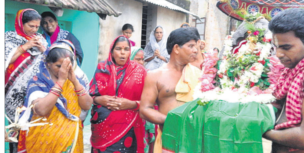
ଲବଣିଖୁଆ ପାଇଁ ଠାକୁରଙ୍କୁ ନିମନ୍ତ୍ରଣ କରି ନିଆଯାଇଛି।

ନୀଳମାଧବଙ୍କ ପୀଠରେ ଲବଣିଖୁଆ ଓ କାଳୀୟଦଳନ ଉତ୍ସବ ଅନୁଷ୍ଠିତ ହୋଇଛି। ଏହି ଅବସରରେ ଶ୍ରୀ ଜାଉଳ ସ୍ୱାମୀ ଓ ଅବକାଶ ଗାଦିନୀଟି ଅନୁଯାୟୀ ସମ୍ପନ୍ନ ହୋଇଥିଲେ।