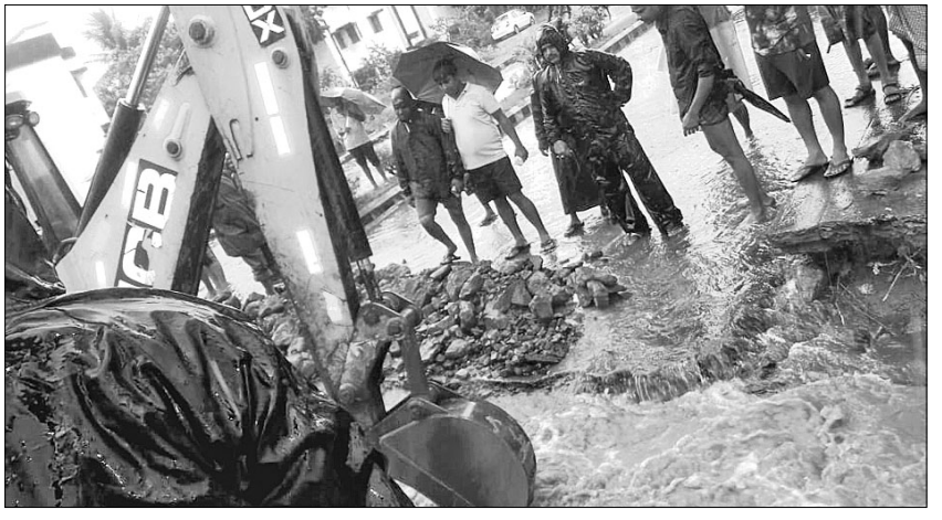
ପାରାଦୀପରେ ଜେସିବି ଯୋଗେ କଳ ନିଷାସନ ବ୍ୟବସ୍ଥା କରାଯାଇଛି ।