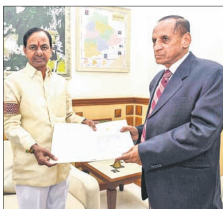
ପୁଞ୍ଜୀମନ୍ତ୍ରୀ କେ. ଚନ୍ଦ୍ରଶେଖର ରାଓ ଗୁରୁବାର ରାଜ୍ୟପାଳ ଇସ୍‌ସାହୁଙ୍କୁ ନରସିଂହନଙ୍କୁ ଭେଟି ସଂକଳ୍ପନାମା ପ୍ରଦାନ କରୁଛନ୍ତି।

ହାଇଦ୍ରାବାଦ, ୬।୯ (ପି.ଟି.) ଯାହା ଅନୁମାନ କରାଯାଉଥିଲା ଶେଷରେ ତାହା ହେଲା। ସମସ୍ତ କଳ୍ପନାକଳ୍ପନାର ଅବଧାନ ଘଟାଇ ତେଲେଙ୍ଗାନା ପୁଞ୍ଜୀମନ୍ତ୍ରୀ କେ. ଚନ୍ଦ୍ରଶେଖର ରାଓ (କେସିଆର୍) ଗୁରୁବାର ରାଜ୍ୟ ବିଧାନସଭାକୁ ଭଙ୍ଗ କରାଇବା ପାଇଁ ସୁପାରିସ କରିଛନ୍ତି। ସେ ରାଜ୍ୟପାଳ ଇସ୍‌ସାହୁଙ୍କୁ ନରସିଂହନଙ୍କୁ ଭେଟି କ୍ୟାବିନେଟର ଏହି ନିଷ୍ପତ୍ତି ସମ୍ପର୍କରେ ଅବଗତ କରାଇଛନ୍ତି। ରାଜ୍ୟପାଳ ଉକ୍ତ ସୁପାରିସକୁ ଗ୍ରହଣ କରିବା ପରେ ତେଲେଙ୍ଗାନାରେ ଆଗୁଆ ନିର୍ବାଚନର ପଥ ଉନ୍ମୁଳ୍ଲ ହୋଇଛି। ପୁନଃ କ୍ଷମତାସାଧନ ହେବା ପାଇଁ କେସିଆର୍ଙ୍କ ଏହି ପଦକ୍ଷେପକୁ ନେଇ ଜାତୀୟ ରାଜନୀତି ସରଗରମ ହୋଇଛି।