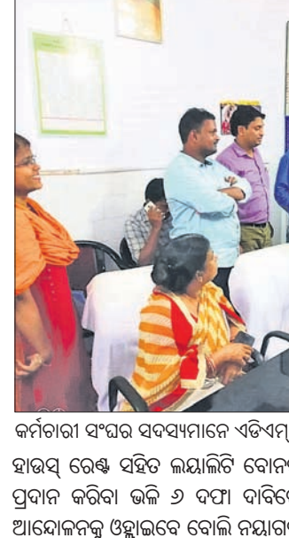
କର୍ମଚାରୀ ସଂଘର ସହଯୋଗୀଙ୍କୁ ଦାବିପତ୍ର ପ୍ରଦାନ କରୁଛନ୍ତି।