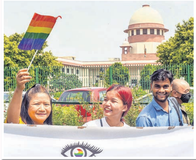
ସମଲିଙ୍ଗୀ ଯୌନ ସମ୍ପର୍କକୁ ଅପରାଧୀୟତା କରିଛନ୍ତି ପୁସ୍ତିକାକୋର୍ଟ । ଆଇନପିତ ଦମ୍ପା ୩୭୭କୁ ନେଇ ଚାଲିଥିବା ନ୍ୟାୟିକ ବିଚାରର ଘଟଣାକ୍ରମ ....