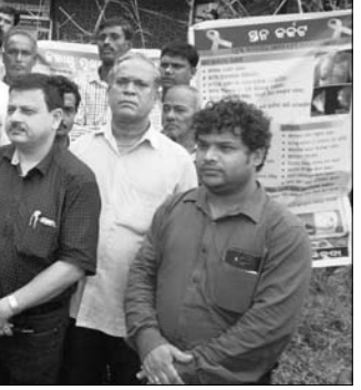
ଶିବିରରେ ଉପସ୍ଥିତ ଡାକ୍ତରୀ ଦଳ ଓ ଅନ୍ୟମାନେ ।