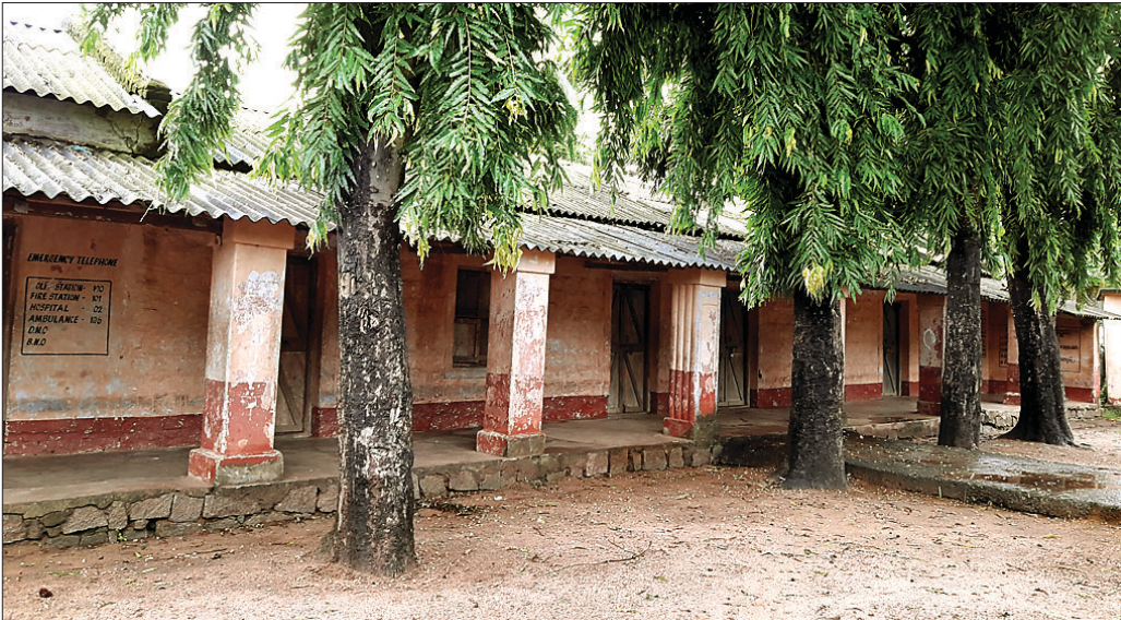
ଅଷ୍ଟପଦାଠାରେ ଥିବା ଦୁର୍ଗାଚରଣ ହାଇସ୍କୁଲରେ ତାଲି ପଢ଼ିଲେ।

ନୟାଗଡ଼ ରୁକ୍ମ ଖୁଣ୍ଟନ ପଞ୍ଚାୟତ ଅଧିକାରୀଙ୍କ ପ୍ରାମାଣିତ ଭାବେ ଡେଙ୍ଗୁ ରୋଗୀ ଚିହ୍ନଟ ହୋଇଛି। ଦଶପଲ୍ଲୀ ଏନଏସି ଅଧୀନ ହରିଡାବାଡି ଗ୍ରାମର ଦଶପଲ୍ଲୀ ସ୍ୱାସ୍ଥ୍ୟକେନ୍ଦ୍ରରେ ଡେଙ୍ଗୁ ରୋଗୀ ଚିହ୍ନଟ ହୋଇଥିବା ଜଣା ପଡ଼ିଛି।