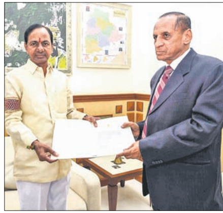
ପୁଞ୍ଜୀମନ୍ତ୍ରୀ କେ. ଚନ୍ଦ୍ରଶେଖର ରାଓ ଗୁରୁବାର ରାଜ୍ୟପାଳ ଇଏସ୍‌ଏଲ୍ ନରସିଂହନଙ୍କୁ ଭେଟି ସଂକଳ୍ପନାମା ପ୍ରଦାନ କରୁଛନ୍ତି।

୨୦୧୯ ସାଧାରଣ ନିର୍ବାଚନକୁ ଆଉ ପ୍ରାୟ ୬ ମାସ ବାକି ଥିବାବେଳେ ଦେଶରେ ନିର୍ବାଚନା ମାହୋଳ ସୃଷ୍ଟି କରିଛି ଡେଲେଙ୍ଗାନା ରାଷ୍ଟ୍ର ସମିତି (ଟିଆର୍ଏସ୍‌ସ୍) ଅଧକ୍ଷ କେସିଆର୍ଙ୍କ ମାନ୍ୟତାପ୍ରାପ୍ତ ଅଣଗଢାପଏ ଏବଂ ଅଣକଂଗ୍ରେସ ଦଳଗୁଡ଼ିକୁ ନେଇ ସଂଘୀୟ ସାମ୍ବନ୍ଧୀୟ ଗଠନର ମଙ୍ଗ ଧରିଥିବା କେସିଆର୍ଙ୍କ ଗୁରୁବାର ଅପରାହ୍ନରେ ରାଜ୍ୟ କ୍ୟାବିନେଟରେ ଅଧ୍ୟକ୍ଷତା କରି ନେଇଛନ୍ତି ବଡ଼ ନିଷ୍ପତ୍ତି। ଡେଲେଙ୍ଗାନାରେ ଲୋକ ସଭା ନିର୍ବାଚନ ସହ ବିଧାନସଭା ଭାଙ୍ଗି ଦେବାରୁ ପ୍ରବାବେଳେ ନିର୍ଦ୍ଧାରିତ ସମୟ ପୂର୍ବରୁ ନିର୍ବାଚନ କରାଯିବାରୁ କ୍ୟାବିନେଟରେ ଏକ ସଂକଳ୍ପନାମା ଗୃହୀତ ହୋଇଛି।