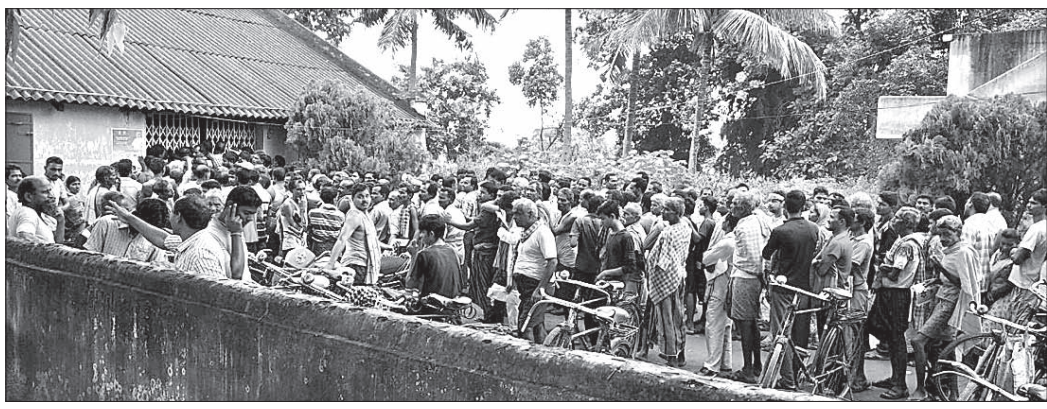
ସାର ବେନାକୁ ଅପେକ୍ଷାରେ ଗାଷ୍ଟୀମାନେ।

ଅନୁଗୋଳ ଜିଲ୍ଲା ଛେଡ଼ିପଦା ବ୍ଲକ୍ ପୁରୀପୁର ସେବା ସମବାୟ ସମିତି ପରିସରରେ ଗୁରୁବାର ସାର ବନ୍ଧନବେଳେ ଉତ୍ତେଜନାମୂଳକ ପରିସ୍ଥିତି ସୃଷ୍ଟି ହୋଇଛି। ଦୀର୍ଘ ସମୟ ଧରି ଲାଲନରେ ଛିଡ଼ା ହେବା ପରେ ସାର ଅଭାବ ଥିବା ଜାଣି ଗାଷ୍ଟୀମାନଙ୍କ ମଧ୍ୟରେ ଡାକ୍ତରୀ ଅସନ୍ତୋଷ ଦେଖାଦେଇଥିଲା। ପରେ ଗାଷ୍ଟୀମାନେ ହୋଇଥିବା ସର ସମିତି ପରିସରରେ ଆନ୍ଦୋଳନ କରିଥିଲେ। ଫଳରେ ସାର ବନ୍ଧନ କାମ ସ୍ଥଗିତ ରଖାଯାଇଛି।