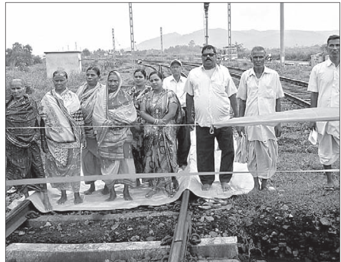
କ୍ଷତିଗ୍ରସ୍ତମାନେ ରେକର୍ଡାରଖଣରେ ଆନ୍ଦୋଳନ କରୁଛନ୍ତି।

ପରିବହନ ବାଧାପ୍ରାପ୍ତ ହୋଇଥିଲା। ଅପରାହ୍‌ରେ ଏନ୍‌ଟିପିସି ଗଢନ ଆନାରେ ଆଲୋଚନା ହୋଇଥିଲା। ଆନ୍ଦୋଳନକାରୀଙ୍କ ପରିବାର ସଦସ୍ୟଙ୍କ ଗୁରୁବାର ଆନ୍ଦୋଳନ କରିଥିଲେ। ପୂର୍ବରୁ କୋର୍ଟରେ ମାମଲା ନେଇ ଏହା ବିକସିତ ହୋଇଛି ବୋଲି ଆଲୋଚନା ବେଳେ କୁହାଯାଇଥିଲା। କୋର୍ଟ ଖୋଲିବାର ୨୦ ଦିନ ମଧ୍ୟରେ ଏହାର ସମାଧାନ କରାଯିବ ବୋଲି ପ୍ରତିଶ୍ରୁତି ଦିଆଯିବା ପରେ ଆନ୍ଦୋଳନ ହଟିଥିଲା ଏହି ସମୟରେ ଆନ୍ଦୋଳନକାରୀଙ୍କ ସହ ଆଲୋଚନାମାନେ ଉପସ୍ଥିତ ଥିଲେ।