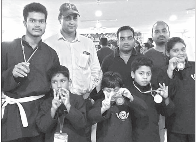
ସଫଳତା ପାଇଥିବା ପ୍ରତିଯୋଗୀମାନେ।