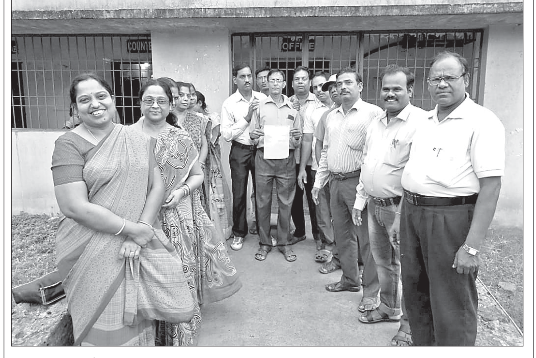
ବିଭିନ୍ନ ଦାବିରେ ବର୍ତ୍ତମାନ କୁନିଘର କଲେଜର ଅଧ୍ୟାପିକା ଓ ଅଧ୍ୟାପକମାନେ ଗୁରୁବାର ଧର୍ମଘର କରିବା ସହ କାର୍ଯ୍ୟକ୍ରମରେ ଚାଲି ପକାଇଛନ୍ତି। ଏଥିଯୋଗୁ କଲେଜରେ ପାଠ ପଢ଼ା ବ୍ୟାହତ ହୋଇଛି।