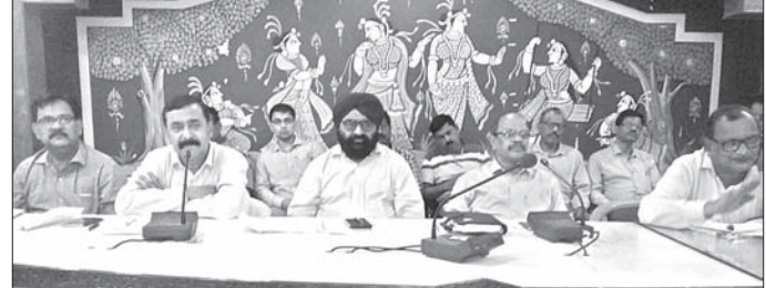
ବୈଠକରେ ଉପସ୍ଥିତ ଅଧିକାରୀମାନେ।

ଓ ରାଜ୍ୟ ସରକାରଙ୍କ ନିର୍ଦ୍ଦେଶରେ ଡାକ୍ତରୀରେ ଡେ.ପି. ଟି.ଏସ୍. ସମସ୍ତ ମହାପ୍ରସଙ୍ଗ, ସୁରକ୍ଷା ମଞ୍ଚ କାର୍ଯ୍ୟକାରୀ ସମ୍ପର୍କରେ ରାଜ୍ୟ ମନ୍ତ୍ରୀ ଅଧିକାରୀଙ୍କ ସମେତ ବିଭିନ୍ନ ଗ୍ରାମବାସୀ ସଭାପତି, ସମ୍ପାଦକ, କ୍ଷତିଗ୍ରସ୍ତ ଗ୍ରାମବାସୀ ଯୋଗ ଦେଇଥିଲେ। ଏମ୍‌ସିଏଲ୍ କର୍ତ୍ତୃପକ୍ଷ ଆନ୍ଦୋଳନକୁ ସ୍ଥଗିତ ରଖିଛି। ଗୁରୁବାର ଆର୍ପିବିଏସି ବୈଠକରେ ଯାହା ନିଷ୍ପତ୍ତି ହୋଇଥିଲା ତାହାକୁ ଜିଲ୍ଲା ପ୍ରଶାସନ ଆନ୍ଦୋଳନ ସହ ନାହିଁ ବୋଲି ମଞ୍ଚ ସଭାପତି ଘୋଷଣା କରିଥିଲେ।