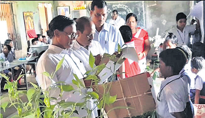
ଜ୍ଞାନ ବିଜ୍ଞାନମେଳାରେ ବିଚାରକମାନେ ପ୍ରକଳ୍ପକୁ ବୁଲି ଦେଖୁଛନ୍ତି।

ନିରାଶ ହୋଇଛନ୍ତି। ଆଶଙ୍କା ଭିତରେ ଆନ୍ଦୋଳନର ରୂପରେଖ ବାଣପୁର ଓ ଗଞ୍ଜାମରେ ସର୍ବ ତ୍ତ୍ୱିଜନ ପ୍ରତିଷ୍ଠା କରାଯାଇ ବୋଲି ଦାବି ରହିଥିଲା। ତେବେ ବାଣପୁରରେ ସର୍ବତ୍ତ୍ୱିଜନ ପ୍ରତିଷ୍ଠା ଦାବି ଜୋର ଧରିଥିଲା। ଚିଲିକାରେ ସର୍ବତ୍ତ୍ୱିଜନ ପ୍ରତିଷ୍ଠା ହେବ ବୋଲି ସରକାରୀ ସ୍ତରରୁ ଜଣା ପଡିଥିଲା। ଏପରିକି ପ୍ରସ୍ତାବିତ ୧୪ଟି ସର୍ବତ୍ତ୍ୱିଜନ ଚାଲିକାରେ ଚିଲିକାର ନାଁ ରହିଥିଲା। ତେବେ କେଉଁଥିପାଇଁ ସର୍ବତ୍ତ୍ୱିଜନର ଦାବିକୁ ଅଣଦେଖା କରାଗଲା ତାର କାରଣ ଜଣାପଡିନାହିଁ। କିନ୍ତୁ ଏଠାରେ ହୋଇଥିବା ଆନ୍ଦୋଳନରେ ସ୍ଥାନୀୟ ବିଧାୟକ ଯୋଗ ଦେଇ ନ ଥିଲେ। ତେବେ ଆନ୍ଦୋଳନର ରୂପରେଖ କ'ଣ ହେବ ତାହା ସମୟ ହିଁ କହିବ।