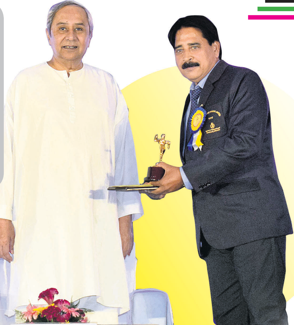
ପୁଖ୍ୟମନ୍ତ୍ରୀ ନବୀନ ପଟ୍ଟନାୟକଙ୍କଠାରୁ ବିଜୁ ପଟ୍ଟନାୟକ ଶ୍ରେଷ୍ଠ କୋର୍ ପୁରସ୍କାର ଗ୍ରହଣ ଅବସରରେ ସଞ୍ଜୟ ଗଡ଼ନାଏକ