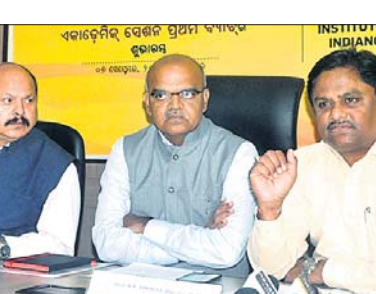
ପ୍ରଥମ ବ୍ୟାଚ୍ରେ ପ୍ରଥମ ବ୍ୟାଚ୍ ରୁ ଶୁଭାରମ୍ଭ ଆଜି

ମୁଖ୍ୟମନ୍ତ୍ରୀ ଭୁବନେଶ୍ୱର ଅଫ୍ କେମ୍ପିକାଲ ଟେକ୍ନୋଲୋଜି (ଆଇସିଟି)ର ଭୁବନେଶ୍ୱର କ୍ୟାମ୍ପସରେ ପ୍ରଥମ ବର୍ଷ ଛାତ୍ରାଛାତ୍ରୀଙ୍କ ପାଠପଢ଼ା ଶୁଭାରମ୍ଭ ହେବ। କେନ୍ଦ୍ର ପେଟ୍ରୋଲିୟମ୍ ଓ ପ୍ରାକୃତିକ ବାଷ୍ପ ମନ୍ତ୍ରୀ ଅନୁଷ୍ଠିତ ପ୍ରଧାନ ପୂର୍ବାହ୍ନୀ ୮ଟାରେ ଏହାକୁ ଉଦ୍ଘାଟନ କରିବେ। ପ୍ରଥମ ବ୍ୟାଚ୍ରେ ୬୦ ଛାତ୍ରାଛାତ୍ରୀ ନାମ ଲେଖାଇଥିବା ବେଳେ ସେମାନଙ୍କ ମଧ୍ୟରେ ୧୫ ଛାତ୍ରୀ ଅଛନ୍ତି। ଓଡ଼ିଶାର ପଞ୍ଚ ଛାତ୍ରୀ ଏହା ମଧ୍ୟରେ ସାମିଲ ରହିଛନ୍ତି। ସ୍ଥାନୀୟ ଇଞ୍ଜିଆନ ଅବଲ୍ କର୍ଯୋରେଶନ(ଆଇଓସି) କାର୍ଯ୍ୟାଳୟରେ ଆୟୋଜିତ ଖବରଦାତା ସମ୍ମିଳନୀରେ ଆଇସିଟି ଭୁବନେଶ୍ୱର ନିର୍ଦ୍ଦେଶକ ପ୍ରଫେସର ବି.ଏନ୍. ଭୋରଟ୍ ଏହି ସୂଚନା ଦେଇଛନ୍ତି। ଆଇଓସି ସହଯୋଗରେ ଆଇସିଟିର ଓଡ଼ିଶା କ୍ୟାମ୍ପସ ଭୁବନେଶ୍ୱରରେ ପ୍ରତିଷ୍ଠିତ ହୋଇଛି। ୨୦୧୮ ମାର୍ଚ୍ଚରେ ଭୁବନେଶ୍ୱର ଆଇଆଇଆଇ କ୍ୟାମ୍ପସରୁ ରିମୋଟ ଲିଙ୍କ ମାଧ୍ୟମରେ ରାଷ୍ଟ୍ରପତି ଉଚ୍ଚ କ୍ୟାମ୍ପସର ଶୁଭାରମ୍ଭ କରିଥିଲେ। ଏହାର ରେକର୍ଡ୍ ୬ ମାସ ମଧ୍ୟରେ କ୍ୟାମ୍ପସରେ ପାଠ ପଢ଼ା ଆରମ୍ଭ ହେଉଥିବା ପ୍ରତିଷ୍ଠାନ ପକ୍ଷରୁ ସୂଚନା ରହିଛି। ପ୍ରାଥମିକ ପର୍ଯ୍ୟାୟରେ ୧୪ ଫାକଲଟିଙ୍କୁ ଏଥି ଲାଗି ନିଯୁକ୍ତ କରାଯାଇଛି। ମେଧାବା ଛାତ୍ରାଛାତ୍ରୀଙ୍କ ପାଇଁ ଉଚ୍ଚତ ଶିକ୍ଷା ବ୍ୟବସ୍ଥା ସହ ଇଞ୍ଜିଣ୍ଡି ଇଞ୍ଜିନିୟରିଂ ତଥା ଛାତ୍ରବୃତ୍ତି ବ୍ୟବସ୍ଥା କରାଯାଇଛି। ୧୯୩୩ରେ ମୁଖ୍ୟ