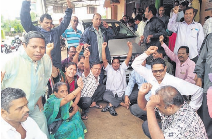
ବିଧାୟକଙ୍କ ଘର ଘେରାଉ କରିଥିବା ଶିକ୍ଷକ ଓ ଅଧ୍ୟାପକମାନେ।