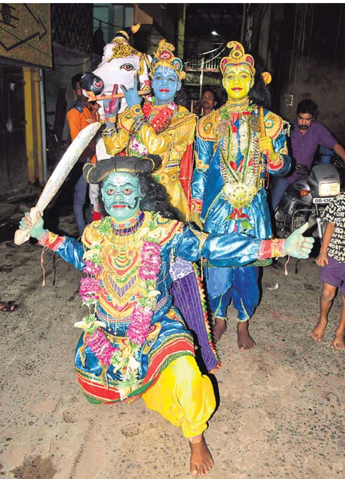
କୃଷ୍ଣଭବେଷ୍ଟ ସାହିରୁ ବାହାରିଥିବା କୃଷ୍ଣ, ବଳରାମ ଓ ସେନୁକାସୁର ବେଶଧାରୀ।

ବିଜେ କରିଥିଲେ। ସେଠାରୁ ଆଜ୍ଞାମାଳ କୃଷ୍ଣଭବେଷ୍ଟ ସାହି ପକ୍ଷରୁ ଧେନୁକାସୁର ପାଇ ଜଗମୋହନରେ ପଡ଼ିଥିବା ଖଟ ଏହାକାଳ ପ୍ରସ୍ତାବ ଆଗତ ହୋଇଥିଲା। ଉପରେ ବିଜେ ହୋଇଥିଲେ। ସେଠାରେ ଧେନୁକାସୁରକୁ ରାମ, କୃଷ୍ଣ ବଧ କରିଥିଲେ।