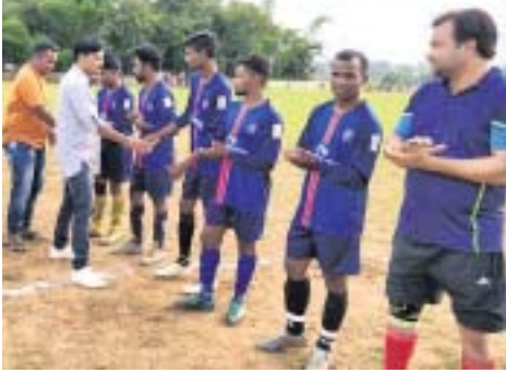
ଅତିଥିମାନେ ଖେଳାଳିଙ୍କ ସହ କରମର୍ଦନ କରୁଛନ୍ତି ।

ଶିକ୍ଷୟିତ୍ରୀଙ୍କୁ ବଦଳି କରାଯିବ । ପାଟଣା , ଶ୍ରେଣୀ ଗୁଡ଼ି ପାଇଁ ଅନୁଦାନ ଦିଆଯିବ ବୋଲି ଡିପିଓ କହିଥିଲେ । କିନ୍ତୁ ଗ୍ରାମବାସୀ ସମସ୍ତ ଶିକ୍ଷକ ଶିକ୍ଷୟିତ୍ରୀଙ୍କ ବଦଳି ଦାବିରେ ଅଟଳ ରହିଥିଲେ । ସମସ୍ତ ଶିକ୍ଷକ ଶିକ୍ଷୟିତ୍ରୀଙ୍କ ବଦଳି କରା ନ ଗଲେ ଷ୍ଟୁଲ ତାଲା ଖୋଲି ଯିବ ନାହିଁ ବୋଲି ଗ୍ରାମବାସୀ କହିଥିଲେ । ସୋମବାର ଜିଲ୍ଲାପାଳଙ୍କ ସହ ଆଲୋଚନା କରାଯାଇ ପଦକ୍ଷେପ ନିଆଯିବ ବୋଲି ପ୍ରଶାସନିକ ଅଧିକାରୀମାନେ କହିଥିଲେ ।