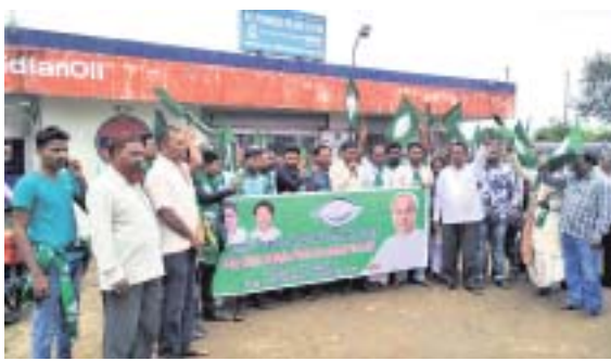
ତାକୁରାଁଠାରେ ବିଜେଡି କର୍ମୀମାନେ ବିରୋଧ ପ୍ରଦର୍ଶନ କରୁଛନ୍ତି ।