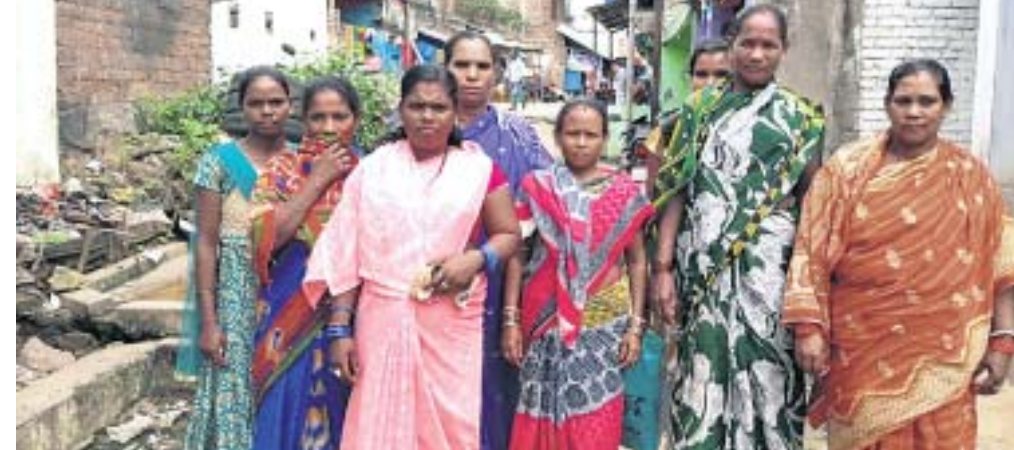
ଆନାଧିକାରୀଙ୍କୁ ସ୍ମାରକପତ୍ର ଦେବା ପାଇଁ ଆସିଥିବା ସ୍ଵୟଂ ସହାୟକ ଗୋଷ୍ଠୀର ସଦସ୍ୟମାନେ।

କରୁଛନ୍ତି। ଏଥିଯୋଗୁଁ ଗ୍ରାମର ପରିବେଶ ନଷ୍ଟ ହେବା ସହ ପିଲା ଓ ଯୁବବର୍ଗଙ୍କ ଉପରେ କ୍ଷୁଦ୍ରଭାବ ପଡ଼ୁଛି। ସେମାନେ ମଦ ପିଇ ବିପଦଗ୍ରାମୀ ହେବାର ଆଶଙ୍କା ରହୁଛି। ସେହିପରି ପରିବାରଗୁଡ଼ିକରେ ଅଶାନ୍ତିର ବାତାବରଣ ସୃଷ୍ଟି ହେଉଛି। ଗ୍ରାମରେ ଏଭଳି ସ୍ଥିତି ଯୋଗୁଁ ବିକାଶ କାର୍ଯ୍ୟ