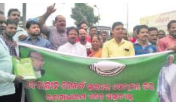
ନବରଙ୍ଗପୁରଠାରେ ଏମ୍ପି ବଳଭଦ୍ର ମାଝି ଓ ବିଜେଡି ନେତାମାନେ ବିରୋଧ କରୁଛନ୍ତି ।