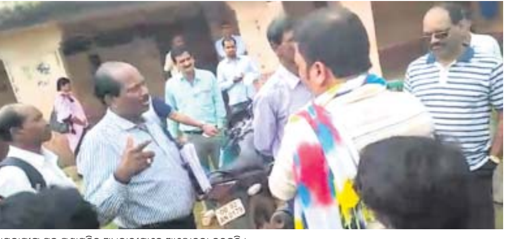
ଗ୍ରାମବାସୀଙ୍କ ସହ ପ୍ରଶାସନିକ ଅଧିକାରୀମାନେ ଆଲୋଚନା କରୁଛନ୍ତି ।