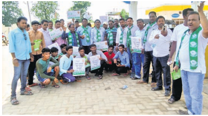
ଶନିବାର ମାଲକାନଗିରି ଓ କାଲିମେଳାରେ ଅନୁଷ୍ଠିତ ହୋଇଥିବା ବିଜେଡିର ବିରୋଧ କାର୍ଯ୍ୟକ୍ରମ ।