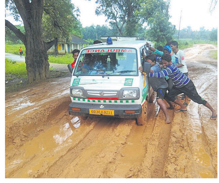
ଫସିଯାଇଥିବା ୧୦୨ ଆୟୁଲାରୁ ସ୍ୱଚ୍ଛମାନେ ଠେଲି ବାହାର କରୁଛନ୍ତି ।

କାଦୁଅ ରାସ୍ତାରେ ଫସିଲା ଆୟୁଲାରୁ ଗର୍ଭବତୀ ମହିଳାଙ୍କୁ ସ୍ୱାସ୍ଥ୍ୟକେନ୍ଦ୍ର ଆଣୁଥିବା ବେଳେ ୧୦୨ ଆୟୁଲାରୁ କାଦୁଅରେ ଫସିଯାଇଥିବା ଶନିବାର ଦେଖିବାକୁ ମିଳିଥିଲା । ପରେ ସ୍ଥାନୀୟ ସ୍ୱଚ୍ଛମାନେ ଆୟୁଲାରୁ ଠେଲି କାଦୁଅକୁ ବାହାର କରିଥିଲେ । ମାଲକାନଗିରି ଜିଲ୍ଲା ମାଥୁଲି ବ୍ଲକ ଅନ୍ତର୍ଗତ ସିନ୍ଧାବେଡ଼ା ପୁଖ୍ୟାସରାରେ ତେତେଜା ପଞ୍ଚାୟତରୁ ଗର୍ଭବତୀ ମହିଳାଙ୍କୁ ସ୍ୱାସ୍ଥ୍ୟକେନ୍ଦ୍ର ଆଣୁଥିବା ୧୦୨ ଆୟୁଲାରୁ ରାସ୍ତାରେ ଦବି ଯାଇଥିଲା । ବହୁ ଚେଷ୍ଟା ସତ୍ତ୍ୱେ ଗାଡି ବାହାରିପାରୁ ନ ଥିଲା । ଏହା ଦେଖି ସିନ୍ଧାବେଡ଼ା ଗ୍ରାମର କିଛି ସ୍ୱଚ୍ଛ ମୁବକ ଗାଡିକୁ ଠେଲିଥିଲେ । ଫଳରେ ଆୟୁଲାରୁ ଦବିଯାଇଥିବା ସ୍ତ୍ରୀଙ୍କୁ ବାହାରିଥିଲା । ଏହାପରେ ଗର୍ଭବତୀ ମହିଳାଙ୍କୁ ଆଣି ମାଥୁଲି ଗୋଷ୍ଠୀ ସ୍ୱାସ୍ଥ୍ୟକେନ୍ଦ୍ରରେ ପହଞ୍ଚାଇଥିଲା । ଏଭଳି ଘଟଣା ପ୍ରଥମ ଥର ରୁହେଁ ବର୍ଷ ବାରମ୍ବାର ଘଟିଚାଲିଛି ।