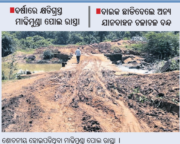
ଶୋଚନୀୟ ହୋଇପଡିଥିବା ମାଡିମୁଣ୍ଡା ପୋଲ ରାସ୍ତା ।

ମାଲକାନଗିରି ଜିଲ୍ଲା ମାଥିଲି ବ୍ଲକ ଅନ୍ତର୍ଗତ ଦୁର୍ଗମ ମାଡିମୁଣ୍ଡା ପୋଲ ରାସ୍ତା ସାମାନ୍ୟ ବର୍ଷାରେ ହେହାଲ ହୋଇପଡିଛି । ଶୋଚନୀୟ କାବୁଆ ରାସ୍ତା ଯୋଗୁ ଯାତାୟାତରେ ସମସ୍ୟା ସୃଷ୍ଟି ହୋଇଛି ।