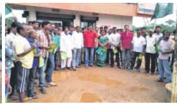
ରାୟଗଡ଼ାଠାରେ ବିରୋଧ କରାଯାଇଛି ।