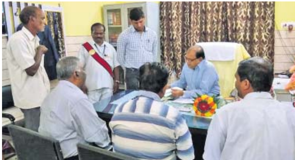
ଲୋକ ଅଦାଲତରେ ମାମଲାର ଫଇଦାଲା କରାଯାଇଛି।