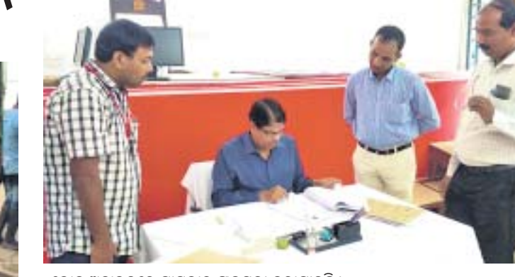
ଲୋକ ଅଦାଲତରେ ମାମଲାର ଫାଇସଲା କରାଯାଇଛି ।