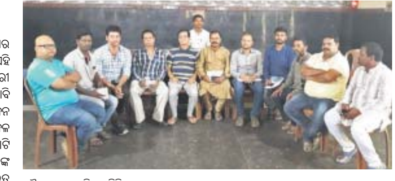
ବୈଠକରେ ଉପସ୍ଥିତ କମିଟିର ସଦସ୍ୟ ଏବଂ ଅନ୍ୟମାନେ ।

ନବରଙ୍ଗପୁର ମହାବିଦ୍ୟାଳୟ ଜିଲାର ସର୍ବପୁରାତନ । ୪୮ ବର୍ଷ ଧରି ଏହି ମହାବିଦ୍ୟାଳୟକୁ ବିଭିନ୍ନ ସମୟରେ ସରକାରୀ ମାନ୍ୟତା ପାଇଁ ସରକାରଙ୍କ ନିକଟରେ ଦାବି କରାଯାଇଛି । ଛାତ୍ର ସଙ୍ଗଠନ ମଧ୍ୟ ଆନ୍ଦୋଳନ କରିଛି । ୩୧ ତାରିଖରେ ମୁଖ୍ୟମନ୍ତ୍ରୀ କେବଳ ଭିଜିଲୁମ୍ ବିକାଶ ପାଇଁ ଦେଉ କୋଟି ଟଙ୍କା ଘୋଷଣା କଲେ । ଜିଲ୍ଲାବାସୀଙ୍କ ବିଶ୍ୱାସ ଓ ଦାବୀକୁ ସରକାର ଗୁରୁତ୍ୱ ଦେଉନାହାନ୍ତି । ନବରଙ୍ଗପୁର ଆଦିବାସୀ