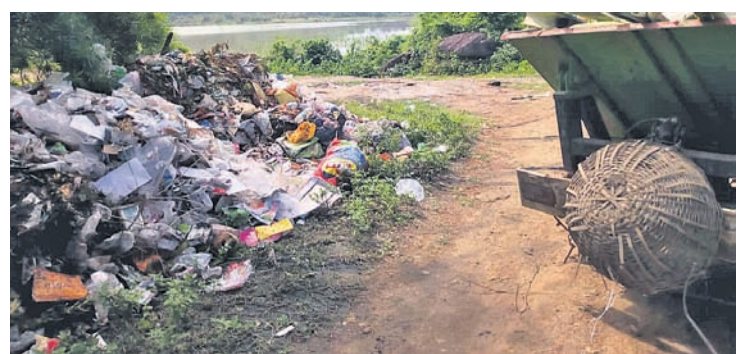
ପୌର ପରିଷଦ ଗଦା କରିଥିବା ଅଳିଆ ।