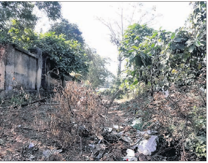
ଅସ୍ଥାୟୀ ମାଛ ପିଣ୍ଡି ପାଇଁ ଚିହ୍ନଟ ହୋଇଥିବା ସ୍ଥାନ।

ଜିଲା ମୁଖ୍ୟ ଚିକିତ୍ସାଳୟ ପଛପଟେ ଥିବା ଦିଆନକ ବନ୍ଧଠାରେ ଅସ୍ଥାୟୀ ମାଛ ମାର୍ଜେଟ୍ ହେବା ନେଇ ୨ ବର୍ଷ ହେଲା କୁହାଯାଉଥିବା ବେଳେ ଏ ଦିଗରେ କୌଣସି ଅଗ୍ରଗତି ହୋଇପାରୁନାହିଁ। ଏପରି କି ପିଣ୍ଡିର ମୂଳଦୁଆ ରୋଡ଼ ଥିବା ଦେଖିବାକୁ ମିଳିଛି। ଫଳରେ ବେପାରୀମାନେ ରାସ୍ତା କଡ଼ରେ ଆମିଶ ଦ୍ରବ୍ୟ ବିକ୍ରି କରିବାକୁ ବାଧ୍ୟ ହୋଇଛନ୍ତି। କହିବାକୁ ଗଲେ ଏନ୍‌ଏସି ବେପାରୀମାନଙ୍କୁ ପିଣ୍ଡି ଓ ଭେଣ୍ଡିଂ ଜୋନ୍ ଯୋଗାଇଦେବାରେ ବିଫଳ ହୋଇଛି। ସୂଚନାଯୋଗ୍ୟ ଯେ ଏନ୍‌ଏସି