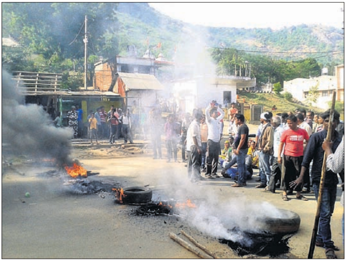
ଖଣ୍ଡପଡ଼ା ରୋଡ଼ଠାରେ ବେପାରୀମାନଙ୍କ ତରଫରୁ ହୋଇଥିବା ରାସ୍ତାଗୋଟା (ଫାଇଲ୍ ଫଟୋ)।

ବାରମ୍ବାର ଦାବି ଓ ଆନ୍ଦୋଳନ ପରେ ନୟାଗଡ଼ ଏନ୍‌ଏସି ତରଫରୁ ଭଠାଦୋକାନୀଙ୍କ ସମସ୍ୟା ସମାଧାନ ପାଇଁ ପଦକ୍ଷେପ ନିଆଯାଇଥିଲା। ପରିବାର ଦୋକାନୀଙ୍କ ପାଇଁ ଭେଣ୍ଡିଂ ଜୋନ୍ ଓ ମାଛ, ମାଂସ ବେପାରୀଙ୍କ ଲାଗି ପିଣ୍ଡି କରାଯିବାକୁ ଯୋଜନା ହୋଇଥିଲା। କିନ୍ତୁ ଏନ୍‌ଏସିର ଅପାରଗତା ଯୋଗୁଁ ତାହା ଏପର୍ଯ୍ୟନ୍ତ କାର୍ଯ୍ୟକାରୀ ହୋଇପାରି ନାହିଁ। ଫଳ ସ୍ୱରୂପ ପୂର୍ବଭଳି ଭଠା ଦୋକାନୀ ଯିଏ ଯେଉଁଠି ପାରିଲେ ସସରା ମେଲାଲ ବସୁଛନ୍ତି। ଏପରିସ୍ଥିତି ପାଖାପାଖି ଦେଢ଼ବର୍ଷ ବ୍ୟବଧାନ ପରେ ଶନିବାର ନୟାଗଡ଼ ଏନ୍‌ଏସି ପକ୍ଷରୁ ସହରର ରାସ୍ତା କଡ଼ରେ ଥିବା ଭଠା ଦୋକାନୀଙ୍କୁ ହଟାଯାଇଛି। ହେଲେ ବର୍ତ୍ତମାନ ପରିବାର କିପରି ଚଳିବ ସେହି ଦିଗରେ ଅଛନ୍ତି ସେମାନେ। ପୁରୁଣା ବ୍ୟବସାୟରେ ବିକ୍ରି କରୁଥିବା ଜଣେ ବେପାରୀ କହିବା କଥା ଯେ, ଏନ୍‌ଏସି ତରଫରୁ ଆମକୁ ଭେଣ୍ଡିଂ ଜୋନ୍ କରି ଥିଲେ ଆମର ଦୋକାନୀ ଫଳରେ ପରିବାର ପ୍ରତିପୋଷଣ ପାଇଁ ରାସ୍ତା କଡ଼ରେ ବେପାର କରୁଛି। ପ୍ରକାଶ ଯେ, ନାରାୟଣ ପାଳ ଆଗରେ ଥିବା ପାଳି ଷ୍ଟାଣ୍ଡ ପାଇଁ ଜାଗା, ପୁରୁଣା ବ୍ୟବସାୟ କଡ଼, ସହର ଦେଇ ଯାଇଥିବା ଜାତୀୟ ରାଜପଥ ପାର୍ଶ୍ୱରେ ଭଠା ଦୋକାନୀମାନେ ପ୍ରତିଦିନ