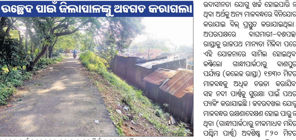
ମାଳବନ୍ଧ ପାର୍ଶ୍ୱ ଜବରଦଖଲ କରାଯାଇ ଗୃହ ନିର୍ମାଣ କରାଯାଇଛି।

ମହାନଦୀରେ ବନ୍ୟା ଆସିଲେ ଖଣ୍ଡପଡ଼ା ବୁକର କଣ୍ଠିଲୋ ଅଞ୍ଚଳବାସୀଙ୍କ ପାଇଁ ବିପଦ ସୃଷ୍ଟି କରିଥାଏ। ଏହାକୁ ସୃଷ୍ଟିରେ ରକ୍ଷା ଦିଆଯାଇ ପକ୍ଷରୁ ବିଭିନ୍ନ ସ୍ଥାନରେ ମାଳବନ୍ଧ ନିର୍ମାଣ କରାଯାଇଛି। ଏହାର ରକ୍ଷଣାବେକ୍ଷଣ ପାଇଁ ମଧ୍ୟକୋଟିକୋଟିକା ବ୍ୟୟ କରାଯାଇଛି। ହେଲେ କେତେକ ସ୍ଥାନରେ ଜବରଦଖଲ ଯୋଗୁଁ ମାଳବନ୍ଧ ମରାମତି ହୋଇପାରୁ ନାହିଁ। ସମ୍ପ୍ରତି କଣ୍ଠିଲୋ ଗାନ୍ଧୀପାର୍ଚ୍ଚଠାରୁ ବାଗପୁର (କଲେଜ) ମାଳବନ୍ଧକୁ ରାଜପଥ ଯୋଗରେ ରାସ୍ତା ନିର୍ମାଣ ପରେ ଅବଶିଷ୍ଟ ମାଳବନ୍ଧ ଦୁର୍ବଳ ହୋଇପଡିଛି। ମାଳବନ୍ଧ ଉପରେ ଜବରଦଖଲକାରୀଙ୍କ ଦ୍ୱାରା ନିର୍ମାଣ ହୋଇଥିବା ସ୍ଥାୟୀଗୃହ ଓ କ୍ୟାବିନ ଆବଶ୍ୟକ ମରାମତି କାର୍ଯ୍ୟରେ ବାଧ୍ୟ ହୋଇଛନ୍ତି। ଏହି ଜବରଦଖଲ ଗୃହ ଓ କ୍ୟାବିନ ଉଚ୍ଛେଦ ପାଇଁ ଜଳସମ୍ପଦ ବିଭାଗୀୟ କର୍ତ୍ତୃପକ୍ଷ ଖଣ୍ଡପଡ଼ା ତହସିଲଦାର, ବିଭାଗୀୟ ଉଚ୍ଚ ଅଧିକାରୀ ଓ ନୟାଗଡ଼ ଜିଲାପାଳଙ୍କୁ ଅବଗତ କରିଛନ୍ତି। ବିଭାଗୀୟ କର୍ତ୍ତୃପକ୍ଷଙ୍କ ସୂଚନା କ୍ରମେ ୧୯୮୨ ମସିହାର ପ୍ରକାଶନା ବନ୍ୟା ପରଠାରୁ ପ୍ରତିବର୍ଷ ମହାନଦୀର ବନ୍ୟା ସମୟରେ ଦକ୍ଷିଣପାର୍ଶ୍ୱ ମାଳବନ୍ଧ କେତେକ ଦୁର୍ବଳ ସ୍ଥାନରେ ଘାଲ ହୋଇ ବିପଦ ସୃଷ୍ଟି କରିଥାଏ। ସ୍ଥାନୀୟ ଲୋକେ ସେମାନଙ୍କ ଜୀବନ ରକ୍ଷା ପାଇଁ ପ୍ରାୟ