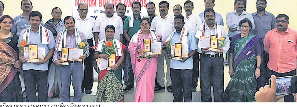
ଅତିଥିମାନଙ୍କ ଗହଣରେ ସମ୍ପର୍କିତ ଶିକ୍ଷକମାନେ।