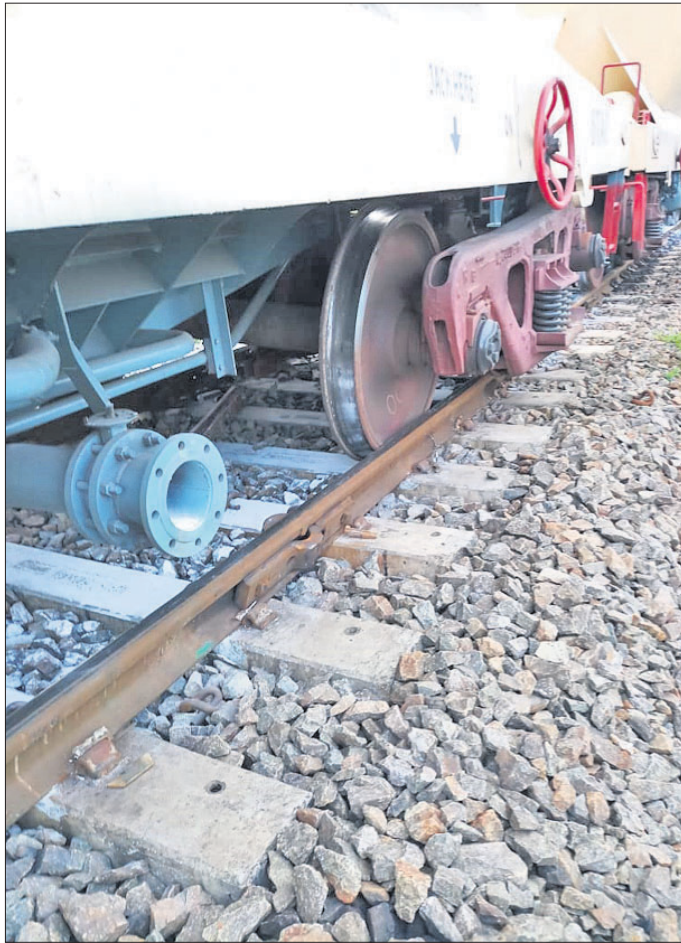
ରେଳ ଧାରଣାରୁ ଖସିଯାଇଥିବା ମାଲବାହୀ ଟ୍ରେନ୍ ।

କୋରାପୁଟ ଜିଲ୍ଲା ବାମନଯୋଡ଼ି ରେଳଷ୍ଟେସନ ନିକଟରେ ମାଲକୋର ଆଲୁମିନା ବୋର୍ଡେଇ ଟ୍ରେନ୍ ଲାଇନରୁ୍ୟତ ହୋଇଛି। ଫଳରେ କୋରାପୁଟ-ବାମନଯୋଡ଼ି-ରାଉରକେଲା ଲାଇନରେ ସମସ୍ତ ଟ୍ରେନ୍ ଚଳାଚଳ ବାଧିତ ହୋଇଛି। ନାଲକୋ ଆଲୁମିନା ବୋର୍ଡେଇ ଟ୍ରେନ୍ ରବିବାର ଅପରାହ୍ଣ ୪ଟା ୩୦ରେ ବାମନଯୋଡ଼ିରୁ କୁମ୍ଭିରିପୁଟ ଅଭିମୁଖେ ବାହାରିଥିଲା। ବାମନଯୋଡ଼ି