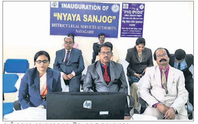
କାର୍ଯ୍ୟକ୍ରମରେ ଯୋଗଦେଇଥିବା ଜିଲା ଜଜ୍ ଓ ଅନ୍ୟମାନେ।