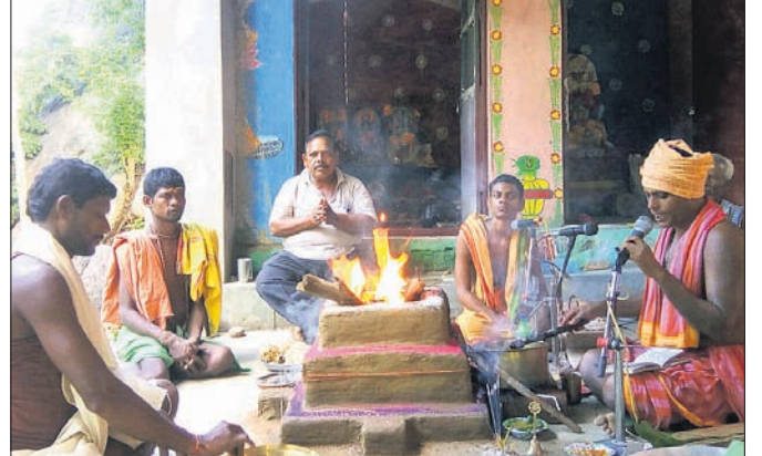
ପୀଠରେ ପୂଜାର୍ଚ୍ଚନା କରାଯାଇଛି।

ଉପଲକ୍ଷେ ବିବାହାତ୍ର ବାଦୀ ସଂକୀର୍ତ୍ତନ ମଣ୍ଡଳୀ ଦ୍ୱାରା ନାମଯଜ୍ଞ ଚାଳିଥିଲା। ମର୍ଦ୍ଦରାଜପୁର ତ୍ରିନାଥ ଠାକୁର ସେବା ସଂଘଙ୍କ ସହଯୋଗରେ ତଥା କାର୍ଯ୍ୟକ୍ରମ ୭ମ ବାର୍ଷିକ ଉତ୍ସବ ଅନୁଷ୍ଠିତ ହୋଇଥିଲା। ପୂର୍ବାହ୍ନରେ ଶ୍ରଦ୍ଧାଳୁମାନେ ପାଣି ଚୋଳିବା ପରେ କାର୍ଯ୍ୟକ୍ରମ ଆରମ୍ଭ ହୋଇଥିଲା। କାର୍ଯ୍ୟକ୍ରମ ପରେ ଠାକୁରଙ୍କ ହୋମଯଜ୍ଞ କାର୍ଯ୍ୟ କରାଯାଇଥିଲା। ଏହି