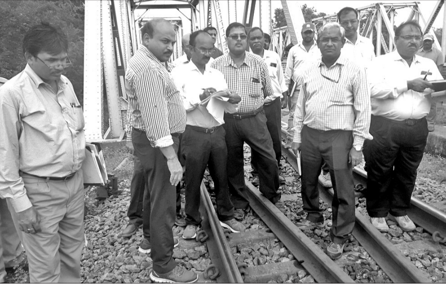
ରେଳ ସୁରକ୍ଷା ଆୟୁକ୍ତ ସମ୍ବଲପୁର ରେଳପକ୍ଷ ବିଦ୍ୟୁତ୍ କରଣ କାର୍ଯ୍ୟ ତଦାରଖ କରୁଛନ୍ତି ।