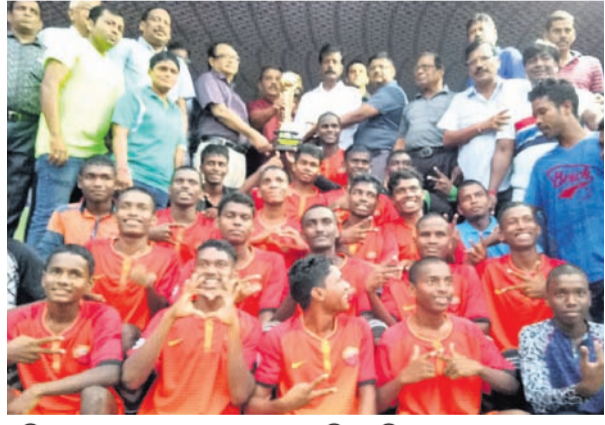
ମୂଳିକାଲକ୍ଷ୍ମୀ କପ୍ ଆନ୍ତର୍ଜାତୀୟ ଫୁଟବଲ ଚାମ୍ପିୟନ କପ୍ ଦଳ ।