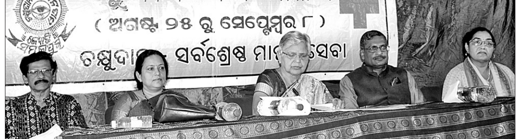
ଶିବିରର ଯତ୍ନରେ ଶ୍ରୀମତୀ ଆୟୋଜିତ ଚକ୍ଷୁଦାନ ପକ୍ଷ ଉତ୍ସବରେ ମଞ୍ଚାଧ୍ୟକ୍ଷ ଅଟେ ।

ଚକ୍ଷୁଦାନ ପକ୍ଷ ଶିବିରର ଅଧିକାରୀ ଶ୍ରୀମତୀ ସର୍ବଶ୍ରେଷ୍ଠ ମାତା ସେବା