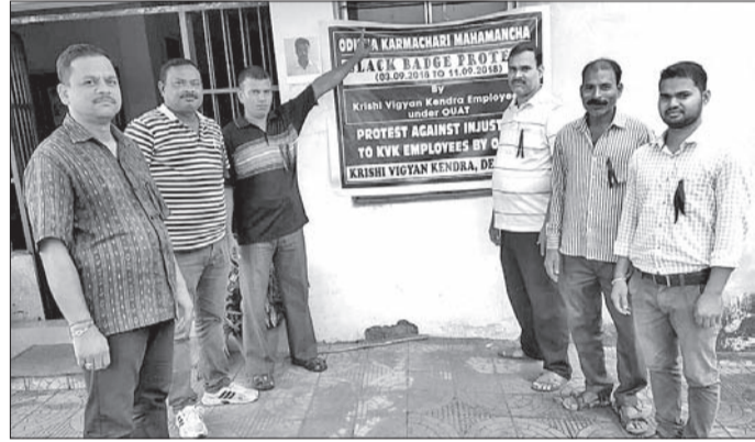
କଳାବ୍ୟାଙ୍କ ପରିଧାନ କରି ଆନ୍ଦୋଳନର କର୍ମଚାରୀ ।

ଦେବଗଡ଼, ୯/୯ (ସ୍ଵ.ପ୍ର.) ଓଡ଼ିଶା କୃଷି ଓ ବୈଷୟିକ ବିଶ୍ଵ ବିଦ୍ୟାଳୟ (ଓୟୁଏଟି) ଅଧୀନସ୍ଥ ଦାବି କୃଷି ବିଜ୍ଞାନ କେନ୍ଦ୍ରର ସମସ୍ତ ବୈଜ୍ଞାନିକ ଓ କର୍ମଚାରୀ କ୍ରମେ ଓୟୁଏଟିର ବୈମାତୃକ ମନୋଭାବ ବିରୋଧରେ କଳାବ୍ୟାଙ୍କ ପରିଧାନ ପୂର୍ବକ ଆନ୍ଦୋଳନ କରି ରଖିଥିବାବେଳେ ଏହା ଉଦ୍‌ବିଗ୍ନ ସପ୍ତମ ଦିନରେ ପହଞ୍ଚିଛି । ଏହି କର୍ମଚାରୀମାନେ ଓୟୁଏଟିରୁ ବିଜ୍ଞାନ ସମୟରେ ଅବହେଳା ଏବଂ ନିର୍ଯାତନାର ଶୀକାର ହୋଇଥିବା ଅଭିଯୋଗ କରିଛନ୍ତି । ଏହି