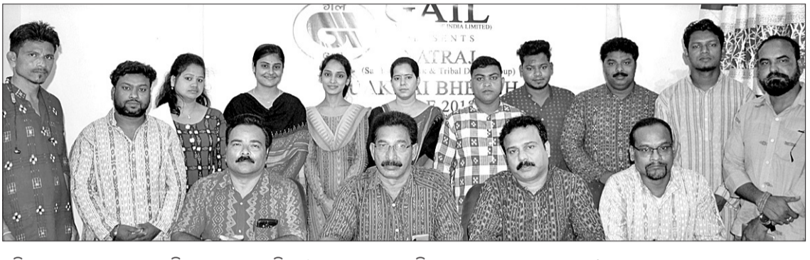
ରବିବାର ସମ୍ବଲପୁରରେ ଆୟୋଜିତ ଖବରଦାତା ସମ୍ମେଳନରେ ନରକାଳ ସାଂସ୍କୃତିକ ଅନୁଷ୍ଠାନର କଳାକାରମାନେ ।