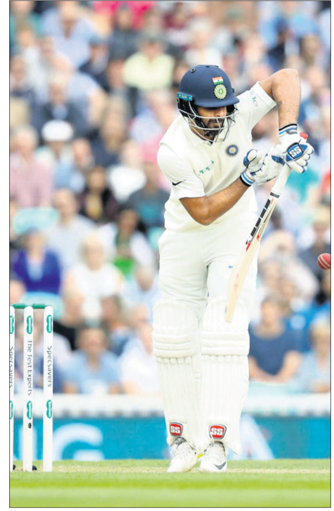
ଅର୍ଦ୍ଧଶତକୀୟ ଇନିଂସ ଅବସରରେ ଭାରତର ହନୁମା ବିହାରୀ ।

ଲଣ୍ଡନ, ୯/୯ (ପି.ଟି.): ସ୍ଥାନୀୟ ଓଭାଲ ଗ୍ରାଉଣ୍ଡରେ ଚାଲିଥିବା ଇଂଲଣ୍ଡ ବିପକ୍ଷ ପ୍ରଥମ ଟେଷ୍ଟରେ ଇଂଲଣ୍ଡ ପ୍ରଥମ ଇନିଂସରେ ଅଗ୍ରଣୀ ହାସଲ କରିଛି।