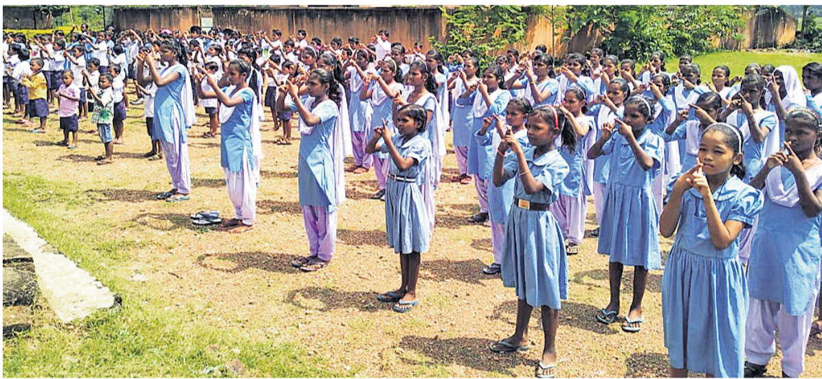
ଧରତ୍ରୀ ଏବଂ ଓଡ଼ିଶା ପୋଷ୍ଟର ସ୍ଵାସ୍ଥିକ ପ୍ରି ଓଡ଼ିଶା ଅଭିଯାନକୁ ସମର୍ଥନ ଜଣାଇଛନ୍ତି ରାଉରକେଲା ମହାନଗର ନିଗମ ଅନ୍ତର୍ଗତ ଅପୁରଜପଲ ଭକ୍ତ ପ୍ରାଥମିକ ବିଦ୍ୟାଳୟର ଶିକ୍ଷୟିତ୍ରୀ ଶିକ୍ଷକ (ଉପର), ଛାତ୍ରୀଛାତ୍ର ।