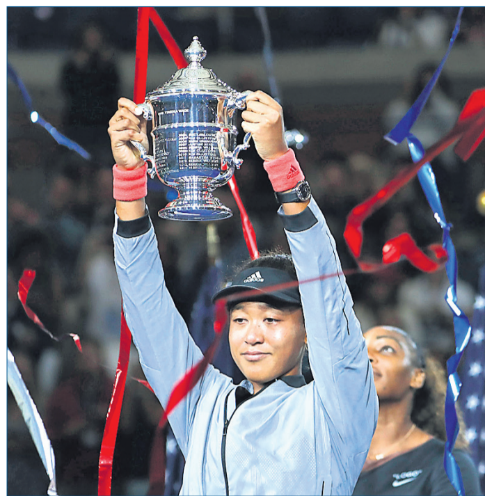
ଚାମ୍ପିୟନ ଚୁପ୍ ଯେ ନାଓନି ଓସାକା।

ନ୍ୟୁୟାର୍କ, ୯।୯ (ଏ.ଏ.ପି.) ନାଓନି ଓସାକା ପ୍ରଥମ ଜାପାନ ଚେମ୍ପିୟ ଖେଳାଳିଭାବେ ଯୁଏସ୍ ଓପେନ୍ ଚାଉଚଳ ହାସଲ କରି ଇତିହାସ ସୃଷ୍ଟି କରିଛନ୍ତି।