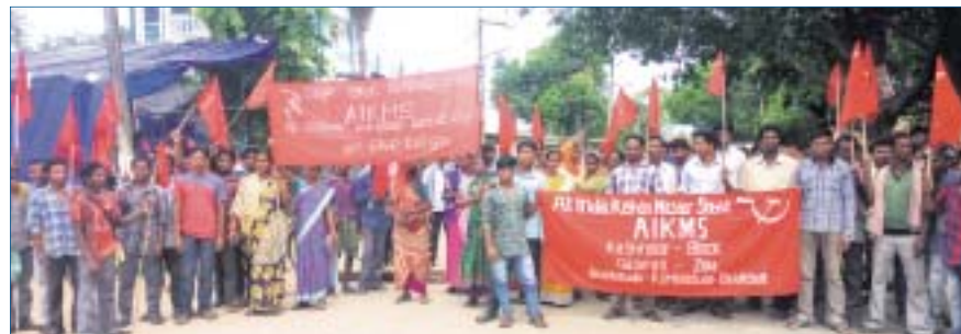
କାଶୀନଗର ଷ୍ଟେବ୍ୟାଙ୍କ ଛକ ।