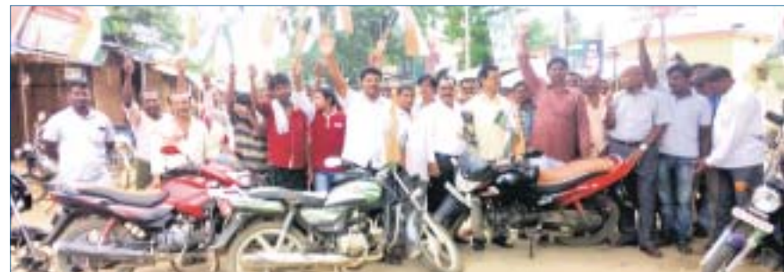
କାଶୀନଗର ଫରେଷ୍ଟ ଛକ ।