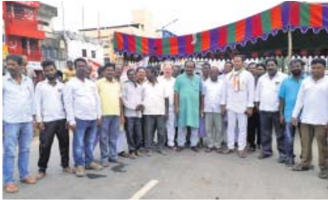
ରାୟଗଡ଼ାରେ କଂଗ୍ରେସ କର୍ମୀମାନେ ବନ୍ଦ ପାଳନ କରୁଛନ୍ତି ।

ରାୟଗଡ଼ା ଅଫିସ/ ଗୁଣପୁର/ ଚନ୍ଦ୍ରପୁର/ ପୁନିଗୁଡ଼ା/ ଚିକିରି/ ଗୁଡ଼ାଚା/ଆଧ୍ୟାୟ ଦାଳା/କଲ୍ୟାଣସିଂହପୁର/କାଶୀପୁର/ ବିଷମକଟକ, ୧୦/୯(ଡି.ଏନ.ଏ)