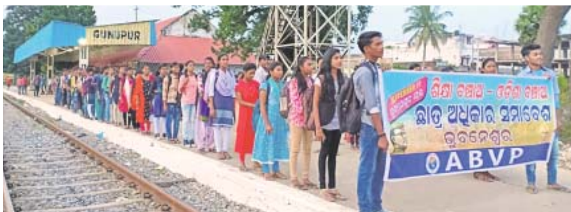
ଗୁଣପୁର ଷ୍ଟେଶନଠାରେ ଥିବା ଛାତ୍ରାଛାତ୍ରୀ ।

ଗୁଣପୁର, ୧୦/୯(ଡି.ଏନ.ଏ) ଶିକ୍ଷା ବନ୍ଧୁଆ ଦାବିରେ ସମାବେଶ ଅନୁଷ୍ଠିତ ହେବ । ଏଥିରେ ରାୟଗଡ଼ା ଜିଲା ଗୁଣପୁର ଏକିଡିପି କଳାପାଳକ ଶାଖା ପକ୍ଷରୁ ଶତାଧିକ ଛାତ୍ରାଛାତ୍ରୀ ମଞ୍ଜଳଦାର ଭୂବନେଶ୍ୱରଠାରେ ଏକଦିନି ପକ୍ଷରୁ ଛାତ୍ର ଅଧିକାର ଏବଂ ସମାବେଶ ଯୋଗ ଦେବେ