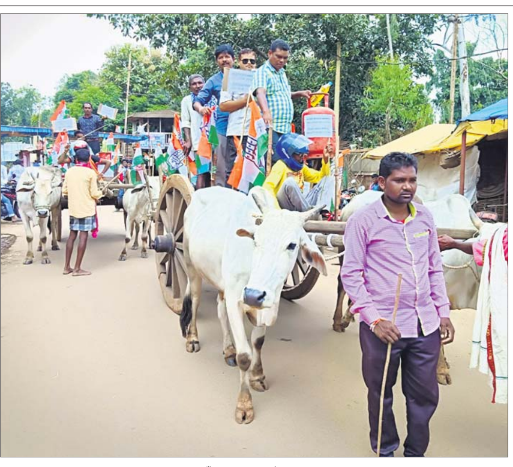
ଡେଇ ଦର ବୃଦ୍ଧିର ପ୍ରତିବାଦକରି ନବରଙ୍ଗପୁର ଜିଲ୍ଲା ଓଡିଗାଁରେ କଂଗ୍ରେସ କର୍ମୀମାନେ ଶଗଡ଼ ଶୋଭାଯାତ୍ରାରେ ସହର ପରିକ୍ରମା କରୁଛନ୍ତି।

ଭୁବନେଶ୍ୱର, ୧୦।୯ (ବୁଧବାର) ପେଟ୍ରୋଲ ଓ ଡିଜେଲ ଦର ବୃଦ୍ଧି ପ୍ରତିବାଦରେ ଅଖିଳ ଭାରତ କଂଗ୍ରେସ କମିଟି (ଏଆଇସିସି) ପକ୍ଷରୁ ଦିଆଯାଇଥିବା ଭାରତ ବନ୍ଦ ଡାକରାର ପ୍ରଭାବ ଓଡ଼ିଶାରେ ଦେଖିବାକୁ ମିଳିଛି। ଏଥିଯୋଗୁଁ ଯୋମବାର ରାଜ୍ୟରେ ଶିକ୍ଷାନୁଷ୍ଠାନ, ଦୋକାନ ବଜାର, ଯାନବାହନ, ରେଳ ଚଳାଚଳ ବନ୍ଦ ରହିଥିଲା। ଓଡ଼ିଶାରେ ବନ୍ଦ ପ୍ରାୟ ୧୫ ଶାନ୍ତିପୂର୍ଣ୍ଣ ରହିଥିଲା ବେଳେ କାଁ ଭାଁ ହିଂସା ଦେଖିବାକୁ ମିଳିଛି। ଲୋକମାନେ ସ୍ୱତଃସ୍ପୃହ ଭାବେ ବନ୍ଦକୁ ସମର୍ଥନ କରି ନେଇଥିବା ଭଳି ମନେହୋଇଥିଲା। ହେଲେ ବ୍ୟବସାୟୀ ଓ ବାଣିଜ୍ୟିକମାନେ ଭଙ୍ଗାଗୁଡ଼ା ଯଦିବା ଆଶଙ୍କା କରିଥିଲେ। ତେଣୁ ଦୋକାନ ବଜାର ସମେତ ବସ୍, ଟ୍ରକ୍, ଅଟୋରିକ୍ସା ଏବଂ ଅନ୍ୟାନ୍ୟ ଯାନବାହନ ଚଳାଚଳକୁ ବନ୍ଦ କରିଦେଇଥିଲେ। କଂଗ୍ରେସ ସହିତ