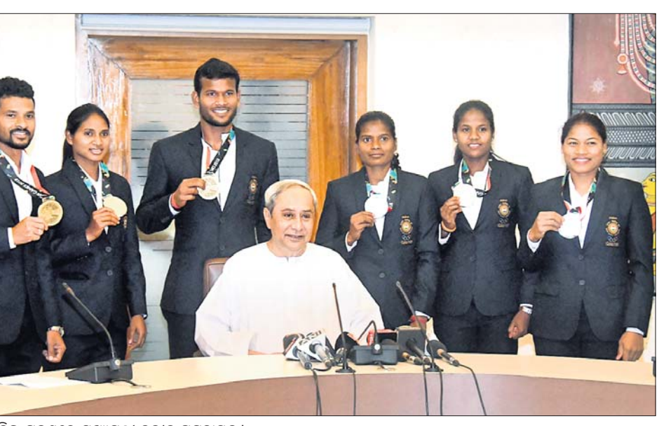
ଓଡ଼ିଆ ଖେଳାଳିଙ୍କ ଗହଣରେ ମୁଖ୍ୟମନ୍ତ୍ରୀ ନବୀନ ପଟ୍ଟନାୟକ ।

ଭୁବନେଶ୍ୱର, ୧୦।୯(ବୁଧବେଳା) ଚଳିତବର୍ଷର ଏସିଆଡ଼ରେ ଭାରତୀୟ ହକି ଦଳରେ ଅଂଶଗ୍ରହଣ କରି ପଦକ ଛିଡା କରିଥିବା ଓଡ଼ିଆ ଖେଳାଳିଙ୍କୁ ମୁଖ୍ୟମନ୍ତ୍ରୀ ନବୀନ ପଟ୍ଟନାୟକ ସୋମବାର ସମ୍ବର୍ଦ୍ଧିତ କରିଛନ୍ତି । ରୌପ୍ୟ ପଦକ ପାଇଥିବା ମହିଳା ଟିମର ୪ଜଣ ଓଡ଼ିଆ ଖେଳାଳିଙ୍କୁ ପ୍ରତ୍ୟେକ ୧କୋଟି ଟଙ୍କା ଲେଖାଏ ପ୍ରଦାନ କରାଯାଇଥିଲା । ସେହିଭଳି ଡ୍ରୋଞ୍ଜି ପଦକ ଛିଡାଥିବା ପୁରୁଷ ଟିମର ଦୁଇ ଜଣଙ୍କୁ ପ୍ରତ୍ୟେକ ୫୦ଲକ୍ଷ ଟଙ୍କା ଲେଖାଏ ପ୍ରଦାନ କରାଯାଇଛି । ଏହି ଅବସରରେ ଖେଳାଳିମାନଙ୍କ ଉଲ୍ଲେଖନୀୟ କୃତିତ୍ୱକୁ ମୁଖ୍ୟମନ୍ତ୍ରୀ ପ୍ରଶଂସା କରିଛନ୍ତି । ସେମାନଙ୍କ ପାଇଁ ଦେଶ ଓ ରାଜ୍ୟରାଜ୍ୟ ଗର୍ବିତ । ଏହି ଖେଳାଳିମାନଙ୍କୁ ଭବିଷ୍ୟତରେ ରାଜ୍ୟ ସରକାର ଆବଶ୍ୟକ ସହାୟତା ଯୋଗାଇଦେବେ ବୋଲି ମୁଖ୍ୟମନ୍ତ୍ରୀ କହିଛନ୍ତି ।