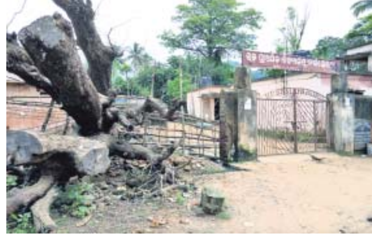
ଗଛପତି ଭାଙ୍ଗିଯାଇଥିବା ପାଚେରି ।

ରାୟଗଡ଼ା ଜିଲା ଚନ୍ଦ୍ରପୁର ବ୍ଲକର ତାଙ୍କସୋରଡ଼ା ପଞ୍ଚାୟତରେ ରହିଛି ଡାକ୍ତରସୋରଡ଼ା ଉଚ୍ଚ ପ୍ରାଥମିକ ବିଦ୍ୟାଳୟ । ସ୍ଥାନୀୟ କପୁରବା ଗାନ୍ଧୀ ବାଲିକା ବିଦ୍ୟାଳୟର ୧୦୦ ଛାତ୍ରା ଆସି ଏଠାରେ ପାଠ ପଢୁଛନ୍ତି । ଗତ ଜୁନରେ ହୋଇଥିବା ପ୍ରକଳ ବର୍ଷା ପବନରେ ଏକ ବଡ଼ ଟେକ୍ସଟିଲ ଉପକ୍ରମ ବିଦ୍ୟାଳୟ ପାଚେରି ଉପରେ ପଡ଼ିଥିଲା । ଫଳରେ ପାଚେରିଟି ସମ୍ପୂର୍ଣ୍ଣ ଭାଙ୍ଗିଯାଇଥିଲା । ଗଛଟି ଏପରି ଅବସ୍ଥାରେ ରହିଛି ଯେ, ପିଲାମାନେ ଉକ୍ତ ରାସ୍ତା ଦେଇ ଯିବାକୁ ଭୟ କରୁଛନ୍ତି । ବର୍ତ୍ତମାନ ବିଦ୍ୟାଳୟରେ ପଢୁଥିବା ମୋଟ ୩୦୨ ଛାତ୍ରାଛାତ୍ରୀ ଅସୁରକ୍ଷିତ ଭାବେ ରହିଛନ୍ତି । ସ୍କୁଲ ପରିସରକୁ ଗାଈ, ଗୋଋ, ଛେଳି କୁକୁର ଅବାଧରେ ପ୍ରବେଶ କରି ହଇରାଣ କରୁଛନ୍ତି