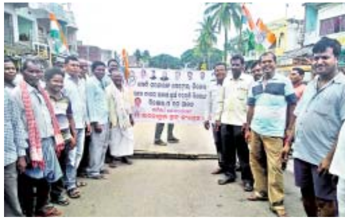
ରାମନାଗୁଡ଼ାରେ କଂଗ୍ରେସ କର୍ମୀମାନେ ରାସ୍ତାରୋକା କରିଛନ୍ତି ।