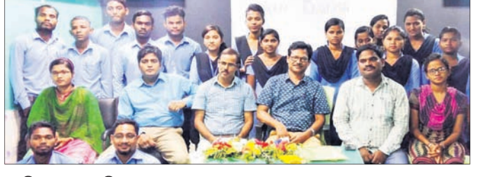
ସେମିନାରରେ ଉପସ୍ଥିତ ଅଧ୍ୟାପକ ଓ ଛାତ୍ରଛାତ୍ରୀ ।