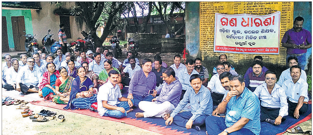
ରଠୁଆଁ ବୁକ କାର୍ଯ୍ୟାଳୟ ସମ୍ମୁଖରେ ଶିକ୍ଷକ, ଅଧ୍ୟାପକ ଓ କର୍ମଚାରୀମାନେ ଧାରଣାରେ ବସିଛନ୍ତି ।