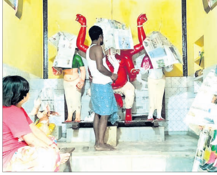
ବୁଢ଼ା ଗଣେଶଙ୍କୁ ରଜା ଦିଆଯାଉଛି ।

ଭଦ୍ରକ ଅଧିକ, ୧୧/୯ ସୈନ୍ଦବ୍ୟ ସମ୍ପର୍କ ଭଦ୍ରକ ସହରରେ ଅଗ୍ରପୁରୀ ଗଣେଶଙ୍କ ପୂଜାର ସ୍ଵାତନ୍ତ୍ର୍ୟ ବାରି ହୋଇପାରେ। ଆସନ୍ତା ୧୩ ତାରିଖରେ ପହୁଣ୍ଡା ଗଣେଶ ପୂଜା ଲାଗି ସାରା ସହର ସଜେଇ ହେବାର ଲାଗିଛି। ପୂଜାମଣ୍ଡପରେ ସାଜସଜ୍ଜା, ମୂର୍ତ୍ତି ନିର୍ମାଣ କାର୍ଯ୍ୟ ଶେଷ ଅବସ୍ଥାରେ ପହଞ୍ଚିଛି। ଏକମାସ ଧରି ଏଠାରେ ହେବାକୁ ଥିବା ବୁଢ଼ା, ଟୋକା ଓ ପିଲା ଗଣେଶଙ୍କ ପୂଜା ଅନ୍ୟବର୍ଷ ଭଳି ଏଥର ଆକର୍ଷଣ ସାଜିବ। ଭସାଣି ଉତ୍ସବ ମଧ୍ୟ ପୃଥକ୍ ପୃଥକ୍ ଭାବେ ହେବ। ପୂଜା ଲାଗି ପ୍ରସ୍ତୁତି କୋର ଧରିଥିବାରୁ ସହର ପରିବେଶ ଉତ୍ସବପୂର୍ଣ୍ଣ ହୋଇ ଉଠିଛି। ଭାଇଚାରର ସହର ଭଦ୍ରକର ପୁରୁଣା ବଜାରରେ ବୁଢ଼ା ଓ ଟୋକା ଗଣେଶ ପୂଜା ପାଇଥାନ୍ତି। କୁଆଁସରେ ପିଲା ଗଣେଶ, କାଞ୍ଚନ ଗଣେଶ ଏବଂ ଅଗ୍ନିକରେ ପେରୁଆ ଗଣେଶଙ୍କ ପୂଜାରେ ଏଠାରେ ଆକର୍ଷଣ ହୋଇ ରହି ଆସିଛି। କୁଆଁସରେ ମେଢ ତିଆରି ଓ ଅନ୍ୟ ପ୍ରସ୍ତୁତି କାର୍ଯ୍ୟ ଏକ ପ୍ରକାର ଶେଷ ପର୍ଯ୍ୟାୟରେ। ଚଳିତ ବର୍ଷ ଏହି