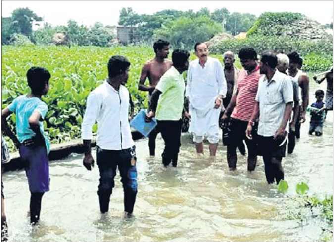
ମାଧ୍ୟମ ଗ୍ରାମ୍ୟ ରାସ୍ତା ଉପରେ ବନ୍ୟାପାଣିର ସୁଅ ବାଲିଛି ।

ପାଣିରେ ବୁଡ଼ି ରହିଛି । କେତେକ ପରିବାର ଜଳବନ୍ୟା ହୋଇ ରହିଛନ୍ତି । ଉପର ମୁଣ୍ଡରୁ ବନ୍ୟାପାଣି କମିଥିଲେ ବି ଛୁଆର ପ୍ରଭାବରୁ ଚଳିଆ ଅଞ୍ଚଳରେ ବନ୍ୟା ଛୁଟି ଯୋଗୁ ଲୋକଙ୍କ ଦୁର୍ଦ୍ଦଶା ବଢ଼ିବାରେ ଲାଗିଛି । ଆଜିକୁ ୫ ଦିନ ହେଲା ବନ୍ୟା ପାଣିରେ ଆରତି, ଘଟପୁର, ନାଲଗୁଣ୍ଡା, ଭୁଇଁବୁଝି, ଚେନ୍ଦ୍ରକିଶି ଓ