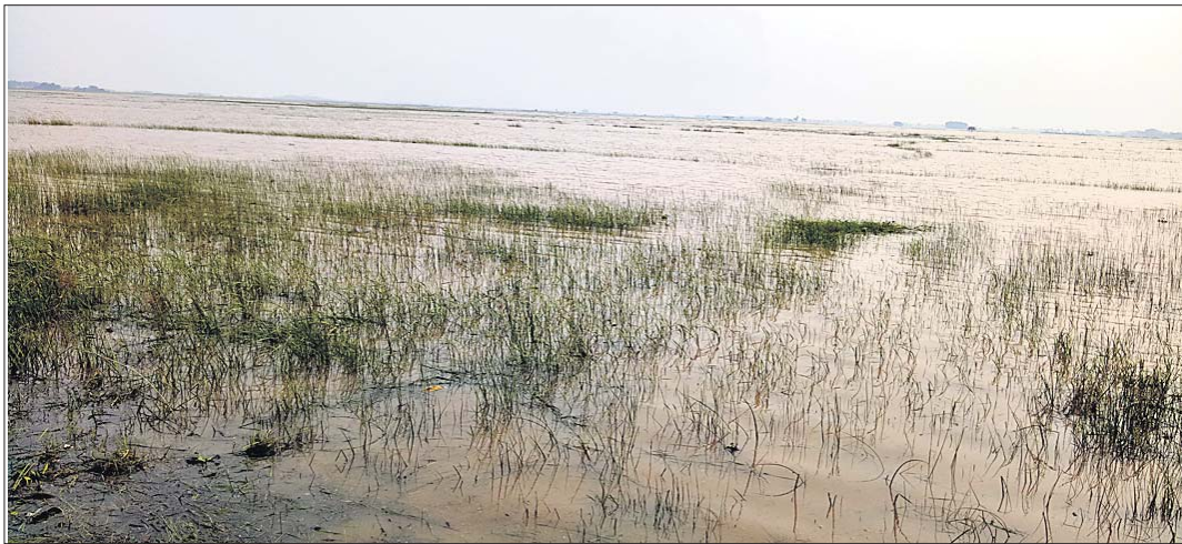
ଚାଷଜମି ବନ୍ୟା ପାଣିରେ ବୁଡ଼ି ରହିଛି ।