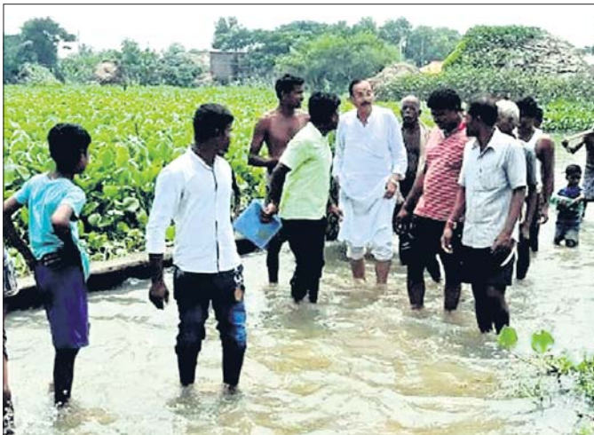
ମାଧ୍ୟମ ଗ୍ରାମ୍ୟ ରାସ୍ତା ଉପରେ ବନ୍ୟାପାଣିର ସୁଅ ବାଲିଛି ।

ଭଦ୍ରକ ଜିଲ୍ଲା ଉପକୂଳବର୍ତ୍ତୀ ବାଲେଶ୍ୱର ଜିଲ୍ଲାରେ ବନ୍ୟା ପ୍ରଭାବିତ ଅଞ୍ଚଳରେ ଏଯାବତ୍ ସୁଧା ଥିବା ଆସି ନାହିଁ । ମାଧ୍ୟମ, ଘଟପୁର, ନାଲଗୁଣ୍ଡା, ଭୁଇଁବୁଝି, ଚେନ୍ଦ୍ରକିଶି, ବାଲିଗାଁ ପରି କେତେକ ପଞ୍ଚାୟତ ଅଞ୍ଚଳରେ ବନ୍ୟାଜଳ ବିଭିନ୍ନ ଗାଁ ରାସ୍ତା ଉପରେ ପ୍ରବାହିତ ହେଉଛି । ଏଥିଲାଗି ଗମନାଗମନ ବାଧାପ୍ରସ୍ତ ହୋଇଛି । ବ୍ୟାପକ ଚାଷ ଜମି