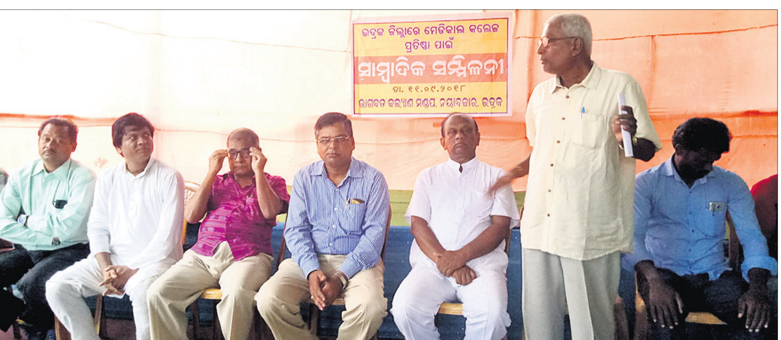
ଭାରତୀୟ କଲ୍ୟାଣ ମଣ୍ଡଳରେ ଆହୁତ ଖବରଦାତା ସମ୍ମିଳନୀରେ ବିଭିନ୍ନ ସାମାଜିକ ସଂଗଠନ କର୍ମକର୍ତ୍ତା।