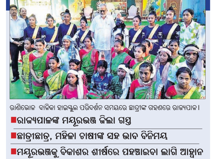
ରାଣିଗୋଳ ବାଲିକା ହାଲସ୍କୁଲ ପରିବର୍ତ୍ତନ ସମୟରେ ଛାତ୍ରୀଙ୍କ ଗହଣରେ ରାଜ୍ୟପାଳ ।