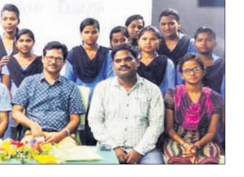
ରାଣିଗୋଳ ବାଲିକା ହାଲସ୍କୁଲ ପରିବର୍ତ୍ତନ ସମୟରେ ଛାତ୍ରୀଙ୍କ ଗହଣରେ ରାଜ୍ୟପାଳ ।