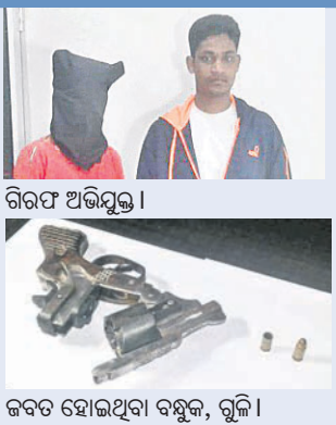
ଜବତ ହୋଇଥିବା ବନ୍ଧୁକ, ଗୁଳି।

କଇପୁର ସହରରେ ମଙ୍ଗଳବାର ଭୋରବେଳକୁ ଅଶାନ୍ତ କରୁଥିବା ବିନିମୟ ପୋଲିସ ଓ ଅପରାଧୀଙ୍କ ଭିତରେ ହୋଇଥିବା ଫାୟାରିଂକୁ ଅଳ୍ପକେ ବର୍ତ୍ତାଇଛନ୍ତି ୨ ଜଣ ଥାନା ଅଧିକାରୀ। ଅପରାଧୀଙ୍କ ଗୁଳି ପୋଲିସ ଗାଡ଼ିରେ ବାଜିଛି। ଫାୟାରିଂ ପରେ ପୋଲିସ ଜଣେ କୁଖ୍ୟାତ ଅପରାଧୀକୁ କାରୁ କରିବାରେ ସଫଳ ହୋଇଛି।