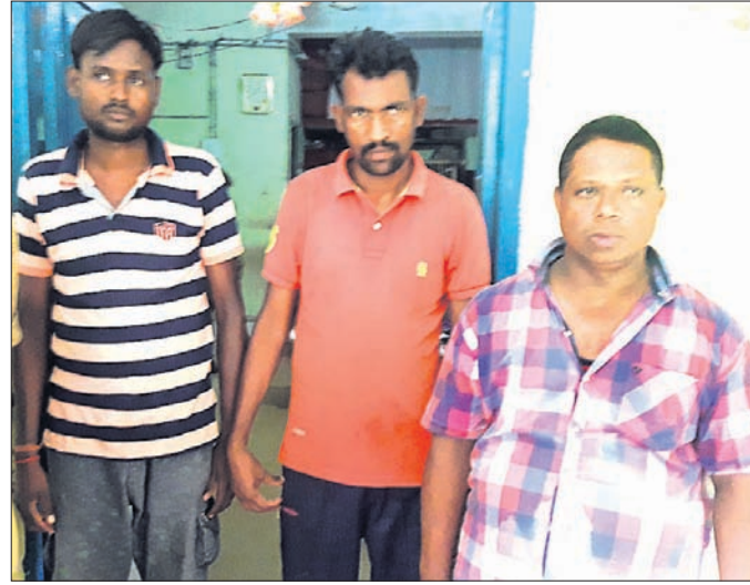
ରିଟ୍ ୩ ଅଭିଯୁକ୍ତ

ଏପଟରେ ବୁଲି ମାସର ଛୁଆ। କାଳୁଟି ମିନଟି ହେଲି। ଗୋଡ଼ ଧରିଲି। ଛାଡ଼ି ଦେବାକୁ ନେହେରା ହେଲି। କେହି ଶୁଣିଲେନି।