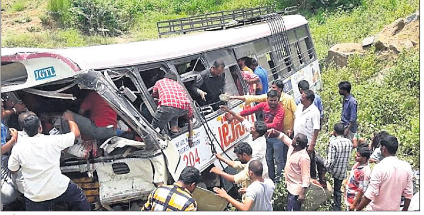
ଦୁର୍ଘଟଣାସ୍ଥଳ ବସ୍ । ଟ୍ରେକ୍ ଦେଇଥିଲେ । ଏତିକିବେଳେ ସେ ଭାରସାମ୍ୟ ହରାଇଥିଲେ । ଫଳରେ ବସ୍ ୪୫ର ଓଲଟିଯାଇ ୫ ମିନଟ ଗଭୀରତାର ଏକ ଖାଇକୁ ଖସିପଡ଼ିଥିଲା ।

ହାଇଦ୍ରାବାଦ, ୧୧/୯ (ଆଇଏଏନଏ) ତେଲେଙ୍ଗାନାର ଜଗତିଆଲ୍ ଜିଲ୍ଲାରେ ମଙ୍ଗଳବାର ଏକ ମର୍ମହତ୍ତ ସଡ଼କ ଦୁର୍ଘଟଣା ଘଟିଛି । ୭୦ରୁ ଊର୍ଦ୍ଧ୍ୱ ଯାତ୍ରୀଙ୍କୁ ନେଇ ଯାଉଥିବା ଏକ ସରକାରୀ ବସ୍ ଖାଇକୁ ଖସିପଡ଼ିଛି । ଏଥିରେ ୫୨ ଯାତ୍ରୀଙ୍କ ମୃତ୍ୟୁ ଘଟିଥିବାବେଳେ ୨୦ରୁ ଊର୍ଦ୍ଧ୍ୱ ଆହତ ହୋଇଛନ୍ତି । ମୃତକଙ୍କ ମଧ୍ୟରୁ ଅଧିକାଂଶ ମହିଳା ଓ ଶିଶୁ ବୋଲି ଜଣାପଡ଼ିଛି । ମଙ୍ଗଳବାରକୁ ଶୁଭଦିନ ମନେକରି ଭଦ୍ରମାନେ କୋଣାର୍କକୁ ପାହାଚ ଉପରେ ଥିବା ଅଞ୍ଜନେୟ ସ୍ୱାମୀ ମନ୍ଦିରକୁ ଦର୍ଶନ ପାଇଁ ଯାଇଥିଲେ । ସେମାନେ ଦର୍ଶନ ସାରି ତେଲେଙ୍ଗାନା ରାଜ୍ୟ ସଡ଼କ ପରିବହନ ନିଗମ (ଟିଏସ୍‌ଆର୍‌ଟିଏ)ର ବସ୍‌ରେ ଫେରୁଥିଲେ । ବସ୍ ପାହାଡ଼କୁ ଚଢ଼ି ଓହ୍ଲାଇଥିବାବେଳେ ପୂର୍ବାହ ପ୍ରାୟ ୧୧ଟା ୩୦ରେ ଶନିବାରାପେଟ ଗ୍ରାମ ନିକଟରେ ଏକ ସିଡ୍‌ ଟ୍ରେକ୍‌ ଦେଖି ଡ୍ରାଇଭର