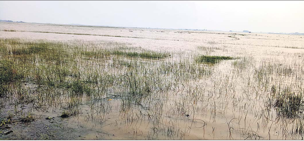
ଚାଷଜମି ବନ୍ୟା ପାଣିରେ ବୁଡ଼ି ରହିଛି ।

ପାଣିରେ ବୁଡ଼ି ରହିଛି । କେତେକ ପରିବାର ଜଳବନ୍ୟା ହୋଇ ରହିଛନ୍ତି । ଉପର ମୁଣ୍ଡରୁ ବନ୍ୟାପାଣି କମିଥିଲେ ବି ଛୁଆର ପ୍ରଭାବରୁ ଚଳିଆ ଅଞ୍ଚଳରେ ବନ୍ୟା ଛୁଟି ଯୋଗୁ ଲୋକଙ୍କ ଦୁର୍ଦ୍ଦଶା ବଢ଼ିବାରେ ଲାଗିଛି । ଆଜିକୁ ୫ ଦିନ ହେଲା ବନ୍ୟା ପାଣିରେ ଆରତି, ଘଟପୁର, ନାଲଗୁଣ୍ଡା, ଭୁଇଁବୁଝି, ଚେନ୍ଦ୍ରକିଶି ଓ