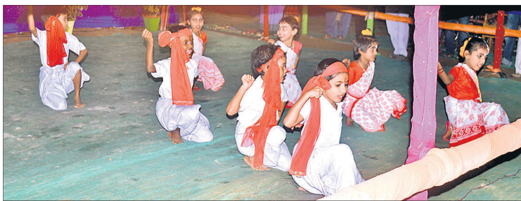
କୂଳି କଳାକାରମାନେ ସାଂସ୍କୃତିକ କାର୍ଯ୍ୟକ୍ରମ ପରିବେଷଣ କରୁଛନ୍ତି ।

ସବୁ ବାଉଁଶର ଭାଗ୍ୟରେ ଜାତୀୟ ପତାକା ଚେକି ଧରିବାର ସୁଯୋଗ ନ ଥାଏ । ସବୁ ବଂଶୀ ମୋହିନୀ ବଂଶୀ ନୁହେଁ । ଯେଉଁ ବଂଶୀ କୃଷ୍ଣକ ଓଠରେ ଲାଗିଥାଏ ସେ ବଂଶୀ ହେଉଛି ମୋହିନୀ ବଂଶୀ । ସେହିପରି କପ୍ପିପଦା ମାଟି ବୀର ସଂଗ୍ରାମୀଙ୍କୁ କୋଳାଗ୍ରତ କରି ଭାରତୀୟ ପୂଜି ସଂଗ୍ରାମର ମୋହିନୀ ବଂଶୀ ପାଲଟିଛି ।