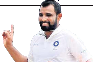
-ମହମ୍ମଦ ଶାମି, ଭାରତୀୟ ଦଳର

ଇଂଲଣ୍ଡ ପରିବେଶରେ କିଭଳି ବୋଲିଂ କରିବାକୁ ହେବ ତାହାର କୌଶଳ ବିପକ୍ଷ ଦଳର ଯେଉଁ ବୋଲର ଷ୍ଟୁଆର୍ଟ ବ୍ରଡ୍ ଓ କେପ୍ ଆଣ୍ଡରସନଙ୍କଠାରୁ ପୂର୍ଣ୍ଣ ହାସଲ କରିପାରିଛି।