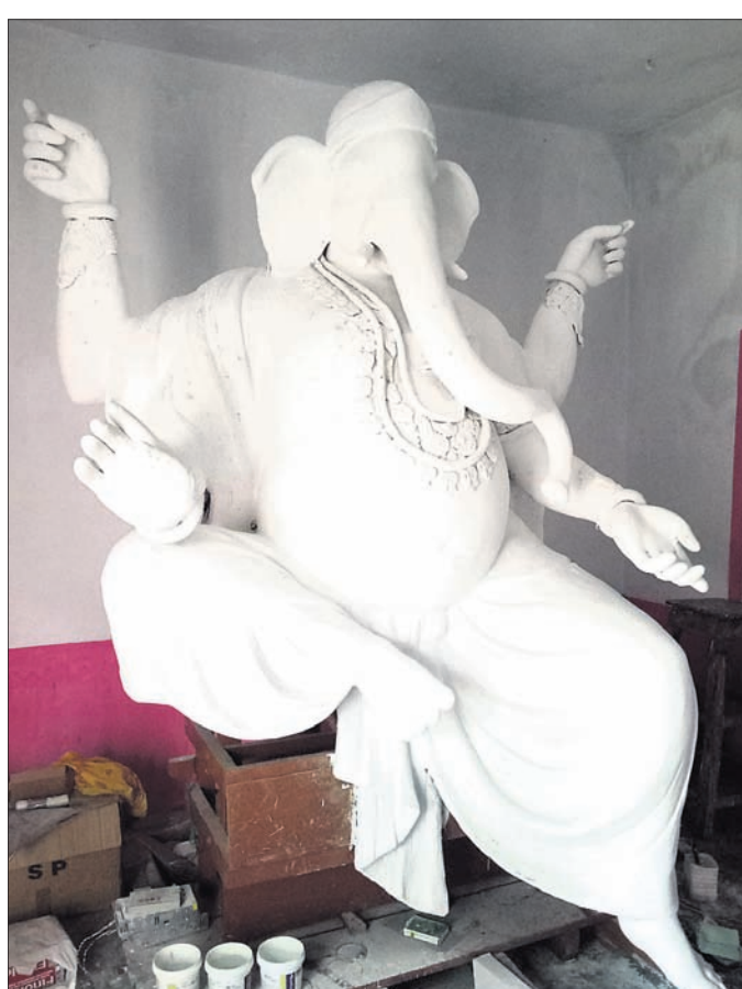
ପିଲା ଗଣେଶଙ୍କୁ ରଜା ଦିଆଯାଉଛି ।