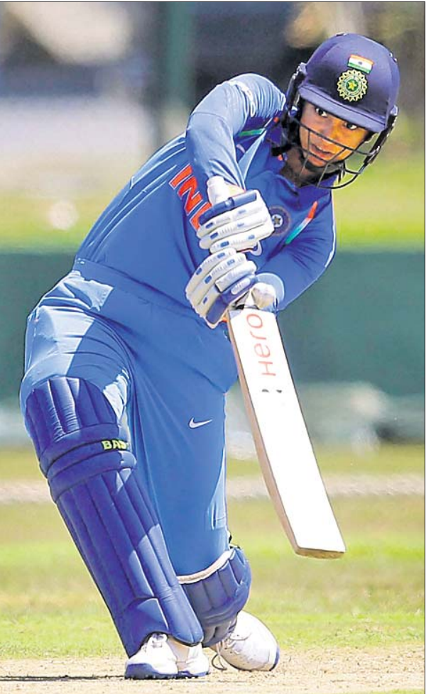
ଅପରାଜିତ ଅର୍ଦ୍ଧଶତକୀୟ ଇନିଂସ୍ ଅବସରରେ ସ୍ମୃତି ମନ୍ଦନ।

ଗାଲେ, ୧୧।୯: ଘରୋଇ ଶ୍ରୀଲଙ୍କା ମହିଳା କ୍ରିକେଟ୍ ଦଳ ବିପକ୍ଷରେ ମଙ୍ଗଳବାରଠାରୁ ଆରମ୍ଭ ହୋଇଥିବା ଦିନିକିଆ ସିରିଜର ପ୍ରଥମ ମ୍ୟାଚରୁ ଭାରତ ୯ ଉଇକେଟରେ ବୃହତ୍ ବ୍ୟବଧାନରେ ବିଜୟ ହାସଲ କରିଛି।