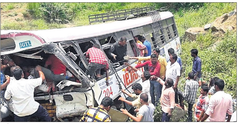
ଦୁର୍ଘଟଣାସ୍ଥଳ ବସ୍ ।

ହାଇଦ୍ରାବାଦ, ୧୧/୯ (ଆଇଏଏନଏସ୍) ଚେଲେଙ୍ଗାନାର ଜଗତିଆଳ ଜିଲ୍ଲାରେ ମଙ୍ଗଳବାର ଏକ ମର୍ମହୀନ ସଡ଼କ ଦୁର୍ଘଟଣା ଘଟିଛି । ୭୦ରୁ ଊର୍ଦ୍ଧ୍ୱ ଯାତ୍ରୀଙ୍କୁ ନେଇ ଯାଉଥିବା ଏକ ସରକାରୀ ବସ୍ ଖାଇକୁ ଖସିପଡ଼ିଛି । ଏଥିରେ ୫୨ ଯାତ୍ରୀଙ୍କ ମୃତ୍ୟୁ ଘଟିଥିବାବେଳେ ୨୦ରୁ ଊର୍ଦ୍ଧ୍ୱ ଆହତ ହୋଇଛନ୍ତି । ମୃତକଙ୍କ ମଧ୍ୟରୁ ଅଧିକାଂଶ ମହିଳା ଓ ଶିଶୁ ବୋଲି ଜଣାପଡ଼ିଛି । ମଙ୍ଗଳବାରକୁ ଶୁଭଦିନ ମନେକରି ଭଦ୍ରମାନେ କୋଣାର୍କକୁ ପାହାଚ ଉପରେ ଥିବା ଅଞ୍ଜନେୟ ସ୍ୱାମୀ ମନ୍ଦିରକୁ ଦର୍ଶନ ପାଇଁ ଯାଇଥିଲେ । ସେମାନେ ଦର୍ଶନ ସାରି ଚେଲେଙ୍ଗାନା ରାଜ୍ୟ ସଡ଼କ ପରିବହନ ନିଗମ (ଟିଏସ୍‌ଆର୍‌ଟିଏ)ର ବସ୍‌ରେ ଫେରୁଥିଲେ । ବସ୍ ପାହାଡ଼କୁ ଚଢ଼ୁ ଓହ୍ଲାଇଥିବାବେଳେ ପୂର୍ବାହ ପ୍ରାୟ ୧୧ଟା ୩୦ରେ ଶନିବାରାପେଟ ଗ୍ରାମ ନିକଟରେ ଏକ ସ୍ଥିତ ବ୍ରିକ୍ ଟ୍ରେକ୍‌ର ଦେଖି ଡ୍ରାଇଭର ଟ୍ରେକ୍ ଦେଇଥିଲେ । ଏତିକିବେଳେ ସେ ଭାରସାମ୍ୟ ହରାଇଥିଲେ । ଫଳରେ ବସ୍ ୪୫ର ଓଲଟିଯାଇ ୫ ମିନଟ ଗଭୀରତାର ଏକ ଖାଇକୁ ଖସିପଡ଼ିଥିଲା ।