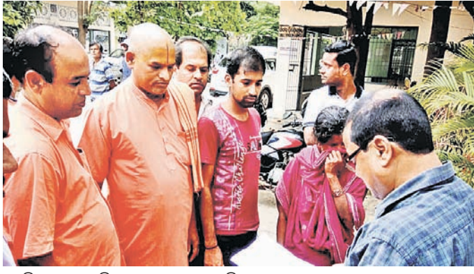
ତହସିଲଦାରଙ୍କୁ ଦାବିପତ୍ର ପ୍ରଦାନ କରାଯାଇଛି ।