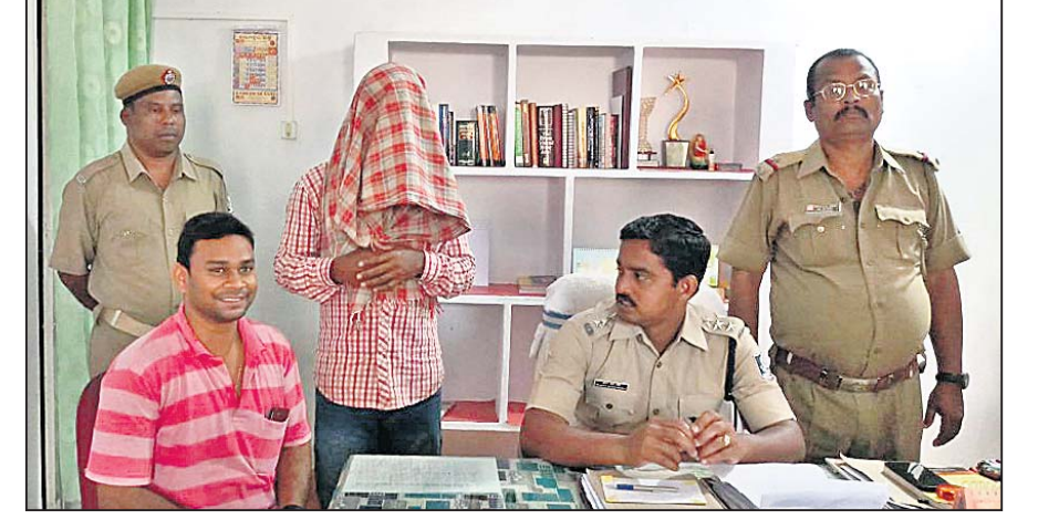
ଗିରଫ ଅଭିଯୁକ୍ତ ସହ ଯୋଲିସ ଅଧିକାରୀ ।