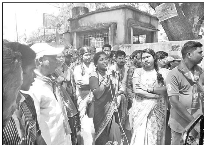
ଭାଙ୍ଗପା ଜିଲ୍ଲା ଅଧକ୍ଷା ମୁଖ୍ୟ ରାସ୍ତାରେ ଉଦ୍‌ବୋଧନ ଦେଉଛନ୍ତି।

ଗଜପତି ଜିଲ୍ଲା ନୂଆଗଡ଼ ବିଡିଓଙ୍କୁ ବଦଳି ଦାବିରେ ମଙ୍ଗଳବାର ଭାଙ୍ଗପା ପକ୍ଷରୁ ଆନ୍ଦୋଳନ ସହ ରାଲି ଅନୁଷ୍ଠିତ ହୋଇଯାଇଛି।