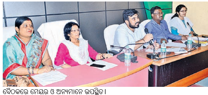
ବୈଠକରେ ମେୟର ଓ ଅନ୍ୟମାନେ ଉପସ୍ଥିତ ।

ବ୍ରହ୍ମପୁର ମହାନଗର ନିଗମ ସାଧାରଣ ବୈଠକ ମଙ୍ଗଳବାର ଅନୁଷ୍ଠିତ ହୋଇଯାଇଛି । ଗତ ୩୧ତାରିଖ ସ୍ଵାୟତ୍ତଶାସନ ଦିବସ ଅବସରରେ ଭିତ୍ତିପ୍ରସ୍ତର ସ୍ଥାପନ କରାଯାଇଥିବା ବୃତ୍ତୀ ପ୍ରକଳ୍ପ ଉପରେ ବୈଠକରେ ଆଲୋଚନା ହୋଇଥିଲା ।