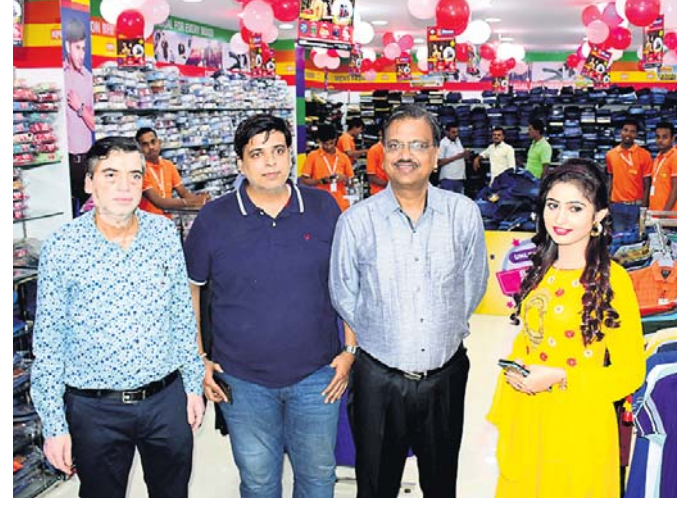
ଭୁବନେଶ୍ୱର, ୧୩-୯ (ଭୁବନେଶ୍ୱର)

କଲିକତା ଭିତ୍ତିକ ରିଟେଲ ଷୋ'ରୁମ୍ ବେଙ୍ଗ ଅପ୍ରାପ୍ତ ରିଟେଲ ଭୁବନେଶ୍ୱରରେ କଳ୍ପନା ହକ୍‌ଠାରେ ଏହାର ତୃତୀୟ ଷୋ'ରୁମ୍ ଖୋଲିବା ପାଇଁ 'କଲିକତା ଫ୍ୟାଶନ ବଜାର' ଉଦ୍‌ଘାଟନ କରାଯାଇଛି।