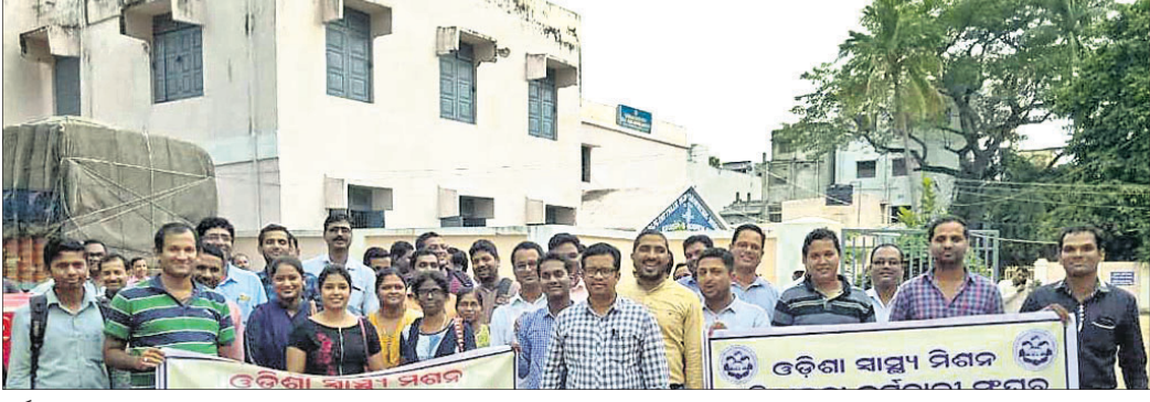
କର୍ମଚାରୀମାନେ ଆନ୍ଦୋଳନ କରୁଛନ୍ତି ।

ବେଗୁନିଆପଡ଼ା, ୧୩୩୯(ଡି.ଏନ.ଏ.): ବେଗୁନିଆପଡ଼ା ବ୍ଲକ୍ ପିଡିଏଚ୍‌ରେ ଘଟିଥିବା ଗୋଟିଏ ଦୁର୍ଘଟଣାରେ ଦୁଇଜଣଙ୍କର ମୃତ୍ୟୁ ହୋଇଛି ।