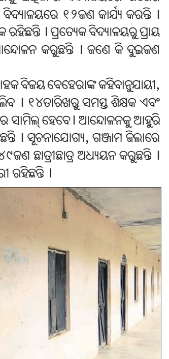
ବୁକ୍‌ଗ୍ରାଣ୍ଟ ବିଦ୍ୟାଳୟର ପାଠ୍ୟପୁସ୍ତକ କୋଠା ଘରୁ ନିଗମ କର୍ମଚାରୀଙ୍କୁ ଅଧିକାର ହୋଇଛି ।