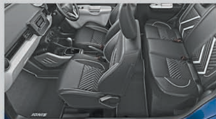
Premium Seat Covers and Foot Mats