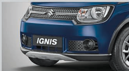
Rugged Body Kit

NEXA Safety Shield Standard Across All Variants