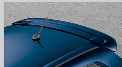
Sporty Roof Spoiler

T & C apply. The accessories shown in the picture may not be the part of standard fitment. Contact authorised dealership for details of the accessories. The black glass on the vehicle is due to lighting effect.