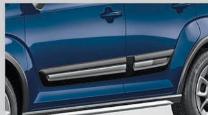
Tough Door Claddings