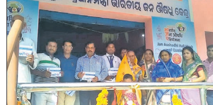
ମଧୁବନଠାରେ ଜନଔଷଧି କେନ୍ଦ୍ର ଅତି ଉଦ୍‌ଘାଟନ କରୁଛନ୍ତି ।

ରଘୁଲପୁର, ୧୩୯(ଡି.ଏନ୍.ଏ.) ରଘୁଲପୁର ବୁକ ଅନ୍ତର୍ଗତ ବଡ଼କଲିଟ ପଞ୍ଚାୟତର ମଧୁବନହାଟ ନିକଟରେ ଗୁରୁବାର ପ୍ରଧାନମନ୍ତ୍ରୀ ଭାରତୀୟ ଜନଔଷଧି କେନ୍ଦ୍ର ଉଦ୍‌ଘାଟିତ ହୋଇଯାଇଛି ।