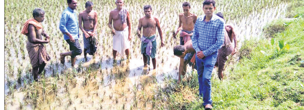
ପାଣି ଜମିଥିବା ଧାନ ଚାଷଜମିରେ କୃଷି ବିଭାଗ ପକ୍ଷରୁ ଅନୁଧାନ କରାଯାଇଛି ।

ବିସ୍ଫାରପୁର, ୧୩୯(ଡି.ଏନ୍.ଏ.) ପ୍ରତିବର୍ଷ ବନ୍ୟା, ମରୁଡ଼ି, ଲଗାଣ ବର୍ଷା ବିସ୍ଫାରପୁର ଅଞ୍ଚଳରେ ବ୍ୟାପକ କ୍ଷୟକ୍ଷତି କରିଚାଷୀର ଆର୍ଥିକ ମେରୁଦଣ୍ଡକୁ ବୋଧହୁଏ ହୋଇଛି ।