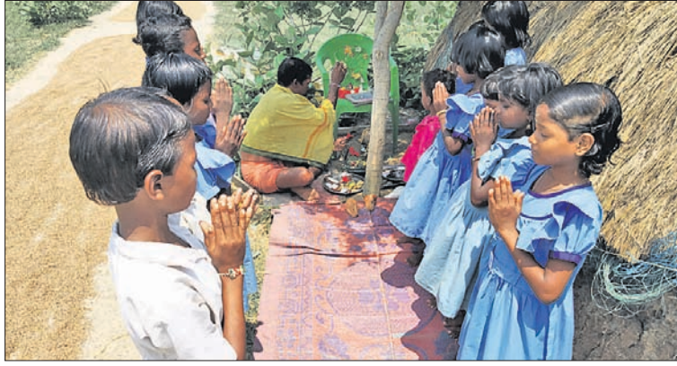
ରାସ୍ତା କଡ଼ରେ ଛାତ୍ରାଛାତ୍ରୀଙ୍କ ଗଣେଶ ପୂଜା।

ମହାକାଳପଡ଼ା ବ୍ଲକ୍ ବରଲକ୍ଷ୍ମୀ ପଞ୍ଚାୟତର ଆଦିବାସୀ ଅଧ୍ୟାପିତ ଅଞ୍ଚଳ ବାଲୁଆନେଳି ପ୍ରକଳ୍ପପ୍ରାଥମିକ ବିଦ୍ୟାଳୟରେ ଛାତ୍ରାଛାତ୍ରୀମାନେ ସ୍କୁଲକୁ ନ ଯାଇ ଗାଁ ରାସ୍ତା କଡ଼ରେ ଗଣେଶ ପୂଜା କରିଥିବା ଦେଖାଯାଇଛି। ସୂଚନା ଅନୁଯାୟୀ, ଉକ୍ତ ସ୍କୁଲର ଦାୟିତ୍ୱରେ ଥିବା ପ୍ରଧାନ ଶିକ୍ଷୟିତ୍ରୀ ଛାତ୍ରାଛାତ୍ରୀଙ୍କୁ ବୃତ୍ତ୍ୟବହାର କରୁଥିବାରୁ ତାଙ୍କ ବଦଳି ପ୍ରତିବାଦରେ ଗତ ୧୧ ତାରିଖରେ ଅଭିଭାବକମାନେ ସ୍କୁଲରେ ତାଲା ପକାଇ ଧାରଣାରେ ବସିଥିଲେ। ଆସନ୍ତା ୧୬ତମ ମଧ୍ୟରେ ପ୍ରଧାନଶିକ୍ଷୟିତ୍ରୀଙ୍କ