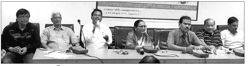
ଜୟନ୍ତୀରେ ଯୋଗଦେଇଥିବା ଅତିଥିମାନେ ।