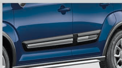
Tough Door Claddings