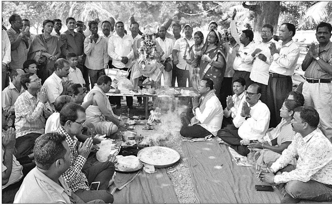
ଓଡ଼ିଶା ସ୍କୁଲ କଲେଜ ଶିକ୍ଷକ କର୍ମଚାରୀ ମିଳିତ ମଞ୍ଚ ପକ୍ଷରୁ ରାସ୍ତାରେ ଗଜାନନଙ୍କ ଆରାଧନା ।

■ ସୋମବାରଠାରୁ ପଞ୍ଚାୟତରେ ପଦଯାତ୍ରା କରିବ ମିଳିତ ମଞ୍ଚ ■ ଲୋକଙ୍କୁ ଜଣାଇବ ସରକାରଙ୍କ ଶିକ୍ଷାମାରଣ ନୀତି