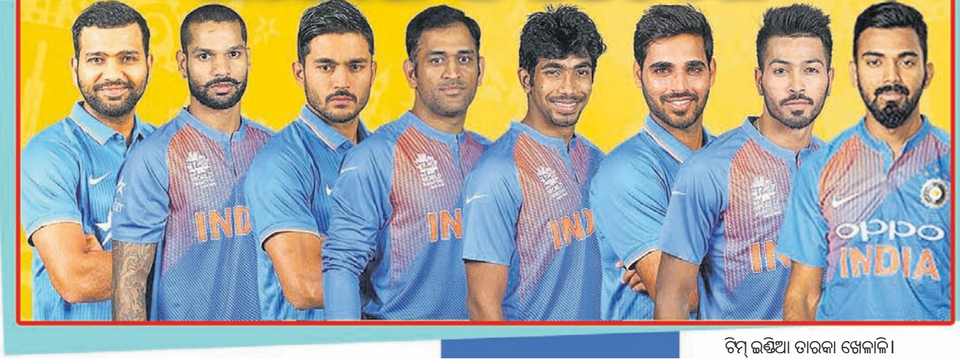
ଚିମ୍ ଇଣ୍ଡିଆ ଚାରକା ଖେଳାଳି

ଏହି ଚୁନାବଳୀରେ ହଂକଂ, ମାଲେସିଆ, ନେପାଳ, ଓମାନ, ସିଙ୍ଗାପୁର ଏବଂ ଯୁଏଇ ଅଂଶଗ୍ରହଣ କରିଥିଲେ ଓ ଶେଷରେ ହଂକଂ ଚାମ୍ପିୟନ ହୋଇ ଏସିଆ କପ୍ ଖେଳିବାକୁ ଯୋଗ୍ୟତା ହାସଲ କରିଛି। ଚଳିତ ଏସିଆ କପ୍ କ୍ରିକେଟ୍ ପ୍ରତିଯୋଗିତାରେ ମୋଟ ୧୩ଟି ମ୍ୟାଚ ଖେଳାଯିବାକୁ ଥିବା ବେଳେ ୬ଟି ଚିମ୍ ଚୁକ୍ତି ଗ୍ରୁପ୍ରେ ବିଭକ୍ତ କରାଯାଇଛି। ଗ୍ରୁପ୍-ଏ ରେ ଭାରତ, ପାକିସ୍ତାନ ଓ କ୍ୱାଲିଫାୟାର ଚିମ୍ ସ୍ଥାନ ପାଇଥିବା ବେଳେ ଗ୍ରୁପ୍-ବି ରେ ଆଫଗାନିସ୍ତାନ, ବାଂଲାଦେଶ ଏବଂ ଶ୍ରୀଲଙ୍କା ସ୍ଥାନ