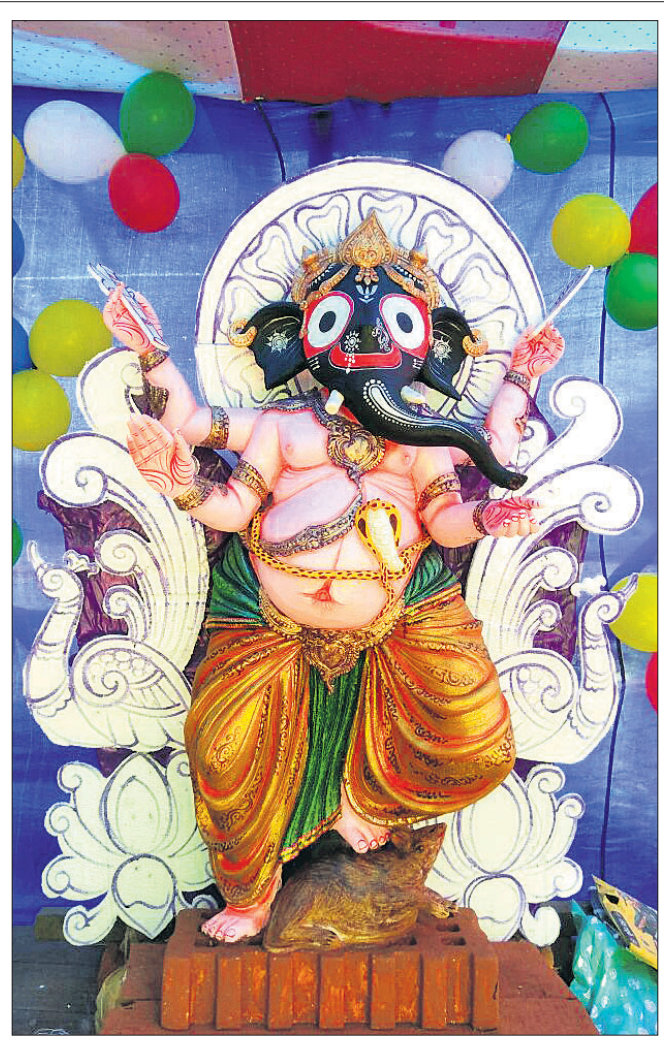
ଭଦ୍ରକ ଜିଲ୍ଲା ବଡ଼ ବୁକ ଆରମ୍ଭପୂର୍ଣ୍ଣା ପୂଜା କମିଟି ପକ୍ଷରୁ ପୂଜା ପାଉଥିବା ଗଜାନନଙ୍କ ଜରନାଥ ବେଶ ।