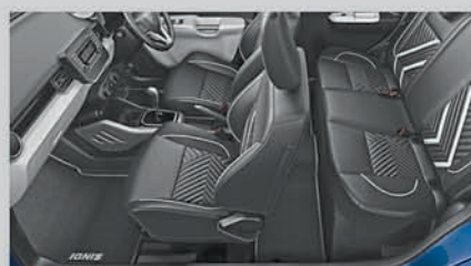
Premium Seat Covers and Foot Mats