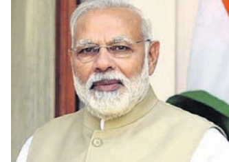
ବାରାଣସୀ, ୧୩୯ (ପି.ଟି.)

ପ୍ରଧାନମନ୍ତ୍ରୀ ନରେନ୍ଦ୍ର ମୋଦି ତାଙ୍କର ୬୮ତମ ଜନ୍ମଦିନ ବାରାଣସୀରେ ପାଳନ କରିବେ। ଏଥିପାଇଁ ସେ ୨ ଦିନିଆ ଗସ୍ତରେ ବାରାଣସୀ ଯିବେ। ୧୭ରେ ତାଙ୍କର ଜନ୍ମଦିନ ରହିଥିବା ବେଳେ ସେଠାରେ ମୋଦି ସ୍କୁଲର ଛୋଟଛୋଟ ପିଲାଙ୍କ ସହ ଏହି ଦିନକୁ କାଟିବାର ଯୋଜନା କରିଛନ୍ତି। ଏହା ସହ ତାଙ୍କର ଜୀବନୀକୁ ନେଇ ନିର୍ମିତ ଫିଲ୍ମ 'ନେଲେ ଛେଡ଼ି'କୁ ପିଲାଙ୍କ ସହ ବସି ସେ ଦେଖିବେ। ଏହି ଗସ୍ତ ସମୟରେ ମୋଦି କାଶୀବିଶ୍ୱନାଥ ମନ୍ଦିର ଯାଇ ଏକ କାର୍ଯ୍ୟକ୍ରମରେ ଲୋକଙ୍କୁ ସମ୍ବୋଧିତ କରିବେ। ମୋଦିଙ୍କ ପୁରୁଣା ବ୍ୟବସ୍ଥାକର୍ତ୍ତାକୃତି କରିବା ପାଇଁ ମୁଖ୍ୟମନ୍ତ୍ରୀ ଯୋଗା ଆଦିତ୍ୟନାଥ ସବୁ ପ୍ରକାର ବ୍ୟବସ୍ଥା କରିଥିବା ଜଣାପଡ଼ିଛି।