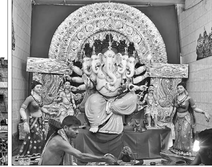
ପଞ୍ଚମୁଖୀ ବିନାୟକ ସମିତି ତରଫରୁ ଶ୍ରୀଗଣେଶ ପୂଜାର୍ଚ୍ଚନା ।

ନୃତ୍ୟ ଗଣପତି, ଭଣ୍ଡ ଗଣେଶ ପ୍ରଭୃତି ବହୁ ଗଣେଶ ପୂଜା ପାଉଛନ୍ତି । ବିଶେଷକରି ଗୁରୁବାର ବଟ ଗଣେଶଙ୍କ ପାଖରେ ଅଧିକ ସମୟ ପୂଜା ପାଉଛି ।