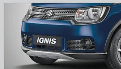
Rugged Body Kit

NEXA Safety Shield Standard Across All Variants