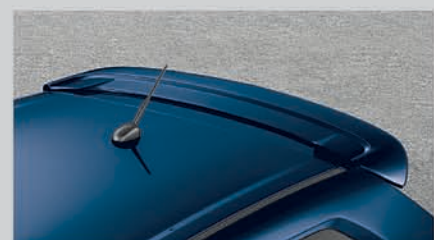
Sporty Roof Spoiler

T & C apply. The accessories shown in the picture may not be the part of standard fitment. Contact authorised dealership for details of the accessories. The black glass on the vehicle is due to lighting effect.