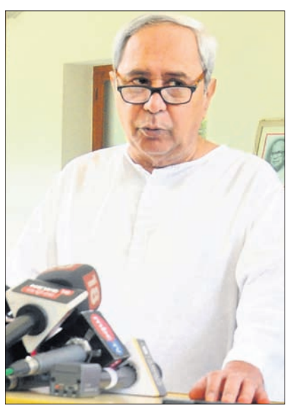
ନବୀନ ନିବାସଠାରେ ଗୁରୁବାର ଗଣମାଧ୍ୟମକୁ ପ୍ରତିକ୍ରିୟା ଦେଇଛନ୍ତି ମୁଖ୍ୟମନ୍ତ୍ରୀ ନବୀନ ପଟ୍ଟନାୟକ।

ଦାମୋଦରଙ୍କ ଅଭିଯୋଗ ହାସ୍ୟାସ୍ୱଦ: ମୁଖ୍ୟମନ୍ତ୍ରୀ ଭୁବନେଶ୍ୱର, ୧୩/୯ (ବୁଧବୋ) ବିଜେଡିରୁ ବହିଷ୍କୃତ ପୂର୍ବତନ ମନ୍ତ୍ରୀ ଦାମୋଦର ରାଉତଙ୍କ ଅଭିଯୋଗ ନିଷ୍ଫଳ ଓ ହାସ୍ୟାସ୍ୱଦ। ଦାମୋଦର ସବୁବେଳେ ଦାୟିତ୍ୱହୀନ ମନ୍ତ୍ରଣା ଦେଖାନ୍ତି। ସେ ଆଶୁଥିବା ଅଭିଯୋଗ ମୂଲ୍ୟହୀନ। ନୂଆଦିଲ୍ଲୀରୁ ଫେରିବା ପରେ ଗୁରୁବାର ନବୀନ ନିବାସଠାରେ ଗଣମାଧ୍ୟମକୁ ଏଭଳି ପ୍ରତିକ୍ରିୟା ଦେଇଛନ୍ତି ବିଜେଡି ନୂଆଦିଲ୍ଲୀ ଗଢ଼ିଲେ କୌଣସି ଫରକ ପଡ଼ିବ ନାହିଁ ସଭାପତି ତଥା ମୁଖ୍ୟମନ୍ତ୍ରୀ ନବୀନ ପଟ୍ଟନାୟକ। ଦାମୋଦର ବହିଷ୍କାର ହେବାର ଦିନକ ପରେ ମୁଖ୍ୟମନ୍ତ୍ରୀ ନିଜର ପ୍ରତିକ୍ରିୟା ଦେଇଛନ୍ତି। ଦାମୋଦର ପୂର୍ବରୁ ବିଜେଡିରୁ ବହିଷ୍କୃତ ନେତାମାନେ ଏକାଠିହୋଇ ଏକ ରାଜନୈତିକ ଦଳ ଗଠନ କରିବା ସମ୍ଭାବନା ରହିଛି। ଏହାଦ୍ୱାରା ବିଜେଡି ପ୍ରଭାବିତ ହେବ କି ଏକ ପ୍ରଶ୍ନର ଜବାବରେ ନବୀନ କହିଛନ୍ତି ଯେ, ପୁଷ୍ପା-୪