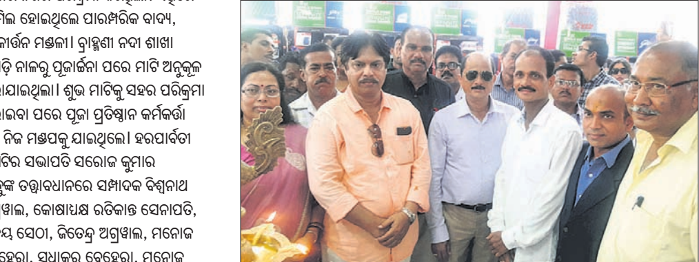
ଶୋ'ରୁମ୍ ଉଦଘାଟନା କାର୍ଯ୍ୟକ୍ରମରେ କମ୍ପାନୀ କର୍ମକର୍ତ୍ତାଙ୍କ ସମେତ ଅନ୍ୟମାନେ।