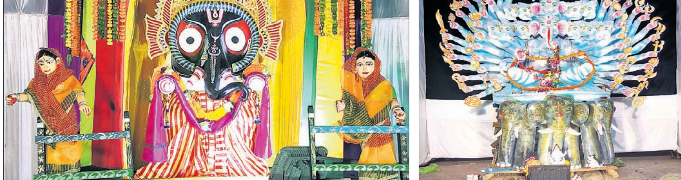
ଡେକାନାଲ ବଜରକ୍ କୁବ ।