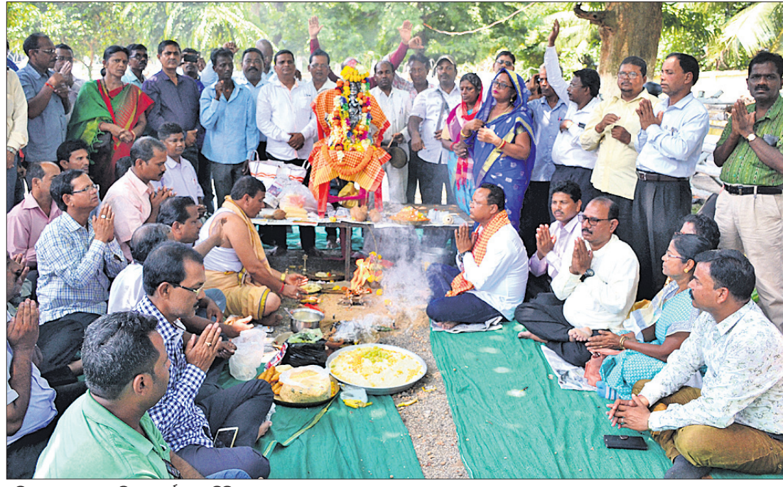
ଓଡ଼ିଶା ସ୍କୁଲ କଲେଜ ଶିକ୍ଷକ କର୍ମଚାରୀ ମିଳିତ ମଞ୍ଚ ପକ୍ଷରୁ ରାସ୍ତାରେ ଗଜାନନଙ୍କୁ ଆରାଧନା ।