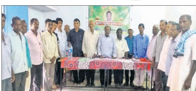
ସ୍ମୃତିସଭାରେ ଉପସ୍ଥିତ ଅତିଥି ଏବଂ ବୁକିଙ୍ଗିବାମାନେ।