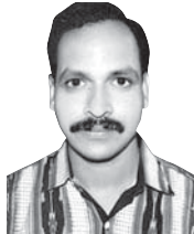
ସଂଗ୍ରାମ କେଶରୀ ପୃଷ୍ଟି

ସକାଳୁ ରାତିଯାଏ ସବୁବେଳେ ଖାଲି କାମ ହିଁ କାମ । ଏଥିରୁ ସୁନ୍ଦରତ ଟିକସ କୋଉ ମିଳୁଛି ଭଲ ! ଖାଇବା ତ ଛାଡ଼ି ମରିବାକୁ ବି ସମୟ ନାହିଁ । ପ୍ରାୟତଃ ଏମିତି କଥା ଅନେକଙ୍କ ମୁହଁରୁ ଶୁଣିବାକୁ ମିଳିଥାଏ । କହୁଥିବା ଲୋକର ଭାଷାଶୈଳୀ ଓ ମୁଖମଣ୍ଡଳ ଦେଖିଲେ ଲାଗେ ସତେଯେମିତି ଯାକଠାରୁ ବଳି ବ୍ୟସ୍ତ ମଣିଷ ଏ ଦୁନିଆରେ ଆଉ କେହି ନ ଥିବେ । ତେବେ ଏ ବ୍ୟସ୍ତ ମଣିଷଙ୍କ ବ୍ୟସ୍ତତା ପରଖିବାକୁ କାହାର ଆଗ୍ରହ ନ ଥାଏ କି ବେଳେ ମଧ୍ୟ ନ ଥାଏ । ମଣିଷ ନିଜ କାର୍ଯ୍ୟକୁ ନେଇ ବ୍ୟସ୍ତ ହୋଇପଡ଼େ । ଅଳ୍ପ ସମୟ ମଧ୍ୟରେ ଅଳ୍ପ କାର୍ଯ୍ୟ କରିବାର ସକ୍ଷମତାକୁ ହିଁ ବ୍ୟସ୍ତତାକୁ ଦେଖାଇପାରେ । କାର୍ଯ୍ୟ ଜରୁରୀ ହେଲେ ଏଥିପାଇଁ ଇନ୍ଦନ ମିଳେ । ତେବେ ଗୋଟିଏ କାର୍ଯ୍ୟ ଜରୁରୀ ହୋଇପଡ଼େ ସେତେବେଳେ, ଯେତେବେଳେ କି ଠିକ୍ ସମୟରେ ଠିକ୍ କାର୍ଯ୍ୟ କରାଯାଇ ନ ଥାଏ । ଫଳତଃ ଧାର୍ଯ୍ୟ ବା ସାମିତ ସମୟ ମଧ୍ୟରେ ତାକୁ ଅଧିକ କାର୍ଯ୍ୟ କରିବାକୁ ପଡ଼ିଥାଏ । ସୁତରାଂ ସେ ବ୍ୟସ୍ତ ରହେ । ଏହି କାରଣରୁ ବ୍ୟସ୍ତ ମଣିଷ ପାଖରେ ରାଗିବା, ବିରକ୍ତ ହେବା ଓ ଚିତ୍ତଚିତା ଭାବ ପରି ଲକ୍ଷଣ ଦେଖାଯାଏ । କାମର ପ୍ରାବଳ୍ୟ ଓ ମାନସିକ ତାପ କାରଣରୁ କାର୍ଯ୍ୟରେ ବିଚ୍ଛିନ୍ନ ଦେଖାଦେଇପାରେ । ଏହି ବ୍ୟସ୍ତତା ଭିତରୁ କେହି ମୁକ୍ତିପାରି ନ ଥାନ୍ତି । ଠିକ୍ ସମୟରେ ପାଠ ସାରି ନ ଥିବାରୁ ପିଲାଟିଏ ନିଜେ ତ ବ୍ୟସ୍ତ ହୁଏ ତା' ସହିତ ପରିବାର ଲୋକଙ୍କୁ ବ୍ୟସ୍ତବିକ୍ରତ କରିପାଏ । ସ୍କୁଲରୁ ଠିକ୍ ସମୟରେ ପିଲା ନ ଫେରିଲେ ବାପାମାଆ ବ୍ୟସ୍ତ ହେବା ସ୍ୱାଭାବିକ । ଫାଇଲ କାମ ଠିକ୍ ସମୟରେ ହୋଇ ନ ପାରିଲେ କର୍ମଚାରୀଟିଏ ଯେତିକି ବ୍ୟସ୍ତ ହୋଇପଡ଼େ ତା'ରୁ ଅଧିକ ବ୍ୟସ୍ତ ହୋଇପଡ଼ନ୍ତି ଅଧିକ । ଟ୍ରେନରେ ଚଢ଼ିବାର ବ୍ୟସ୍ତତା, ଠିକ୍