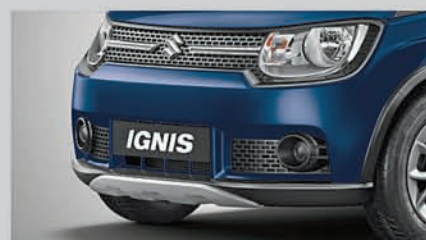
Rugged Body Kit

NEXA Safety Shield Standard Across All Variants