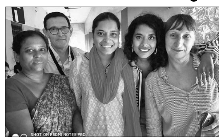
ବସୁନ୍ଧରାରେ କେନ୍ଦ୍ରୀୟ ଚେକର, ସ୍ନେହୀୟ ଦମ୍ପତିଙ୍କ ସହ ପୋଷ୍ୟ ସନ୍ତାନ ଲକ୍ଷ୍ମୀ ଓ ସାଗରିକା।

ପିଲାଟି ଖାଇବା ଏବଂ ସତେଇରେ ଖେଳିବା ଦେଖି ମଜାଦାର ଥିଲା ବୋଲି ସେମାନେ କହିଛନ୍ତି। ସେହିପରି ସାଗରିକା ଓ ଲକ୍ଷ୍ମୀଙ୍କୁ ପୋଷ୍ୟ ଭାବେ ଗ୍ରହଣ କରିଥିବା ସ୍ନେହୀୟ ଦମ୍ପତିଙ୍କ କହିବାକୁ ଯାଏ। ଅନ୍ୟ ଦେଶ ତୁଳନାରେ ଭାରତରେ ପୋଷ୍ୟ ସନ୍ତାନ ଗ୍ରହଣ କରିବାରେ ଆଇନଗତ ବ୍ୟବସ୍ଥା ବହୁତ ଭଲ।