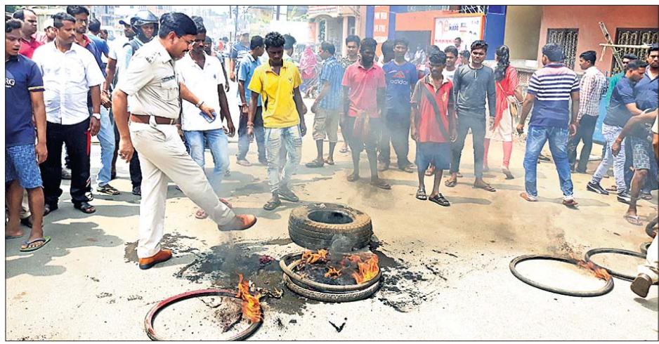
ରାସ୍ତାରୋକୋରେ ନିଆଁ ଲଗାଯାଇଥିବା ଟାଇରକୁ ପୋଲିସମାନେ ଲିଭାଇଛନ୍ତି।