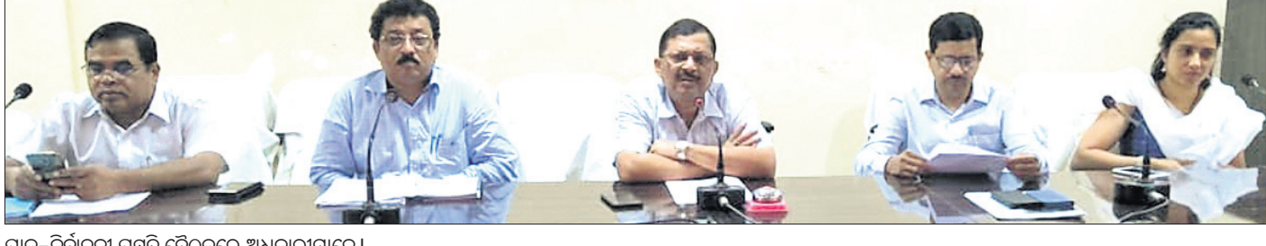
ପ୍ରାକ୍-ନିର୍ବାଚନ ପ୍ରସ୍ତୁତି ବୈଠକରେ ଅଧିକାରୀମାନେ ।