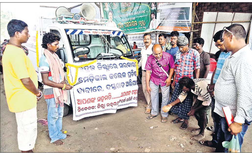
ଦସ୍ତଖତ ସଂଗ୍ରହ ଆନ୍ଦୋଳନ ରଥକୁ ଉଦ୍ଦୋଳନ କରାଯାଇଛି।

ଭଦ୍ରକ ନାଗରିକ ସମାଜ ପକ୍ଷରୁ ବିଭିନ୍ନ ରୁକ୍ମରେ ଆନ୍ଦୋଳନ ଚାଲି ରହିଛି। ମଙ୍ଗଳବାର ବନ୍ଧ ଛକରେ ଶ୍ରାବଣ ନାଗରିକ ଅଧିକାର ସୂଚନା ପତ୍ରର ପଠନ ଶତାଧିକ ହୁଏ। ଏହାଛଡ଼ା ବନ୍ଧ-କେନ୍ଦ୍ରୀୟତା ଛକ ଠାରୁ ପଦଯାତ୍ରାରେ ବାହାରି ବଜାର ପରିକ୍ରମା କରିଥିଲେ। ପରେ ସେମାନେ ଗଣସଂଖ୍ୟାରେ ସମ୍ମିଳିତ ଦାବିପତ୍ର ପ୍ରଦାନମାନା, ପୁଞ୍ଜୀମାନା ଓ ସ୍ଵାସ୍ଥ୍ୟମନ୍ତ୍ରାଳୟ ଉଦ୍ଦୋଳନରେ ଅଫିସ୍‌ରେ ପ୍ରଦାନ କରିଥିଲେ। ବିଭିନ୍ନ ଖବରଦାତା ପତ୍ରଞ୍ଚଳା କରଣୀଙ୍କ ଆବାହକତ୍ଵରେ ଏହି