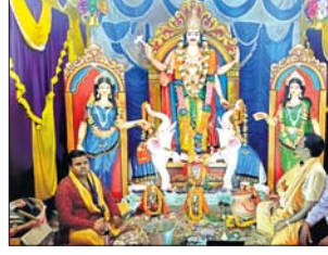
ବଡ଼ବିଲ ପିଏବିରେ ପୂଜା ପାଉଥିବା ବିଶ୍ୱକର୍ମା।

ଦେବଶିଳ୍ପୀ ବିଶ୍ୱକର୍ମାଙ୍କୁ ସବୁଠି ପୂଜାର୍ଚ୍ଚନା କରାଯାଇଛି। କେନ୍ଦୁଝର ଜିଲ୍ଲା ବଡ଼ବିଲ ଶିଳ୍ପାଞ୍ଚଳ ଉତ୍ସବମୁଖର ହୋଇଛି।