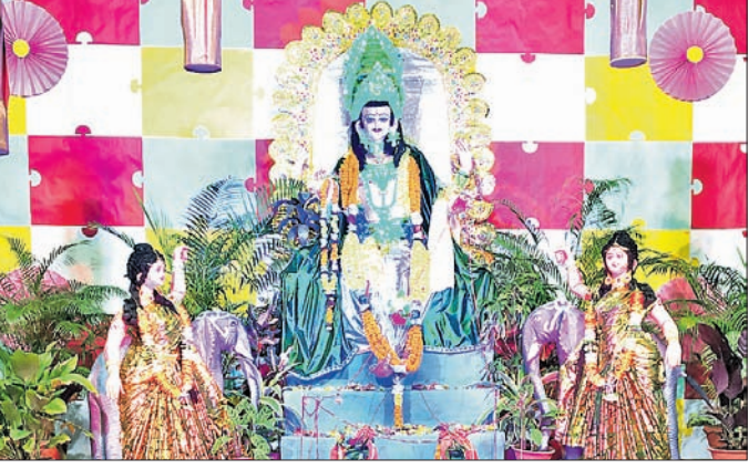
ବାଲେଶ୍ୱର ଆଲଏଚ୍ କମ୍ପାନୀ ପୂଜା ।

ବାଲେଶ୍ୱର ଆଲଏଚ୍ କମ୍ପାନୀ ପରିସର ମଧ୍ୟରେ ବିଶ୍ୱକର୍ମା ପୂଜା ମହାସମାରୋହରେ ଅନୁଷ୍ଠିତ ହୋଇଯାଇଛି ।