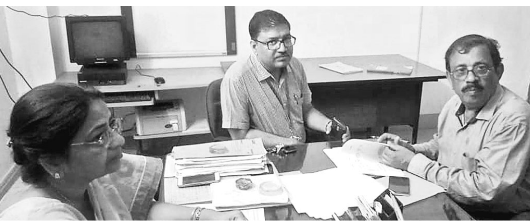
ଏମ୍.କେ.ସି.ଜି ମେଡିକାଲ କଲେଜର ଜଣେ କର୍ତ୍ତୃପକ୍ଷଙ୍କ ସହ ଏମ୍.ସି.ଆଇ ଚିମ୍ ଆଲୋଚନା କରୁଛନ୍ତି ।

ମେଡିକାଲ କାଉନ୍ସିଲ ଅଫ୍ ଇଣ୍ଡିଆ (ଏମ୍.କେ.ସି.ଜି)ର ଏକ ଚିମ୍ ମଙ୍ଗଳବାର ବ୍ରହ୍ମପୁର ଏମ୍.କେ.ସି.ଜି ମେଡିକାଲ କଲେଜକୁ ପରିଦର୍ଶନରେ ଆସିଥିବା ଜଣାପଡିଛି । ଏହି ଚିମ୍ ଦୁଇ ଦିନ ଧରି ଏମ୍.କେ.ସି.ଜି ମେଡିକାଲ କଲେଜର ସମସ୍ତ ବିଭାଗ ଏବଂ ଖର୍ଚ୍ଚ ପରିଦର୍ଶନ କରିବେ ବୋଲି ସୂଚନା ମିଳିଛି । ପ୍ରକାଶଯେ, ଆଜକୁ ତିନି ବର୍ଷ ହେଲା ଏମ୍.କେ.ସି.ଜି ମେଡିକାଲ କଲେଜରେ ସିମ୍ ସଂଖ୍ୟା ୧୫୦୦ରୁ ୨୫୦୦କୁ ବୃଦ୍ଧି ପାଇଥିବା ବେଳେ ଚଳିତବର୍ଷ ଚତୁର୍ଥ ଫେଜର ଛାତ୍ରଛାତ୍ରୀ ଆର୍ଡିନାନ୍ ହୋଇଛନ୍ତି । ଏମ୍.ସି.ଆଇ ଚିମ୍ ପ୍ରତି ବର୍ଷ ଆସି ସମସ୍ତ ବିଭାଗ ପରିଦର୍ଶନ କରି କିଛିତ୍ରୁମି ପରଖି ଅନୁମତି ପ୍ରଦାନ କଲେ ତାହା ଛାତ୍ରଛାତ୍ରୀଙ୍କ ଶିକ୍ଷାଗ୍ରହଣ କାର୍ଯ୍ୟକ୍ରମ ଆରମ୍ଭ ହୋଇଥାଏ । ମଙ୍ଗଳବାର ଏହି ଚିମ୍ ମେଡିକାଲ କଲେଜ ଏବଂ ବଡ଼ମେଡିକାଲର କେତେକ ବିଭାଗ ବୁଲି ପରିଦର୍ଶନ କରିଥିବା ବେଳେ ବୁଧବାର ପରିଦର୍ଶନ ଏବଂ ଯାତ୍ରା କାର୍ଯ୍ୟକ୍ରମ ଶେଷ ହେବ ବୋଲି ସୂଚନା ମିଳିଛି । ବନାରସ ଆଇ.ଏମ୍.ଏସ୍.ଇନଷ୍ଟିଚ୍ୟୁଟ୍ ଅଫ୍