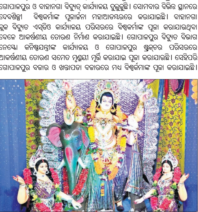
ଗୋପାଳପୁର ବିଦ୍ୟୁତ୍ ଷ୍ଟକକର ପରିସରରେ ପୂଜା ପାଠ ଥିବା ଦେବଶିଳ୍ପୀ ବିଶ୍ୱକର୍ମା ।

ଅଞ୍ଚଳ ଚିହ୍ନଟ କରି ସେ ଅଞ୍ଚଳରେ ସମସ୍ୟା ଏବଂ ସମାଧାନ ବାବଦରେ ଯୋଜନା ପ୍ରସ୍ତୁତ କରିବାକୁ ନିର୍ଦ୍ଦେଶ ଦିଆଯାଇଛି ।