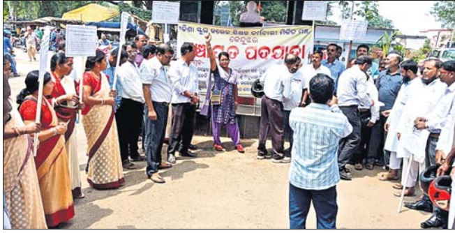
ଶିକ୍ଷକମାନେ ପଦଯାତ୍ରାରେ ଯାଉଛନ୍ତି।

ଚମ୍ପୁଆ, ୧୮୮୯(ଡି.ଏନ.ଏ.) ରୁକ୍ମିଣୀ ଶିକ୍ଷକଙ୍କ ସମସ୍ୟା ପ୍ରତି ସରକାର କର୍ତ୍ତୃପତ୍ତ କରୁ ନ ଥିବା ଓ ଶିକ୍ଷକଙ୍କ ଦାବି ଶୁଣୁ ନ ଥିବାରୁ ମିଳିତ ମଞ୍ଚ ପକ୍ଷରୁ ପଦଯାତ୍ରା ଆରମ୍ଭ ହୋଇଛି।