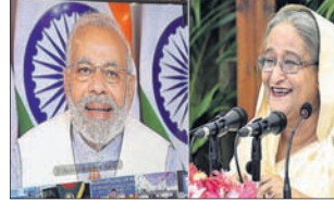
ସମ୍ପୃକ୍ତ ହେବାର ଲକ୍ଷ୍ୟ ରଖାଯାଇଛି। ପାଇପ୍‌ଲାଇନ୍‌ର କ୍ଷମତା ହେଲା ବାର୍ଷିକ ୧ ନିୟୁତ ମେଟ୍ରିକ୍ ଟନ୍। ତେବେ ଭାରତ ଏବଂ ବାଂଲାଦେଶର ମଧ୍ୟରେ ପାରମ୍ପରିକ ସହଯୋଗ ବିଶ୍ୱାସୀୟତା ପାଇଁ ଏକ ଉପାହରଣ ବୋଲି ନିର୍ମାଣକାର୍ଯ୍ୟର ଉଦ୍ଦ୍ୟୋଗ ବେଳେ ମୋଦି ଉଲ୍ଲେଖ କରିଛନ୍ତି। ପାଇପ୍‌ଲାଇନ୍ ପ୍ରକଳ୍ପ ବ୍ୟତୀତ କୋଟି ଟଙ୍କା ବିନିଯୋଗରେ ନିର୍ମାଣ ହେବାକୁ ଥିବା ଏହି ପ୍ରକଳ୍ପ ୩୦ ମାସ ମଧ୍ୟରେ

ଭାରତ-ବାଂଲାଦେଶ ବନ୍ଧୁତା ପ୍ରତୀକ 'ପ୍ରେକ୍ଷଣିୟ ପାଇପ୍‌ଲାଇନ୍ ପ୍ରକଳ୍ପ' ନିର୍ମାଣକାର୍ଯ୍ୟ। ଦୁଇଦେଶର ପ୍ରଧାନମନ୍ତ୍ରୀ ନରେନ୍ଦ୍ର ମୋଦି ଏବଂ ଶେଖ୍ ହାସିନା ମଙ୍ଗଳବାର ଭିତ୍ତି କର୍ମରେଖା କରିଆରେ ମିଳିତ ଭାବେ ଏହାର ଭିତ୍ତିପ୍ରସ୍ତର ସ୍ଥାପନ କରିଛନ୍ତି। ୧୩୦ କିଲୋମିଟର ବିଶିଷ୍ଟ ଭାରତ-ବାଂଲାଦେଶ ପ୍ରେକ୍ଷଣିୟ ପାଇପ୍‌ଲାଇନ୍ ପ୍ରକଳ୍ପ ପଶ୍ଚିମବଙ୍ଗର ସିଲିଗୁଡ଼ି ବାଂଲାଦେଶର ଦିନାହପୁର ଜିଲ୍ଲାର ପାର୍ବତୀପୁର ଅଞ୍ଚଳକୁ ବିଛାଯିବ। ୩୪୬ କୋଟି ଟଙ୍କା ବିନିଯୋଗରେ ନିର୍ମାଣ ହେବାକୁ ଥିବା ଏହି ପ୍ରକଳ୍ପ ୩୦ ମାସ ମଧ୍ୟରେ