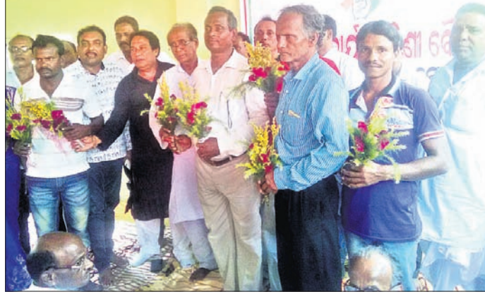
ବିଜେଡି ଓ ଭାଜପା ନେତାମାନେ କଂଗ୍ରେସରେ ସାମିଲ ହେବାକୁ ସମ୍ମତ ହେବେ ।

ବାଲେଶ୍ୱର ଜିଲ୍ଲା ଭୋଗରାଜ ନିର୍ବାଚନମଣ୍ଡଳରେ କଂଗ୍ରେସକୁ ଅଧିକ ଶକ୍ତିଶାଳୀ ଓ କ୍ରିୟାଶୀଳ କରି ରଖିବା ଲକ୍ଷ୍ୟ ରଖିଛନ୍ତି ।