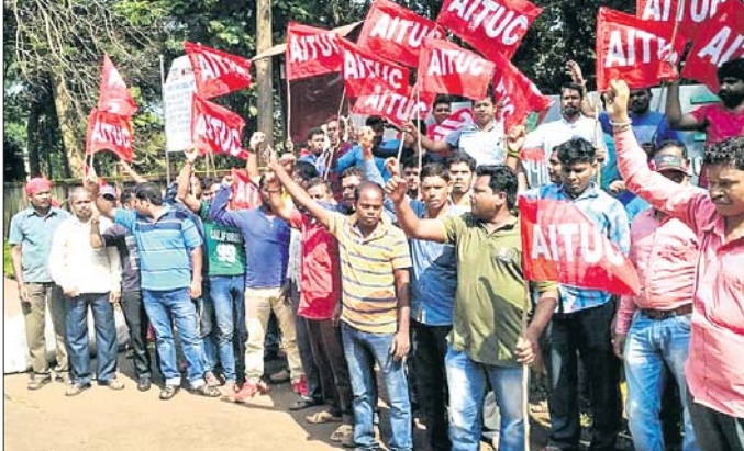
ଧାରଣାରେ ସାମିଲ ହୋଇଥିବା ଠିକା କର୍ମଚାରୀ।

ଠିକା ସଂସ୍ଥା ଡେକୋର କାର୍ଯ୍ୟରେ କର୍ମଚାରୀଙ୍କୁ ଦେଇ ମାସ ହେଲା କାମ ବିଭାଗ କର୍ମଚାରୀଙ୍କ ଖାମଖିଆଳ ମନଭାବକୁ ଏଭଳି ଅଭିଯୋଗ କରିଛନ୍ତି।