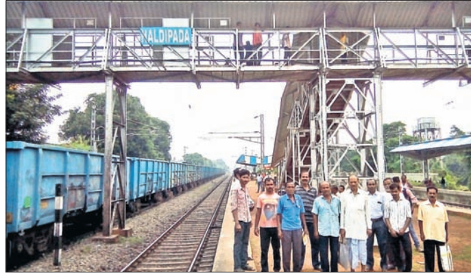
ହଳଦୀପଦା ରେଳଷ୍ଟେଶନ ।

ଦକ୍ଷିଣ-ପୂର୍ବ ରେଳପଥର ଖଡ଼ଗପୁର ଡିଭିଜନ ଅନ୍ତର୍ଗତ ବାଲେଶ୍ୱର ଜିଲ୍ଲା ହଳଦୀପଦା ରେଳଷ୍ଟେଶନ ରମନାଗମନ କ୍ଷେତ୍ରରେ ଗୁରୁତ୍ୱ ଦେବାକୁ ନିଷ୍ପତ୍ତି ହୋଇଥିଲା ।