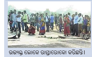
ଉତ୍ତମ ଲୋକେ ରାସ୍ତାରେକୋ କରିଛନ୍ତି।

ପାଟଣା ବ୍ଲକ୍ ଚୁରୁପୁଙ୍ଗା ଥାନା ଚେମଣା ନର୍ସରୀ ଛକ ନିକଟରେ ମଙ୍ଗଳବାର ଅପରାହ୍ନରେ ୪୯ ନମ୍ବର ଜାତୀୟ ରାଜପଥ ପାର ହେଉଥିବା ବେଳେ ଅଜଣା ଗାଡ଼ି ଧକ୍କାରେ ଜଣେ ମହିଳାଙ୍କ ମୃତ୍ୟୁ ଘଟିଛି।