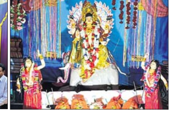
ଝୁମୁରାରେ ବିଶ୍ୱକର୍ମା ପୂଜା।