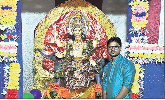
କୁକୁର ଆକାଂକ୍ଷା କାର୍ଯ୍ୟକ୍ରମରେ ବିଶ୍ୱକର୍ମାଙ୍କ ପୂଜାର୍ଚ୍ଚନା ।

ସୋର ଥାନା ଅନ୍ତର୍ଗତ ମାଣିପୁର ପଞ୍ଚାୟତର ଖୁଣ୍ଟା ଗ୍ରାମରେ ଏକ ପାଗଳ କୁକୁର କାମୁଡ଼ାରେ ୭ଜଣ ଆହତ ହୋଇ ସୋର ଡାକ୍ତରଖାନାରେ ଚିକିତ୍ସାଧିନ ଅଛନ୍ତି ।