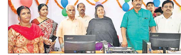
କାର୍ଯ୍ୟକ୍ରମରେ ଉପସ୍ଥିତ ଅତିଥିମାନେ ।

ଗଜପତି ଜିଲ୍ଲା ପାରଳାଖେମୁଣ୍ଡି ରେଳଷ୍ଟେଶନ ନିକଟରେ ରୁଧିରା ସଂରକ୍ଷଣ ଓ ଅଣ ସଂରକ୍ଷଣ ଟିକେଟ ଗୃହ ତଥା ଶ୍ରୀଜଗନ୍ନାଥ ଯାତ୍ରା ଟିକେଟ୍ ସେବାକେନ୍ଦ୍ର ଉଦ୍ଘାଟିତ ହୋଇଯାଇଛି ।