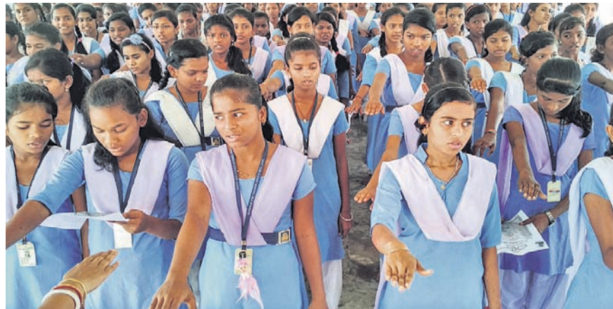
ଛାତ୍ରୀମାନେ ବାହ୍ୟ ମଳମୁକ୍ତ ଡ୍ରାଉଟ ଗଠନ ନେଇ ଶପଥ ପାଠ କରୁଛନ୍ତି।