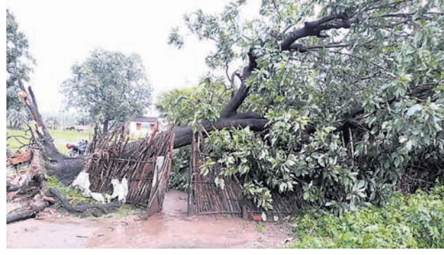
ଏକ ଘର ଉପରେ ଗଛ ପଡ଼ିଛି।