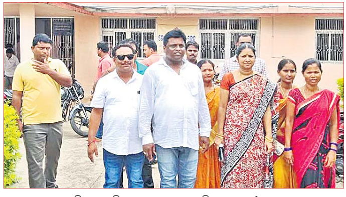
ମତ ଉପସ୍ଥାପନ କରିବାକୁ ଆସିଥିବା କଂଗ୍ରେସ କାଉନସିଲରମାନେ ପୋଲିସର ଦ୍ଵାରା ହୋଇଥିଲେ କଂଗ୍ରେସ କାଉନସିଲରମାନେ ଘଟଣାକୁ ନେଇ କାର୍ଯ୍ୟକ୍ରମରେ ଅଣଦେଖା କରାଯାଇଥିବା ମଧ୍ୟ ଅଭିଯୋଗ ଆଣିଥିଲେ ।

ଗଜପତି ଜିଲ୍ଲା ପାରଳାଖେମୁଣ୍ଡିର ନୂତନ ପୌର କାର୍ଯ୍ୟାଳୟ ଉଦ୍ଘାଟନକୁ ନେଇ ବିବାଦ ଘଟଣାରେ ରୁଧିରା ନିର୍ଦ୍ଦେଶ ଦେଇ ବିଜେଡିର କାଉନସିଲରମାନେ ଉପଜିଲ୍ଲାପାଳଙ୍କ ନିକଟରେ ନିଜର ଯୁକ୍ତି ଉପସ୍ଥାପନ କରିଛନ୍ତି ।