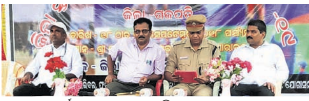
ଉଦ୍‌ଘାଟନା କାର୍ଯ୍ୟକ୍ରମରେ ମଞ୍ଚାସୀନ ଅତିଥି ।