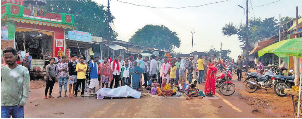
ପରିବାର ଲୋକ ଓ ସମ୍ପର୍କୀୟମାନେ ମୃତଦେହ ରଖି ରାସ୍ତାରୋକ୍ତି କରିଛନ୍ତି ।

ନବରଙ୍ଗପୁର ଜିଲ୍ଲା ଅନ୍ତର୍ଗତ ରାଜନୀତି କୁଳ ସହର ମହକୁମା ସ୍ଥିତ ମଶାଣିରେ ଦୀର୍ଘ ନିକଟସ୍ଥ ଏକ ମଶାଣିରେ ଶବ ସଜ୍ଜାକୁ ନେଇ ୨ ଗ୍ରାମ ମଧ୍ୟରେ ବୁଧବାର ଉତ୍ତେଜନା ଦେଖାଦେଇଛି । ପରିବାର ଲୋକ ଶବ ସଜ୍ଜା କରି ପାରି ନ ଥିଲେ । ସେହି ମଶାଣିରେ ଶବ ସଜ୍ଜା ଦାବି କରି ଉପରକୋଟ-କୁନ୍ଦେଇ ମୁଖ୍ୟ ରାସ୍ତାର ରାଜନୀତି ବଜାରସ୍ଥିତ ହନୁମାନ ମନ୍ଦିର ନିକଟରେ ମୃତଦେହ ରଖି ପରିବାର ଲୋକ ରାସ୍ତା ଅବରୋଧ କରି ଧାରଣାରେ ବସିଛନ୍ତି ।