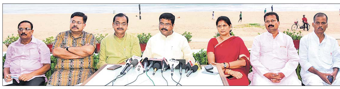
ଝବରବାବା ସମ୍ମିଳନୀରେ କେନ୍ଦ୍ରମନ୍ତ୍ରୀ ଧର୍ମେନ୍ଦ୍ର ପ୍ରଧାନ ଓ ଅନ୍ୟ ଭାଜପା ନେତାମାନେ ।