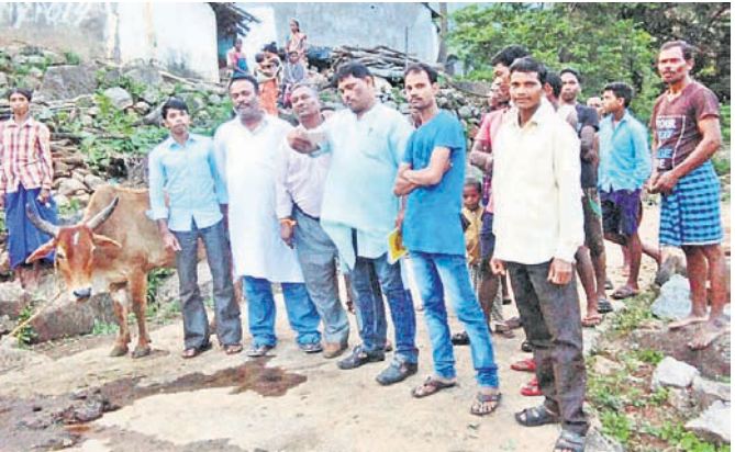
କୁଜାସିଂ ଗ୍ରାମରେ ଯାଇଥିବା ଭାଜପା କର୍ମକର୍ମୀ ।