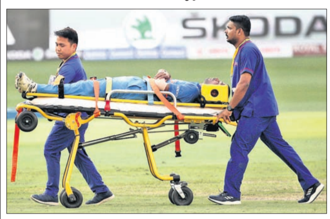
ଷ୍ଟେଡିୟମରେ ବାହାରକୁ ଗଲେ ପାଣ୍ଡ୍ୟା

ରୁଧିର ଖେଳାଯାଇଥିବା ପାକିସ୍ତାନ ବିପକ୍ଷ ମ୍ୟାଚରେ ଭାରତୀୟ ଅଲରାଉଣ୍ଡର ହାର୍ଦ୍ଦିକ ପାଣ୍ଡ୍ୟା ଆହତ ହୋଇଥିଲେ ଓ ତାଙ୍କୁ ଷ୍ଟେଡିୟମ ଯୋଗେ ପଠା ବାହାରକୁ ନିଆଯାଇଥିଲା। ଆକ୍ରମକ ଲୋୟର ବ୍ୟାକ୍ ଇଞ୍ଜିରି ବା ପିଠି ନିମ୍ନ ଭାଗରେ ଆଘାତ ସମସ୍ୟା ଯୋଗୁ ପାଣ୍ଡ୍ୟାଙ୍କୁ ବାହାରକୁ ନିବାକୁ ହୋଇଥିଲା। ପାକିସ୍ତାନ ଇନିଂସର ୧୮ତମ ଓଭରରେ ଏହି ଘଟଣା ଘଟିଥିଲା। ପାଣ୍ଡ୍ୟା ତାଙ୍କ ପଞ୍ଚମ ଓଭରର ପଞ୍ଚମ ବଲ୍ ପକାଇବା ପରେ ଫଲୋଥିରେ ବଲ୍ ସଂଗ୍ରହ କରିବା ବେଳେ ଯତ୍ନଶୀଳ ଅନୁଭବ କରି ତଳେ ପଡିଯାଇଥିଲେ। ଏପରି କି ସେ ଉଠିବାକୁ ସକ୍ଷମ ହୋଇ ନ ଥିଲେ। ତାଙ୍କର ମେଡିକାଲ ଚେକ୍‌ଅପ୍ କରାଯାଇଥିଲା। ସେ ଏବେ ଠିଆହେବାକୁ ସକ୍ଷମ ବୋଲି ମେଡିକାଲ ଟିମ୍ ତରଫରୁ ଜଣାଇଥିଲା। ତାଙ୍କ ବଦଳ ଖେଳାଳିଭାବେ ମନୀଷ ପାଣ୍ଡେ ପଡିଆରେ ପ୍ରବେଶ କରିଥିଲେ। ପଡିଆ ଛାଡିବା ବେଳକୁ ପାଣ୍ଡ୍ୟା ୪.୫ ଓଭର ୧୮ତମ ଓଭରରେ ଏହି ଘଟଣା ଘଟିଥିଲା। ପାଣ୍ଡ୍ୟା ତାଙ୍କ ପଞ୍ଚମ ଓଭରର ପଞ୍ଚମ ବଲ୍ ପକାଇବା ପରେ ଫଲୋଥିରେ ବଲ୍ ସଂଗ୍ରହ କରିବା ବେଳେ ଯତ୍ନଶୀଳ ଅନୁଭବ କରି ତଳେ ପଡିଯାଇଥିଲେ।