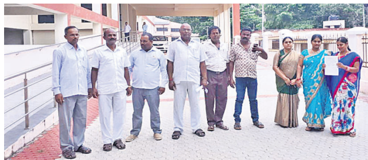
ସ୍ମାରକପତ୍ର ଦେବାକୁ ଆସିଥିବା ସରପଞ୍ଚ, ସମିତିସଭ୍ୟ ଓ ଓଡ଼ିଶାଧିକାରୀମାନେ ।