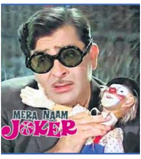
ସିଂ ଏବଂ ରାଜେନ୍ଦ୍ର କୁମାର ଅଭିନୟ କରିଥିଲେ। କେ.ଏ. ଆବାସ କାହାଣୀ ଏବଂ ଚିତ୍ରନାଟ୍ୟ ରଚନା କରିଥିବା ବେଳେ ସଙ୍ଗୀତ ନିର୍ଦ୍ଦେଶନା ଦେଇଥିଲେ ଶଙ୍କର ଜୟକିଶନ।

ସାଧାରଣତଃ ଗୋଟିଏ ସିନେମାରେ ଗୋଟିଏ ହିଁ ଇଣ୍ଡରଭାଲ ଥାଏ। କାହାଣୀ ଏକ ନିର୍ଦ୍ଦେଶକ ମୋଡ଼ରେ ଗଠି କରୁଥିବା ବେଳେ ହଠାତ୍ ପରଦା ଉପରେ ଲେଖି ହୋଇଯାଏ 'ଇଣ୍ଡରଭାଲ'। ସେହି ସମ୍ବନ୍ଧ ସମୟରେ ସିନେମା ଭିତରେ ପାଖାପାଖି ଦେଖି ଘଣ୍ଟା ବୁଡ଼ି ରହିଥିବା ଦର୍ଶକ ମାଇକ୍ସ ଫ୍ରେଶ କରିଥାଆନ୍ତି। ହେଲେ ଏପରି ଏକ ହିନ୍ଦୀ ସିନେମା ଅଛି ଯେଉଁଥିରେ ଦୁଇଟି ଇଣ୍ଡରଭାଲ ଥିଲା। ବଲିଉଡ଼ର ଶୋ' ମ୍ୟାନ୍ ଗାଜ କପୁରଙ୍କ ପ୍ରଯୋଜିତ, ନିର୍ଦ୍ଦେଶିତ ତଥା ଅଭିନୀତ ସେହି ସିନେମାଟି ହେଲା 'ମେରା ନାମ ଗୋକର'। ୧୯୭୦ରେ ରିଲିଜ୍ ହୋଇଥିବା ଏହି ଫିଲ୍ମର ଅବଧି ଥିଲା ୨୪୪ ମିନିଟ୍। ରାଜ କପୁରଙ୍କ ବ୍ୟତୀତ ଏଥିରେ ସିମି ଗେରେଫାଲ, ମନୋଜ କୁମାର, ରଷି କପୁର, ଧର୍ମେନ୍ଦ୍ର, ଦାରା