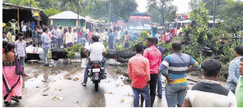
କାଲିମେଳାରେ ଝଡ଼ତୋପାନରେ ଉପୁଡ଼ି ପଡ଼ିଥିବା ଗଛ।