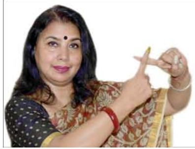
Padma Shri Aruna Mohanty Odissi Danseuse