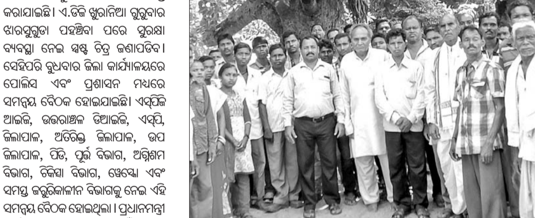
ବିଦ୍ୟାଳୟରେ ଅଭିଭାବକ ସଭାରେ ଉପସ୍ଥିତ ଶିକ୍ଷକ, ଅଭିଭାବକ।

ଝାରସୁଗୁଡ଼ା ସୁରକ୍ଷା ପାଇଁ ରୁଧିର ଦଳୀୟ କାର୍ଯ୍ୟକ୍ରମ ନେଇ ଭାଜପା ଏକତରଫା ପ୍ରଚାରପ୍ରସାର ଚଳାଇଛି ବୋଲି ବିଜେଡି ଅଭିଯୋଗ କରିଛି। ବିମାନବନ୍ଦର କାର୍ଯ୍ୟକ୍ରମ ନେଇ ରାଜ୍ୟ ସରକାରଙ୍କ ଅବଦାନ ବିଷୟରେ ଭାଜପା କୁତାଭିପ୍ରାୟ ଅଭିଯୋଗ କରିଛି ଝାରସୁଗୁଡ଼ା ଜିଲ୍ଲା ବିଜେଡି। ଏନେଇ ରୁଧିର ଦଳୀୟ କାର୍ଯ୍ୟାଳୟରେ ଆୟୋଜିତ ଖବରଦାତା ସମ୍ମିଳନୀରେ ରାଜ୍ୟ ସରକାରଙ୍କ ଅନୁଦାନ ସମ୍ପର୍କରେ ସର୍ବଶେଷ ବିବରଣୀ ପ୍ରଦାନ କରାଯାଇଛି। ବିମାନବନ୍ଦର କାର୍ଯ୍ୟକ୍ରମ ଆନ୍ତରାଳେ ଆର୍ଥିକ ଏବଂ ଅନ୍ୟାନ୍ୟ