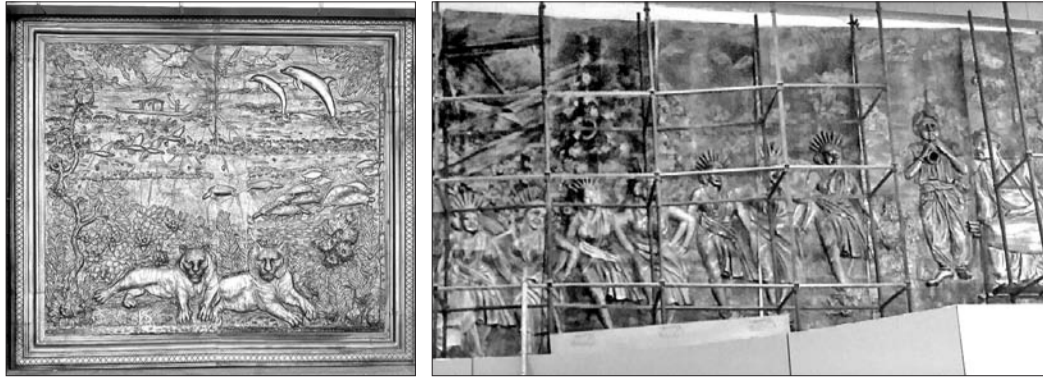
ବନ୍ୟଜନ୍ତୁ ଏବଂ ପରିବେଶ ସଂକ୍ରାନ୍ତୀୟ ଦୃଶ୍ୟ।

କୋଲାବିରା, ୧୯।୯ (ଡି.ଏନ.ଏ.) ଝାରସୁଗୁଡ଼ା ଜିଲ୍ଲା କୋଲାବିରା ବନାଞ୍ଚଳରେ ଅସୁସ୍ଥ ହାତୀର ଚିକିତ୍ସା ପାଇଁ ଝାରସୁଗୁଡ଼ା ଉଚ୍ଚ ପ୍ରଶାସନିକ ସ୍ତରରୁ ଉଦ୍ଧାରଣ ପାଇଁ ଚେଷ୍ଟା କରାଯାଇଥିଲା। କୋଲାବିରା ବନାଞ୍ଚଳରେ ଅସୁସ୍ଥ ହାତୀର ଚିକିତ୍ସା ପାଇଁ ଝାରସୁଗୁଡ଼ା ଉଚ୍ଚ ପ୍ରଶାସନିକ ସ୍ତରରୁ ଉଦ୍ଧାରଣ ପାଇଁ ଚେଷ୍ଟା କରାଯାଇଥିଲା। କୋଲାବିରା ବନାଞ୍ଚଳରେ ଅସୁସ୍ଥ ହାତୀର ଚିକିତ୍ସା ପାଇଁ ଝାରସୁଗୁଡ଼ା ଉଚ୍ଚ ପ୍ରଶାସନିକ ସ୍ତରରୁ ଉଦ୍ଧାରଣ ପାଇଁ ଚେଷ୍ଟା କରାଯାଇଥିଲା।