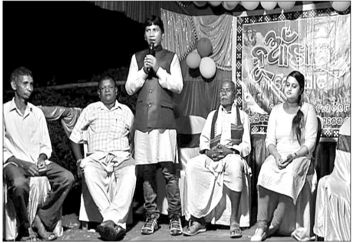
ନୂଆଁଖାଇ ଭେଟଯାତ୍ରା କାର୍ଯ୍ୟକ୍ରମରେ ଉପସ୍ଥିତ ଅତିଥି ।