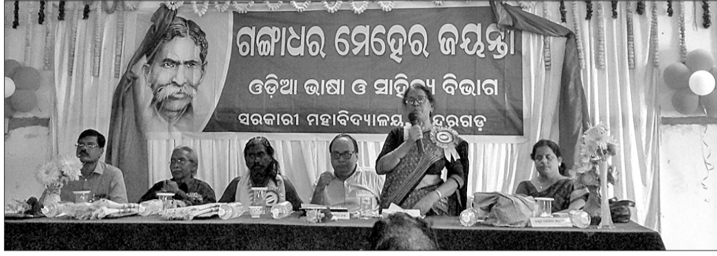
ଗଙ୍ଗାଧର ସାହିତ୍ୟ ଆଲୋଚନା ଚକ୍ରରେ ମଞ୍ଚାସୀନ ଅତିଥିମାନେ ।

ସୁନ୍ଦରଗଡ଼ ସରକାରୀ ମହାବିଦ୍ୟାଳୟର ଓଡ଼ିଆ ଭାଷା ସାହିତ୍ୟ ବିଭାଗ ତରଫରୁ ଗଙ୍ଗାଧର ସାହିତ୍ୟ ଆଲୋଚନାଚକ୍ର ଅନୁଷ୍ଠିତ ହୋଇଯାଇଛି ।