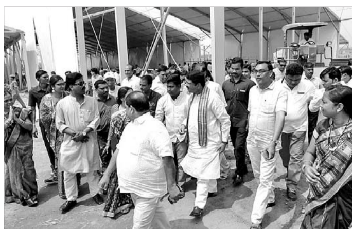
ଅମଳିପାଲି ସଭାସ୍ଥଳ ବୁଲି ଦେଖୁଥିଲେ ମନ୍ତ୍ରୀ।

କୋଲାବିରା ବନାଞ୍ଚଳରେ ଅସୁସ୍ଥ ହାତୀର ଚିକିତ୍ସା ପାଇଁ ଝାରସୁଗୁଡ଼ା ଉଚ୍ଚ ପ୍ରଶାସନିକ ସ୍ତରରୁ ଉଦ୍ଧାରଣ ପାଇଁ ଚେଷ୍ଟା କରାଯାଇଥିଲା। କୋଲାବିରା ବନାଞ୍ଚଳରେ ଅସୁସ୍ଥ ହାତୀର ଚିକିତ୍ସା ପାଇଁ ଝାରସୁଗୁଡ଼ା ଉଚ୍ଚ ପ୍ରଶାସନିକ ସ୍ତରରୁ ଉଦ୍ଧାରଣ ପାଇଁ ଚେଷ୍ଟା କରାଯାଇଥିଲା। କୋଲାବିରା ବନାଞ୍ଚଳରେ ଅସୁସ୍ଥ ହାତୀର ଚିକିତ୍ସା ପାଇଁ ଝାରସୁଗୁଡ଼ା ଉଚ୍ଚ ପ୍ରଶାସନିକ ସ୍ତରରୁ ଉଦ୍ଧାରଣ ପାଇଁ ଚେଷ୍ଟା କରାଯାଇଥିଲା।