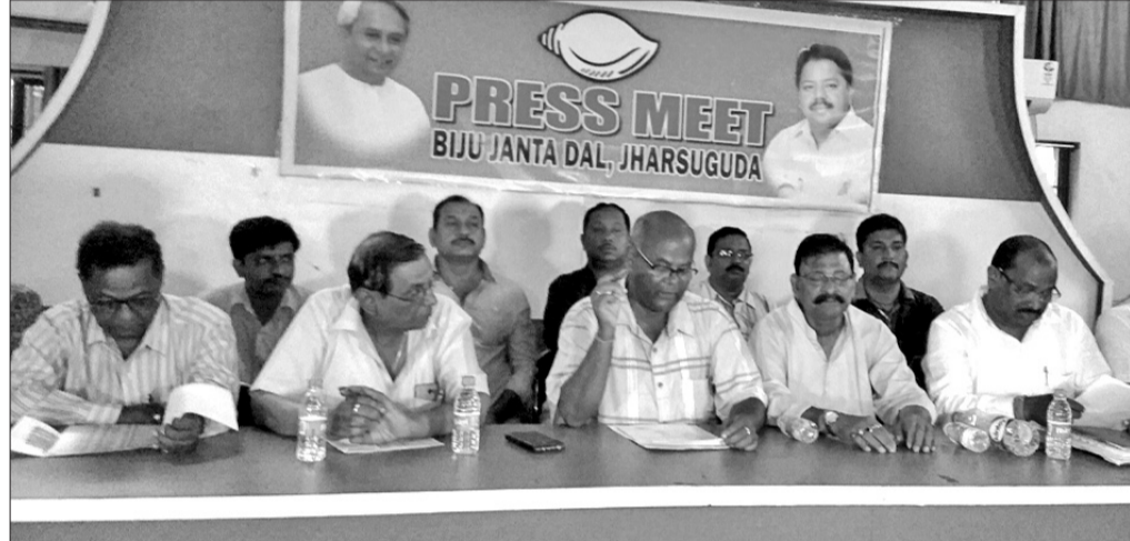
ବିଜେଡି କାର୍ଯ୍ୟାଳୟରେ ଉପସ୍ଥିତ ଦଳୀୟ କାର୍ଯ୍ୟକର୍ତ୍ତା।

ଝାରସୁଗୁଡ଼ା ଅଫିସ, ୧୯।୯- କଳା ଓ ସଂସ୍କୃତିର ରାଜ୍ୟ ଓଡ଼ିଶା। ଏହି ରାଜ୍ୟର କୋଣ ଅନୁକୋଣରେ ଭିନ୍ନ ଭିନ୍ନ କଳା ଓ ସଂସ୍କୃତି ଦୃଶ୍ୟମାନ ହୁଏ। ଓଡ଼ିଶାର ପୂର୍ବରୁ ପଶ୍ଚିମ ଏବଂ ଉତ୍ତରରୁ ଦକ୍ଷିଣ ଭାଗ ଯାଏଁ ସ୍ୱତନ୍ତ୍ର ଏବଂ ଭିନ୍ନ ଭିନ୍ନ ପରମ୍ପରାକୁ ନେଇ ସମୃଦ୍ଧ। କେବଳ ପରମ୍ପରା ନୁହେଁ, ପ୍ରାକୃତିକ ପରିବେଶର ମନୋହର ଦୃଶ୍ୟ ରାଜ୍ୟର ମର୍ଯ୍ୟାଦାକୁ ଦେଖି ବିଦେଶରେ ପରିଚିତ କରାଇଛି। ଝାରସୁଗୁଡ଼ା ବିମାନବନ୍ଦରର ଚୌଦର୍ଯ୍ୟକରଣ ଭିତରେ ରାଜ୍ୟର ପ୍ରତ୍ୟେକ ଭାଗର ଝଲକ ଦେଖିବାକୁ ମିଳେ। ଝାରସୁଗୁଡ଼ା ବିମାନବନ୍ଦର ଥିବା ପ୍ୟାଭିଲିୟନରେ ରହିଛି ସଂସ୍କୃତି, ପରମ୍ପରା ଓ ପରିବେଶ। ଏହାର ଉପସ୍ଥାପନା ଶୈଳି ମଧ୍ୟ ଉଚ୍ଚକୋଟୀର। ଶିଳ୍ପସଂସ୍ଥା ବେଦାନ୍ତର ଆର୍ଥିକ ବିନିଯୋଗ ଏବଂ ଶିଳ୍ପୀ ପ୍ରଦାୟ