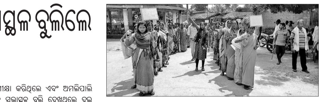
ମହିଳାମାନେ ନିଶାନିବାରଣ ସକାଶେ ସଚେତନତା ଶୋଭାଯାତ୍ରାରେ ଯାଉଛନ୍ତି।

ଝାରସୁଗୁଡ଼ା ଅଫିସ, ୧୯।୯- ଝାରସୁଗୁଡ଼ା ବିମାନବନ୍ଦର ଉପସ୍ଥାପନା ନେଇ ଭାଜପା ଏକତରଫା ପ୍ରଚାରପ୍ରସାର ଚଳାଇଛି ବୋଲି ବିଜେଡି ଅଭିଯୋଗ କରିଛି। ବିମାନବନ୍ଦର କାର୍ଯ୍ୟକ୍ରମ ନେଇ ରାଜ୍ୟ ସରକାରଙ୍କ ଅବଦାନ ବିଷୟରେ ଭାଜପା କୁତାଭିପ୍ରାୟ ଅଭିଯୋଗ କରିଛି ଝାରସୁଗୁଡ଼ା ଜିଲ୍ଲା ବିଜେଡି। ଏନେଇ ରୁଧିର ଦଳୀୟ କାର୍ଯ୍ୟାଳୟରେ ଆୟୋଜିତ ଖବରଦାତା ସମ୍ମିଳନୀରେ ରାଜ୍ୟ ସରକାରଙ୍କ ଅନୁଦାନ ସମ୍ପର୍କରେ ସର୍ବଶେଷ ବିବରଣୀ ପ୍ରଦାନ କରାଯାଇଛି। ବିମାନବନ୍ଦର କାର୍ଯ୍ୟକ୍ରମ ଆନ୍ତରାଳେ ଆର୍ଥିକ ଏବଂ ଅନ୍ୟାନ୍ୟ