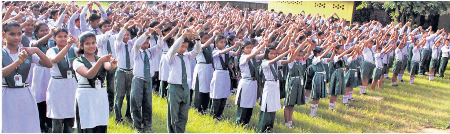
ଧରତ୍ରୀ ଏବଂ ଓଡ଼ିଶା ପୋଷ୍ଟ ପକ୍ଷରୁ ଆରମ୍ଭ ହୋଇଥିବା 'ପ୍ଲାଷ୍ଟିକ୍ ଫ୍ରି ଓଡ଼ିଶା' ଅଭିଯାନରେ ସାମିଲ ହୋଇଛନ୍ତି ରାଉରକେଲା ମହାନଗର ନିଗମ ଅନ୍ତର୍ଗତ ବାରି ରାଉତ ଶିକ୍ଷା ନିକେତନର ଶିକ୍ଷୟିତ୍ରୀ ଶିକ୍ଷକ (ଉପର), ଛାତ୍ରାଛାତ୍ରୀ।