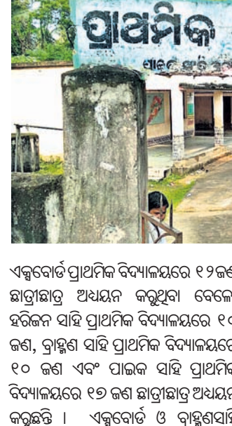
ପ୍ରାଥମିକ ବିଦ୍ୟାଳୟର ଛାତ୍ରଛାତ୍ରୀ ।