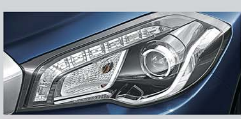
LED Projector Headlamps with LED DRLs