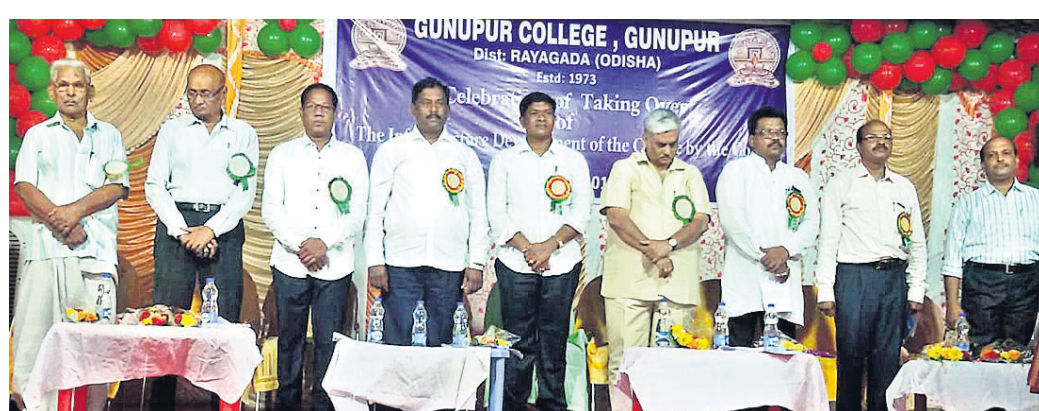
କାର୍ଯ୍ୟକ୍ରମରେ ଯୋଗଦେଇଥିବା ଅତିଥିମାନେ ।