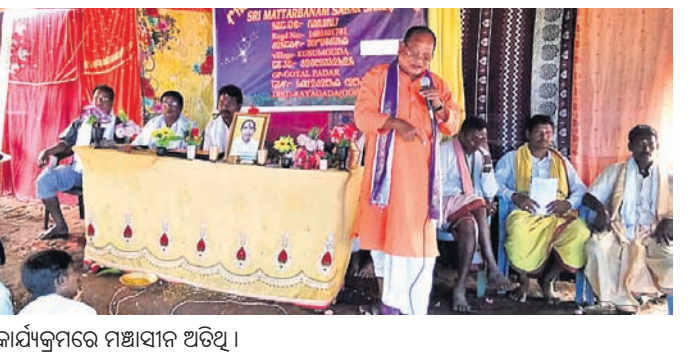
କାର୍ଯ୍ୟକ୍ରମରେ ମଞ୍ଚାସୀନ ଅତିଥି ।

ସହ ଓ ପାଇକ ସାହି ପ୍ରାଥମିକ ବିଦ୍ୟାଳୟ ଗୌଡ଼ସାହି ପ୍ରାଥମିକ ବିଦ୍ୟାଳୟରେ ମିଶ୍ରଣ ହେବାର ସମ୍ଭାବନା ରହିଛି । ଏନସିସି ଅଧ୍ୟକ୍ଷ ସହର ବିଦ୍ୟାଳୟ ଷ୍ଟାଫ୍ କମିଟି ଅଧ୍ୟକ୍ଷ ହୋଇଥିଲେ ମଧ୍ୟ ଜଣେ ଲେଖାଏଁ ଶିକ୍ଷକ ଥିବା ବିଷୟ ସେ ବିଭାଗୀୟ ଅଧିକାରୀଙ୍କୁ ଅବଗତ କରାଇ ନାହାନ୍ତି । ଗତ ୨୦୧୫-୧୬ ଶିକ୍ଷା ବର୍ଷରେ ଆବଶ୍ୟକତାଠାରୁ କମ୍ ପିଲା ଥିବାରୁ ସହରର ନିୟାମନସାହି ପ୍ରାଥମିକ ବିଦ୍ୟାଳୟ ଉଦଘାଟିତ ହୋଇଥିଲା । ଏନେଇ ଅଧ୍ୟକ୍ଷଙ୍କୁ ପଚାରିବାକୁ ଦାବିକରି ବିଭାଗ ତରଫରୁ ହେଲା ବିଦ୍ୟାଳୟ ଷ୍ଟାଫ୍ କମିଟିର କୌଣସି ବୈଠକ ବସାଯାଇନାହିଁ । ତଥାପି ଷ୍ଟାଫ୍ ଗ୍ରାମ ପ୍ରଦେଶ ପରିଆଡ଼େ ନିଆଁ ଚାଳିଆରେ ଦାବିକରି ହେଲା ସ୍ଥାନୀୟ ଶିକ୍ଷାଧିକାରୀ ନ ଥିବା ବେଳେ ଏ ଜଣ ଅତିରିକ୍ତ ଗୋଷ୍ଠୀ ଶିକ୍ଷାଧିକାରୀଙ୍କ ବଦଳରେ ଜଣେ ମାତ୍ର ପ୍ରାଥମିକ ବିଦ୍ୟାଳୟ ଏକ୍ସଟେଣ୍ଡିଂ ବିଦ୍ୟାଳୟ