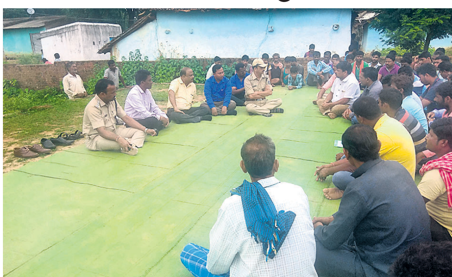
ଧତ୍ତାପାରା ଗ୍ରାମବାସୀଙ୍କ ସହ ପୋଲିସ ଓ ପ୍ରଶାସନିକ ଅଧିକାରୀମାନେ ଆଲୋଚନା କରୁଛନ୍ତି ।