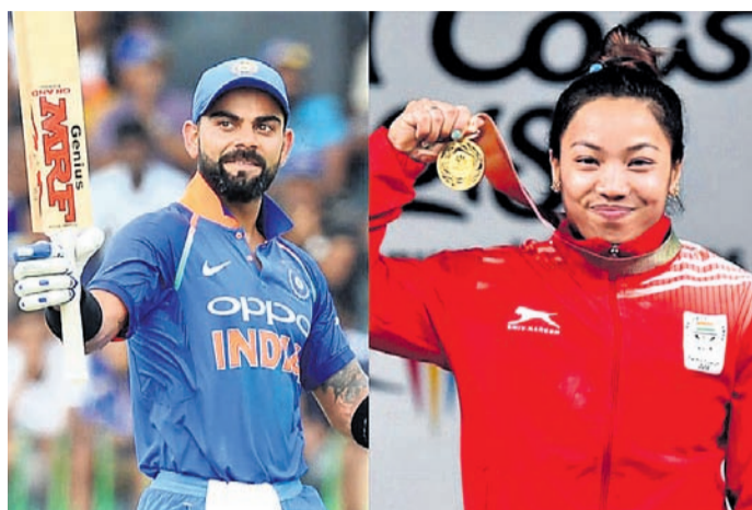
ବିରାଟ କୋହଲି ଓ ମାରିସାଜା ଚାନ୍ଦୁ

ଭାରତୀୟ କ୍ରିକେଟ ଅଧିନାୟକ ବିରାଟ କୋହଲି ଏବଂ ବିଶ୍ୱ ଚାମ୍ପିୟନ ଭାରୋଲୋଲିକା ମାରିସାଜା ଚାନ୍ଦୁ ସେପ୍ଟେମ୍ବର ୨୫ରେ ସମ୍ମାନଜନକ ରାଜ୍ୟ ଗାନ୍ଧୀ ଖେଳ ରତ୍ନ ପୁରସ୍କାର ପାଇବେ।