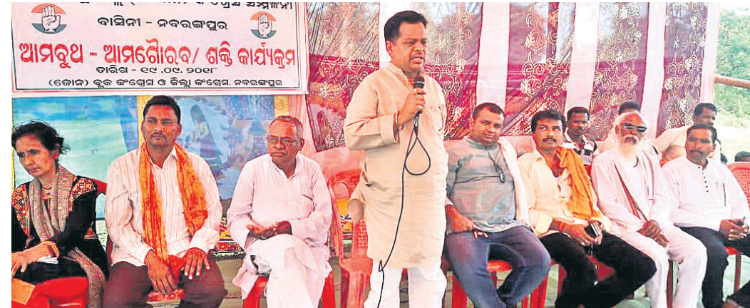
ବାସିନୀ ପଞ୍ଚାୟତରେ କଂଗ୍ରେସର 'ମୋ ରୁଥ୍ ଆମ ଗୌରବ' କାର୍ଯ୍ୟକ୍ରମରେ ଜିଲ୍ଲା ସଭାପତି ଉଦ୍‌ବୋଧନ ଦେଉଛନ୍ତି ।