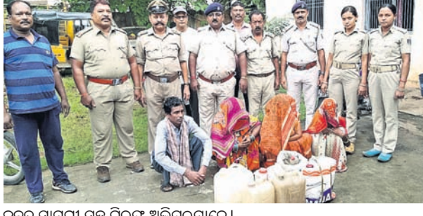
କବଚ ସାମଗ୍ରୀ ସହ ଗିରଫ ଅଭିଯୁକ୍ତମାନେ।