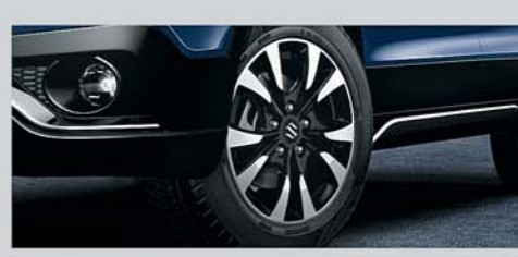
Machined Alloy Wheels