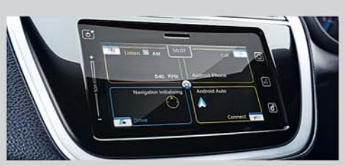
SmartPlay Infotainment System with Android Auto