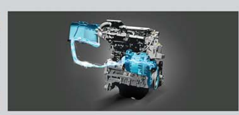
DDiS 200 Smart Hybrid Diesel Engine