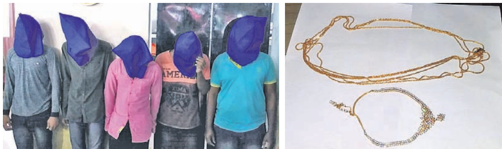
ଗିରଫ ୪ ଅଭିଯୁକ୍ତ, ଜବତ ସୁନା ଅଳଙ୍କାର ।