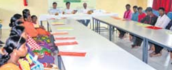
ଶିବିରରେ ଯୋଗଦେଇଥିବା ମହିଳା ଓ ପୁରୁଷ ଚାଷୀମାନେ।