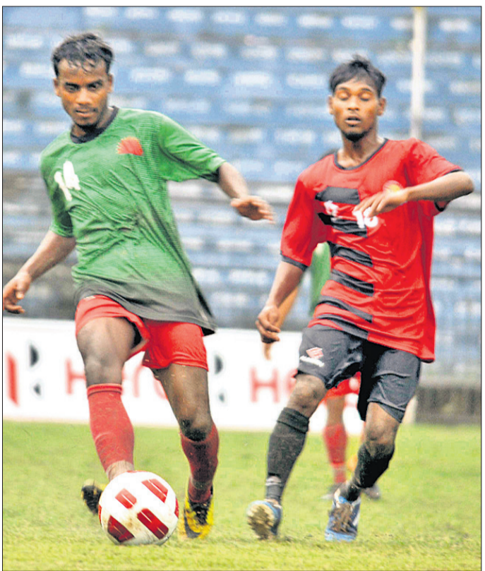
ସନ୍ତୋଷକ ଓ ରାଜିନ୍ ଷୁଭେଷ୍ଟ ମଧ୍ୟରେ ଅନୁଷ୍ଠିତ ମ୍ୟାଚ।

ବାରବାଟୀ ଷ୍ଟାଡିୟମରେ ଚାଲିଥିବା ଫାଓ ପ୍ରଥମ ଡିଭିଜନ ଲିଗରେ ଗୁରୁତ୍ୱପୂର୍ଣ୍ଣ ଖେଳାଯାଇଥିବା ଗୋଟିଏ ମ୍ୟାଚରେ ରାଜିନ୍ ଷୁଭେଷ୍ଟ କ୍ଲବ ୧-୦ ଗୋଲରେ ସନ୍ତୋଷକର ଫଳ ପ୍ରାପ୍ତ କରିଛି।