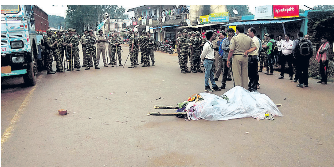
ରାସ୍ତାରେ ପଡିରହିଥିବା ମୃତଦେହକୁ ପୋଲିସ ଜରି ରହିଛି ।