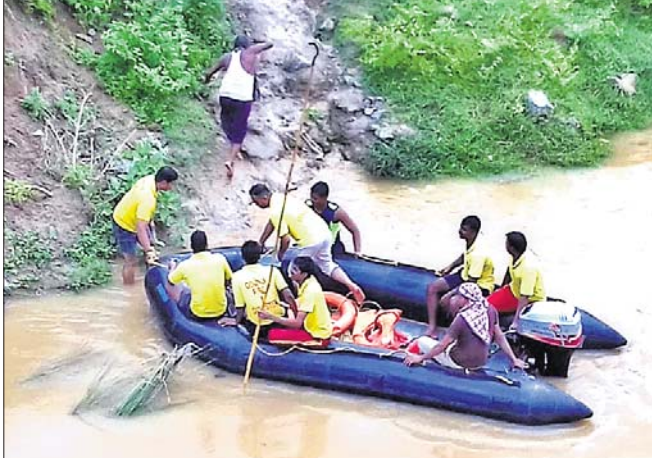
ଅଗ୍ନିଶମ ବିଭାଗ କର୍ମଚାରୀଙ୍କ ଦ୍ୱାରା ଉଦ୍ଧାର କାର୍ଯ୍ୟ କରାଯାଇଛି ।

ଗୋଟି ଖସିଯିବାକୁ ଭାସି ଯାଇଥିଲେ । ହିଞ୍ଜିଳିକାଟୁ ଓ ପୁରୁଷୋତ୍ତମପୁର ଅଗ୍ନିଶମ ବିଭାଗ କର୍ମଚାରୀ ପହଞ୍ଚିବାକୁ ଖୋଜାଖୋଜି କରିଥିଲେ । ମୋଟର ଚାଳିତ ଡ୍ରାକ୍ଟାରେ ରକ୍ଷିକୁଳ୍ୟା ନଦୀର ରାଳବ,ନନ୍ଦିନୀ,ପୁଟିଆପଦର ଯାତ୍ରୀ ଆଦି ଅଞ୍ଚଳରେ ଉଦ୍ଧାର କାର୍ଯ୍ୟ କରାଯାଇଛି । କିନ୍ତୁ ସନ୍ଧ୍ୟା ପୁଣ୍ୟ ନିଖୋଜକ ପତା ମିଳି ନ ଥିବା ହିଞ୍ଜିଳିକାଟୁ ଆଇଆଇସି ପ୍ରଶାନ୍ତ କୁମାର ସାହୁ କହିଛନ୍ତି ।