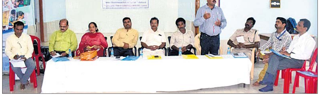
ସଭାରେ ଉପସ୍ଥିତ ଅତିଥି ।