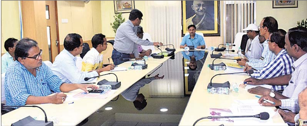
ବୈଠକରେ ଜିଲ୍ଲାପାଳ ଏବଂ ଅନ୍ୟମାନେ ଉପସ୍ଥିତ ।