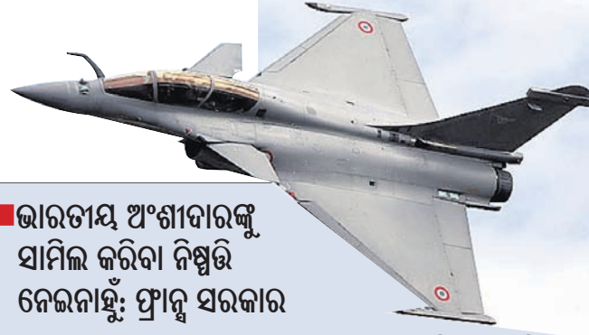
ଭାରତୀୟ ଅଂଶଦାରଙ୍କୁ ସାମିଲ କରିବା ନିଷ୍ପତ୍ତି ନେଇନାହିଁ: ପ୍ରାୟତଃ ସରକାର

ବାୟୁସେନାର ଶକ୍ତିକୁ ପାଇଁ ପ୍ରାୟତଃ ରାଫେଲ୍ ଯୁଦ୍ଧବିମାନ କିଣିବା ନିମିତ୍ତ ହୋଇଥିବା ବୁକ୍ତିରେ ଦୁର୍ନୀତିର ଛିଟା ରହିଥିବା କଂଗ୍ରେସ ସମେତ ବିରୋଧୀ ଦଳଗୁଡ଼ିକ ସରକାରଙ୍କୁ ଆକ୍ଷେପ କରୁଛନ୍ତି। ଏତିକିବେଳେ ପ୍ରାୟତଃ ପୂର୍ବତନ ରାଷ୍ଟ୍ରପତି ପ୍ରଂୟୁଆ ଓଲିଆଙ୍କ ମନ୍ତବ୍ୟ ବିରୋଧୀ ସୂକ୍ଷ୍ମ କରିଛି। ଚିଲିଆସ୍ ଡିଫେନ୍ସ ଲିମିଟେଡ୍ (ଆରଡିଏଲ୍)କୁ ତତ୍କାଳୀନ ପ୍ରାୟତଃ ସରକାର ଚୟନ କରି ନ ଥିଲେ ମୁଖ୍ୟ ରାଫେଲ୍ ବୁକ୍ତିବେଳେ ଭାରତ ସରକାର ଏହାକୁ ଦାସକୁ ଆଭିବଶନର ଅଂଶଦାର ଦର୍ଶାଇଥିଲେ ବୋଲି କରୁଥିବା କହିଥିଲେ। ଏହାପରେ ତାଙ୍କୁ ସ୍ଥାନୀୟ ସରକାର ମେଡିକାଲ କଲେଜ ତାଲୁକାଖାନାରେ ଭର୍ତ୍ତି କରାଯାଇଥିଲା। ଶନିବାର ସକାଳେ ତାଲୁକାଖାନାକୁ ଡିସ୍ଚାର୍ଜ ହେବା ପରେ ତାଙ୍କୁ କୋର୍ଟରେ ହାଜର କରାଯାଇଥିଲା।