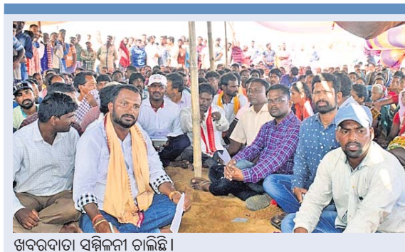
ଦାବି ପୂରଣ ନେଇ ଚାଲିଛି ଆନ୍ଦୋଳନ । ଆଜିରେ ୪୮ ଜଣଙ୍କ ନାଁରେ ମାମଲା

ବିଭିନ୍ନ ଦାବି ନେଇ ଛତ୍ରପୁର ଉପକଣ୍ଠ ଭାରତୀୟ ବିରଳ ମୁରକା (ଆଇଆରଇ) ପ୍ଲାଣ୍ଟର କାର୍ଯ୍ୟ ବନ୍ଦ କରିବା ପ୍ରସଙ୍ଗରେ ୧୨ ଜଣ ଆନ୍ଦୋଳନକାରୀ ଶନିବାର ଛତ୍ରପୁର ସିନିୟର ଡିଜିଟାଲ୍ ସିଭିଲ କୋର୍ଟରେ ହାଜର ହୋଇଥିଲେ ।