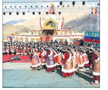
ବିଚାରକ ସ୍ପିକ୍ ଡାକ୍ତରୀକର ଉଚ୍ଚ ନୃତ୍ୟ କାର୍ଯ୍ୟକ୍ରମକୁ 'ସର୍ବବୃହତ୍ ଲଦାଖୀ ନୃତ୍ୟ' ବୋଲି ଘୋଷଣା କରିଥିଲେ। ଏହି ନୃତ୍ୟରେ ଆମେ ଅଭିଭୂତ ଏବଂ ଏହା ଉତ୍ସବରେ ପରିବେଷଣ କରାଯାଏ। ନୂଆ ବିଶ୍ୱ ରେକର୍ଡ ଟାଲଟଲ୍ ହାସଲ ଉତ୍ସବ ପରେ ଗିନିଜ୍ ବିଶ୍ୱ ରେକର୍ଡ

ଲେହ: ହିମାଳୟର ହେମିସ୍ ମନାଷ୍ଟୁରିଠାରେ ଆୟୋଜିତ ନରୋପା ଉତ୍ସବରେ ପାରମ୍ପରିକ ଲଦାଖୀ ଭଙ୍ଗିରେ ୨୯୯ ମହିଳା ନୃତ୍ୟ କରିଥିଲେ। ଏହା ଗିନିଜ୍ ବିଶ୍ୱ ରେକର୍ଡରେ ସ୍ଥାନ ପାଇଛି। ୧୮୮୦ରୁ ୬୦ବର୍ଷ ମଧ୍ୟରେ ମହିଳା ଏଥିରେ ଅଂଶଗ୍ରହଣ କରିଥିଲେ। ସେମାନେ ପରେକ୍ (ବର୍ଦ୍ଧିକ୍ ହେଡ଼ିଅର) ପରିଧାନ କରିବା ସହିତ ଲଦାଖୀ ସଂଗୀତର ତାଳେ ତାଳେ ଶୋଭାଳୁ ନୃତ୍ୟ ପରିବେଷଣ କରିଥିଲେ। ଏହି ପାରମ୍ପରିକ ନୃତ୍ୟ ସେଠିକା ରାଜ୍ୟ ଉଦ୍ଦେଶ୍ୟରେ ସ୍ୱତନ୍ତ୍ର ଉତ୍ସବରେ ପରିବେଷଣ କରାଯାଏ। ନୂଆ ବିଶ୍ୱ ରେକର୍ଡ ଟାଲଟଲ୍ ହାସଲ ଉତ୍ସବ ପରେ ଗିନିଜ୍ ବିଶ୍ୱ ରେକର୍ଡ