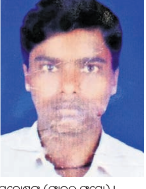
ସନ୍ଦେହଜନକ (ଫାଇଲ ଫଟୋ) ।

ଆସିକା ପୋଲିସ ପକ୍ଷରୁ ଶନିବାର ଆସିକା ସହରର ବିଭିନ୍ନ ସ୍ଥାନରେ ଚଢ଼ାଇ କରାଯାଇ ଦେସରକାରୀ ସଂସ୍ଥାରେ ନିୟୋଜିତ ୩୯ ଶିଶୁ ଶ୍ରମିକଙ୍କୁ ଉଦ୍ଧାର କରାଯାଇଛି । ଆସିକା ସହର ବସଷ୍ଟିକ୍ସ, ବିଭୂବନନାଥକ ସେକ୍ଟର, କଲିକା ରୋଡ ଆଦି ସ୍ଥାନରେ ବିଭିନ୍ନ ହୋଟେଲ, ଗ୍ୟାରେଜ୍, ଡେକୋରାଟିଭ ଦୋକାନ, ପୁସ୍ତକାଳୟ ଭଳି ବିଭିନ୍ନ ସାମଗ୍ରୀ ବିକ୍ରି କରୁଥିବା ବେଳେ ଏହି ଶିଶୁମାନଙ୍କୁ ପୋଲିସ ଉଦ୍ଧାର କରିଥିଲା ।