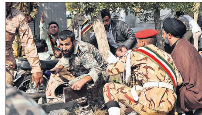
ତେହରାନ, ୨୨।୯ (ପି.ଟି.)