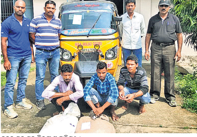
କବଚ ମଦ ସହ ଗିରଫ ୩ ଅଭିଯୁକ୍ତ ।

କୋଟି ଟଙ୍କାରୁ ଉର୍ଦ୍ଧ୍ଵ ବ୍ୟୟରେ ଖାତର ଟ୍ରିମେଣ୍ଟ ପ୍ଲାଣ୍ଟ ରହିଥିଲେ ମଧ୍ୟ ତାହା ଲୋକଙ୍କ ଆବଶ୍ୟକତା ମେଣ୍ଟାଇ ପାରୁନାହିଁ । ପାଣି ପାଇଁ ସହରବାସୀଙ୍କୁ ଡୁହଳିବିକଳ କରିଥିବା ପ୍ରତିଷ୍ଠିତ ଭୋଗିବାକୁ ପଡୁଛି । ଚୁରୁପୁର୍ଣ୍ଣ ପ୍ରକଳ୍ପ ପାଇଁ ଲୋକ ପାଣି ପାଇବାକୁ ବଞ୍ଚିତ ହେଉଥିବା ଅଭିଯୋଗ ହେଉଛି । ବିଭିନ୍ନ ସମୟରେ ଲୋକମାନେ ପାଣି ପାଇଁ ପ୍ରତିବାଦ କଲେ କିଛି ଦିନ ଚିନ୍ତା ଅବହେଳା ଲାଗି ରହିଛି । ବର୍ଷା ଦିନେ ଜନସ୍ଵାସ୍ଥ୍ୟ ବିଭାଗ ପାଣି ଦେଇପାରୁ ନ ଥିବାରୁ ରୁଜୁକାରୀ ମହଲରେ ଉଦ୍‌ବେଗ ପ୍ରକାଶ ପାଇଛି । କଟାଳଗୁଡ଼ାଠାରେ ୮