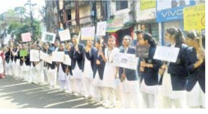
ମାନବଶୃଙ୍ଖଳ କରି ସଚେତନତା ବାସ୍ତୁଛନ୍ତି ଛାତ୍ରୀମାନେ।