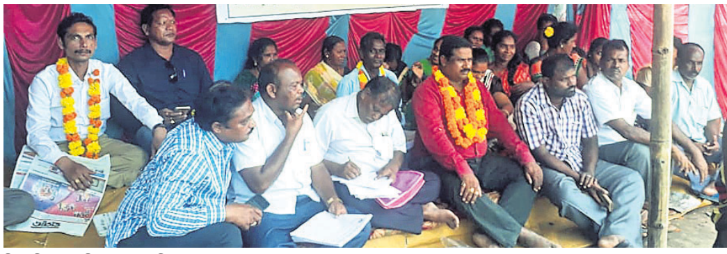
ଜିଲା ବିକାଶ ପରିଷଦ ପକ୍ଷରୁ ଦିଆଯାଇଥିବା ଧାରଣା ।