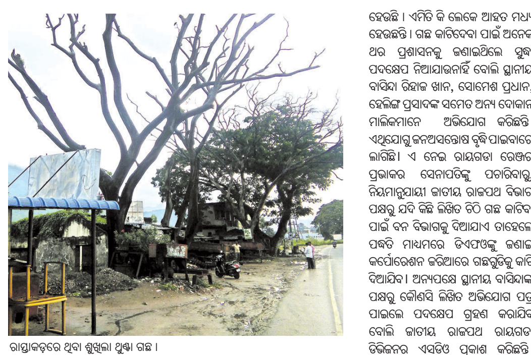
ରାସ୍ତାକଡ଼ରେ ଥିବା ଶୁଖିଲା ଥୁଣ୍ଡ ଗଛ ।