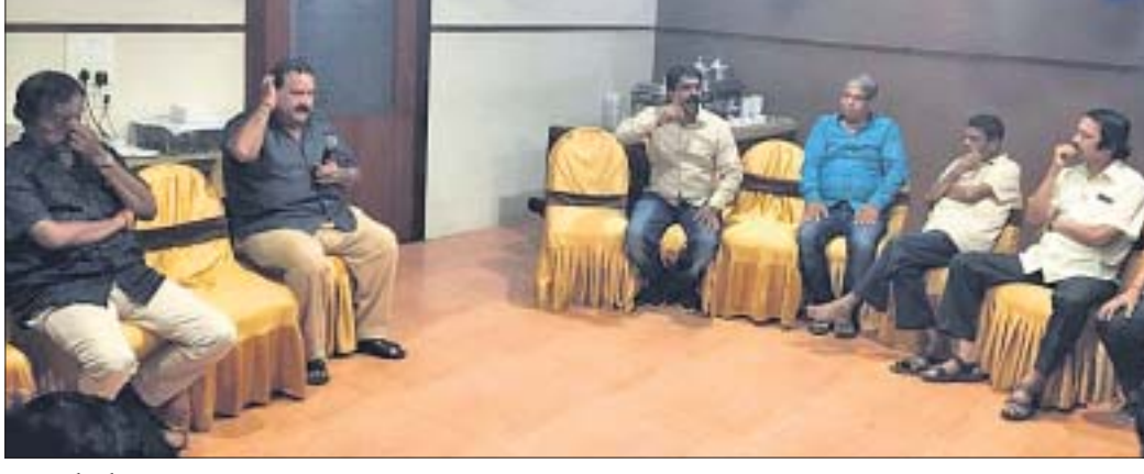
କ୍ଲବ୍ କର୍ମଚାରୀ ଓ ସ୍କୁଲ, କଲେଜ ସଦସ୍ୟମାନଙ୍କ ବୈଠକ।