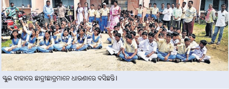
ସ୍କୁଲ ବାହାରେ ଛାତ୍ରାଛାତ୍ରୀମାନେ ଧାରଣାରେ ବସିଛନ୍ତି ।

ଧାରଣାରେ ବସିଲେ ଛାତ୍ରାଛାତ୍ରୀ, ଅଭିଭାବକ ବାବି ପୁରୁଣା ପ୍ରତିଶ୍ରୁତି ଦେଲା ପ୍ରଶାସନ