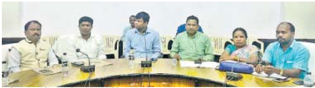
ପ୍ରସ୍ତୁତି ଦେଠକରେ ଜିଲାପାଳ, ଜିଲା ଯୋଜନା କମିଟି ଅଧ୍ୟକ୍ଷ ଓ ଅନ୍ୟମାନେ।

କୋଟିଆର ସ୍ୱର୍ଣ୍ଣ ପାହାଡ଼ରୁ ଲୋକ ମହୋତ୍ସବ ‘ପରବ-୨୦୧୮’ର ଶୁଭାରମ୍ଭ ହେବ। ସ୍ଥାନୀୟ ସର୍ବଭାବନା ସଭାଦ୍ୱାରା ଶନିବାର ଅପରାହ୍ନରେ ଆୟୋଜିତ ପରବ ପ୍ରସ୍ତୁତି ଦେଠକରେ ଏହି ନିଷ୍ପତ୍ତି ହୋଇଛି। ପରବର ପୂର୍ଣ୍ଣା ମହୋତ୍ସବ ପାଇଁ ନଭେମ୍ବର ୧୬, ୧୭ ଓ ୧୮ ତାରିଖ ନିର୍ଦ୍ଦେଶ ହୋଇଛି। କିନ୍ତୁ ଏହାର ଶୁଭାରମ୍ଭ ତାରିଖ ଏବଂ ପୂର୍ଣ୍ଣା ମହୋତ୍ସବ କେଉଁଠାରେ ହେବ, ସେ ନେଇ ନିଷ୍ପତ୍ତି ହୋଇନାହିଁ।