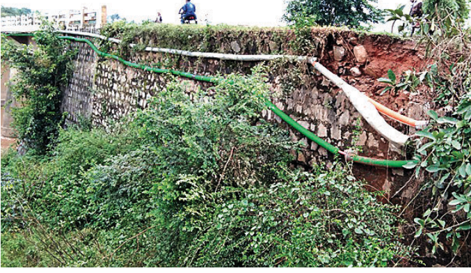
ସାନ ନଦୀ ଆସ୍ତ୍ରୋତରୋତ ପାର୍ଶ୍ଵରେ ମାଟି ଏବଂ ପଥର ଖସିଛି ।

ରାୟଗଡ଼ା ଜିଲା ଗୁଣପୁର ସହରର ସାନନଦୀ ବ୍ରିଜ ନିକଟ ରାସ୍ତାରେ ମାଟି ଓ ପଥର ଧସିଥିବା ଦେଖିବାକୁ ମିଳିଛି । ବ୍ରିଜର ଆସ୍ତ୍ରୋତ ରୋଡ ରାସ୍ତାରେ ଏହି ମାଟି ଓ ପଥର ଖସିଛି । ଗୁଣପୁର-ପଦ୍ମପୁର ରାସ୍ତାର ଲିମାମେଡାସ୍ଥିତ ସାନନଦୀ ବ୍ରିଜର ଆସ୍ତ୍ରୋତ ରୋଡର ରାସ୍ତା ପାର୍ଶ୍ଵରେ ମାଟି ଖସିଥିବାରୁ ପଥରାଚାରୀ ଓ ଗାଡି ଚାଳକଙ୍କ ମଧ୍ୟରେ ଭୟର ବାତାବରଣ ସୃଷ୍ଟି ହୋଇଛି । ଚୁରୁତ ପ୍ରଶାସନ ପକ୍ଷରୁ ରାସ୍ତା ମରାମତି କରାଯିବାକୁ ଯାଧାରଣରେ ଦାବି ହେଉଛି ।