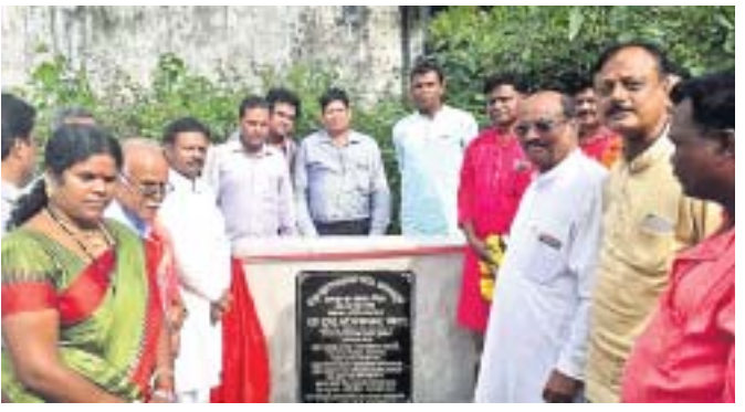
ଭିତ୍ତିପ୍ରସ୍ତର ସ୍ଥାପନ କରୁଛନ୍ତି ଏମ୍ପି।