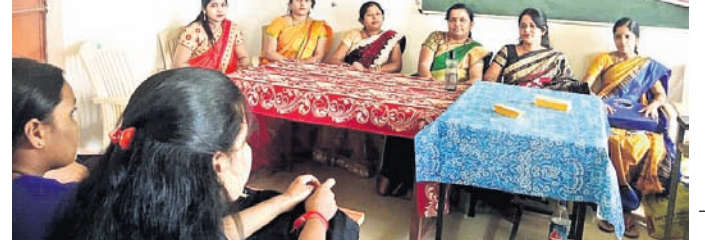
ସଭାରେ ଉପସ୍ଥିତ ନବରଙ୍ଗପୁର ମହିଳା ମହାବିଦ୍ୟାଳୟର ଅଧ୍ୟାପିକାମାନେ ।