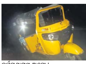
ଦୁର୍ଘଟଣାସ୍ଥଳ ଅଟୋ ।

କାଶୀନଗର, ୨୫୧୯(ଡି.ଏନ.ଏ)- ଗଜପତି ଜିଲ୍ଲା କାଶୀନଗର ରୁକର ଅଲଟା ଓ ଶିଆଳି ଗ୍ରାମ ମଧ୍ୟରୁ ରାସ୍ତାରେ ଯୋମବାବ ଏକ ଅଟୋ ଓଲଟି ପଡ଼ିଛି । ଫଳରେ ୫ଜଣ ଯାତ୍ରୀ ଆହତ ହୋଇଛନ୍ତି । ସେମାନେ ହେଲେ ପି.ରାମକୁ,