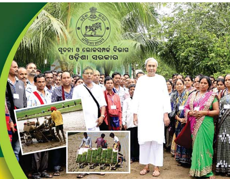
ସୂଚନା ଓ ଲୋକସମ୍ପର୍କ ବିଭାଗ ଓଡ଼ିଶା ସରକାର

୨୦ କୁଳରୁ ଆରମ୍ଭ ହୋଇଥିବା ଏହି କୃଷକ ସଚେତନତା କାର୍ଯ୍ୟକ୍ରମ ପାଇଁ କୃଷକମାନେ ଚାଳ ମୁଖ୍ୟମନ୍ତ୍ରୀଙ୍କୁ ଭେଟି ବେଉଛନ୍ତି ଆଭିମତ ଧନ୍ୟବାଦ।