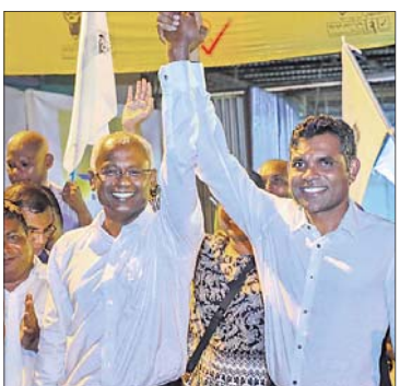
ବିଜୟ ଉତ୍ସବ ମନାଇଛନ୍ତି ଇନ୍ଦ୍ରାହିନ୍ ମହମ୍ମଦ୍ ସେଲିକ୍ (ବାମ) । ଯାନିନ୍ ଅବ୍ଦୁଲ୍ ଗୟୁମ୍ ।

ଦ୍ଵୀପରାଷ୍ଟ୍ର ମାଳଦ୍ଵୀପରେ କ୍ଷମତା ପରିବର୍ତ୍ତନ ସହ ରାଜନୈତିକ ସଙ୍କଟର ଆଶଙ୍କା ପ୍ରକାଶ ପାଇଛି । ରବିବାର ଦେଶରେ ଅନୁଷ୍ଠିତ ରାଷ୍ଟ୍ରପତି ନିର୍ବାଚନର ଫଳାଫଳ ସୋମବାର ପ୍ରକାଶ ପାଇବା ପରେ ଶାସକ 'ପ୍ରୋଗ୍ରେସିଭ୍ ପାର୍ଟି ଅଫ୍ ମାଳଦ୍ଵୀ' (ପିପିଏମ୍)କୁ ଖେତକ ଲାଗିଛି । ଏକ ପରାଜିତ ହେବା ସହ ପଦ ଛାଡ଼ିବାକୁ ଯାଉଛନ୍ତି ରାଷ୍ଟ୍ରପତି ଯାନିନ୍ ଅବ୍ଦୁଲ୍ ଗୟୁମ୍ । ବିରୋଧୀ 'ମାଳଦେଭିଏନ୍ ଡେମୋକ୍ରାଟିକ୍ ପାର୍ଟି' (ଏମ୍ଡିପି) ପ୍ରାର୍ଥୀ ଇନ୍ଦ୍ରାହିନ୍ ମହମ୍ମଦ୍ ସେଲିକ୍ ମସ୍ତୁକରେ ରାଷ୍ଟ୍ରପତି ମୁକୁଟ ସଜାଇବାକୁ ବାଛିଛନ୍ତି ମାଳଦ୍ଵୀପବାସୀ । ସେପଟେ ନିଜର ପରାଜୟ ସ୍ଵୀକାର କରିଛନ୍ତି ଦେଶର ପ୍ରଭାବଶାଳୀ ନେତା ଅବ୍ଦୁଲ୍ ଗୟୁମ୍ । କିନ୍ତୁ ତାଙ୍କ ବିରୋଧରେ ଉତ୍ତୁଧିତା ଦମନ କରିଆସିଛନ୍ତି ପୂର୍ଣ୍ଣିଆରେ ସେ ସେଭଳି କିଛି