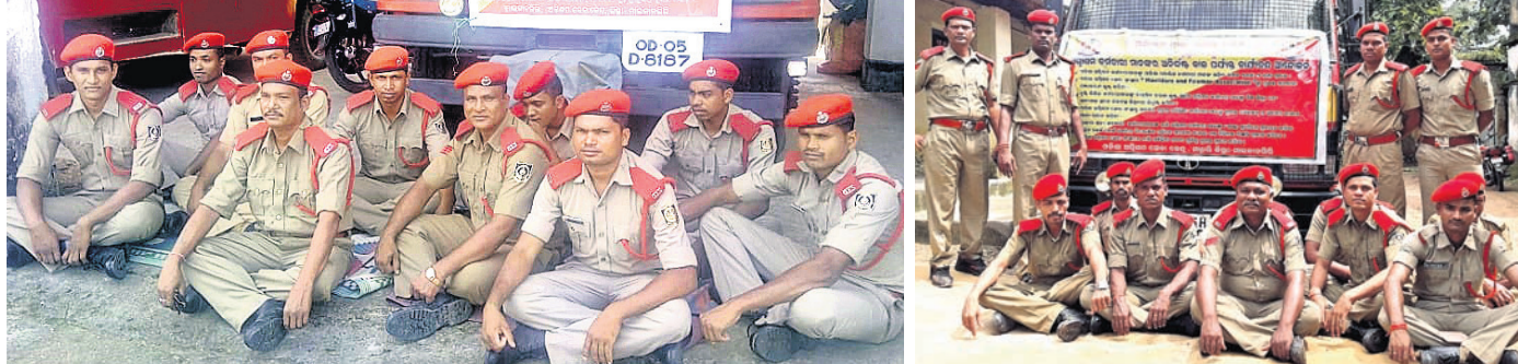
ମାଲକାନଗିରି ଓ ମାଥିଲିରେ ଅଗ୍ନିଶମ ସେବା କର୍ମଚାରୀମାନେ ଧାରଣାରେ ବସିଛନ୍ତି ।

ମାଲକାନଗିରି, ୨୪।୯ (ଡି.ଏନ୍.ଏ.) ବନ୍ୟା, ବାତ୍ୟା, ଅଗ୍ନିକାଣ୍ଡ ସମୟରେ ଲୋକଙ୍କ ଧନକ୍ଷୟ ରକ୍ଷା କରୁଥିବା ଏବଂ ଉଦ୍ଧାର କାର୍ଯ୍ୟ କରୁଥିବା ଅଗ୍ନିଶମ କର୍ମଚାରୀମାନେ ଯୋଗଦାନଠାରୁ ରାଜ୍ୟବ୍ୟାପୀ କାର୍ଯ୍ୟ ବନ୍ଦ ଆନ୍ଦୋଳନ ଆରମ୍ଭ କରିଛନ୍ତି । ମାଲକାନଗିରି ଜିଲ୍ଲାର ୪୦୦ ଉର୍ଦ୍ଧ୍ୱ ଅଗ୍ନିଶମ କର୍ମଚାରୀ ଏହି ଆନ୍ଦୋଳନରେ ସାମିଲ ହୋଇଛନ୍ତି । କର୍ମଚାରୀମାନେ ରାଜ୍ୟ ସରକାରଙ୍କୁ ସେମାନଙ୍କର ଧନ୍ୟା ଦିବିନ ଦାବି ପୂରଣ ନେଇ ପୂର୍ବରୁ ଜଣାଇଥିଲେ । ଗତବର୍ଷ କଳାବ୍ୟାଜ୍ ପରିଧାନ କରି ପ୍ରତିବାଦ ଜଣାଇଥିଲେ । ମାତ୍ର ସରକାର ସେମାନଙ୍କ ଦାବି ପୂରଣ ନ କରିବାକୁ ରାଜ୍ୟସଂସଦ ନିଷ୍ପତ୍ତି ଅନୁଯାୟୀ କର୍ମଚାରୀମାନେ କାର୍ଯ୍ୟକ୍ଷୟ ସମ୍ମୁଖରେ ବସି ଆନ୍ଦୋଳନ କରିଛନ୍ତି । ଅଗ୍ନିଶମ କର୍ମଚାରୀଙ୍କ ଦାବିକୁ ନିଜ ମଧ୍ୟରେ ପୋଲିସ୍ କର୍ମଚାରୀମାନଙ୍କ ସହିତ ସମାନ ଦରମା ଓ ଭତ୍ତା ଯୋଗାଇଦେବା, ଅଗ୍ନିଶମ ସେବାସଂସ୍ଥାର ହାବିଲଦାର, ଫାୟାରମ୍ୟାନ ଆସୋସିଏସନକୁ ରୁଚକ ସରକାରୀ ପୁଞ୍ଜୀକୃତ କରିବା, ନୁହେଁକିଲ କର୍ମଚାରୀମାନଙ୍କୁ ନିୟମିତ ଦରମା, କର୍ମଚାରୀମାନଙ୍କୁ ନିଜ ଜିଲା ଓ ଆବଶ୍ୟକ ସ୍ଥଳେ ନିକଟସ୍ଥ ଜିଲାରେ ନିଯୁକ୍ତି କରିବା, ଅଗ୍ନିଶମ ସେବା ସଂସ୍ଥାରୁ ଅବସର ଗ୍ରହଣ କରିଥିବା କର୍ମଚାରୀମାନଙ୍କୁ ରୁଚକ ପେନସନ ଓ ଅବସରକାଳୀନ ପ୍ରାପ୍ୟ ପ୍ରଦାନ କରିବା, ଅନ୍ୟ ସରକାରୀ କର୍ମଚାରୀମାନଙ୍କ ଭଳି ଅଗ୍ନିଶମ କର୍ମଚାରୀଙ୍କୁ ଘଣ୍ଟା ବ୍ୟବସ୍ଥାରେ ପୁରସ୍କରଣ କରିବା, ଅଗ୍ନିଶମ ସେବା ସଂସ୍ଥାରେ ଖାଲିପଡ଼ିଥିବା ପଦବୀଗୁଡ଼ିକୁ ରୁଚକ ପୂରଣ କରିବା ଆଦି ରହିଛି । ପ୍ରକାଶ ଆଇ କି ପୁରୁଷେନ ପୂର୍ବରୁ ମାଲକାନଗିରି ଜିଲାରେ ଯେଉଁ ବନ୍ୟା ପରିଚ୍ଛେଦ ସୃଷ୍ଟି ହୋଇଥିଲା ସେହି ସମୟରେ