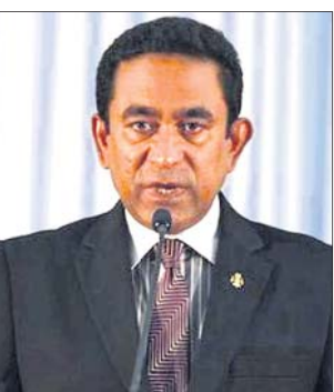
୫୬ ବର୍ଷୀୟ ସେଲିକ୍ ହେଉଛନ୍ତି ଜଣେ ଗଣତନ୍ତ୍ର ଅଧିକାରୀ । ଦେଶରେ ଦୀର୍ଘ ଏକ ଦଶନ୍ଧି ଧରି ଏକଛତ୍ରବାଦ ଶାସନ ବିରୋଧରେ ସେ ସଂଗ୍ରାମ ଚଳାଇଥିଲେ । ଗୟୁମ୍ କ୍ଷମତାକୁ ଆସିବା ପରେ ତାଙ୍କର ପୂର୍ବସୂତା ମହମ୍ମଦ୍ ନଖିଦ୍ ସମେତ ଏମ୍ଡିପିର ବହୁ ଶୀର୍ଷସ୍ତରୀୟ ନେତାଙ୍କୁ ଦୁର୍ଗତି ମାମଲାରେ ଛଦି ଜେଲରେ ପଠାଇ ଦେଇଥିଲେ । କିନ୍ତୁ ଦେଶରୁ ବାହାର

ପଦକ୍ଷେପ ନେଇପାରନ୍ତି ବୋଲି ଆଶଙ୍କା ଦୃଷ୍ଟି କରାଯାଇଛି । କାରଣ ନିର୍ବାଚନରେ ହେଉଥିବା ନେଇ ପୂର୍ବରୁ ସେ ଅଭିଯୋଗ ଆଣି ସାରିଛନ୍ତି । ଏଭଳି ଛୁଟିରେ ଦେଶରେ ରାଜନୈତିକ ସଙ୍କଟ ଦେଖା ଦେଇପାରେ ବୋଲି ଭୟ କରାଯାଇଛି । ନିର୍ବାଚନ ଫଳାଫଳ ପ୍ରକାଶ ସ୍ଵରୁ ଗୟୁମ୍ ପୂର୍ବରୁ ସେଭଳି ଦମନ କରିଆସିଛନ୍ତି ପୂର୍ଣ୍ଣିଆରେ ସେ ସେଭଳି କିଛି