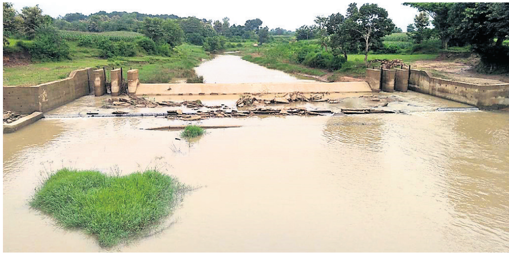
ଭୁକ୍ତି ପଡିଥିବା ଚେକଡ୍ୟାମ ।

ନବରଙ୍ଗପୁର ଜିଲ୍ଲା ତାବୁଗାଁ ବ୍ଲକ୍ରେ ଚାଷୀଙ୍କ ସ୍ୱାସ୍ଥ୍ୟକୁ ଦୃଷ୍ଟିରେ ରଖି ନିର୍ମାଣ ହୋଇଥିବା ଚେକ ଡ୍ୟାମ ନିର୍ମାଣ କାର୍ଯ୍ୟ ଶେଷ ହେବାର ୨ ମାସ ମଧ୍ୟରେ ଭୁକ୍ତି ଯାଉଛି । ଏପରିକି ନାମ ଫଳକ ଓ କେଉଁ ବିଭାଗର କାର୍ଯ୍ୟ ତାହା ଉଲ୍ଲେଖ କରାଯାଇ ନ ଥିବାରୁ ଗ୍ରାମୀଣ ଚାଷୀ କାହାକୁ ଅଭିଯୋଗ କରିବେ ତାହା ଜାଣି ପାରୁ ନାହାନ୍ତି । ଲକ୍ଷାଧିକ ଚଳାଉ ଚେକଡ୍ୟାମ ନିର୍ମାଣର କାମ ଲାଗି ଏଭଳି ଅବସ୍ଥା ହୋଇଛି ବୋଲି ଚାଷୀ ଅଭିଯୋଗ କରିଛନ୍ତି । ତଳପୁଣ୍ଡରେ ଚେକଡ୍ୟାମର ଦୁଇ ପାର୍ଶ୍ୱବର୍ତ୍ତୀ ଅଞ୍ଚଳରେ ୫୦ ହେକ୍ଟର ଚାଷ କମି ଲୁଚିଯାଇଛି ବୋଲି ଚାଷୀ ପାଇଁ ଏହା ନିର୍ମାଣ କରାଯାଇଥିଲା । କିନ୍ତୁ ନିର୍ମାଣର କାର୍ଯ୍ୟ ଯୋଗୁ