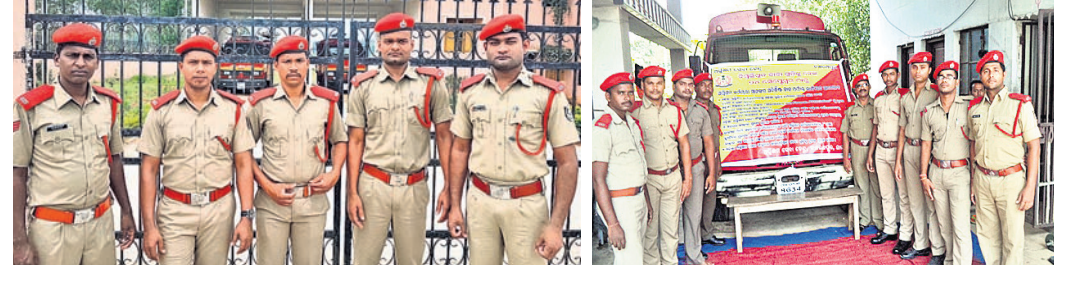
ଆୟୋଜନରେ ସାମିଲ ହୋଇଥିବା ପାପଡ଼ାହାଣ୍ଡି ଓ ଚେନ୍ନୁଲିଖୁଣ୍ଟି ଅଗ୍ନିଶମ କର୍ମଚାରୀମାନେ ।

ପାପଡ଼ାହାଣ୍ଡି/ଚେନ୍ନୁଲିଖୁଣ୍ଟି, ୨୪।୯(ବି.ପ୍ର.)- ନବରଙ୍ଗପୁର ଜିଲ୍ଲା ପାପଡ଼ାହାଣ୍ଡି ବ୍ଲକ୍ ଅଗ୍ନିଶମ କର୍ମଚାରୀମାନେ ୬ ଦମ୍ପା ଦାବି ନେଇ ଆୟୋଜନକୁ ଓହ୍ଲାଇ କାର୍ଯ୍ୟାଳୟରେ ଧାରଣାରେ ବସିଥିଲେ । ଫଳରେ ବ୍ଲକ୍ରେ ଲଠୁରୀ ସେବା ଠପ ହୋଇପଡିଛି । ଦାବି ପୂରଣ ନ ହେବା