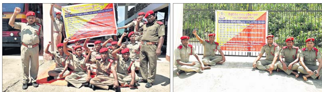
ପାରଳାଖେମୁଣ୍ଡି ଓ ଗୁମ୍ଫାଠାରେ ଆନ୍ଦୋଳନରେ ସାମିଲ ହୋଇଥିବା ଅଗ୍ନିଶମ କର୍ମଚାରୀମାନେ ।

ପାରଳାଖେମୁଣ୍ଡି/ଗୁମ୍ଫା, ୨୪୯୯(ସ.ପ୍ର./ଡି.ଏନ.ଏ.)