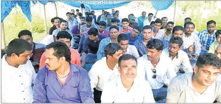
ଡାକ୍ତରୀ ବିଦ୍ୟୁତ୍ କର୍ମଚାରୀମାନେ କାର୍ଯ୍ୟାଳୟ ସମ୍ମୁଖରେ ଧାରଣାରେ ବସିଛନ୍ତି।

ଅନୁଗୋଳ ଅଫିସ/ ଡାକ୍ତରୀ, ୨୪x୯ ପୂରଣ କରିବାରେ ଡାକ୍ତରୀ ନାହିଁ। ଅନୁଗୋଳ ଅଫିସରେ ଏହି ଧାରଣା ଆରମ୍ଭ ହୋଇଛି।