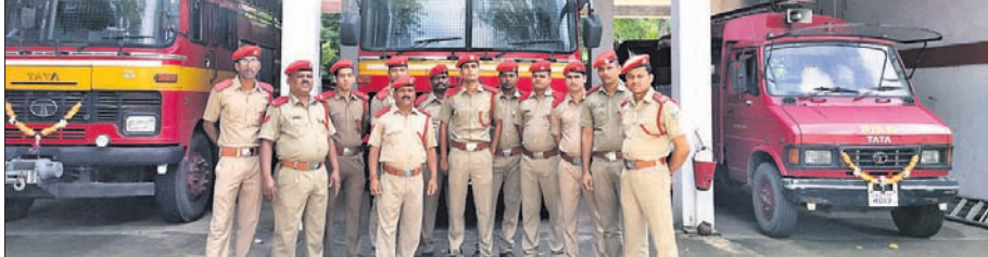
ଅନୁଗୋଳ ଅଗ୍ନିଶମ ବିଭାଗ କର୍ମଚାରୀମାନେ ଅଯୋଜନ କରାଇଛନ୍ତି।

ଅନୁଗୋଳ ଅଫିସ/ ଡାକ୍ତରୀ, ୨୪x୯ ଅନୁଗୋଳ ଅଫିସରେ ଏହି ଧାରଣା ଆରମ୍ଭ ହୋଇଛି। ଡାକ୍ତରୀ ବିଦ୍ୟୁତ୍ କର୍ମଚାରୀମାନେ କାର୍ଯ୍ୟାଳୟ ସମ୍ମୁଖରେ ଧାରଣାରେ ବସିଛନ୍ତି।