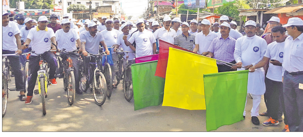
ଓକିଲ ସଂଘର ଆହ୍ୱାନରେ ଆୟୋଜିତ ସାଇକେଲ ଶୋଭାଯାତ୍ରା।