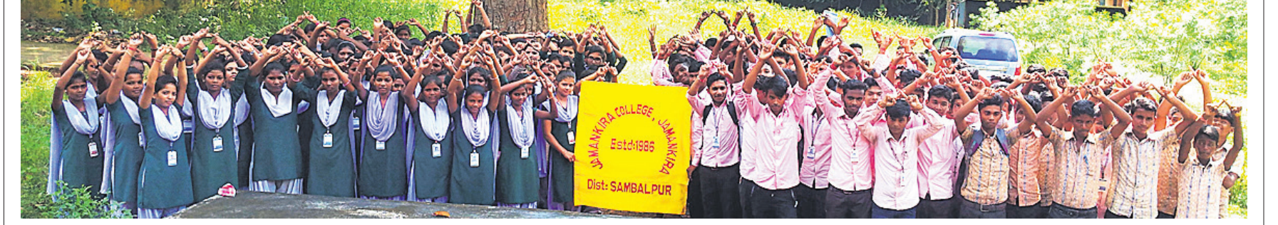
ଧରତ୍ରୀ ଏବଂ ଓଡ଼ିଶା ପୋଷ୍ଟ ପକ୍ଷରୁ ଚାଲିଥିବା 'ପ୍ଲାଷ୍ଟିକ ଫ୍ରି ଓଡ଼ିଶା' ଅଭିଯାନରେ ଘୋମବାର ସମ୍ବଲପୁର ଜିଲ୍ଲା ଜନନକିରା କଲେଜର ଅଧ୍ୟାପିକା, ଅଧ୍ୟାପକ, କର୍ମଚାରୀ ଓ ଛାତ୍ରାଛାତ୍ର ସାମିଲ ହୋଇଛନ୍ତି ।