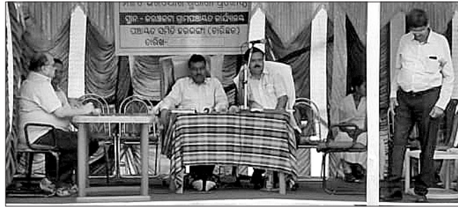
ଜନ ଶୁଣାଣି ଶିବିରରେ ଉପସ୍ଥିତ ପ୍ରଶାସନିକ ଅଧିକାରୀ।

ପ୍ରଚାର ଓ ପ୍ରସାର କରାଯାଇ ନ ଥିବାରୁ ଲୋକେ ସୂଚନା ପାଇପାରି ନ ଥିବା କୁହାଯାଇଛି। ଏଥିପ୍ରତି ୪୨ଟି ଅଭିଯୋଗର ଶୁଣାଣି ହୋଇଥିଲା।