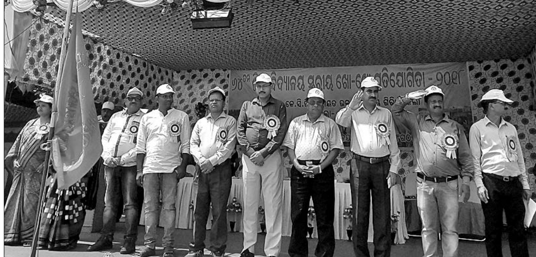
ଗିରିଜାକେଲା କେଶବ ଚନ୍ଦ୍ର ପୁଷ୍ପି ପଞ୍ଚାୟତର ହାଲସ୍କୁଲରେ ଜିଲ୍ଲାସ୍ତରୀୟ ବିଦ୍ୟାଳୟ ସମୂହ ଖୋଖୋ ପ୍ରତିଯୋଗିତା ଉଦ୍‌ଘାଟନା ମୁହୂର୍ତ୍ତ।

୧୦ଜଣ ଶିକ୍ଷକ କ୍ରୀଡା ପରିଚାଳନା ଦିଗରେ ସାମିଲ ହୋଇଥିଲେ। ଉଦ୍‌ଘାଟନା କାର୍ଯ୍ୟକ୍ରମ ପରିଶେଷରେ କେସିପି ପଞ୍ଚାୟତ ବିଦ୍ୟାଳୟର ଛାତ୍ରୀଛାତ୍ର ଅତି ସୁନ୍ଦର ଭାବେ ସାଂସ୍କୃତିକ କାର୍ଯ୍ୟକ୍ରମ ପରିଶେଷଣ କରିଥିଲେ।