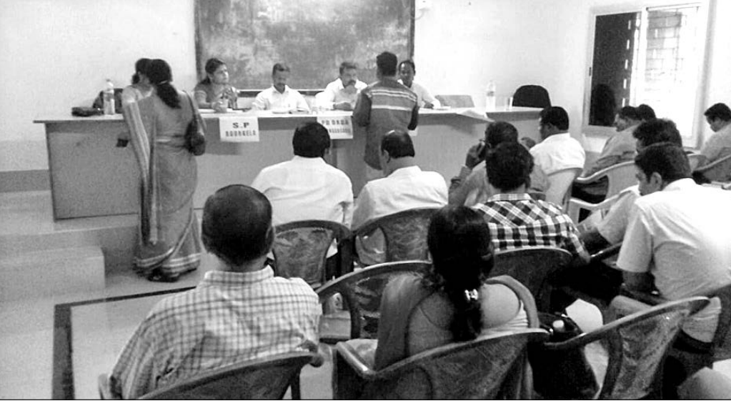
ନୂଆଗାଁରେ ଜିଲ୍ଲାପାଳଙ୍କ ଅଭିଯୋଗ ଶୁଣାଣି କାର୍ଯ୍ୟକ୍ରମରେ ଉପସ୍ଥିତ ଅଧିକାରୀ।

ସୁନ୍ଦରଗଡ଼ ଜିଲ୍ଲା ନୂଆଗାଁ ବ୍ଲକ୍ ପରିସରରେ ସୋମବାର ଜିଲ୍ଲାପାଳଙ୍କ ଅଭିଯୋଗ ଶୁଣାଣି କାର୍ଯ୍ୟକ୍ରମ ଅନୁଷ୍ଠିତ ହୋଇଥିଲା।