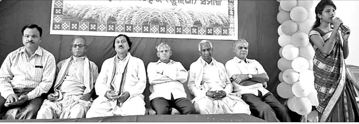
ନୂଆଖାଇ ଭେଟପାଟ ଉତ୍ସବରେ ଜଣେ ଯୁବକ ମା' ସମଲେଶ୍ଵରୀଙ୍କ ବନ୍ଦନା ଗାନ କରୁଛନ୍ତି।

ବ୍ରାହ୍ମଣୀଚରଣ ଆନା ଅନ୍ତର୍ଗତ ଲୁଙ୍ଗେଇ ଅଞ୍ଚଳରେ କେନ୍ଦ୍ର ପଞ୍ଚ ପାଖରେ ଥିବା ପୋଖରୀରେ ରୁଡି ରିଭିକାର ଅପରାହ୍ନରେ ଜଣେ ଯୁବକଙ୍କ ମୃତ୍ୟୁ ଘଟିଛି।