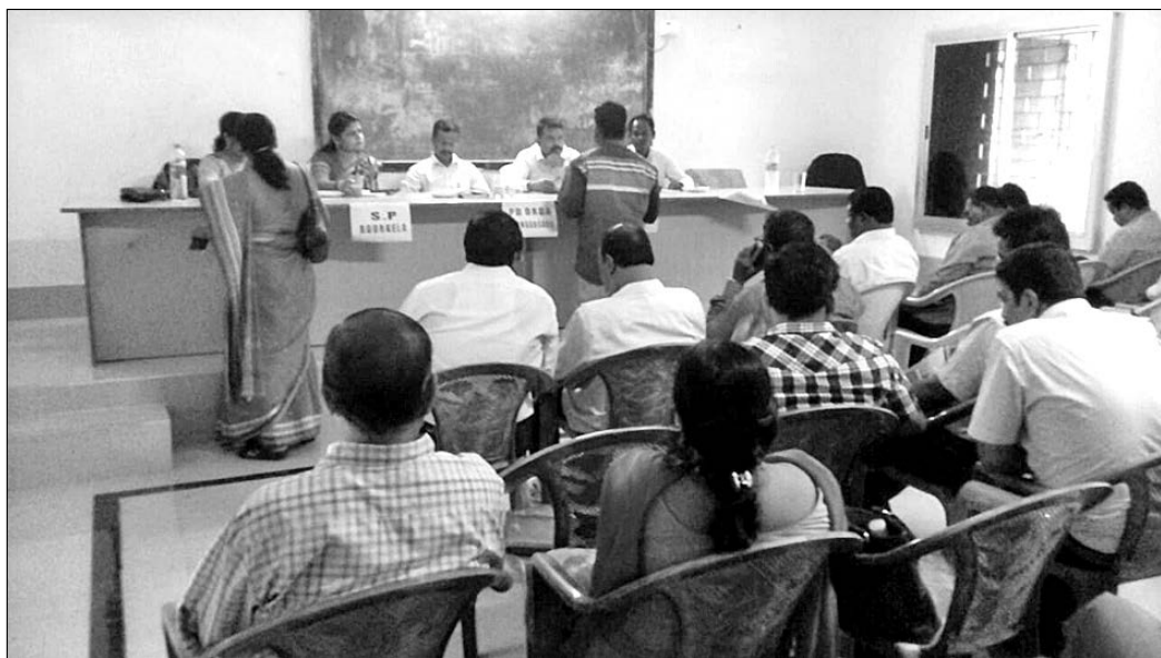
ନୂଆଗାଁରେ ଜିଲ୍ଲାପାଳଙ୍କ ଅଭିଯୋଗ ଶୁଣାଣି କାର୍ଯ୍ୟକ୍ରମରେ ଉପସ୍ଥିତ ଅଧିକାରୀ।

ସୁନ୍ଦରଗଡ଼ ଜିଲ୍ଲା ନୂଆଗାଁ ବ୍ଲକ୍ ପରିସରରେ ସୋମବାର ଜିଲ୍ଲାପାଳଙ୍କ ଅଭିଯୋଗ ଶୁଣାଣି କାର୍ଯ୍ୟକ୍ରମ ଅନୁଷ୍ଠିତ ହୋଇଥିଲା। ଡି.ଏମ. କଲେ ଶୁଣାଣି କରିଥିଲେ।