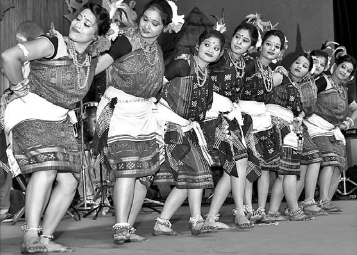
ଦିଲ୍ଲୀ କୁହାର ପରିବାର ଦ୍ୱାରା ଆୟୋଜିତ ନୂଆଁଖାଇ ଭେଟିଆଟରେ ସମ୍ବଲପୁରୀ ଲୋକ ନୃତ୍ୟ ।