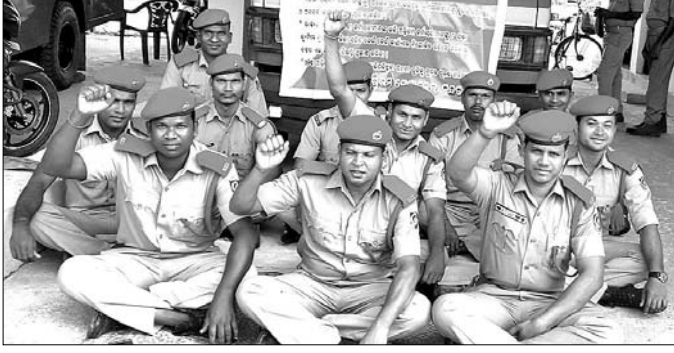
ବଡ଼ଗାଁରେ ଅଗ୍ନିଶମ ବିଭାଗ କର୍ମଚାରୀମାନେ କାର୍ଯ୍ୟବନ୍ଧ ଆନ୍ଦୋଳନ ଚଳାଇଛନ୍ତି।

ବସିଛନ୍ତି। ଦାବିକୃତ୍ତିକ ପୂରଣ ନ ହେଲେ ଅନିଚ୍ଛା କାଳ ପାଇଁ ଆନ୍ଦୋଳନ ଚାଲି ରହିବ ବୋଲି ସଂଘ ପକ୍ଷରୁ କୁହାଯାଇଛି।