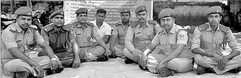
କଣ୍ଠାମାଳ ଅଗ୍ନିଶମ ସେବା କେନ୍ଦ୍ରର କର୍ମଚାରୀମାନେ ଅନିର୍ଦ୍ଦିଷ୍ଟକାଳ କାର୍ଯ୍ୟବନ୍ଦ ଆନ୍ଦୋଳନରେ ବସିଛନ୍ତି।

ବୌଦ୍ଧ ଜିଲ୍ଲା କଣ୍ଠାମାଳ ଅଗ୍ନିଶମ ସେବା କେନ୍ଦ୍ରର କର୍ମଚାରୀମାନେ ଅନିର୍ଦ୍ଦିଷ୍ଟକାଳ କାର୍ଯ୍ୟବନ୍ଦ ଆନ୍ଦୋଳନକୁ ଉଦ୍ଘୋଷିତ କରିଛନ୍ତି।