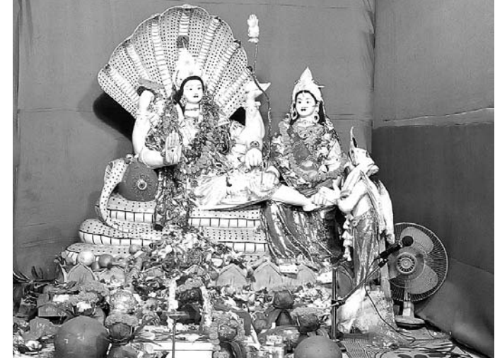
ଅନନ୍ତ ଭଗବାନଙ୍କ ମୂର୍ତ୍ତିର ପୂଜା