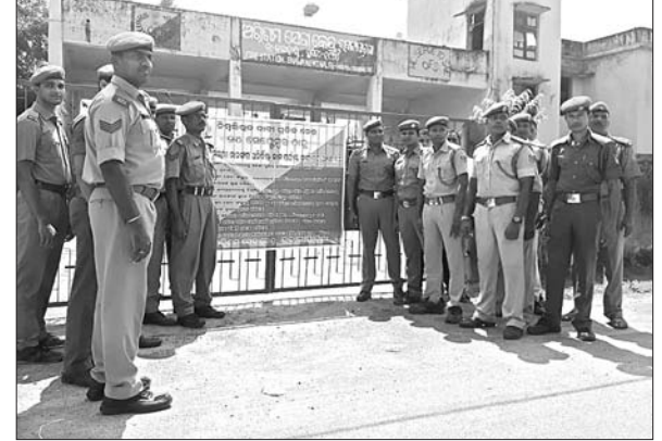
ଜିଲ୍ଲା ସଦର ମହକୁମା ଅଗ୍ନିଶମ କେନ୍ଦ୍ରରେ ଆନ୍ଦୋଳନର ଅଗ୍ନିଶମ କର୍ମଚାରୀ (ବାମ) । କଳାପୁଣ୍ଡା ଅଗ୍ନିଶମ କର୍ମଚାରୀ ।

ଓଡ଼ିଶା ଅଗ୍ନିଶମ କର୍ମଚାରୀ ସଂଘ ୬ ଦମ୍ପା ଦାବି ନେଇ ଯୋଗବାରଠାରୁ କାର୍ଯ୍ୟବନ୍ଧ ଆନ୍ଦୋଳନକୁ ଉଦ୍ଘାଟନ କରିଛି । ଏଥିରେ କଳାହାଣ୍ଡି ଜିଲ୍ଲାର ୧୩ଟି ବ୍ଲକ୍ରେ ୧୫୨ ଜଣ କର୍ମଚାରୀ ଏହି ଆନ୍ଦୋଳନରେ ସାମିଲ ହୋଇଛନ୍ତି । ସେମାନଙ୍କ ବିଭିନ୍ନ ଦାବି ମଧ୍ୟରେ ଓଡ଼ିଶା ଅଗ୍ନିଶମ କର୍ମଚାରୀମାନଙ୍କୁ ଓଡ଼ିଶା ପୋଲିସ କର୍ମଚାରୀମାନଙ୍କ ସହିତ ସାମାନ ଦରମା ଓ ଭତ୍ତା ପ୍ରଦାନ, ଓଡ଼ିଶା ଅଗ୍ନିଶମ ସେବା ସଂସ୍ଥା ହାବିଲଦାର ଓ ଫେସାଲମେନ ଆସୋସିଏସନକୁ ଭୁଗ୍ଡ ସରକାରୀ ପଞ୍ଜୀକରଣ ଛୁଟି କରିବା, ରୁକ୍ମି ଭିକ୍ଟି କର୍ମଚାରୀଙ୍କୁ ନିୟମିତ ଦରମା ଭୁକ୍ତ କରିବା ସହିତ ଅଗ୍ନିଶମ କର୍ମଚାରୀଙ୍କୁ ନିଜ ଜିଲ୍ଲା ଓ ଆବେଶକ୍ଷେତ୍ର ନିକଟସ୍ଥ ଜିଲ୍ଲାରେ ନିଯୁକ୍ତି କରିବା, ଓଡ଼ିଶା ଅଗ୍ନିଶମ ସେବା ସଂସ୍ଥାରୁ ଅବସର ଗ୍ରହଣ କରିଥିବା କର୍ମଚାରୀଙ୍କୁ ୧୫୫ ଟଙ୍କା ଟ୍ୟୁନିଂ ଫଣ୍ଡରେ ମୁକ୍ତମାନ କରିବା ସହିତ କେଉଁ କେଉଁ କାର୍ଯ୍ୟରେ ନିଯୋଜିତ ରହିବେ ସରକାର ତାହାର ଏକ ବିଧିବଦ୍ଧ ବିଶ୍ଳେଷଣ ପ୍ରକାଶ କରିବା, ଓଡ଼ିଶା ଅଗ୍ନିଶମ ସେବା ସଂସ୍ଥାରେ ଅଗ୍ନିଶମ ପଦବୀଗୁଡ଼ିକ ଭୁଗ୍ଡ ପୁରଣ କରିବା ଭଳି ଦାବି ରହିଛି । ଏହି ସବୁ ଦାବି ପୂରଣ ନ ହେବା ପର୍ଯ୍ୟନ୍ତ କାର୍ଯ୍ୟରେ ଯୋଗଦେବେ ନାହିଁ ବୋଲି ଅଗ୍ନିଶମ କର୍ମଚାରୀମାନେ କହିଛନ୍ତି । ଅଗ୍ନିଶମ କର୍ମଚାରୀଙ୍କ ଆନ୍ଦୋଳନ ଯୋଗୁ ଜିଲ୍ଲାରେ ରହିଥିବା ୧୩ଟି ଅଗ୍ନିଶମ କେନ୍ଦ୍ର ଅଟନ୍ତି ହୋଇପଡ଼ିଛି । ଜିଲ୍ଲା ସଦର ମହକୁମା ଅଗ୍ନିଶମ କେନ୍ଦ୍ରରେ ପୁଣ୍ୟ ଆଗ୍ନିକ ଜୟନ୍ତି ବାଗ, ଚଢ଼ିଲା ମଲିକ,