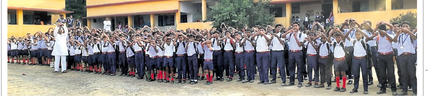
ସୁନ୍ଦରଗଡ଼ ଜିଲ୍ଲା ଲାଠିକଟା ବ୍ଲକ କଲୋଙ୍ଗାସ୍ଥିତ ସରସ୍ୱତୀ ଶିଶୁ ବିଦ୍ୟାଳୟର ପିଲାମାନେ ପ୍ଲାଷ୍ଟିକ ଫ୍ରି ଅଭିଯାନରେ ସାମିଲ ହୋଇଛନ୍ତି ।