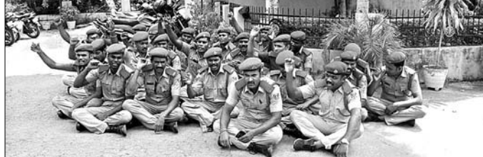
ଧାରଣାରେ ବସିଥିବା ଅଗ୍ନିଶମ କର୍ମଚାରୀ ।