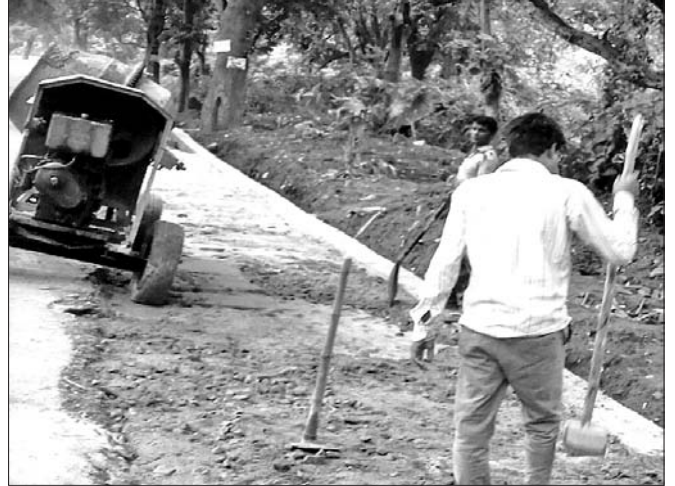
ତାଳବଜଳା ସମ୍ପୂର୍ଣ୍ଣ ରାସ୍ତା ସମ୍ପ୍ରଦାନ କାମ ଚାଲିଛି ।

ଖପ୍ରାଖୋଲ-ହରିଶଙ୍କର ରାସ୍ତାର ଚିଡିଆଖାନା ଓ ବନ ବିଭାଗ ତାଳ ବଜଳା ସମ୍ପୂର୍ଣ୍ଣ ରାସ୍ତା ସମ୍ପ୍ରଦାନ କାମ ଚାଲିଛି । ରାସ୍ତା କଂକ୍ରିଟକରଣ କରାଯିବା ସଂ ଗାଡିଂ କାମ ପୂର୍ଣ୍ଣବିଭାଗ ଚରଫରୁ ଚାଲିଛି । ହେଲେ କିଛି ଦିନ ହେଲା ବିଭାଗୀୟ ଯନ୍ତ୍ରୀମାନେ କାର୍ଯ୍ୟବଦ ଆଧ୍ୟାୟନ କାରି ରଖିଥିବାବେଳେ ଏହି ରାସ୍ତା କାମ ଯନ୍ତ୍ରୀଙ୍କ ଅନୁପସ୍ଥିତିରେ କୋରସୋର ଚାଲିଥିବା ଦେଖିବାକୁ ମିଳିଛି । ଏହାକୁ ନେଇ ଗ୍ରାମୀଣ ଅଞ୍ଚଳରେ ଅସନ୍ତୋଷ ପ୍ରକାଶ ପାଇବା ସହ କାମର ମାନ ଏବଂ ଗୁଣ୍ଠିତ ଉପରେ ପ୍ରଶ୍ନବାଚୀ ସୃଷ୍ଟି ହୋଇଛି । ଅନେକ ସମୟରେ କଂକ୍ରିଟ ପୂର୍ଣ୍ଣ ବିଭାଗ ସର୍ବତ୍ତ୍ୱିକରଣରେ ଠିକାଦାରଙ୍କୁ ଅହେତୁକ ଅନୁକମ୍ପା ଦେଖାଯାଉଥିବାବେଳେ ବ୍ୟାପକ ପରି