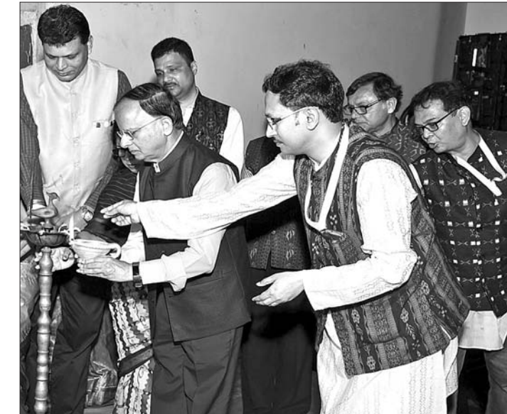
ଦିଲ୍ଲୀ କୁହାର ପରିବାର ପକ୍ଷରୁ ଆୟୋଜିତ ନୂଆଁଖାଇ ଭେଟିଆଟରେ ଅତିଥିମାନେ ପ୍ରଦୀପ ପ୍ରସ୍ତୁତ କରି ଶୁଭାରମ୍ଭ କରୁଛନ୍ତି ।