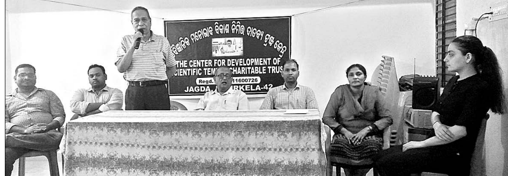
ମାନବ ସେବା ପ୍ରତିଷ୍ଠାନ ପକ୍ଷରୁ ଆୟୋଜିତ ଆଲୋଚନାଚକ୍ରରେ ଯୋଗଦେଇଥିବା ଅତିଥିମାନେ ।