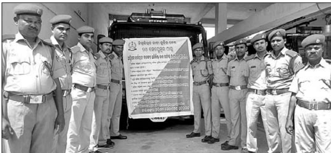
ବାଲିଶାଳାରେ ଅଗ୍ନିଶମ ବିଭାଗ କର୍ମଚାରୀମାନେ କାର୍ଯ୍ୟବନ୍ଧ ଆନ୍ଦୋଳନ ଚଳାଇଛନ୍ତି।

ରାଜ୍ୟ ବ୍ୟାପି ଅଗ୍ନିଶମ ବିଭାଗ କର୍ମଚାରୀମାନେ ଅନିଚ୍ଛା କାଳ କାର୍ଯ୍ୟବନ୍ଧ ଆନ୍ଦୋଳନରେ ବସିଥିବାବେଳେ ବାଲିଶାଳା ଓ ବଡ଼ଗାଁ ବ୍ଲକ୍ ଅଗ୍ନିଶମ ବିଭାଗ କର୍ମଚାରୀମାନେ ମଧ୍ୟ କାର୍ଯ୍ୟବନ୍ଧ କରି ବସିଛନ୍ତି।