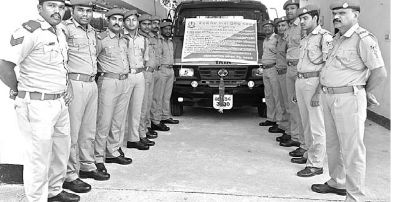
କେସିଜା ଦମକ କେନ୍ଦ୍ର ପରିସର ମଧ୍ୟରେ କନଷ୍ଟେବଲଙ୍କ ଧାରଣା ।