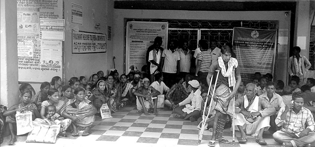
ବାଦ୍ ପଡିଥିବା ହିତାଧିକାରୀ ବ୍ଲକ ଆଗରେ ବିକ୍ଷୋଭ କରୁଛନ୍ତି ।