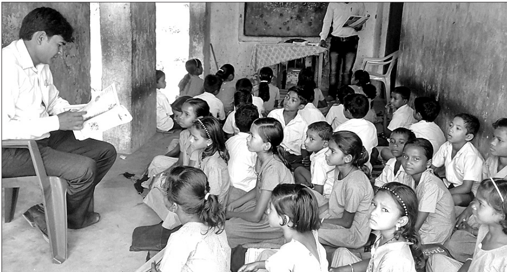
ପିଲାମାନେ ଲୁଲୁ ବାରଣ୍ଡାରେ ପଢୁଛନ୍ତି ।

ବଲାଙ୍ଗୀର ଜିଲା ଖପ୍ରାଖୋଲ ବ୍ଲକ ମହରାପଦର ପିନ୍ଧେଡ଼ର ବାଘଝରଣ ପ୍ରାଥମିକ ବିଦ୍ୟାଳୟ । ଲୁଲୁରେ ୧୭ ୫ ଚଳ ୧୨୧ ଝନ୍ ଛାତ୍ରାଛାତ୍ର ପାଠ ପଢୁଛନ୍ତି । ପାଠପଢ଼ାବାକେ ଅଛନ୍ତି ୩୫୧ ଶିକ୍ଷକ । ହେଲେ ୫୪୦ ଶ୍ରେଣୀ ଲାଗି ସେ ହିସାବେ ପଢ଼ାକୁଟିର ଅଭାବ ରହିଛି । ଲୁଲୁରେ ଥିବାର ଗୁଡେନ କୁଟି ୩୮୦ ଶ୍ରେଣୀର ଛାତ୍ରାଛାତ୍ର ବସୁଥିଲା ବେଳେ ବାକି ଦୁଇଟି ଶ୍ରେଣୀର ଛାତ୍ରାଛାତ୍ର ବାରଣ୍ଡାରେ ବସି ପାଠ ପଢୁଛନ୍ତି । ୧୯୬୧ ଯାଲେ ଆରମ୍ଭ ହେଇଥିବାର ଲୁଲୁରେ ପଢ଼େଇଲୁ ୨ ବର୍ଷର ଖପର ଘର ଥିଲା । ହେଲେ ଏହେତେ ସେ ଖପର ଘରମାନ ଆରୁ ବେଭାର କଲା ଲେଖେନ୍ଦୁ ଅବସ୍ଥାରେ ନାହିଁ । ତିପିଇପି ସମିତିଆରେ ତିଆର ହେଇଥିବାର ଗୁଡେ କୁଟି ଏହେତେ ପାଠପଢ଼ା ଚାଲିଛି । ଆରଗୁଡେ କୁଠା ପାଖାପାଖି ୧୦ ବଛନ୍ ହେଲା ଦର୍ଶିତଥା ହେଇ ପଢ଼ିଛି । ଯେନ୍ଥିଲୁଲାଗି ଛାତ୍ରାଛାତ୍ରକର୍ମ ପାଠପଢ଼ାରେ ବଡ଼ ଅସୁବିଧା ହେଉଛି । ଲ ବାଦ୍ ପଡ଼ି ବାରବାର ବିଭାଗୀୟ ଉଚ୍ଚ କରୁରପକ୍ଷକୁ ଜନେଇଥିଲେ ବି କେହି ଦୁରୁକ୍ଷିତ ନାହିଁ ।