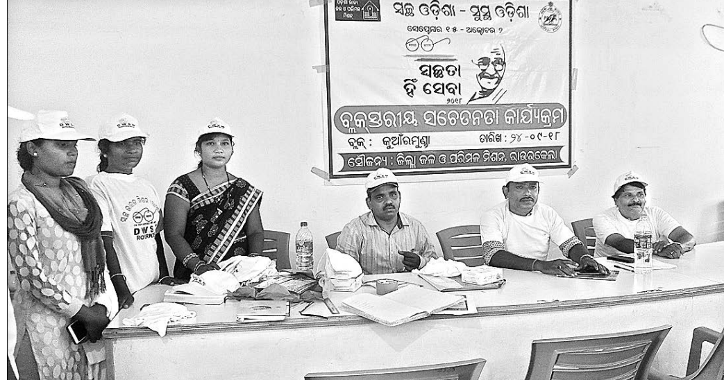
କୁଆଁରପୁଣ୍ଡା ବ୍ଲକ୍ ସଭାଠାରୁ ‘ସ୍ୱଚ୍ଛତା ହିଁ ସେବା’ ସଚେତନତା କାର୍ଯ୍ୟକ୍ରମରେ ଉପସ୍ଥିତ ଅତିଥି।

ସମଗ୍ର ଅଞ୍ଚଳର ପରିବେଶ ସ୍ୱଚ୍ଛ ଓ ପରିଷ୍କାର ରହିବ। ଏଥିପାଇଁ ବିଶେଷ କରି ଲୋକମାନେ ଖୋଲା ସ୍ଥାନରେ ମଳ, ମୂତ୍ର ତ୍ୟାଗ ନ କରି ଶୌଚାଳୟ ବ୍ୟବହାର କରିବା ଉଚିତ୍ ବୋଲି ଏବିଡିଓ ପାଠା ନିଜ ବକ୍ତବ୍ୟରେ କହିଥିଲେ।