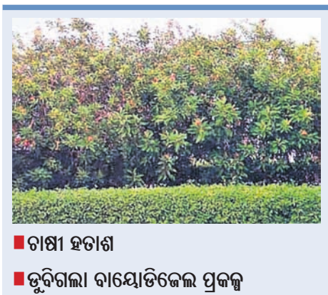
■ ଚାଷୀ ହତାଶ ■ ଭୁବନେଶ୍ୱର ବାୟୋଡିଜେଲ ପ୍ରକଳ୍ପ

ଜାତୋପାୟ (ବାଉଁଶ) ଏକ ଲାଭକର ଚାଷ। ଏଥିରୁ ବାୟୋଡିଜେଲ ପ୍ରସ୍ତୁତ କରାଯାଇ ପାରୁଥିବାରୁ ଦେଶର ବିଭିନ୍ନ ରାଜ୍ୟରେ ଏହି ଚାଷ ପ୍ରତି ଆଗ୍ରହ ବଢିବାରେ ଲାଗିଛି। ଏଥିରୁ ପ୍ରସ୍ତୁତ ବାୟୋଡିଜେଲକୁ ବିମାନ ଇନ୍ଧନ ଭାବେ ବ୍ୟବହାର କରାଯାଇପାରେ। ତେବେ ୮ ବର୍ଷ ପୂର୍ବରୁ ଓଡ଼ିଶାରେ ଆରମ୍ଭ କରାଯାଇଥିବା ଏହି ଚାଷ ଏବେ ଉତ୍ତମ ହୋଇଯାଇଛି। ସରକାରୀ ପ୍ରୋତ୍ସାହନ ନ ଥିବାରୁ ଏଥିପ୍ରତି ଆଗ୍ରହ ଦେଖାଉଥିବା ସଂଗ୍ରାହକ କମି ଚାଲିଯାଇଛି।