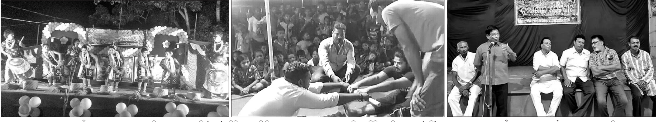
ଭାଇତାରା ସୃଷ୍ଟି କରେ ନୂଆଁଖାଇ ଭେଟ୍‌ଘାଟରେ ନୂଆଁଖାଇ ପରିବେଷଣ କରାଯାଇଛି (ବାମ) । ଚିକିତ୍ସା କ୍ଷେତ୍ର ବିକାଶ ଯୁବକ ସଂଘ ତରଫରୁ ଆୟୋଜିତ ବାରିପଦା ପ୍ରତିଯୋଗୀ (ମଝି) । କଳାହାଣ୍ଡି ସଂଘ ପକ୍ଷରୁ ନୂଆଁଖାଇ ଭେଟ୍‌ଘାଟ କାର୍ଯ୍ୟକ୍ରମରେ ମଞ୍ଚାସୀନ ଅଟନ୍ତି ।