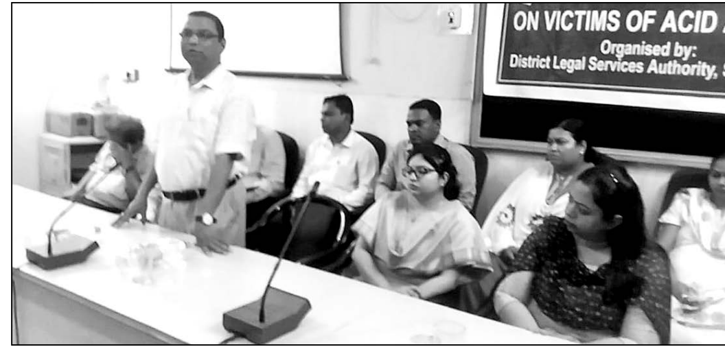
ଏସିଡ୍ ଆକ୍ରମଣ ସମ୍ପର୍କିତ ସଚେତନତା ଶିବିରରେ ଉପସ୍ଥିତ ବିତରପତି ଓ ଡାକ୍ତର।

ସମ୍ପର୍କରେ ସୂଚନା ପ୍ରଦାନ କରିଥିଲେ। ଏହି ସଚେତନତା ଶିବିରରେ ଶିକ୍ଷାନୁଷ୍ଠାନ ବିତରପତି ଏବଂ ଡାକ୍ତର ଓ ନର୍ସ ଛାତ୍ରୀ ଛାତ୍ରମାନେ ଉପସ୍ଥିତ ଥିଲେ।