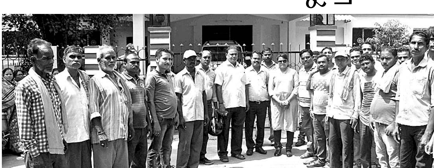
ଏତିଏମ୍‌କ କାର୍ଯ୍ୟାଳୟକୁ ଆସିଥିବା ସ୍ତ୍ରୀମାନଙ୍କୁ ବ୍ୟବସାୟୀମାନେ ।

ରାଉରକେଲା ଅଫିସ, ୨୪। ୯ ସହରରେ ଚୋରା ସ୍ତ୍ରୀମାନଙ୍କୁ ନେଇ ବିଭିନ୍ନ ସମୟରେ ଗାଡି ଜବତ ସାଙ୍ଗକୁ ଗିରଫଦାରି ଏବେ ସମ୍ପୂର୍ଣ୍ଣ ବ୍ୟବସାୟୀଙ୍କ ପାଇଁ ଚିନ୍ତା କାରଣ ପାଲଟିଛି । ବର୍ଷା କଳା(ନେଲ ଲୁହା) ଓ ପ୍ଲାଷ୍ଟିକ ଆଦି ସଂଗ୍ରହ କରି ଖଣିଜ ଉତ୍ପାଦନ କରୁଥିବା ସହରରୁ ପ୍ରତ୍ୟେକ ମେଣ୍ଟାଉଥିବା ବେଳେ ଏହା ଉପରେ ପୋଲିସ ଦାଉ ସାଧୁଛି । ଏବେ ନିରୁପାୟ ସ୍ତ୍ରୀମାନଙ୍କୁ ବ୍ୟବସାୟୀ ପ୍ରଶାସନର ଦ୍ୱାରା ହେବାକୁ ବାଧ୍ୟ ହୋଇଛନ୍ତି । ଏନେଇ ଯୋଗଦାନ ଏକ ପ୍ରତିନିଧି ମଣ୍ଡଳ ରାଉରକେଲା ଏପି ଡ.