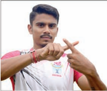
Govinda Poddar Sports Personality