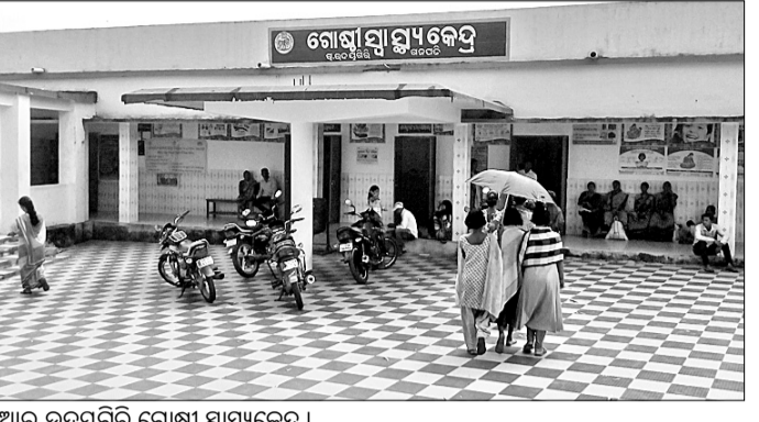
ଆର.ଉଦୟଗିରି ଗୋଷ୍ଠୀ ସ୍ୱାସ୍ଥ୍ୟକେନ୍ଦ୍ର ।

ଆର.ଉଦୟଗିରି, ୨୫ତା(ତି.ଏନ.ଏ.): ଗଜପତି ଜିଲ୍ଲାରେ ଆର.ଉଦୟଗିରି ଗୋଷ୍ଠୀ ସ୍ୱାସ୍ଥ୍ୟକେନ୍ଦ୍ର ଅବସ୍ଥିତ । ଏହି ସ୍ୱାସ୍ଥ୍ୟକେନ୍ଦ୍ର ଉପରେ ଉଚ୍ଚତମ ଆର.ଉଦୟଗିରି ଏବଂ ନୂଆଗଡ଼ ରୁଜ୍‌ହା ୧୦ରୁ ଉର୍ଦ୍ଧ୍ୱ ପଞ୍ଚାୟତର ୩୦ ହଜାରରୁ ଉର୍ଦ୍ଧ୍ୱ ଲୋକ ନିର୍ଭର କରନ୍ତି । ଲୋକେ ଠିକ୍ ଠିକ୍‌ଆ ହୁଏତ ପାଇଁ ନ ଥିବାକୁ ଅନୁଭବ କରୁଛନ୍ତି । ଉଚ୍ଚତମ ଆର.ଉଦୟଗିରି ଏବଂ ନୂଆଗଡ଼ ରୁଜ୍‌ହା ୧୦ରୁ ଉର୍ଦ୍ଧ୍ୱ ପଞ୍ଚାୟତର ୩୦ ହଜାରରୁ ଉର୍ଦ୍ଧ୍ୱ ଲୋକ ନିର୍ଭର କରନ୍ତି । ଲୋକେ ଠିକ୍ ଠିକ୍‌ଆ ହୁଏତ ପାଇଁ ନ ଥିବାକୁ ଅନୁଭବ କରୁଛନ୍ତି । ଉଚ୍ଚତମ ଆର.ଉଦୟଗିରି ଏବଂ ନୂଆଗଡ଼ ରୁଜ୍‌ହା ୧୦ରୁ ଉର୍ଦ୍ଧ୍ୱ ପଞ୍ଚାୟତର ୩୦ ହଜାରରୁ ଉର୍ଦ୍ଧ୍ୱ ଲୋକ ନିର୍ଭର କରନ୍ତି । ଲୋକେ ଠିକ୍ ଠିକ୍‌ଆ ହୁଏତ ପାଇଁ ନ ଥିବାକୁ ଅନୁଭବ କରୁଛନ୍ତି । ଉଚ୍ଚତମ ଆର.ଉଦୟଗିରି ଏବଂ ନୂଆଗଡ଼ ରୁଜ୍‌ହା ୧୦ରୁ ଉର୍ଦ୍ଧ୍ୱ ପଞ୍ଚାୟତର ୩୦ ହଜାରରୁ ଉର୍ଦ୍ଧ୍ୱ ଲୋକ ନିର୍ଭର କରନ୍ତି । ଲୋକେ ଠିକ୍ ଠିକ୍‌ଆ ହୁଏତ ପାଇଁ ନ ଥିବାକୁ ଅନୁଭବ କରୁଛନ୍ତି ।