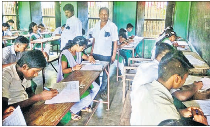
ପରୀକ୍ଷା ହଲ ଭିତରେ ଶିକ୍ଷକମାନେ କଳାବ୍ୟାଜ୍ ପିନ୍ଧିଛନ୍ତି ।

ଓଡ଼ିଶା ସ୍କୁଲ କଲେଜ ଶିକ୍ଷକ କର୍ମଚାରୀ ମିଳିତ ମଞ୍ଚ ପକ୍ଷରୁ ପୂର୍ଣ୍ଣ ଅନୁଦାନ ଏବଂ ଅନ୍ୟାନ୍ୟ ଦାବି ନେଇ ଅଗଷ୍ଟ ୧୬ରୁ ଆୟୋଜନ ଚାଲିଛି । ଭୁବନେଶ୍ଵର ସମେତ ପ୍ରତ୍ୟେକ ବ୍ଲକ୍ ଯାଏ ଆୟୋଜନ ବ୍ୟାପିବାରେ ଲାଗିଛି । ରୁକ୍ମ ଗ୍ରାଃ ବିଦ୍ୟାଳୟଗୁଡ଼ିକରେ ପାଠପଢ଼ା ଠିକ୍ ହୋଇଯାଇଛି । ଶିକ୍ଷକମାନେ ଆୟୋଜନ କରୁଥିବା ଯୋଗୁ ବିଦ୍ୟାଳୟକୁ ଯାଇନାହାନ୍ତି । ଅନ୍ୟପକ୍ଷେ ଛାତ୍ରାଛାତ୍ରୀମାନେ ମଧ୍ୟ ଶିକ୍ଷକ ନ ଥିବା ଯୋଗୁ ବିଦ୍ୟାଳୟ ଯିବାକୁ ସମ୍ମତ ହେଉନାହାନ୍ତି । ଫଳରେ ଏକ ଅତଳାବସ୍ଥା ଦେଖାଦେଇଛି । ଅନ୍ୟପକ୍ଷେ ଯୋଗାଣରୁ ବନ୍ଦୀ ଶ୍ରେଣୀ ପ୍ରଚଳନ ଆରମ୍ଭ ହୋଇଯାଇଛି । ଛାତ୍ରାଛାତ୍ରୀଙ୍କୁ ଭବିଷ୍ୟତକୁ ଦୃଷ୍ଟିରେ ରଖି ଶିକ୍ଷକମାନେ ଆୟୋଜନ ସାମାନ୍ୟ କୋହଳ କରିଛନ୍ତି । ସେମାନେ ଆୟୋଜନ କରୁଥିଲେ ମଧ୍ୟ ବିଦ୍ୟାଳୟକୁ କଳାବ୍ୟାଜ୍ ପିନ୍ଧି ଆସୁଛନ୍ତି, ପରୀକ୍ଷା ପରିଚାଳନା କରୁଛନ୍ତି । ଏପରିକି ଯେଉଁ ଅଭିଭାବକମାନେ ବିଦ୍ୟାଳୟକୁ ଆସୁଛନ୍ତି, ସେମାନଙ୍କ ମଧ୍ୟ ଆୟୋଜନ ସମ୍ପର୍କରେ ଅବଗତ କରାଯାଇଛି । ଅପରପକ୍ଷେ ଦୀର୍ଘ ୪୦ଦିନ ହେଲା ବିଦ୍ୟାଳୟରେ ପାଠପଢ଼ା ବନ୍ଦ ରହିଥିବା ଯୋଗୁ ଛାତ୍ରାଛାତ୍ରୀମାନେ ପାଠାଭ୍ୟସ୍ତ ଦାରିନାହାନ୍ତି । ଏଭଳି ସ୍ଥିତିରେ ପରୀକ୍ଷାକୁ ନେଇ ସେମାନେ ମଧ୍ୟ ନାନା ଆଶଙ୍କାରେ ରହିଛନ୍ତି ।