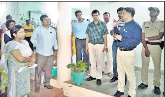
ବିଭିନ୍ନ ଅଧିକାରୀଙ୍କ ସହ ଜିଲାପାଳ ଆଲୋଚନା କରୁଛନ୍ତି।