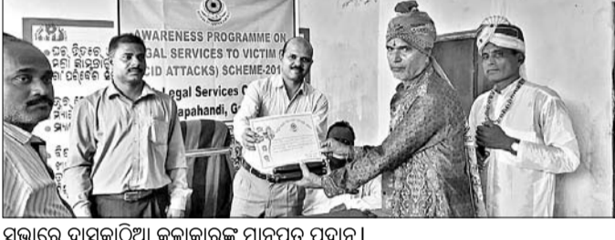
ସଭାରେ ଦାସକାଠିଆ କଳାକାରଙ୍କୁ ମାନପତ୍ର ପ୍ରଦାନ ।