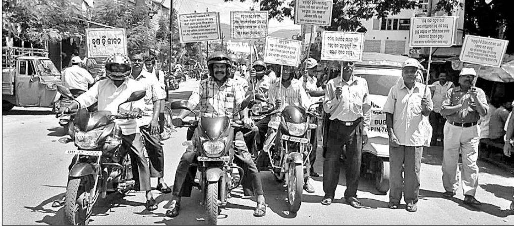
ପୂର୍ବତନ ସୈନିକ ସଂଘ ପକ୍ଷରୁ ବାହାରିଥିବା ଗାଲି ।

ରୁଗୁଡ଼ା, ୨୫ତା(ତି.ଏନ.ଏ.): ପୂର୍ବତନ ସୈନିକ ସଂଘ ପକ୍ଷରୁ ସେବାଦାର ରୁଗୁଡ଼ାରେ ବିଭିନ୍ନ ସଚେତନତା କାର୍ଯ୍ୟକ୍ରମ ଅନୁଷ୍ଠିତ ହୋଇଯାଇଛି । ସଂଘ ଚାର୍ କାର୍ଯ୍ୟକ୍ରମ ଅନୁଯାୟୀ ଏକ ଶୋଭାଯାତ୍ରାରେ ହାତରେ ବିଭିନ୍ନ ପ୍ଲାକାର୍ଡ ଧରି ମଦ୍ୟପାନ କରି ଗାଡ଼ି ନ ଚଳାଇବା, ଗ୍ରାହକ ନିୟମ ମାନିବା, ହେଲମେଟ ବ୍ୟବହାର ଓ ଦ୍ରୁତ ଗତିରେ ଗାଡ଼ି ନ ଚଳାଇବା, ବୃତ୍ତାବଳୀରେ ଗୋପାଳପୁର ସେବା କରିବା, ଗାସ୍ତ୍ରରେ ଅଲିଆ ନ ପକାଇବା, ତମାସୁ ବର୍ଦ୍ଧନ କରିବା, ସ୍ୱାସ୍ଥ୍ୟ ପ୍ରତି ସମାଜ ରହିବା, ପରିବେଶକୁ ସଫା ରଖିବା, କନ୍ୟାଭୁକ୍ତ ହତ୍ୟା ବନ୍ଦ କରିବା, ନାରୀ ସମକ୍ଷାକରଣ କାର୍ଯ୍ୟକ୍ରମରେ ଅଂଶଗ୍ରହଣ କରିବା, ବେତି ବତାଏ ବେତି ପଢ଼ାଏ କାର୍ଯ୍ୟକ୍ରମ ପ୍ରତି ଦୃଷ୍ଟି ଦେବା, ପଲିଥିନ ପୁଲ୍ଲ ପ୍ରତି ଧ୍ୟାନ ଦେବା ନେଇ ସଭା ସହର ପରିକ୍ରମା କରି ଜନସାଧାରଣଙ୍କୁ ସଚେତନ କରାଇଥିଲେ । ଏହି କାର୍ଯ୍ୟକ୍ରମରେ ବଳଦେବ ସାମା ବରିଷ୍ଠ ନାଗରିକ ଟ୍ରଷ୍ଟର ସଭ୍ୟମାନେ ସହଯୋଗ କରିଥିଲେ ।