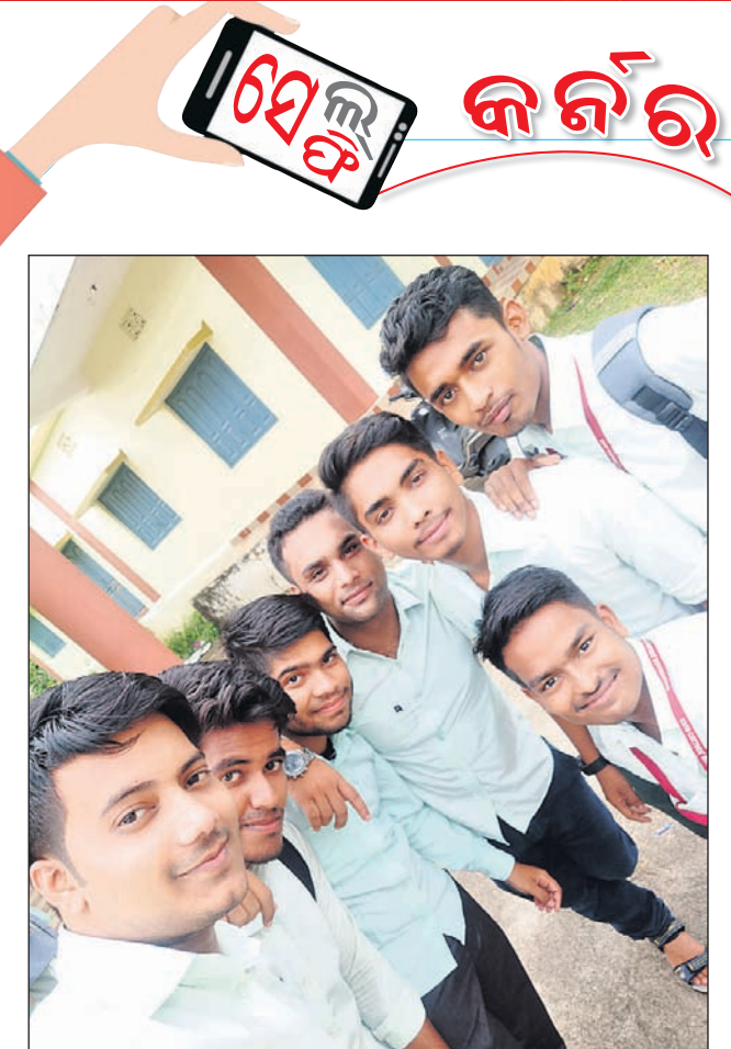
ସୁଖୀ ଗ୍ରୀଷ୍ମ ଶୁଭାଶିଷ