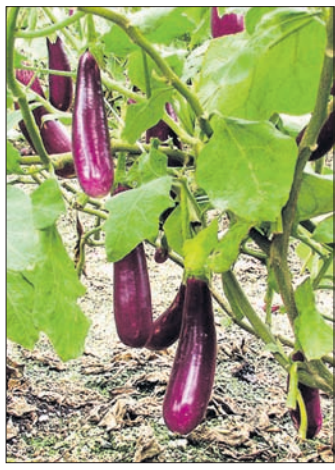
ଏହାର ଔଷଧୀୟ ଗୁଣଗୁଡ଼ିକ ମଧ୍ୟରେ ରକ୍ତହୀନତା, ଚର୍ମରୋଗ, କୁମ୍ଭି ବ୍ୟଞ୍ଜନ, ରକ୍ତ ଅପରିଷ୍କାର, ହାତ୍ ହିଦ୍ଧାଳ, ଆକମା, ତ୍ରୋକାକ୍ତପିତ୍ତ, ଗାଳପଏତ୍, ଖାଦ୍ୟ ହଜମ ସମସ୍ୟା, ପରିସ୍ରାଜନିତ ଓ ଅନୁଦୋଷ ନିରାକରଣ ନିମନ୍ତେ ବ୍ୟବହାର ବେଶ୍

ବାଇଗଣରେ ଫଳ ଓ କାଣ୍ଡ ବିକ୍ଷା ପୋକର ଦମନ ପାଇଁ ସମର୍ଥ ଯୋଗ ପରିଚାଳନା ପଦ୍ଧତି ଅନୁସାରେ ଏକର ପ୍ରତି ୨୦ ହକାର ବ୍ରାଜକୋଗ୍ରାମା ପରାଶ୍ରୟା କୀଟ କ୍ଷାତକୃତ କିମ୍ପା ୩୦୦ପିପିଏମ୍ ନିୟମିତ କାର୍ବୋଥାଇଓସିଲିନ୍ ଏକର ପ୍ରତି ୧ଲିଟର ହିସାବରେ ପ୍ରୟୋଗ କରନ୍ତୁ । ଅଥବା ପ୍ରତି ଲିଟର ପାଣିରେ ୫ଗ୍ରାମ୍ କାର୍ବୋରିଲ୍ ମିଶାଳ ସିଧିନ କରନ୍ତୁ । କାଣ୍ଡକୁ ଜାତୀୟ ଫସଲରେ ଲାଲ୍ ଓ କଳା କାଣ୍ଡକୁ ଭୃଙ୍ଗ ଦମନ ଲାଗି ଏକର ପ୍ରତି ୮୦୦ଗ୍ରାମ୍ ହିସାବରେ କାର୍ବୋରିଲ୍ ପ୍ରୟୋଗ କରନ୍ତୁ । ଲକ୍ଷ୍ୟମାନିତ ଫସଲରେ ପତ୍ରମୋଟା ଦେଖାଗଲେ ଏହାର ଦମନ ପାଇଁ ପ୍ରତି ଲିଟର ପାଣିରେ ୨ ମିଲି ଆବମେକ୍ସିନ୍ (୧.୯%) କିମ୍ପା ୧.୫୦୦ ୨ମିଲି ଇଥ୍ରାମ୍ ଔଷଧ ମିଶାଳ ପତ୍ର ସିଧିନ କରନ୍ତୁ । ଝୁଡ଼ଙ୍ଗ ଫସଲରେ ଜର ପୋକର ଆକ୍ରମଣ ଦେଖାଗଲେ ଏକର ପ୍ରତି ୫୦ମିଲି ଇମିଡାକ୍ଲୋପ୍ରିଡ୍ ୨୦୦ଲିଟର ପାଣିରେ ପତ୍ର ସିଧିନ କରନ୍ତୁ ଏବଂ ଏହାର ୧୦ଦିନ ପରେ ଫସଲ ଅମଳ କରନ୍ତୁ ।