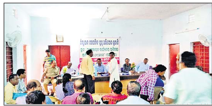
ଜିଲାପାଳ ଅଭିଯୋଗ ଶୁଣାଣି କରୁଛନ୍ତି।

ନୋଟିସ ନ ଦେଇ ଜବରଦଖଲ ଉଚ୍ଛେଦ କରାଯାଇଥିବା ଅଭିଯୋଗ ହୋଇଛି।