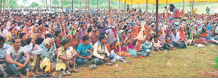
କାର୍ଯ୍ୟକ୍ରମରେ ଯୋଗ ଦେଇଥିବା ଶ୍ରଦ୍ଧାଳୁ।

ଦାରିଙ୍ଗପାଡ଼ି, ୨୫୯ (ଡି.ଏନ୍.ଏ.) ଦାରିଙ୍ଗପାଡ଼ିର ଦାରିଙ୍ଗପାଡ଼ିରେ ମଙ୍ଗଳବାର ଗ୍ରାଉରଲ ଡାୟୋସିସ୍ ଅଫ୍ କନ୍ୟାମାଳର ଦାରିଙ୍ଗପାଡ଼ି ଶାଖା ଉଦ୍‌ଘାଟିତ ହୋଇଛି।