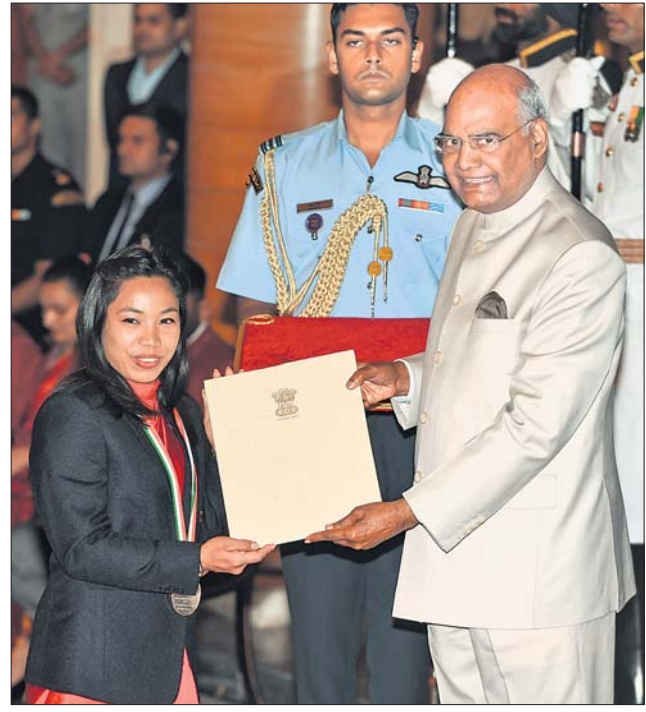
ରାଷ୍ଟ୍ରପତି ରାମନାଥ କୋବିନ୍ଦଙ୍କଠାରୁ ଅର୍ଜୁନ ପୁରସ୍କାର ଗ୍ରହଣ କରୁଛନ୍ତି (ବାମକୁ) ଜିନ୍ଦସନ ଜନସନ, ହିମା ଦାସ, ନିରଜ ଚୋପ୍ରା ଏବଂ ଖେଳରତ୍ନ ମାଗାବାଲ ତାକୁ।