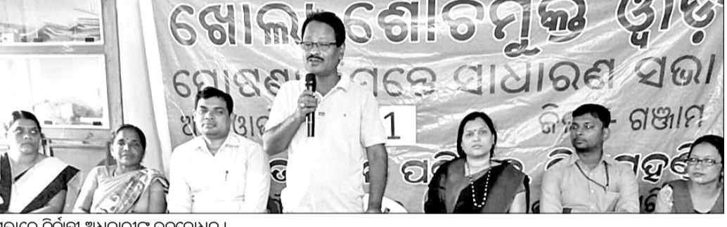
ସଭାରେ ନିର୍ବାହୀ ଅଧିକାରୀଙ୍କ ଉଦ୍ଦେଶ୍ୟ ।

ବିଗପହଣ୍ଡି, ୨୫ତା(ତି.ଏନ.ଏ.): ବିଗପହଣ୍ଡି ଏନ୍‌ଏସ୍‌ସି ପକ୍ଷରୁ ଶିବିର ପ୍ରଦାନ ଯୋଜନାରେ ଖୋଲା ଶୈତପୁଲ୍ଲ ଓଡ଼ିଆ ସମ୍ପର୍କିତ ଆଲୋଚନା ସଭା ଅନୁଷ୍ଠିତ ହୋଇଯାଇଛି । ଏନ୍‌ଏସ୍‌ସି କାର୍ଯ୍ୟନିର୍ବାହୀ ଅଧିକାରୀ ପ୍ରଫୁଲ୍ଲ