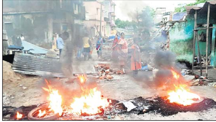
ଜବରଦଖଲ ଉଚ୍ଛେଦକୁ ବିରୋଧ କରି ରାସ୍ତାବୋକୋ କରାଯାଇଛି।

ଭଞ୍ଜନଗର, ୨୫।୯(ଡି.ଏନ.ଏ.) ଭଞ୍ଜନଗର ସହରର ବିଭିନ୍ନ ଅଞ୍ଚଳରେ ମଙ୍ଗଳବାର ଜବରଦଖଲ ଉଚ୍ଛେଦ ହୋଇଛି।