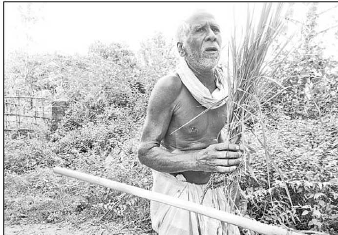
ନଷ୍ଟ ହୋଇଥିବା ଫସଲ ଦେଖାଇଛନ୍ତି ଜଣେ ଚାଷୀ ।

ଜଗନ୍ନାଥପ୍ରସାଦ ରୁକ୍ ବହୁ ଅଞ୍ଚଳରେ ବର୍ତ୍ତମାନ ଧାନଚାଷରେ ଅଜଣା ରୋଗକୁ ନେଇ ଚାଷୀ ଚିନ୍ତିତ ହୋଇପଡିଛନ୍ତି। କୃଷି ବିଭାଗକୁ ଅଭିଯୋଗ କଲେ ବୁଝା ସମସ୍ୟା ସମାଧାନ ଉପରେ ପଦକ୍ଷେପ ନେବା ତ ବୁଝର କଥା ପରାମର୍ଶ ମଧ୍ୟ ଦିଆଯାଇଥିବାବେଳେ ଚାଷୀ ମହଲରେ ଅବଗୋଷ୍ଠ ଦେଖାଦେଇଛି। ସମସ୍ତ ବିଭାଗୀୟ ଅଧିକାରୀମାନେ ଶେତ ପରିଦର୍ଶନ କରୁନଥିବା ଅଭିଯୋଗ ହୋଇଛି। ଚିକିତ୍ସା ବର୍ଷାଦିନ ଚାଷୀ ହେବା ଦ୍ୱାରା ଚାଷ ଠିକ୍ ହୋଇଥିଲା। ସମସ୍ତେ ଭଲ ଫସଲ ହେବା ନେଇ ଆଶା କରୁଥିବା ବେଳେ ବର୍ତ୍ତମାନ ଏଭଳି ରୋଗପୋକ ସମସ୍ୟା ଚାଷୀଙ୍କ ମନରେ ଏକ ପ୍ରକାର ଶଙ୍କା ପଶିଛି। ଚାଷୀମାନେ ଏହି ରୋଗକୁ ଚିହ୍ନି ପାରୁନଥିବା ବେଳେ କେତେକ ଧାର ଦେଖାଇବାକୁ ରୁକ୍ ବହା ବିଭାଗୀୟ ପ୍ରମୋଦ କରି ବିଫଳ ହେଉଛନ୍ତି। ଉକ୍ତ