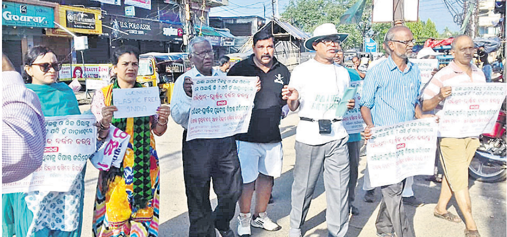
ସଦସ୍ୟମାନେ ପୋଷ୍ଟର ମାଧ୍ୟମରେ ପଲିଥିନ ପ୍ଲାଷ୍ଟିକ୍ ବର୍ଜନ ନେଇ ସଚେତନ କରାଇଛନ୍ତି ।