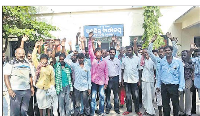
ତହସିଲ କାର୍ଯ୍ୟାଳୟ ସମ୍ମୁଖରେ ଗ୍ରାମବାସୀଙ୍କ ବିରୋଧ।

ଦିଗପହଣ୍ଡି ରୁକ୍ମ କକର ଗ୍ରାମ ସଂଲଗ୍ନ ହୁରୁରା ପାହାଡ଼ରେ ବେଆଇନ ବିଚ୍ଛୋରଣ ପ୍ରତିବାଦରେ ଗ୍ରାମବାସୀ ତହସିଲ କାର୍ଯ୍ୟାଳୟ ସମ୍ମୁଖରେ ବିରୋଧ ପ୍ରଦର୍ଶନ କରିଛନ୍ତି। ଦଳମତ ନିର୍ଦ୍ଦେଶପତ୍ର ଗ୍ରାମର ଶତାଧିକ ଲୋକେ ସୋମବାର ଅପରାହ୍ଣରେ ତହସିଲଦାର ଅଫିସକୁ ଜୁମାର ସ୍ୱାର୍ଦ୍ଧକୁ ଦସ୍ତଖତ ସମ୍ମିଳିତ ସ୍ମାରକପତ୍ର ପ୍ରଦାନ କରିଛନ୍ତି। ଗ୍ରାମ ନିକଟ ପାହାଡ଼ରେ ଥିବା କପଟର ଖାଦାନ ଲିଫ୍ଟ ବାଟିଲ ପାଇଁ ସ୍ମାରକପତ୍ରରେ ଉଲ୍ଲେଖ ରହିଛି। ପାହାଡ଼ ନିକଟରେ ଜନସମ୍ପତ୍ତି ଗଢ଼ି ଉଠିଥିବା ବେଳେ କେତେକ ବ୍ୟକ୍ତି ତିନାମାଲଟ ଡିଟୋନେଟର ବ୍ୟବହୃତ କରି ବିଚ୍ଛୋରଣ