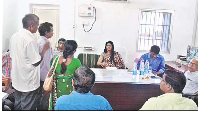
ଜିଲାପାଳ ଅଭିଯୋଗ ଶୁଣୁଛନ୍ତି।