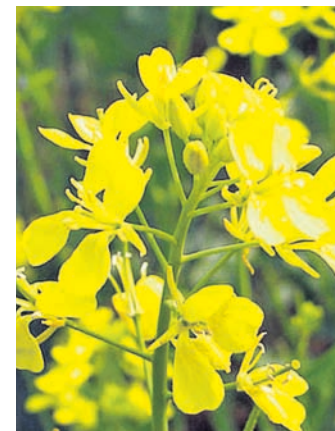
ସୌଖ୍ୟର ମୁଖ୍ୟ ରୋଗ- ଏହି ରୋଗ ଦେଖାଦେଲେ ଏକର ପ୍ରତି ୧ କିଗ୍ରା ସଲଫର ସେଡିମେଣ୍ଟ ପତ୍ରରେ ସିଧିନ କରନ୍ତୁ ।

ସୌଖ୍ୟର ମୁଖ୍ୟ ରୋଗ: ଏହି ରୋଗ ହେଲେ ପତ୍ରର ଚକ୍ଚକାଗରେ ଧୂସର ବର୍ଣ୍ଣର ଚିହ୍ନମାନ ଦେଖାଯାଏ ଏବଂ ଏହି ଚିହ୍ନଗୁଡ଼ିକ ଠିକ ଦିନରେ ଭାଗରେ ଅର୍ଥାତ ପତ୍ରର ଉପର ଭାଗରେ ଧଳା ରଙ୍ଗର ଦାଗ ଦେଖିବାକୁ ମିଳେ ଏବଂ ପରେ ପତ୍ର ଶୁଖିଯାଏ । ଏହି ଦାଗ ଗଛର କାଣ୍ଡରେ ମଧ୍ୟ ଦେଖାଯାଏ । ଏହାକୁ ନିୟନ୍ତ୍ରଣ କରିବା ପାଇଁ ଏକର ପ୍ରତି ୧ କିଗ୍ରା କପରଅକ୍ସି କ୍ଲୋରାଇଡ୍ କିମ୍ପା ୧କିଗ୍ରା ଥିମିଆମ୍ ଫସଲରେ ପକାଇବା ଆବଶ୍ୟକ ।