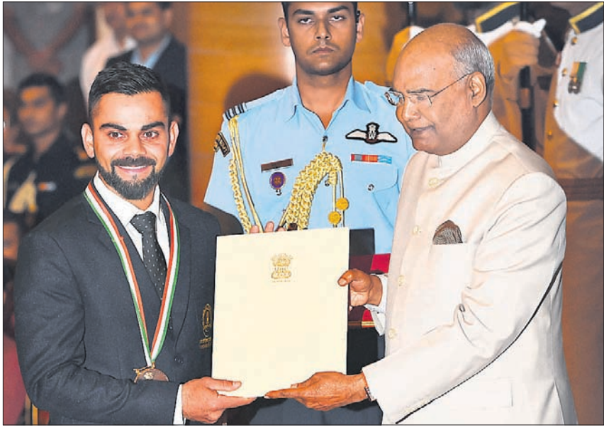
ରାଷ୍ଟ୍ରପତି ରାମନାଥ କୋବିନ୍ଦଙ୍କଠାରୁ ରାଜୀବ ରାଣୀ ଖେଳ ରତ୍ନ ପୁରସ୍କାର ଗ୍ରହଣ କରୁଛନ୍ତି ଡିଏ ଇଣ୍ଡିଆ ଅଧିନାୟକ ବିରାଟ କୋହଲି। (ଜିପୋର୍ଟ ଖେଳ ପୃଷ୍ଠାରେ)

ନୂଆଦିଲ୍ଲୀ, ୨୫ତମ: ଆଧାରର ସାମ୍ବିଧାନିକ ବୈଧତା ସମ୍ପର୍କରେ ସୁପ୍ରିମକୋର୍ଟ ବୁଧବାର ରାୟ ପ୍ରକାଶ କରିବେ। ସରକାରଙ୍କ ଜନକଲ୍ୟାଣମୂଳକ କାର୍ଯ୍ୟକ୍ରମ ସହ ୧୨ ସଂଖ୍ୟାବିଶିଷ୍ଟ ବାୟୋମେଟ୍ରିକ୍ସକୁ ଯୋଡ଼ାଯିବାକୁ ଗତବର୍ଷ ବିରୋଧ କରାଯାଇଥିଲା। ରାୟ ପ୍ରକାଶ ପର୍ଯ୍ୟନ୍ତ ବାଧ୍ୟତାମୂଳକ ଭାବେ ବ୍ୟାଙ୍କ ଓ ମୋବାଇଲ ନମ୍ବରକୁ ଆଧାର ସହିତ ଯୋଡ଼ାଯିବା ଚାଲୁ ରହିବ ବୋଲି ଗତ ମାର୍ଚ୍ଚରେ ସୁପ୍ରିମକୋର୍ଟ ଅନ୍ତରାଣ ରାୟରେ ସ୍ପଷ୍ଟ କରିଥିଲେ। ଆଧାର ସଂଯୋଗ ଦ୍ୱାରା ନାଗରିକଙ୍କ ଗୋପନୀୟତା ଭଙ୍ଗ ହେଉଛି ବୋଲି ଅଭିଯୋଗ କରାଯାଇ ସୁପ୍ରିମକୋର୍ଟରେ ଆଧାର ସଂଯୋଗ ବିରୋଧରେ ଏକାଧିକ ମାମଲା ଦାଏର କରାଯାଇଛି।