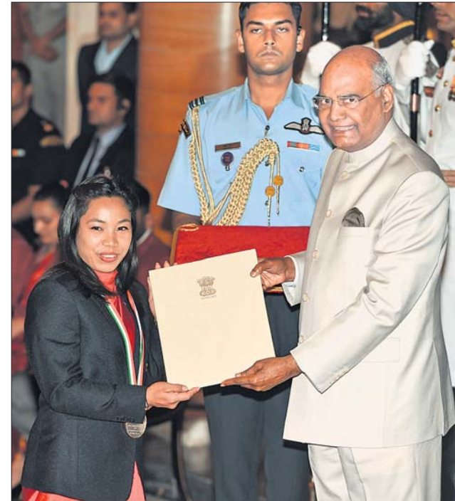
ରାଷ୍ଟ୍ରପତି ରାମନାଥ କୋବିନ୍ଦଙ୍କଠାରୁ ଅର୍ଜୁନ ପୁରସ୍କାର ଗ୍ରହଣ କରୁଛନ୍ତି (ବାମକୁ) ଜିନ୍ଦସନ ଜନସନ, ହିମା ଦାସ, ନିରଜ ଚୋପ୍ରା ଏବଂ ଖେଳରତ୍ନ ମାବାବାଇ ତାକୁ।