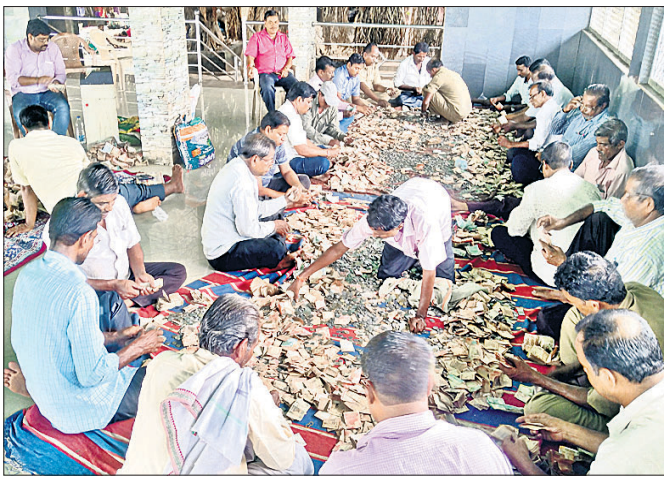
ହୁଣ୍ଡିରୁ ବାହାରିଥିବା ଟଙ୍କା ଗଣାଯାଉଛି।