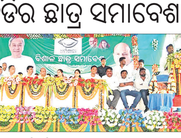
ଛାତ୍ର ସମାବେଶରେ ଉପସ୍ଥିତ ଅତିଥିମାନେ ।