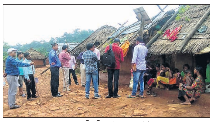
ଖାଦ୍ୟ ଆୟୋଗ ଅଧ୍ୟକ୍ଷଙ୍କ ସହ ଉପସ୍ଥିତ ବିଭାଗୀୟ ଅଧିକାରୀ ।