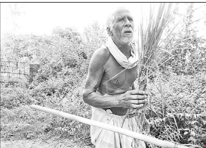
ନଷ୍ଟ ହୋଇଥିବା ଫସଲ ଦେଖାଇଛନ୍ତି ଜଣେ ଚାଷୀ ।

ଜଗନ୍ନାଥପ୍ରସାଦ, ୨୫: ଜଗନ୍ନାଥପ୍ରସାଦ ରୁକ୍ମିଣୀ ଅଞ୍ଚଳରେ ବର୍ତ୍ତମାନ ଧାନଚାଷରେ ଅଜଣା ରୋଗକୁ ନେଇ ଚାଷୀ ଚିନ୍ତିତ ହୋଇପଡ଼ିଛନ୍ତି।