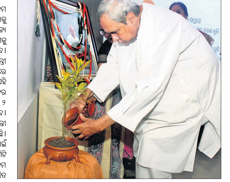
ପୁଣ୍ୟମନ୍ତ୍ରୀ ନବାନ ପଟ୍ଟନାୟକ ଏକ ଚାଉଳରେ ପାଣି ଦେଇ ପ୍ରସ୍ତୁତି ସିଂଠକକୁ ଉଦ୍ଘାଟନ କରୁଛନ୍ତି।

ଚଳିତ ବର୍ଷ ମହାତ୍ମା ଗାନ୍ଧୀଙ୍କ ୧୫୦ତମ ଜୟନ୍ତୀ ସମଗ୍ର ଦେଶରେ ପାଳନ କରିବାକୁ କେନ୍ଦ୍ର ସରକାର ନିଷ୍ପତ୍ତି ନେଇଛନ୍ତି। ରାଜ୍ୟ ସରକାର ମଧ୍ୟ ମହାତ୍ମା ଗାନ୍ଧୀଙ୍କ ଜୟନ୍ତୀକୁ ଆସନ୍ତା ୨ ବର୍ଷ ପର୍ଯ୍ୟନ୍ତ ପାଳନ କରିବେ। ମଙ୍ଗଳବାର ସଚିବାଳୟଠାରେ ପୁଣ୍ୟମନ୍ତ୍ରୀ ନବାନ ପଟ୍ଟନାୟକଙ୍କ ଅଧ୍ୟକ୍ଷତାରେ ଅନୁଷ୍ଠିତ ଏକ ଉଚ୍ଚସ୍ତରୀୟ ସିଂଠକରେ ଏହି ନିଷ୍ପତ୍ତି ନିଆଯାଇଛି। ଆସନ୍ତା ଅକ୍ଟୋବର ୨ ତାରିଖରୁ ୨୦୨୦ ଅକ୍ଟୋବର ୨ ତାରିଖ ଯାଏ ଏହା ପାଳନ କରାଯିବ। ସବୁ ବର୍ଗର ଲୋକଙ୍କୁ ନେଇ ଜୟନ୍ତୀ ପାଳନ କରିବାକୁ ନିଷ୍ପତ୍ତି ନିଆଯାଇଛି। ମହାତ୍ମା ଗାନ୍ଧୀଙ୍କ ଜୟନ୍ତୀ ପାଳନ ପାଇଁ ସଂସ୍କୃତି ବିଭାଗ ପକ୍ଷରୁ ୫ଟି ସର୍ବ କମିଟି ଗଠନ କରାଯାଇଛି। ଅନେକ କାର୍ଯ୍ୟକ୍ରମ ପାଇଁ ମଧ୍ୟ ନିଷ୍ପତ୍ତି ନିଆଯାଇଛି। ଏଥିସହିତ ଜୟନ୍ତୀ କମିଟିର ସଦସ୍ୟମାନଙ୍କ ମତାମତ ଗ୍ରହଣ କରାଯାଇଛି।