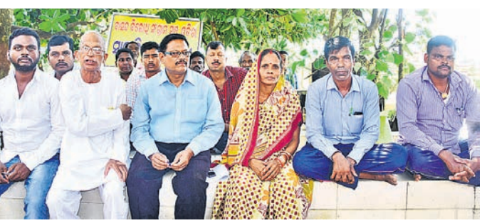
ପୁରୀ ଗଣାଘାଟଠାରେ ବାସନ୍ଦ ବିରୋଧୀ ସଂଗ୍ରାମ ମଞ୍ଚର କର୍ମକର୍ମୀ ।

ପ୍ରମାଣପତ୍ର ମିଳିଥିଲେ ମଧ୍ୟ ସେମାନଙ୍କ ପରିବାର ୧୮ବର୍ଷ ଧରି ବାସନ୍ଦ ଜୀବନ ବିତାଉଛନ୍ତି । ଗଡ଼ିଶାଗୋଦା ଥାନା ବାରିକଶୋରପୁର ଗ୍ରାମର ୩, ଗୋପ ଥାନା ଅଧୀନ ମାହାପୁର ଗ୍ରାମର ୧୮, ସତ୍ୟବାଦୀ ଥାନା ଅନ୍ତର୍ଗତ ମାର୍ଗଶ୍ରୀପଡ଼ା ଗ୍ରାମର ଗୋଟିଏ ବାରିକ ପରିବାର, ପୁରୀ ସଦର ଥାନା ଅଧୀନ ଗୋରୁଆଳର ୧୨ଟି ପରିବାର ବାର୍ଦ୍ଧିନୀ ଧରି ବାସନ୍ଦ ଜୀବନ ବିତାଉଛନ୍ତି । ଗ୍ରାମ ଏବଂ କୌଳିକ ବୃତ୍ତିଠାରୁ ବୃତ୍ତର ଉପାୟ ଏମାନଙ୍କ