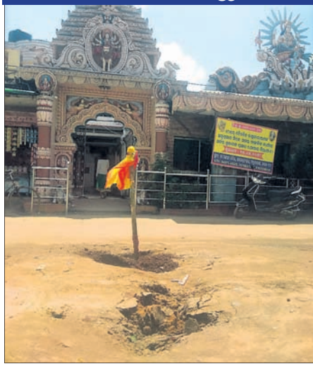
ସିଏସ୍‌ସି ୫୨୯. ଖାର୍ତ୍ତ ମଙ୍ଗଳା ମନ୍ଦିର ନିକଟରେ ରାସ୍ତା ଧରାଯାଇଛି।

ପୂଜାକୁ ମାଧ୍ୟମରୁ ମଧ୍ୟ କମ୍ ସମୟ ବାକି ରହିଛି। ହେଲେ ଜାଇକା କାମ ସରିଥିବା ବିତାନାସୀ, ବାବାମବାଡି, କଲେଜଗଡକ, ମଙ୍ଗଳାମନ୍ଦିର ଭଳି ବିଭିନ୍ନ ଜନଗହଳପୂର୍ଣ୍ଣ ସ୍ଥାନର କିଛି ରାସ୍ତାରେ ଏବେ ବି ମାଟି ଧରିବା ଯୋଗୁଁ ଦୁର୍ଗତରା ଘରୁଛି। ରୂପକାର ସିଏସ୍‌ସିର ସ୍ଵତନ୍ତ୍ର ବୈଠକ ବସିବ। ଏହି ସମସ୍ୟାକୁ ଅଧିକାଂଶ କର୍ମଚାରୀଙ୍କୁ ପ୍ରସଙ୍ଗ କରିବେ ବୋଲି ଜଣାପଡିଛି। ମିଳିତରା ସୂଚନା ପ୍ରଦାନକ, ଜାଇକା ଦ୍ଵାରା ନିୟୋଜିତ ଠିକାଦାରମାନେ ଭାଇବ୍ରେଟର ମେଶିନ ଦ୍ଵାରା ରାସ୍ତାରେ ୪ ଫୁଟରୁ ୨୦ ଫୁଟ ମଧ୍ୟରେ ଖୋଳି କାମ କରନ୍ତି। କାମ ସରିବା ପରେ ଏହାକୁ ଭଲଭାବେ ମରାମତି କରି ରାସ୍ତାକୁ ପୁଣି ଯାତାୟାତ ଉପଯୋଗୀ କରିବା ଆବଶ୍ୟକ। ହେଲେ ଜାଇକା କାମ ସରିଥିବା ଅଧିକାଂଶ ସ୍ଥାନରେ ଏବେ ରାସ୍ତାକୁ ମାଟି ଧରି ବିପଦପୂର୍ଣ୍ଣ ମାନ୍ଦିରୀୟାଳ ସୃଷ୍ଟି ହେଉଛି। ଫଳରେ ଜାଇକା ଦ୍ଵାରା ନିୟୋଜିତ ଠିକାଦାରଙ୍କ ଅବହେଳା ସାମ୍ନାକୁ ଆସିଛି। ଉଦାହରଣ ସ୍ଵରୂପ, ସୋମବାର ୫୨୯. ଖାର୍ତ୍ତ ମଙ୍ଗଳାମନ୍ଦିର ନିକଟରେ ଜାଇକା କାମ ସରିଥିବା ସ୍ଥାନରେ ମାଟି ଧରିଥିବାରୁ ଜଣେ ସ୍କୁଲ ଛାତ୍ରକୁ ଦୁର୍ଗତରା ଘଟିଥିଲା, ଯାହାକୁ ନେଇ ସ୍ଥାନୀୟ ଲୋକଙ୍କ ମଧ୍ୟରେ ଅସନ୍ତୋଷ ବେଶାଦେଇଥିଲା। ଘଟଣାକୁ ନେଇ ସ୍ଥାନୀୟ କର୍ମଚାରୀଙ୍କ ଆସି ଜାଇକା କାମ କରୁଥିବା ଠିକାଦାର ସମ୍ମୁଖେ ବୋଷ ଦେଇ ଚାଲିଯାଇଥିଲେ। ଏବେ ପ୍ରଶ୍ନ ଉଠୁଛି ସାଧାରଣ ଲୋକଙ୍କ ପାଇଁ ଉଦ୍ଦିଷ୍ଟ ଥିବା ରାସ୍ତାକୁ ଯଦି ଠିକାଦାର