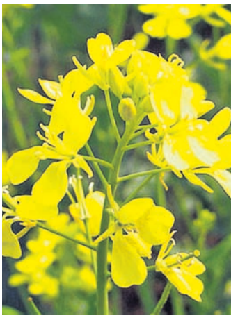
ପାଉଁଶିଆ ରୋଗ- ଏହି ରୋଗ ଦେଖାଦେଲେ ଏକର ପ୍ରତି ୧ କିଗ୍ରା ସକାଂସର ସେଚିଟରୁଖ ପତ୍ରରେ ସିଞ୍ଚନ କରନ୍ତୁ ।