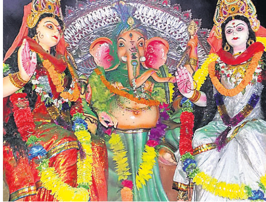
ବାଛରା ପୂଜା ମଣ୍ଡପ।