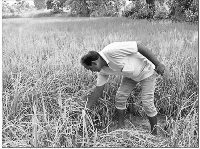
କୃତାସିଂହା ଅଞ୍ଚଳରେ ଜଣେ ଚାଷୀ ଚକଡ଼ା ପୋକ ଲାଗିଥିବା ଧାନ କ୍ଷେତ ଦେଖାଉଛନ୍ତି ।

ବଲାଙ୍ଗୀର ସଦର ବ୍ଲକ ଅଧୀନ କୃତାସିଂହା, ସାହାଜଗାହାଳ ଅଞ୍ଚଳରେ ଧାନ କ୍ଷେତରେ ଚକଡ଼ା ପୋକ ପ୍ରାଚୁର୍ଯ୍ୟ ଦେଖାଦେଇଛି । ପ୍ରାୟ ୭୦ ଏକର ଜମିରେ ଚକଡ଼ା ପୋକ ପ୍ରାଚୁର୍ଯ୍ୟ ଦେଖାଦେଇଛି । ଚକଡ଼ା ପୋକ ବ୍ୟାପକ କ୍ଷତି ଘଟାଇଥିଲେ । ରୋଗପୋକ ଅଣାୟତ୍ତ ହେବାରୁ କେତେକ ଗ୍ରାମରେ ଚାଷୀ ନିଜ ଜମିରେ ନିଆଁ ଲଗାଇବା ଦୃଶ୍ୟ ସମସ୍ତଙ୍କୁ ବିଚଳିତ କରିଥିଲା । ଚଳିତବର୍ଷ ବିକଳ ବର୍ଷା ଯୋଗୁଁ ଜିଲ୍ଲାର ବିଭିନ୍ନ ବ୍ଲକରେ ମାଲୁଡ଼ି ପରିସ୍ଥିତି ଦେଖାଦେଇଥିଲା । ଅନେକ ଗ୍ରାମରେ ବର୍ଷାଭାବ ଯୋଗୁଁ ଚାଷୀମାନେ ଚାଷ କରି ନ ଥିଲେ । ତେବେ ପରବର୍ତ୍ତୀ ସମୟରେ ଭଲ ବର୍ଷା ହେବାରୁ ଚାଷୀମାନେ ବିକଳରେ ଧାନ ଚାଷ ଆରମ୍ଭ କରିଥିଲେ । ଏବେ ଅନେକ ଗ୍ରାମରେ ଭଲ ଫସଲ ହେବ ବୋଲି ଆଶା କରାଯାଉଥିବା ବେଳେ ଚକଡ଼ା ପୋକ ପ୍ରାଚୁର୍ଯ୍ୟ ଦେଖାଦେଇ ଚାଷୀମାନେ ପଡ଼ିଛନ୍ତି । ବଲାଙ୍ଗୀର ସଦର ବ୍ଲକ ଅନ୍ତର୍ଗତ କୃତାସିଂହା ଓ ସାହାଜଗାହାଳ ଅଞ୍ଚଳରେ ୭୦ରୁ ଉର୍ଦ୍ଧ୍ୱ ଏକର ଧାନ ଫସଲରେ ଚକଡ଼ା ପୋକ