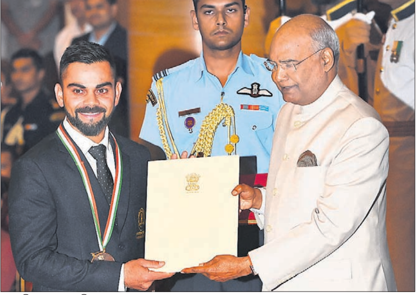
ରାଷ୍ଟ୍ରପତି ରାମନାଥ କୋବିନ୍ଦଙ୍କଠାରୁ ରାଜ୍ୟ ଶେକର ରତ୍ନ ପୁରସ୍କାର ଗ୍ରହଣ କରୁଛନ୍ତି ଡି.ଏ. ଭଣ୍ଡାରୀ ଅଧ୍ୟକ୍ଷଙ୍କ ବିରାଟ କୋହଳି। (କିପୋର୍ଟ ଷେକ ପୃଷ୍ଠାରେ)

ନୂଆଦିଲ୍ଲୀ, ୨୫।୯: ଆଧାରର ସାମ୍ବିଧାନିକ ଦୈନିକ ସମ୍ପର୍କରେ ସୁପ୍ରିମକୋର୍ଟର ବୁଧବାର ରାୟ ପ୍ରକାଶ କରିବେ। ସରକାରଙ୍କ ଜନକଲ୍ୟାଣମୂଳକ କାର୍ଯ୍ୟକ୍ରମ ସହ ୧୨ ସଂଖ୍ୟାବିଶିଷ୍ଟ ଗାୟୋମେନ୍ଟିକ୍ସକୁ ଯୋଡ଼ାଯିବାକୁ ଗତବର୍ଷ ବିରୋଧ କରାଯାଇଥିଲା। ରାୟ ପ୍ରକାଶ ପର୍ଯ୍ୟନ୍ତ ବାଧ୍ୟତାମୂଳକ ଭାବେ ଦାଖଲ ଓ ସେବାରେ ନିୟନ୍ତ୍ରଣ ଆଧାର ସହିତ ଯୋଡ଼ାଯିବା ଚାଲୁ ରହିବ ବୋଲି ଗତ ମାର୍ଚ୍ଚରେ ସୁପ୍ରିମକୋର୍ଟ ଅଭିଯୋଗ ରାୟରେ ସ୍ପଷ୍ଟ କରିଥିଲେ। ଆଧାର ସଂଯୋଗ ହାରା ନାଗରିକଙ୍କ ଗୋପନୀୟତା ଭଙ୍ଗ ହେଉଛି ବୋଲି ଅଭିଯୋଗ କରାଯାଇ ସୁପ୍ରିମକୋର୍ଟରେ ଆଧାର ସଂଯୋଗ ବିରୋଧରେ ଏକାଧିକ ମାମଲା ଦାଖଲ କରାଯାଇଛି।