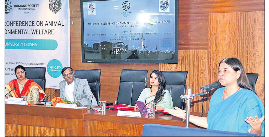
ଜାତୀୟ ଆଲୋଚନାଚକ୍ରରେ କେନ୍ଦ୍ର ମହିଳା ଓ ଶିଶୁ ବିକାଶ ମନ୍ତ୍ରୀ ମାନବକା ଗାନ୍ଧୀଙ୍କ ସହ ଅନ୍ୟମାନେ।

ଜାତୀୟ ଆଲୋଚନା ଓ ଶିଶୁ ବିକାଶ ମନ୍ତ୍ରୀ ମାନବକା ଗାନ୍ଧୀଙ୍କୁ ଏଠାରେ ପ୍ରଶ୍ନିତ ଦିଆଯାଇଛି ବୋଲି ମାନବକା କହିଛନ୍ତି। ବାଲ୍ୟଦେଶ (ଏନ୍ଏଲସ୍) ଓ ଲୁଗାମାନ ସୋସାଇଟି ଲଞ୍ଚନମାଗଣାକୁ (ଏଏସଏଆଇ)ର ମିଳିତ ଆନୁକୁଲ୍ୟରେ ମଙ୍ଗଳବାର ବିଶ୍ୱବିଦ୍ୟାଳୟଠାରେ 'ପ୍ରାଣୀ ଓ ପରିବେଶ ମଙ୍ଗଳ' ଉପରେ ଜାତୀୟ ଆଲୋଚନାଚକ୍ର ଅନୁଷ୍ଠିତ ହୋଇଥିଲା। ଏଥିରେ କେନ୍ଦ୍ରମନ୍ତ୍ରୀ ମାନବକା ଯୋଗଦେଇ ରାଜ୍ୟର ଗୋ-ଚାଲାଣ ଛିଡ଼ିକୁ ନେଇ ସିଧାସଳଖ ଓଡ଼ିଶା ପୋଲିସ୍, ପ୍ରାଣୀ ସମ୍ପଦ ବିଭାଗ ଓ ଜନସାଧାରଣଙ୍କୁ ବୋଧ ଦେଇଛନ୍ତି।