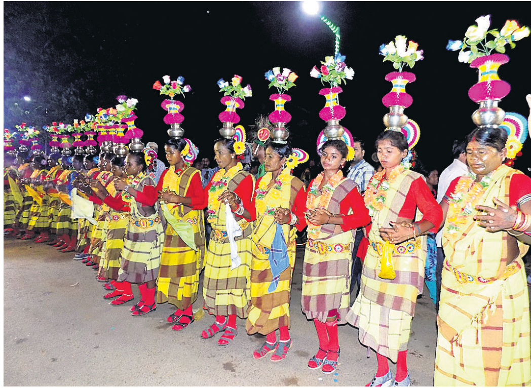
କଟଣା ଗଣେଶ ଭସାଣି ଉତ୍ସବରେ ଆଦିବାସୀ ନୃତ୍ୟ।