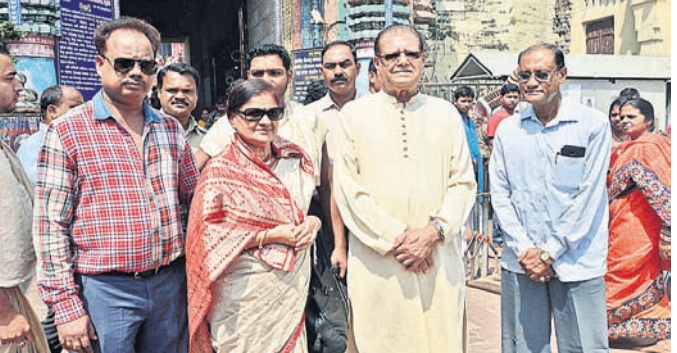
ନିରସର ପୂର୍ବତନ ରାଷ୍ଟ୍ରପତି ସପରବାର ଶ୍ରୀମନ୍ଦିରକୁ ଶ୍ରୀକାନ୍ତଙ୍କ ଦର୍ଶନ କରି ଯିବେ ।

ନିମାପଡ଼ା, ୨୫.୯ (ଡି.ଏ.ଏ.): ନିମାପଡ଼ା ଥାନା ଅଞ୍ଚଳର ଜଣେ ବିବାହିତ ମହିଳାଙ୍କୁ ତାଙ୍କ ଶୁଣ୍ଠର ବଳାଙ୍ଗାର ଉଦ୍ୟମ କରିଛନ୍ତି । ଏହି ଘଟଣାରେ ପୋଲିସ ଅଭିଯୁକ୍ତ ଶୁଣ୍ଠରକୁ ମଙ୍ଗଳବାର ରିମଫ କରିଛି । ସୂଚନା ଅନୁଯାୟୀ, ଗତ ୧୫ତାରିଖ ରାତିରେ ଉକ୍ତ ମହିଳାଙ୍କ ସ୍ୱାମୀ ଘରେ ନ ଥିଲେ । ଏହାର ସୂଚନା ନେଇ ଶୁଣ୍ଠର ବୋହୂଙ୍କୁ ଖୋଜିବା ଘରେ ପଶି ତାଙ୍କୁ ଅପରାଧରତ କରିବା ସହ ବଳାଙ୍ଗାର ଉଦ୍ୟମ କରିଥିଲେ । ଘଟଣା ସଂଗ୍ରାହରେ ବୋହୂ ସୋମବାର ଥାନାରେ ଅଭିଯୋଗ କରିଥିଲେ । ପୋଲିସ ଏନେଇ ନଂ ୨୮୧/୧୮ରେ ଏକ ମାମଲା ରୁଜୁ କରି ଘଟଣାର ତଦନ୍ତ ଚଳାଇଛି । ଘରେ ଅଭିଯୁକ୍ତ ଶୁଣ୍ଠରକୁ ଗିରଫ କରି କୋର୍ଟ ଚାଲାଣ କରିଛି । କୋର୍ଟ ଅଭିଯୁକ୍ତଙ୍କ ଜାମିନ ଆବେଦନକୁ ନାମସ୍ଥିର କରି କେଲ ପଠାଇ ଦେଇଛନ୍ତି । ପୋଲିସ ମଙ୍ଗଳବାର ଉଭୟ ଶୁଣ୍ଠର ଓ ବୋହୂଙ୍କୁ ଚାଲୁଥା ମାନାବା ପାଇଁ ନିମାପଡ଼ା ମେଡିକାଲକୁ ପଠାଇଛି ।