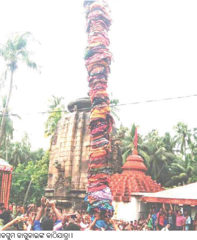
ଅଳଗୁମ କାଗୁଲାଇଙ୍କ କାଠିଯାତ୍ରା ।

ପୁରୀଜିଲା ସତ୍ୟବାଦୀ ବ୍ଲକ ଅଳଗୁମ ଗ୍ରାମର ପ୍ରତ୍ୟକ୍ଷ ଦେବୀ ମା' ଜାଗୁଲେଇଙ୍କ ପାରମ୍ପରିକ କାଠିଯାତ୍ରା ମଙ୍ଗଳବାର ଅନୁଷ୍ଠିତ ହୋଇଯାଇଛି । ବର୍ଷକୁ ଥରେ ଏହି ଯାତ୍ରା କରାଯାଉଥିବା ମାନସିକଧାରୀ ଭକ୍ତ ଓ ଶ୍ରଦ୍ଧାଳୁଙ୍କର ଭିଡ଼ ଲାଗିଥିଲା । ୧୨ପତାରେ ଭୋଗ ଖାଇ ମା'ଙ୍କର ବିଜେ ପ୍ରତିମା ମଧ୍ୟାହ୍ନରେ ମନ୍ଦିରକୁ ଫେରିବା ପରେ କାଠିଯାତ୍ରା ଆରମ୍ଭ ହୋଇଥିଲା । ଝୁଣାଧୂପ, ଦୀପ, ଆଳତି, ଘଷ, କାହାଳୀ, ଡୋଲ, ମହୁରି, ହରିବୋଲ, ଛୁଳିଧୁଳି ଧରି ମଧ୍ୟରେ ମା'ଙ୍କ ଶ୍ରୀଅଙ୍ଗକୁ ଆଖିମାଳ ଅଣାଯାଇ ୨୨ ହାତ ୨୨ ଅଙ୍ଗୁଳ ଲମ୍ବ ଏବଂ ଗୋଲାକାର ବିଶିଷ୍ଟ ଏକ କାଠିରେ (ଖୁମ୍ବ) ଲାଗି କରାଯାଇଥିଲା । ମା'ଙ୍କ ଭବେଶ୍ୟରେ ଶ୍ରଦ୍ଧାଳୁମାନେ ଅର୍ପଣ କରିଥିବା ଶହ ଶହ ସଂଖ୍ୟାରେ ଶାଢ଼ି ଲୁଗାକରି ମହାରଣା ସେବକମାନେ ଭକ୍ତ କାଠିରେ ବାନ୍ଧିଥିଲେ । ଶାଢ଼ି ବନ୍ଧାଣ ସେବାର ଗ୍ରାମର ଭକ୍ତ