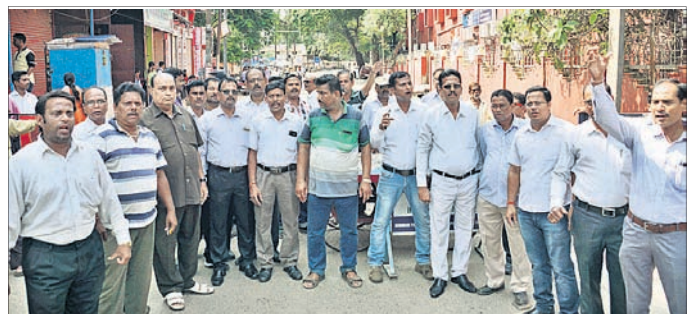
ଆଇନଜୀବୀମାନେ କଟକରା ରୋଡ଼କୁ ସିଲ୍ କରି ଆଲୋଚନା କରୁଛନ୍ତି।