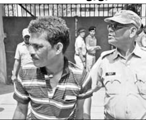
ଅନ୍ତେବାସୀଙ୍କ ଆକ୍ରମଣରେ ଆହତ ହୋଇଥିବା ବାଲି ସୁଧାର ଗୃହ (କୃତକାରୀଙ୍କ ଦୃଷ୍ଟିରେ)