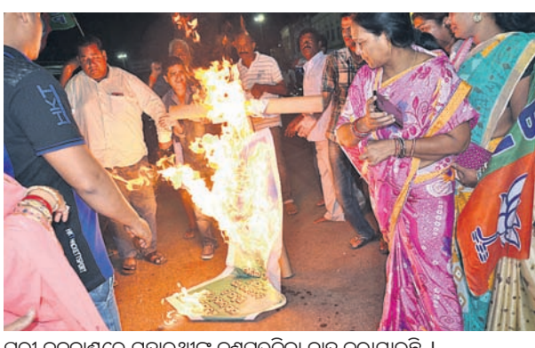
ପୁରୀ ବଡ଼ଦାଣ୍ଡରେ ମହାରଥୀଙ୍କ କୁଶପୁରାଣିକା ଦାସ କରାଯାଇଛି ।

ପୁରୀ ଅଧିକାରୀ, ୨୫୫୯ କୃଷିମନ୍ତ୍ରୀ ପ୍ରତାପ ମହାରଥୀଙ୍କ ଏକ ଭିଡିଓ ସୋସିଆଲ ମିଡିଆରେ ଭାଇରାଲ ହୋଇଛି। କୃଷିମନ୍ତ୍ରୀ ଉକ୍ତ ଭିଡିଓରେ ମହିଳାଙ୍କ ପ୍ରତି ଗଭୀର ଓ ଆକ୍ରୋଧ କରି କହିଛନ୍ତି। ଏହି ଭିଡିଓକୁ ନେଇ ମହିଳାମାନଙ୍କ ମଧ୍ୟରେ ତେଜସ୍ୱି ଅଭିଯୋଗ ହୋଇଛି। ୨୪ ଘଣ୍ଟା ମଧ୍ୟରେ ମନ୍ତ୍ରୀ ପଦକୁ ବହିଷ୍କାର କରିବା ଲାଗି ଦାବି କରିଛନ୍ତି ଭାଇମାନେ। ଅନ୍ୟପକ୍ଷରେ ବଡ଼ଦାଣ୍ଡ ଗାଉନ ଥାନା ସମ୍ପୂର୍ଣ୍ଣରେ ଭାଇମାନେ ନଗର ମହିଳା ମୋର୍ଚ୍ଚା ପକ୍ଷରୁ କୃଷିମନ୍ତ୍ରୀ ମହାରଥୀଙ୍କ ଉନ୍ମତ୍ତ ଦାବି କରି କୁଶ ପୁରାଣିକା ଦାସ କରାଯାଇଛି।