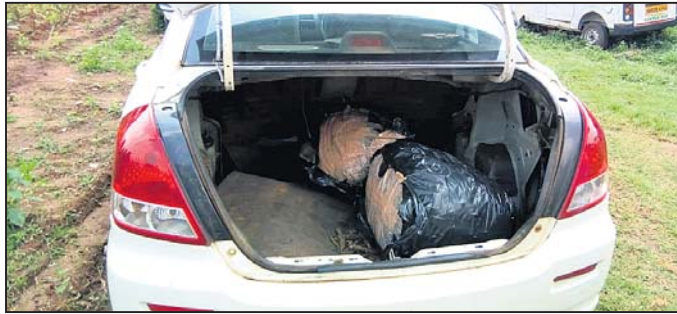
ଜବତ କାର ସହ ଗଞ୍ଜେଇ।