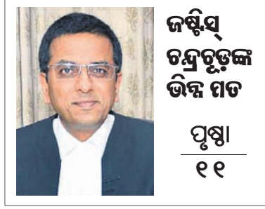
ଜଷ୍ଟିସ୍ ଚନ୍ଦ୍ରଚୂଡ଼ଙ୍କ ଭିନ୍ନ ମତ ପୃଷ୍ଠା ୧୧