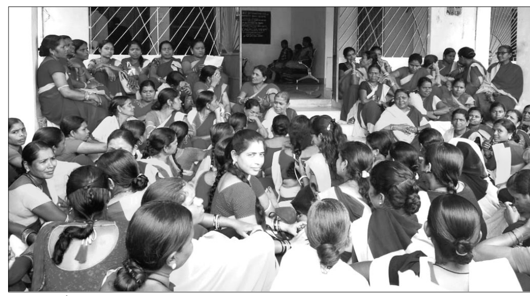
ଅଙ୍ଗନୱାଡ଼ି କର୍ମୀମାନେ ଧାରଣାରେ ବସିଛନ୍ତି।

କନ୍ଧମାଳ ଜିଲା ବାଲିଗୁଡ଼ା ବ୍ଲକ୍ରେ କାର୍ଯ୍ୟରତ ସମସ୍ତ ଅଙ୍ଗନୱାଡ଼ି କର୍ମୀମାନଙ୍କର ବିଭିନ୍ନ ପଦସାଧା ସମ୍ପର୍କରେ ବାରମ୍ବାର ବିଭାଗୀୟ କର୍ମଚାରୀଙ୍କୁ ନିଖିତ ତଥା ମୌଖିକ ଆକାରରେ ଜଣାଯାଇଥିଲେ। କିନ୍ତୁ କୌଣସି ପ୍ରକାର ବିଭିନ୍ନ କାର୍ଯ୍ୟାନୁଷ୍ଠାନ ଗ୍ରହଣ କରାଯାଇନଥିବାରୁ ବୁଧବାର ବାଧ୍ୟ ହୋଇ ବାଲିଗୁଡ଼ା ବ୍ଲକ୍ରେ କାର୍ଯ୍ୟରତ ୧୯୨ ଅଙ୍ଗନୱାଡ଼ି କେନ୍ଦ୍ର କର୍ମୀମାନେ ସ୍ଥାନୀୟ ଉପଜିଲ୍ଲାପାଳଙ୍କ କାର୍ଯ୍ୟାଳୟ ଆଗରେ ଧାରଣାରେ ବସିଛନ୍ତି। ଏହି କାର୍ଯ୍ୟରତ ଅଙ୍ଗନୱାଡ଼ି କର୍ମୀଙ୍କ ବିଭିନ୍ନ ଦାବା ମଧ୍ୟରେ ୧୨ ଦିନୀ ରହିଛି ସେଗୁଡ଼ିକ ମଧ୍ୟରେ ଅଙ୍ଗନୱାଡ଼ି କେନ୍ଦ୍ର ଏରିଆରେ ରହୁଥିବା କର୍ମୀଙ୍କର ବକେୟା ଦେବା ପ୍ରଦାନ କରାଯାଉ, ମନଦା ଯୋଜନାରେ ହିରାପୁରୀରୁ ନିକଟ, ଏସ.ଏଚ.କି. ୩୦୮ ନିମନ୍ତେ ସ୍ଥଗିତ ଦରମା ଦୁଇଟି ପ୍ରଦାନ କରାଯାଉ, ବିଭିନ୍ନ ଅନୁଷ୍ଠାନରୁ ଗାଈକ ବକେୟାରେ ଅଣାଯାଇ ଖାଦ୍ୟ ପରିଚାଳନା କରାଯାଇଥିବା ବକେୟା ଚାକ