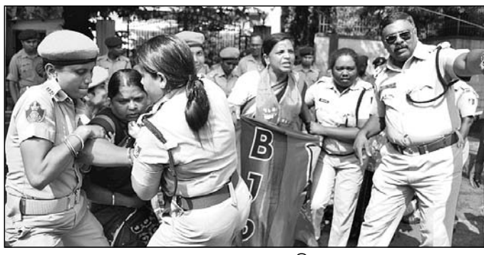
ଆନ୍ଦୋଳନକାରୀଙ୍କୁ ପୋଲିସ୍ ଅଟକାଇବାକୁ ଚେଷ୍ଟା କରୁଛି।

ଭୁଲ୍ କଥା କହିନି ବୋଲି ମହାରଥୀ କହିଛନ୍ତି। ମହାରଥୀ କହିଛନ୍ତି ଯେ, ବିନା କାରଣରେ ମୋ ବକ୍ତବ୍ୟକୁ କଦର୍ଥ କରିବାର ପ୍ରୟାସ କରାଯାଇଛି। ମୁଁ ଏପରି କିଛି କହି ନାହିଁ। ସୋସିଆଲ ମିଡିଆ ଏବଂ ଗଣମାଧ୍ୟମରେ ମତେ