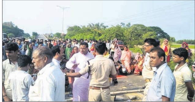
ପାରାଦୀପ ଟେକ ବିଶୋଧନାଗାରର ପୁଖ୍ୟରାସ୍ତା ରଙ୍ଗିଆଗଡ଼ ପୋଲ ନିକଟରେ ଗ୍ରାମବାସୀ ରାସ୍ତାଚାରାକୋ କରିଛନ୍ତି।