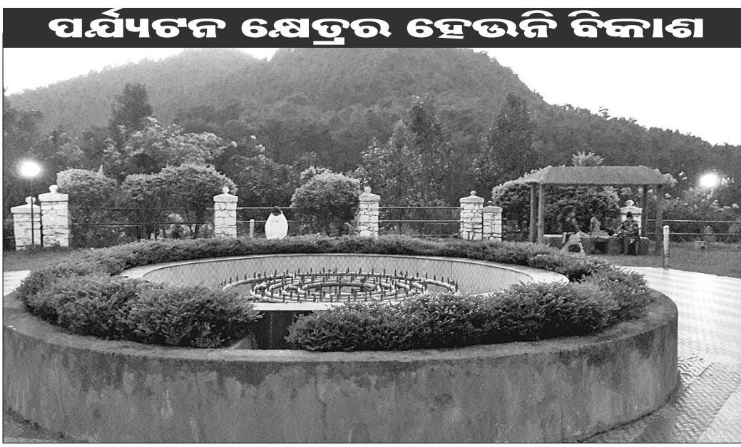
ପାର୍କ ଭିତରେ ଥିବା ଅବଳ ଫାଉଣ୍ଟେନ୍ । ସୌନ୍ଦର୍ଯ୍ୟ ହରାଇବାକୁ କରାଯାଇଛି । କୃତ୍ରିମ ଜଳ ସୁଆରା ଥିଲେ ଚାହା ବାଲୁ ନାହିଁ। ୨୦୧୭ରେ ପର୍ଯ୍ୟଟକଙ୍କ ସଂଖ୍ୟା ନେଚର ପାର୍କ ରହିଛି। ପର୍ଯ୍ୟଟକଙ୍କଠାରୁ ଚଳେ ସଂଗ୍ରହ କରାଯାଇଛି। ଓଷଧିୟ ଚୁଣ୍ଡ, ଫାଟକରେ ନିର୍ମିତ ବିଭିନ୍ନ ପ୍ରାଣୀ, ଜନଜାତିକ ପାରମ୍ପରିକ ଚଳଣିର ପ୍ରତିରୂପ, ପ୍ରକାଶିତ ଉଦ୍ୟାନ ଏବଂ ଚରକଙ୍କ ପଥର ମୂର୍ତ୍ତି ଆଦି ପର୍ଯ୍ୟଟକଙ୍କୁ ଆକୃଷ୍ଟ କରୁଛି । ଚେବେ ଏସବୁ ରଖଣାବେକ୍ଷଣ ଅଭାବରୁ

କନ୍ଧମାଳ ଜିଲା ଦାରିଙ୍ଗବାଡ଼ି ଓଡ଼ିଶା ପର୍ଯ୍ୟଟନ ମାନଚିତ୍ରରେ ସ୍ଥାନ ପାଇଥିଲେ ସୁଦ୍ଧା ମାନ୍ୟତା ପାଇନାହିଁ। ଦୈନିକ ଏଠାକୁ ଶହ ଶହ ପର୍ଯ୍ୟଟକ ଆସୁଛନ୍ତି। ହେଲେ ପର୍ଯ୍ୟଟନକ୍ଷେତ୍ର ଗୁଡ଼ିକର ବିକାଶ ଲକ୍ଷ୍ୟ ରହିଛି। ଗୁରୁବାର ବିଷ୍ଣୁ ପର୍ଯ୍ୟଟନ ବିବସ ପାଳନ କରାଯିବ। ଦାରିଙ୍ଗବାଡ଼ି ଅଞ୍ଚଳକୁ ପଶ୍ଚିମବଙ୍ଗରୁ ଏକାଧିକ ପର୍ଯ୍ୟଟକ ଆସି ଏହି ବିବସ ପାଳନ କରିବେ। ପ୍ରତିବର୍ଷ ସେପ୍ଟେମ୍ବରରୁ ମାର୍ଚ୍ଚ ମାସ ପର୍ଯ୍ୟନ୍ତ ଦାରିଙ୍ଗବାଡ଼ିକୁ ପର୍ଯ୍ୟଟକ ମାନେ ଆସିଥାନ୍ତି। ହେଲେ ଏଠାରେ ପର୍ଯ୍ୟଟନମାନଙ୍କୁ ମୌଳିକ ସୁବିଧା ମିଳୁ ନ ଥିବାରୁ ନିରାଶ ହେବାକୁ ପଡୁଛି। ଦାରିଙ୍ଗବାଡ଼ି ଅଞ୍ଚଳରେ ହିଲଭିୟୁ ପାର୍କ, କର୍ପି ବଗିଚା, ନେଚର ପାର୍କ, ମିଡୁସୁବାସୀ ଖାତରଫାଲ, ଶାନ୍ତି ଉପତ୍ୟକା ଓ ବିଭିନ୍ନ ଉପକୂଳରେ ନେଚର ଲଭର୍ସି ପଏଣ୍ଟ, ପାଇନବଗ ପର୍ଯ୍ୟଟନକ୍ଷେତ୍ର ରହିଛି। ଜଙ୍ଗଲ ଓ ପରିବେଶ ବିଭାଗ ପକ୍ଷରୁ ନେଚର ପାର୍କ ରହିଛି। ପର୍ଯ୍ୟଟକଙ୍କଠାରୁ ଚଳେ ସଂଗ୍ରହ କରାଯାଇଛି। ଓଷଧିୟ ଚୁଣ୍ଡ, ଫାଟକରେ ନିର୍ମିତ ବିଭିନ୍ନ ପ୍ରାଣୀ, ଜନଜାତିକ ପାରମ୍ପରିକ ଚଳଣିର ପ୍ରତିରୂପ, ପ୍ରକାଶିତ ଉଦ୍ୟାନ ଏବଂ ଚରକଙ୍କ ପଥର ମୂର୍ତ୍ତି ଆଦି ପର୍ଯ୍ୟଟକଙ୍କୁ ଆକୃଷ୍ଟ କରୁଛି। ଚେବେ ଏସବୁ ରଖଣାବେକ୍ଷଣ ଅଭାବରୁ