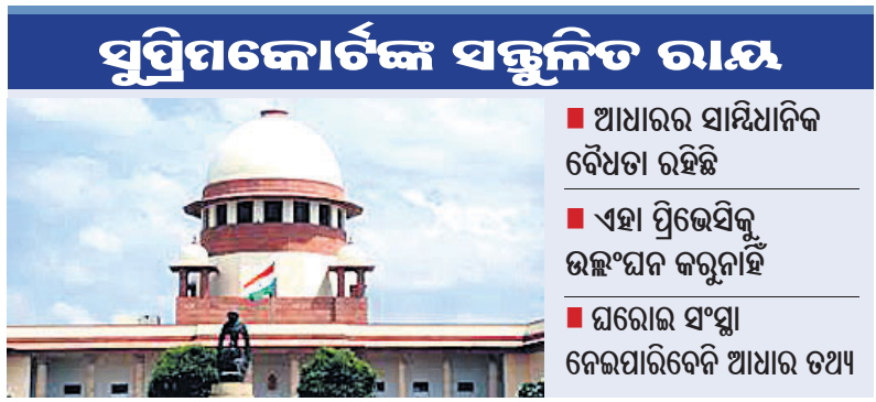
ସୁପ୍ରିମକୋର୍ଟଙ୍କ ସହଜତା ରାୟ ■ ଆଧାରର ସାମ୍ବିଧାନିକ ବୈଧତା ରହିଛି ■ ଏହା ପ୍ରଭେଦକୁ ଉଲ୍ଲେଖନ କରୁନାହିଁ ■ ଘରୋଇ ସଂସ୍ଥା ନେଇପାରିବେନି ଆଧାର ତଥ୍ୟ

ନୂଆଦିଲ୍ଲୀ, ୨୬/୯/୧୮ (ପି.ଟି.) ଆଧାର ବୈଧ । ଏହାର ସାମ୍ପାଦନା ବୈଧତାକୁ ବ୍ୟାପକ କରାଯାଇ ପାରିବ ନାହିଁ ବୋଲି ରୁଧିରାଜ ପୁସ୍ତକାଳୟ ଏକ ଐତିହାସିକ ରାୟ ଦେଇଛନ୍ତି । ସର୍ବୋଚ୍ଚ ଅଦାଲତ ସାମାଜିକ ଯୋଜନାଗୁଡ଼ିକର ସୁବିଧା ହାସଲ ପାଇଁ ଆଧାରର ବୈଧତାକୁ ସୀମିତ ରଖିଛନ୍ତି । କିନ୍ତୁ ମୋବାଇଲ୍ ଫୋନ୍, ବ୍ୟାଙ୍କ ଆକାର୍ଡ ଓ ସ୍କୁଲରେ ନାମଲେଖା ଭଳି କ୍ଷେତ୍ରରେ ଏହାର ଆବଶ୍ୟକତା ନାହିଁ ବୋଲି ଶୁଣାଇ ଦେଇଛନ୍ତି । ୫ ବିଚାରପତି ବିଶିଷ୍ଟ ସାମ୍ବିଧାନିକ ପୀଠ 'ବାଡ଼ି ନ ଭାଙ୍ଗି କି ସାପ ନ ମାରି' ନୀତିରେ ଦେଇଥିବା ଏହି ସହଜତାକୁ ରାଜ୍ୟ ନେଇ ବିଭିନ୍ନ ମହଲରେ ମିଶ୍ର ପ୍ରତିକ୍ରିୟା ପ୍ରକାଶ ପାଇଛି । ଭାଙ୍ଗିବା ରାୟକୁ କେନ୍ଦ୍ର ସରକାରଙ୍କ ବିରୁଦ୍ଧ ବୋଲି ଅବିସ୍ତର କରିଥିବାବେଳେ କଂଗ୍ରେସ ଏହାକୁ ଭିନ୍ନ ଦୃଷ୍ଟିକୋଣରୁ ସ୍ୱାଗତ କରିଛି । ପ୍ରଧାନ ବିଚାରପତି ଦୀପକ ମିଶ୍ରଙ୍କ ଅଧ୍ୟକ୍ଷତାରେ ତଥା ଜଷ୍ଟିସ୍ ଡି.ଓ.ଇ. ଚନ୍ଦ୍ରଚୂଡ଼, ଅଶୋକ ଭୁଷଣ, ଏ.ଏ.ଏମ୍. ଖାନ୍ନୂଲିକର ଏବଂ ଜେ. ପ୍ରିୟଙ୍କା ନେଲ ଗଠିତ ପୀଠ ରୁଧିରାଜ ଆଧାରର ବୈଧତାକୁ ବଢ଼ାଇ ରଖିଛନ୍ତି । ଏହାକୁ ବ୍ୟାପକ କରି ଦାବି ହୋଇଥିବା ଏକାଧିକ ପିରିଶ୍ଟନର ଶୁଣାଣି କରି ପୀଠ ୫:୬ ପୃଷ୍ଠାର ସଂଖ୍ୟାଗରିଷ୍ଠ (୪:୧) ରାୟରେ କହିଛନ୍ତି, ଆୟକର (ଆଇଟି) ରିଟର୍ନ ଦାଖଲ ଓ ପର୍ମାନେଣ୍ଟ ଆକାର୍ଡ ନମ୍ବର