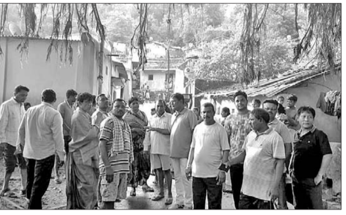
କେସିଙ୍ଗା ସହରର ୧୦ ନଂ. ଖର୍ଚ୍ଚବାସୀଙ୍କ ସହିତ ବିଧାନସଭା ଆଲୋଚନା କରୁଛନ୍ତି ।