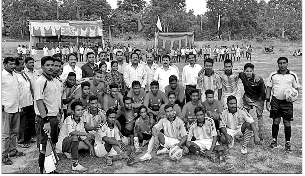
ଅତିଥି ଗଣେଶରେ ଭରସା ଦଳର ଷ୍ଟେଡିଆ।

ଫୁଲ୍ ମେଣ୍ଟ ଚାମ୍ପିୟନ ଫୁଲ୍ ମେଣ୍ଟ ଗତ ରବିବାର ଉଦ୍‌ଘାଟିତ ହୋଇଥିଲା। ଏଥିରେ ସମ୍ପୂର୍ଣ୍ଣ ଗତ ଅଂଶଗ୍ରହଣ କରିଥିଲେ। ଲଖନପୁର ବାଣ୍ଡିପାହାଡ଼ ବନ ପକ୍ଷରୁ ଫୁଲ୍ ମେଣ୍ଟ ଚାମ୍ପିୟନ ଫୁଲ୍ ମେଣ୍ଟ ଗତ ରବିବାର ଉଦ୍‌ଘାଟିତ ହୋଇଥିଲା। ଏଥିରେ ସମ୍ପୂର୍ଣ୍ଣ ଗତ ଅଂଶଗ୍ରହଣ କରିଥିଲେ। ଲଖନପୁର ବାଣ୍ଡିପାହାଡ଼ ବନ ପକ୍ଷରୁ ଫୁଲ୍ ମେଣ୍ଟ ଚାମ୍ପିୟନ ଫୁଲ୍ ମେଣ୍ଟ ଗତ ରବିବାର ଉଦ୍‌ଘାଟିତ ହୋଇଥିଲା। ଏଥିରେ ସମ୍ପୂର୍ଣ୍ଣ ଗତ ଅଂଶଗ୍ରହଣ କରିଥିଲେ। ଲଖନପୁର ବାଣ୍ଡିପାହାଡ଼ ବନ ପକ୍ଷରୁ ଫୁଲ୍ ମେଣ୍ଟ ଚାମ୍ପିୟନ ଫୁଲ୍ ମେଣ୍ଟ ଗତ ରବିବାର ଉଦ୍‌ଘାଟିତ ହୋଇଥିଲା। ଏଥିରେ ସମ୍ପୂର୍ଣ୍ଣ ଗତ ଅଂଶଗ୍ରହଣ କରିଥିଲେ।