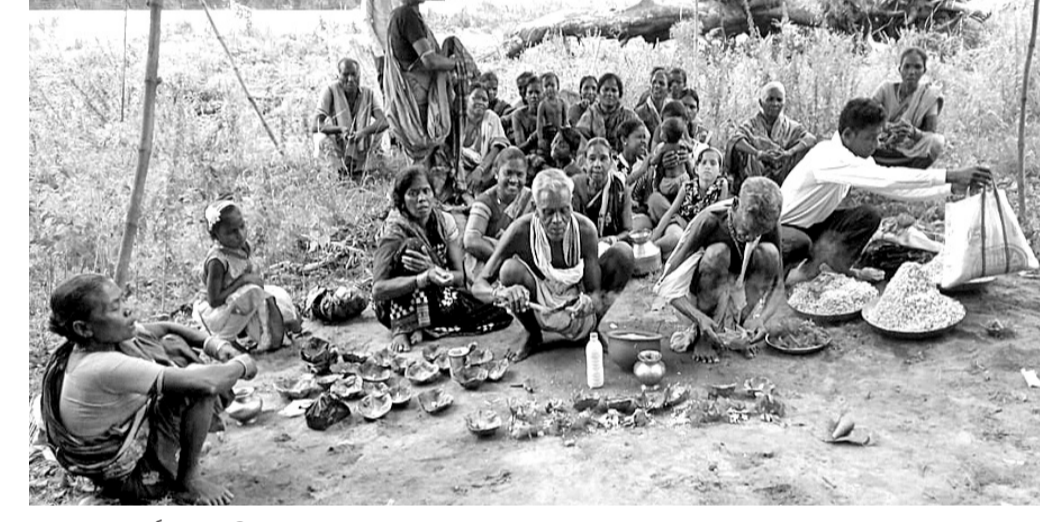
ଗ୍ରାମବାସୀ ପୂଜାର୍ଚ୍ଚନା କରୁଛନ୍ତି ।

ବଲାଙ୍ଗୀର ଜିଲା ପାଟଣାଗଡ଼ ଥାନା ଅନ୍ତର୍ଗତ ଗଂଧାଉଡ଼ା ଗ୍ରାମରେ ପ୍ରତିବର୍ଷ ପରି ଏବର୍ଷ ମଧ୍ୟ ଆଦିବାସୀମାନେ ନବୀନ ଅବସରରେ ଗ୍ରାମର ଶୁଣାନଘାଟ ନିକଟରେ ତାଙ୍କ ପୂର୍ବ ପୁରୁଷଙ୍କ ପୂଜା କରି ଏକ ସଭାର ଆୟୋଜନ କରିଛନ୍ତି । ପୂରାଧିକାରୀଙ୍କୁ ଏହି ପୂଜା ହେଉଥିବାବେଳେ ଏବର୍ଷ ଏହି ପୂଜା କରିବାକୁ ସେମାନେ ଭୟଭୀତ ହୋଇଥିଲେ । କାରଣ ସେହି ଜମି ନିକଟରେ ଏ ବର୍ଷ ଏକ ଘୋରା ପାଖର ପୁଣି ନିର୍ବାଣ ଚାଲିଛି । ସେହି ଘୋରା ପୁଣି ମାଲିକ ଜଙ୍ଗଲ ଜମି, ଗୋଟର ଜମି ଯେଉଁଠାରେ ଆଦିବାସୀମାନେ କାମ କରି ଚଳୁଥିଲେ ସେ ସବୁ ଜମିକୁ ଅଧିକାର କରିନେଇଥିବା ଅଭିଯୋଗ କରିଥିଲେ । ଫଳରେ କମ୍ପାନୀ ସେମାନଙ୍କ ନାଁରେ ମିଥ୍ୟା ମାମଲା କରି ସେମାନଙ୍କୁ କେଳରେ ପୁରାଇ ଦେଇଥିବା ସେମାନେ ଅଭିଯୋଗ କରିଛନ୍ତି । ତେଣୁ ଏବର୍ଷ ସେମାନେ ସେହି ସ୍ଥାନରେ ପୂଜା କରିବାକୁ ଚଳୁଥିଲେ । ପରେ ପାଟଣାଗଡ଼ ଜନମଞ୍ଚର ସହଯୋଗକ୍ରମେ ରୁଧିରର ପୂଜା କରୁଥିଲେ ଏବଂ ଏକ ସଭାରେ ଆୟୋଜନ କରିଥିଲେ । ଏହି ସଭାରେ ଗ୍ରାମର ସମସ୍ତ ଆଦିବାସୀ ଘୋରା ନିର୍ବାଣ କମ୍ପାନୀର କାର୍ଯ୍ୟକୁ ନିରା କରିଥିଲେ । କମ୍ପାନୀ ୫୧ଏକର ଜମି ନିଜ ନାଁରେ