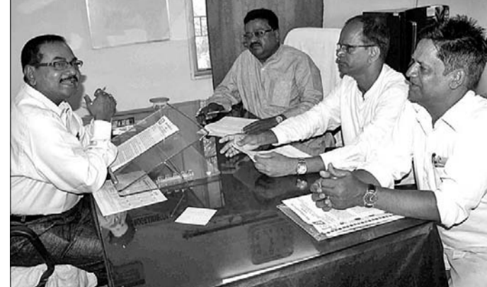
ଓଡ଼ିଶା ମେଡିକାଲ କର୍ମଚାରୀ ସଂଘ ପକ୍ଷରୁ ଆରକିଏଚ୍ ନିର୍ଦ୍ଦେଶକଙ୍କୁ ଦାବିପତ୍ର ପ୍ରଦାନ କରାଯାଇଛି।

ଶଯ୍ୟା ଆବଶ୍ୟକ ପଡୁଛି। ଏପରିକି ହସ୍ପିଟାଲରେ କର୍ମଚାରୀଙ୍କ ଅଭାବ ରହିଛି। ୫ଟି ଠିକା ସଂଘା ମାଧ୍ୟମରେ ସଫେଇ