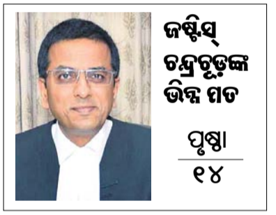
ଜଷ୍ଟିସ୍ ଚନ୍ଦ୍ରଚୂଡ଼ଙ୍କ ଭିନ୍ନ ମତ ପୃଷ୍ଠା ୧୪

ପ୍ରଥମେ ନିଜ ତଥ୍ୟ ସିଲେକ୍ଟାଲ ମିଶ୍ର ଏବଂ ଜଷ୍ଟିସ୍ ଖାନ୍ନୁଲକରଙ୍କ ପାଇଁ ଲେଖିଥିବା ରାୟକୁ ଜଷ୍ଟିସ୍ ସିଦ୍ଧି ପଢ଼ିଥିଲେ । ଜଷ୍ଟିସ୍ ଚନ୍ଦ୍ରଚୂଡ଼ ଏବଂ ଜଷ୍ଟିସ୍ ଭୁଷଣ ସେମାନଙ୍କ ବ୍ୟକ୍ତିଗତ ରାୟ ଲେଖିଥିଲେ । ଜଷ୍ଟିସ୍ ଚନ୍ଦ୍ରଚୂଡ଼ ୩ ବିଚାରପତିଙ୍କ ରାୟଠାରୁ ଭିନ୍ନପଦ ଦେଇଥିବାବେଳେ ଜଷ୍ଟିସ୍ ଭୁଷଣ ସଂଖ୍ୟାଗରିଷ୍ଠ ରାୟ ସହ ସହମତ ବୋଲି କହିଥିଲେ । ଚେଲିକମ୍ପ କମ୍ପାନୀ ବା ଅନ୍ୟ କର୍ପୋରେଟ୍ ଭଳି ଘରୋଇ ସଂସ୍ଥାଗୁଡ଼ିକୁ ଆଧାର ତଥ୍ୟ ହାସଲ ପାଇଁ ଅନୁମତି ପ୍ରଦାନ କରୁଥିବା ଧାରା ୫୬୭କୁ ଜଷ୍ଟିସ୍ ସିଦ୍ଧି ହଟାଇ ଦେଇଛନ୍ତି । ପ୍ରକାଶ ଯେ, ଆଧାରର ବୈଧତାକୁ ବ୍ୟାପକତା କରି ସ୍ୱପ୍ନାକୋର୍ଟରେ ଏକାଧିକ ପିରିଶିତି ଦାବି ହୋଇଥିଲା । ୩୮ ଦିନର ଶୁଣାଣି ପରେ ସର୍ବୋଚ୍ଚ ଅଦାଲତ ନେ' ୧୦ରେ ଏହାର ରାୟ ସଂରକ୍ଷିତ ରଖିଥିଲେ ।