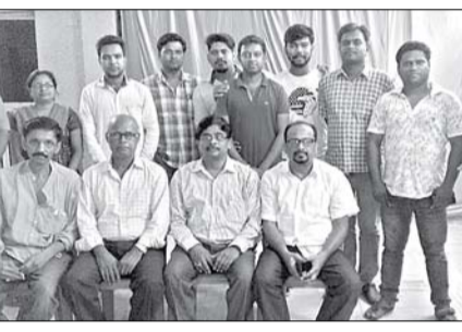
ବୈଠକରେ ଯୋଗ ଦେଇଥିବା ବିଭିନ୍ନ ସଂଗଠନର କର୍ମକର୍ତ୍ତାମାନେ ।

ବରଗଡ଼ ଅଫିସ୍, ୨୬।୯: ବରଗଡ଼ ଜିଲ୍ଲାରେ କ୍ୟାନସର ହସ୍ପିଟାଲ ଦାବିକୁ ବ୍ୟାପକ କରିବା ପାଇଁ ବିଭିନ୍ନ ସଙ୍ଘଠନ ପକ୍ଷରୁ ମଙ୍ଗଳବାର ସ୍ଥାନୀୟ ପୁରୋହିତ ଭବନରେ ଏକ ବୈଠକ ଅନୁଷ୍ଠିତ ହୋଇଯାଇଛି । କ୍ୟାନସର ହସ୍ପିଟାଲ ଦାବି ନେଇ ପୁଞ୍ଜ୍ୟମନ୍ତ୍ରୀଙ୍କୁ ଦିଆଯାଇଥିବା ସ୍ମାରକପତ୍ରର ଅଗ୍ରଗତି ଉପରେ ବୈଠକରେ ଆଲୋଚନା ହୋଇଥିଲା । ଏହି କ୍ରମରେ ସଙ୍ଘଠନର ଏକ ପ୍ରତିନିଧି ଦଳ ବରଗଡ଼ ଜିଲ୍ଲାପାଳଙ୍କୁ ଭେଟିବା ପାଇଁ ବୈଠକରେ ନିଷ୍ପତ୍ତି ନିଆଯାଇଥିଲା । ସେହିପରି କ୍ୟାନସର ହସ୍ପିଟାଲ ଦାବି ନେଇ ଜିଲ୍ଲାର