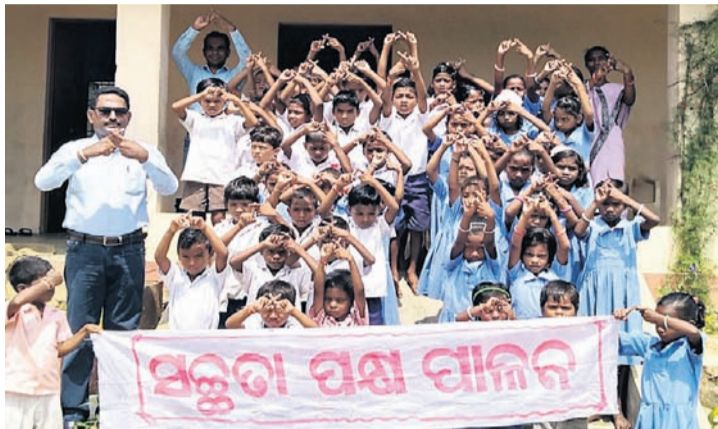
ଧରିତ୍ରୀ ଏବଂ ଓଡ଼ିଶା ପୋଷ୍ଟର 'ପ୍ଲାଷ୍ଟିକ ଫ୍ରୀ ଓଡ଼ିଶା' ଅଭିଯାନକୁ ସମର୍ଥନ ଜଣାଇଛନ୍ତି ବଲାଙ୍ଗୀର ଜିଲ୍ଲା ରୁଚରକେଲା ବ୍ଲକ୍ ଚନ୍ଦ୍ରଅନଳା ମାଓପଢ଼ା ସରକାରୀ ପ୍ରାଥମିକ ବିଦ୍ୟାଳୟର ଛାତ୍ରାଛାତ୍ରୀ (ବାମ) ଶିକ୍ଷୟିତ୍ରୀଶିକ୍ଷକ ।