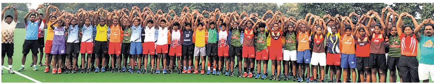
ଧରିତ୍ରୀ ଏବଂ ଓଡ଼ିଶା ପୋଷ୍ଟର 'ପ୍ଲାଷ୍ଟିକ ଫ୍ରୀ ଓଡ଼ିଶା' ଅଭିଯାନକୁ ସମର୍ଥନ ଜଣାଇଛନ୍ତି ରାଉରକେଲା ପାନପୋଷ ଟ୍ରାଡ଼ା ଛାତ୍ରାବାସର ହକି ଖେଳାଳି ଏବଂ କୋଚ୍ ।