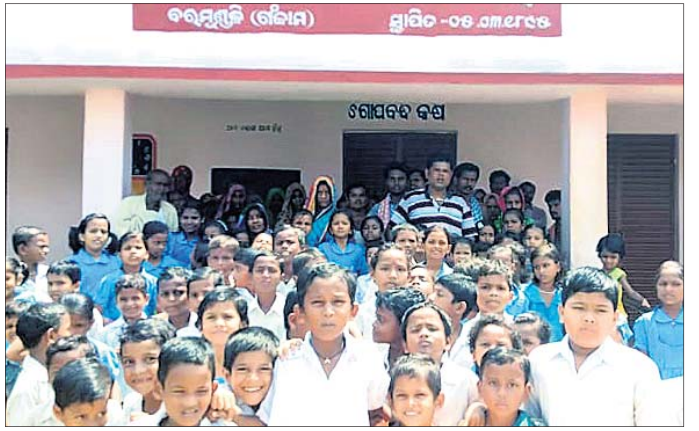
ବିଦ୍ୟାଳୟ ଆଗରେ ଅଭିଭାବକ ଓ ଶିକ୍ଷା କମିଟି ସଦସ୍ୟଙ୍କ ସହ ଛାତ୍ରଛାତ୍ରୀମାନେ।

ରୁକ୍ମିଣୀ ନାବାଳିକାଙ୍କୁ ଉଦ୍ଧାର କରିବା ପାଇଁ ଗଣତନ୍ତ୍ର ପାର୍ଟିରୁ ଗୋଟିଏ ପ୍ରସ୍ତାବ ଗ୍ରହଣ କରାଯାଇଛି। ଉଦ୍ଧାର ପାଇଁ ଗଣତନ୍ତ୍ର ପାର୍ଟିରୁ ଗୋଟିଏ ପ୍ରସ୍ତାବ ଗ୍ରହଣ କରାଯାଇଛି।