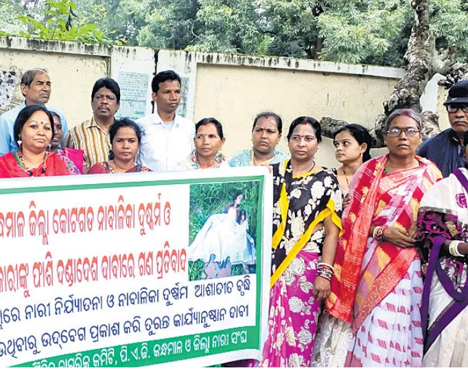
କୋଟଗଡ ନାବାଳିକା ବନ୍ଦୀରୁ ଏବଂ ହତ୍ୟା ଘଟଣାରେ ଅଭିଯୁକ୍ତଙ୍କୁ ଫାଶୀ ଦାବିରେ ଗୁରୁବାର କନ୍ଧମାଳ ମିଳିତ ନାଗରିକ କମିଟି ପକ୍ଷରୁ ଜିଲ୍ଲାପାଳଙ୍କ କାର୍ଯ୍ୟକ୍ରମ ସମ୍ମୁଖରେ ପ୍ରତିବାଦ କରାଯାଇଛି।

ଭଞ୍ଜନଗର, ୨୭.୯ (ଡି.ଏନ୍.ଏ.): ୨୦୧୮ ମସିହାରେ ନିର୍ବାଚିତ ହୋଇଥିବା ଭଞ୍ଜନଗର ଏନ୍-ଏସି କାର୍ଯ୍ୟକ୍ରମର ଶେଷ ପର୍ଯ୍ୟାୟ ଚଳେଇ ପାରିବ। ଏହି କାର୍ଯ୍ୟକ୍ରମର ଶେଷ ପର୍ଯ୍ୟାୟ ଚଳେଇ ପାରିବ।