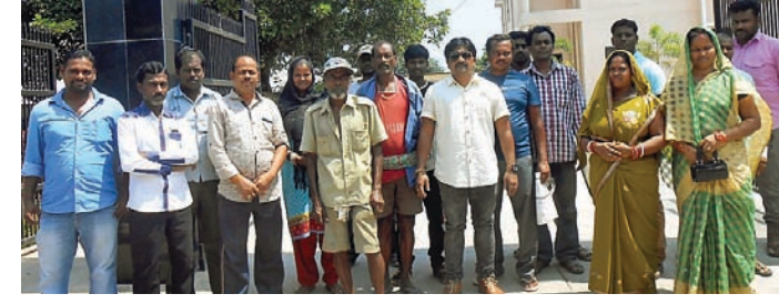
ଓଡ଼ି ବାସିନ୍ଦା ଅତିରିକ୍ତ ଏସପିଙ୍କୁ ଭେଟି ଫେରୁଛନ୍ତି।