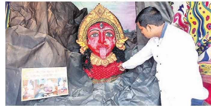
କାରଗରେ ନିର୍ମିତ କଳାକୁଞ୍ଜ।