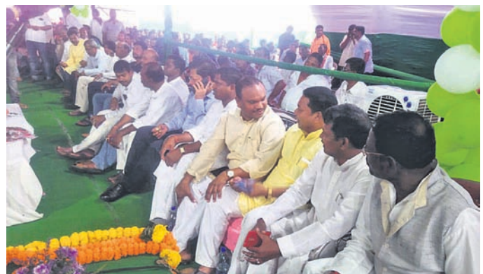
କାର୍ଯ୍ୟକ୍ରମରେ ମନ୍ତ୍ରୀ, ଏମ୍‌ପି, ବିଧାୟକଙ୍କ ସହ ଅନ୍ୟମାନେ ।