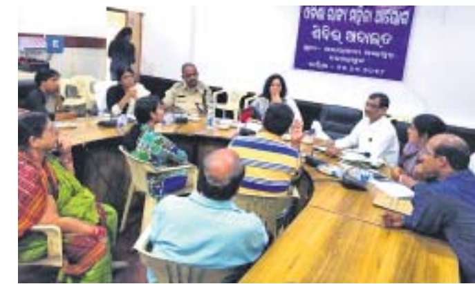
କ୍ୟାମ୍ପ କୋର୍ଟରେ ମହିଳା କମିଶନ ଅଧିକାରୀଙ୍କ ସାମନା ମାମଲା ଶୁଣୁଛନ୍ତି ।