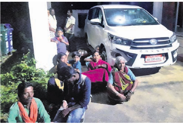
ଅଭିଯୋଗର ବିଚାର ପାଇଁ ଆସିଥିବା ଲୋକମାନେ ଅପେକ୍ଷା କରିଛନ୍ତି ।