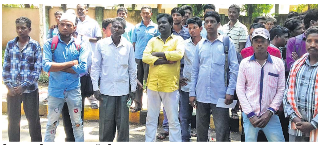
ଜିଲ୍ଲାପାଳଙ୍କୁ ଅଭିଯୋଗ କରାଯାଇ ପାଇଁ ଆସିଥିବା ଗ୍ରାମବାସୀ।

ଗଜପତି ଜିଲ୍ଲା ନୂଆଗଡ଼ ବ୍ଲକ ଅଧୀନ ୬ଟି ଗ୍ରାମ ଅଭିଲିଖା, ପାଳକପଦା, ଚାନ୍ଦିଆପାହା, ଡେକାପାଳୀ, ବୁର୍ଲାପେଟା, ରାମଗିରି ୧୩୦୦୦ ଉର୍ଦ୍ଧ୍ଵ ପରିବାର ନିଜ ପଞ୍ଚାୟତ ପରିବର୍ତ୍ତନ ଦାବିରେ ଗୁରୁବାର ଜିଲ୍ଲାପାଳଙ୍କ ଦ୍ଵାରସ୍ଥ ହୋଇଛନ୍ତି।