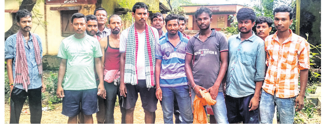
ଗଣେଶ ପୂଜା ନେଇ ଅସନ୍ତୋଷ ଗ୍ରାମବାସୀ ।