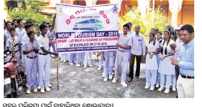
ସହର ପରିକ୍ରମା ପାଇଁ ବାହାରିଥିବା ଶୋଭାଯାତ୍ରୀ।