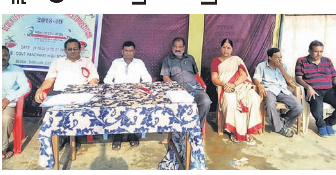
ବୈଠକରେ ଉପସ୍ଥିତ ଅତିଥିମାନେ ।