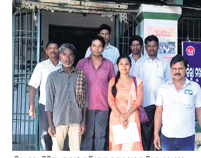
ଜିଲ୍ଲା ମୁଖ୍ୟ ଚିକିତ୍ସାଧିକାରୀଙ୍କୁ ଅଭିଯୋଗ କରାଯାଇଥିବା ଅଭିଯୋଗୀ ଲୋକେ।

ପାରଳାଖେମୁଣ୍ଡି, ୨୭।୯(ସ.ପ୍ର.) ଗଜପତି ଜିଲ୍ଲା ଚନ୍ଦ୍ରଗିରି ଗୋଷ୍ଠୀ ସ୍ଵାସ୍ଥ୍ୟକେନ୍ଦ୍ରରେ ନାନା ଅବ୍ୟବସ୍ଥା ନେଇ ଅଞ୍ଚଳବାସୀ ଅଭିଯୋଗ ଆଣି ଗୁରୁବାର ଜିଲ୍ଲା ମୁଖ୍ୟ ଚିକିତ୍ସାଧିକାରୀଙ୍କୁ ଏକ ପତ୍ର ଦେଇଛନ୍ତି। ଏଥିରେ ସେମାନେ ଦର୍ଶାଇଛନ୍ତି ଯେ, ଚନ୍ଦ୍ରଗିରି ଗୋଷ୍ଠୀ ସ୍ଵାସ୍ଥ୍ୟକେନ୍ଦ୍ର ଉପରେ ମୋହନା, ଆର୍. ଉଦୟଗିରି ଓ ନୂଆଗଡ଼ ବ୍ଲକର ବିଭିନ୍ନ ଗ୍ରାମର ଲୋକେ ନିର୍ଭର କରନ୍ତି। ତେବେ ଏହି ସ୍ଵାସ୍ଥ୍ୟକେନ୍ଦ୍ରରେ ଡାକ୍ତର ଅଭାବ ଆଦି ନାନା ସମସ୍ୟା ଲାଗିରହିବା ସତ୍ତ୍ଵେ ଅନିୟମିତତା ହେଉଛି। ଏଥିପାଇଁ ରୋଗୀ ଉପଯୁକ୍ତ ସେବା ପାଇବାକୁ ବନ୍ଧୁତ ହେଉଛନ୍ତି। ଏଠାରେ ଆନୁଷ୍ଠାନିକ ଭିତ୍ତିଭୂମି ରହିଥିଲେ ମଧ୍ୟ ଠିକ ପରିଚାଳନା କରାଯାଉନାହିଁ। ପରିବେଶ ଓ ପରିମଳ ବ୍ୟବସ୍ଥା ଠିକ୍ ନାହିଁ। ଡାକ୍ତର ଅଭାବ ଯୋଗୁ ଅଧିକାଂଶ ରୋଗୀଙ୍କୁ ବ୍ରହ୍ମପୁର ସ୍ଥାନାନ୍ତର କରାଯାଉଛି। ଏହାଦ୍ଵାରା ଗରିବ ରୋଗୀଙ୍କୁ ଅଧିକ ଖର୍ଚ୍ଚ ହେବାକୁ ପଡ଼ୁଛି। ଏବ୍ବରେ ମେଣିନ ଅଟକ