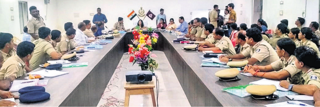
ମହିଳା କମିଶନ ଅଧିକାରୀ ସମୀକ୍ଷା ବୈଠକରେ ଯୋଗ ଦେଇଛନ୍ତି ।