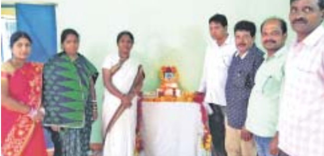
ସେମିକିରୁଡ଼ା ଶ୍ରୀ ଅରବିନ୍ଦ ପାଠାଗାରରେ ଅନୁଷ୍ଠିତ ସ୍ମୃତିସଭା ।