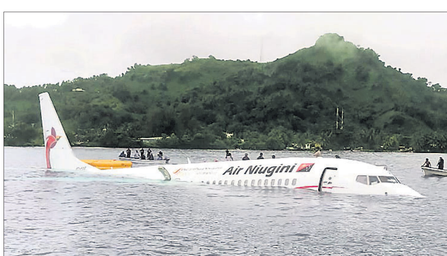
ମାଣିକ ଶ୍ରୀପଦ ଡ୍ରେନା ବିମାନବନ୍ଧରେ ଶୁକ୍ରବାର ଅବତରଣ କରିବାକୁ ଚେଷ୍ଟା କରୁଥିବା ଏୟାର ଗୁଗୁନି ବୋର୍ଡ ୭୩୭-୮୦୦ ବିମାନରେ ସମସ୍ୟା ଦେଖାଯିବା ପରେ ଚାହା ପ୍ରଶାନ୍ତ ମହାସାଗରୀୟ ବୁକ୍ ହବରେ ଓହ୍ଲାଇଥିଲା । ବିମାନର ଅଧିକାଂଶ ଭାଗ ବୁଡ଼ି ରହିଥିବାବେଳେ ସମସ୍ତ ଯାତ୍ରୀଙ୍କୁ ସୁରକ୍ଷିତ ଭାବେ ଉଦ୍ଧାର କରାଯାଇଛି । (ବିସ୍ତାର: ପୃଷ୍ଠା-୨)