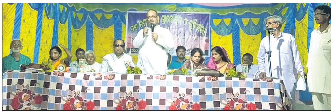
ଶହୀଦ ଦିବସ ସମାରୋହରେ ଉପସ୍ଥିତ ଅତିଥି

ସ୍ୱାଧୀନତା ସଂଗ୍ରାମର ଅନ୍ୟତମ ରକ୍ତଚର୍ଚ୍ଚା ବାଲେଶ୍ୱର ଜିଲ୍ଲା ଖଇରା ବ୍ଲକର ତୁଟିଗଡ଼ିଆରେ ଶୁକ୍ରବାର ୧୬ତମ ଶହୀଦ ଦିବସ ପାଳିତ ହୋଇଯାଇଛି। ସ୍ୱାଧୀନତା ଆନ୍ଦୋଳନ ସମୟର ଶହୀଦଙ୍କ ପୀଡ଼ାକୁ ବର୍ତ୍ତମାନର ଯୁବପିଢ଼ି ଅନୁଭବ କରିବା ଦରକାର। ଏହାଦ୍ୱାରା ସେମାନେ ପ୍ରେରଣା ଲାଭ କରି ଆଗକୁ ବଢ଼ି ପାରିବେ ବୋଲି ଶହୀଦ ଦିବସ ସମାରୋହରେ ଅତିଥି ଓ ବକ୍ତାମାନେ ମତବ୍ୟକ୍ତ କରିଛନ୍ତି।