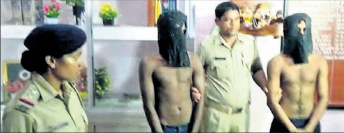
ହତ୍ୟା ଘଟଣାରେ ଭିତର ଦୁଃଖ ଅଭିଯୁକ୍ତ।