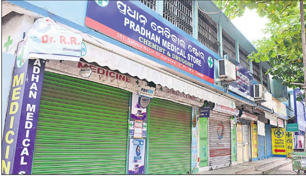
ଭୁବନେଶ୍ୱର ଶହ ଦୋକାନରେ ବନ୍ଦ ରହିଥିବା ଔଷଧ ଦୋକାନ ।