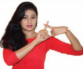
Archita Sahu Actress