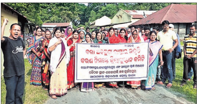
ବିଧାୟକ ବାସଭବନ ସମ୍ମୁଖରେ ଗ୍ରାମବାସୀ ବିକ୍ଷୋଭ ପ୍ରଦର୍ଶନ କରୁଛନ୍ତି ।