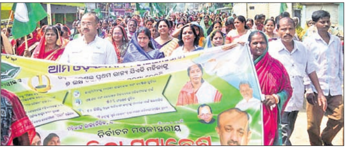
ବିକେତ ମହିଳା ମୋର୍ଚ୍ଚା ପକ୍ଷରୁ ରାଜି ଖଜୁରା ବଜାର ପରିକ୍ରମା କରୁଛି ।