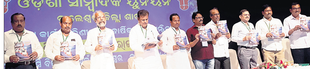
ଅତିଥିମାନଙ୍କ ଦ୍ୱାରା ସ୍ମରଣିକା ଉନ୍ମୋଚନ କରାଯାଇଛି ।

ବାଲେଶ୍ୱର ଆପିସ, ୩୦।୯ ବାଲେଶ୍ୱର ବାମପନ୍ଥା ସ୍ଥିତ ନୋଭି ବିକେନ୍ସ ପାର୍କ ପରିସରରେ ଓଡ଼ିଶା ସାମ୍ପାଦକ ସୁନିଅନ୍ ଜିଲା ଶାଖା ପକ୍ଷରୁ ରବିବାର ରାଜ୍ୟ ନେତାମାନଙ୍କୁ ଓଡ଼ିଶା ସମ୍ପାଦକ ସୁନିଅନ୍ ଜିଲା ଶାଖା ପକ୍ଷରୁ ନିର୍ବାଚନୀ ଅନୁଷ୍ଠିତ ହୋଇଥିଲା । ଗଣମାଧ୍ୟମ ପ୍ରତିନିଧିତ୍ୱ ଉପରେ ବିକିର ସ୍ଥାନରେ ହେଉଥିବା ଆକ୍ରମଣ ଘଟଣାକୁ ସମ୍ମିଳନୀରେ ନିନ୍ଦା କରାଯାଇଥିଲା । ନିଶାମୁକ୍ତ ପ୍ରସାର ଯୋଗୁ ସମାଜରେ ବିକିର ପ୍ରକାର ହିଂସା ଓ ବିଶ୍ୱାସକୁ ବଢ଼ିଯାଇଛି । ଏହାକୁରୋକିବାପାଇଁ ଆଗାମୀ ନିର୍ବାଚନରେ ସବୁ ରାଜନୈତିକ ଦଳ ଏହାକୁ