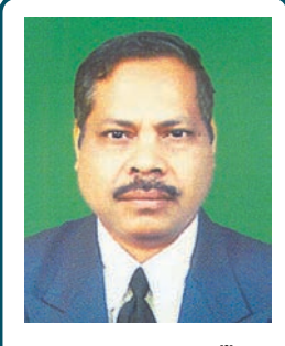
ଇମାମ୍ ମାୟାଧର ସ୍ୱାଇଁ