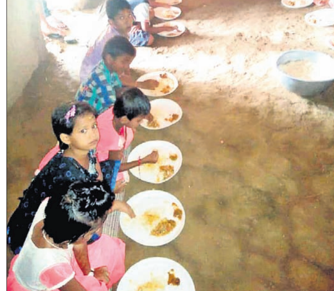
ଫଗୁଣା ସ୍କୁଲର ପିଲାମାନଙ୍କୁ ନିଜ ଖର୍ଚ୍ଚରେ ମଧ୍ୟାହ୍ନଭୋଜନ ଦିଆଯାଇଛି ।

ଖଇରା ବ୍ଲକ ମହତାପୁର ପଞ୍ଚାୟତ ଅଧିକାରୀଙ୍କୁ ଶିବ ପ୍ରସାଦ ଉଚ୍ଚ ପ୍ରାଥମିକ ବିଦ୍ୟାଳୟରେ ମିଶ୍ରଣ କରିବା ଘଟଣାକୁ ନେଇ ଗ୍ରାମବାସୀଙ୍କ ମଧ୍ୟରେ ଅସନ୍ତୋଷ ବଢ଼ିବାରେ ଲାଗିଛି । ଗ୍ରାମବାସୀ ନିଜ ଖର୍ଚ୍ଚରେ ଶିକ୍ଷକ ରଖି ଓ ନିୟନ୍ତ୍ରଣକାରୀଙ୍କୁ ଦେଇ ପିଲାମାନଙ୍କୁ ପୁରୁଣା ସ୍କୁଲରେ ପଢ଼ାଇବା ଶିକ୍ଷା ଦିଆଯାଇ ପାରିବ ବୋଲି ପ୍ରକଳ୍ପ ନିର୍ଦ୍ଦେଶକ କାର୍ଯ୍ୟକ୍ରମକୁ ସ୍କୁଲ ପରିବର୍ତ୍ତନରେ ଆସିଥିବା ଅଧିକାରୀଙ୍କ ଆଗରେ ସେମାନେ ସମାଜର ହକ୍ କାହିଁ କରିଛନ୍ତି । ଗ୍ରାମବାସୀ ମୁଖ୍ୟତଃ ଚିତ୍ ପ୍ରସଙ୍ଗ ଉପରେ ସେମାନଙ୍କର ଅସନ୍ତୋଷ ପ୍ରକାଶ କରିଥିଲେ । ପ୍ରାଥମିକ ବିଦ୍ୟାଳୟରେ ନିଜ ଖର୍ଚ୍ଚ ନ ଥିବା ଆକାଶରେ ବନ୍ଦ କରିବାକୁ ମନୁଷ୍ୟ କରାଯାଉଛି । ହେଲେ ଯେଉଁ ସ୍କୁଲରେ ଏହାକୁ ମିଶ୍ରଣ କରାଗଲା ସେ