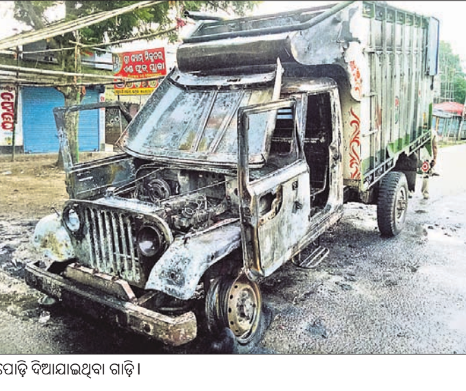
ପୋଡ଼ି ଦିଆଯାଇଥିବା ଗାଡ଼ି ।

ଭଦ୍ରକ ଅଫିସ/ଧାମନଗର, ୩୦।୯(ଡି.ଏନ.ଏ.) ବେଆଇନ ଗୋଚାଲାଣକୁ କେନ୍ଦ୍ରକରି ଭଦ୍ରକ ଜିଲ୍ଲା ଧାମନଗର ବ୍ଲକ୍ ଅଧିକାରୀଙ୍କୁ ବକାରରେ ଚୁପୁକାଣ୍ଡ ଘଟିଛି । ଘାମନାୟ ଲୋକେ ଶନିବାର ବିଳମ୍ବିତ ରାତିରେ ୮ଟି ପିକ୍‌ଅପ୍ ଭ୍ୟାନରେ ବେଆଇନ ଗୋ ଚାଲାଣ ହେଉଥିବା ଦେଖି ସେଥିରୁ ୬ଟି ଖସି ଉଠିବାକୁ ଅଟକାଇଥିଲେ । ଗୋଟିଏ ଭ୍ୟାନ ଖସି ପଳାଇଥିଲା । ଧରାପଡ଼ିଥିବା ଭ୍ୟାନରେ ଚାଲାଣ ହେଉଥିବା ୧୨୦ରୁ ଉର୍ଦ୍ଧ୍ୱ ଗାଈଙ୍କ ମଧ୍ୟରୁ ୨ଟି ମରିଯାଇଥିବା ଏବଂ ୩୦ରୁ ଉର୍ଦ୍ଧ୍ୱ ଅସୁସ୍ଥ ଥିବା ଜଣାପଡ଼ିଥିବା ଚାନ୍ଦି ଭେଟ୍‌ଗଣା ପ୍ରକାଶ ପାଇଥିଲା । ଉଭୟ ଲୋକେ ସେଠାରେ ଗୋଟିଏ ଭ୍ୟାନକୁ ଜାଳି ଦେଇ