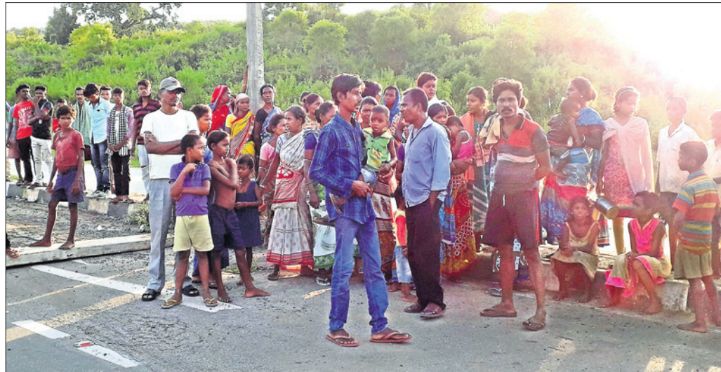
ଲୋକେ ରାସ୍ତା ଅବରୋଧ କରିଛନ୍ତି।

ଗାଉଁର ଥାନା ଅଞ୍ଚଳର ଧୂପଦା ୨୦ ନମ୍ବର ଜାତୀୟ ରାଜପଥରେ ରବିବାର ଅପରାହ୍ନରେ ୨ ଶିଶୁ ଅଣ୍ଡା କିଣି ଘରକୁ ଫେରୁଥିବା ବେଳେ ଏକ ଦୁର୍ଘଟଣା ଅଘଟଣା ଘଟି ଧକ୍କା ହୋଇଥିଲା।